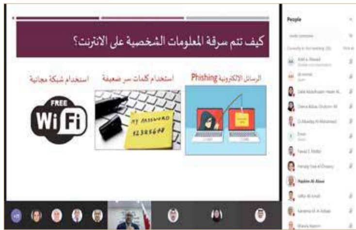
أمانة الشورى تنظم محاضرة إلكترونية عن كيفية الحماية على الإنترنت خلال العمل عن بُعد