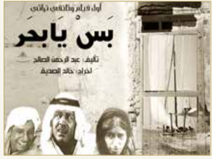
فيلم بس يا بحر