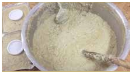
مصدره حب القمح

منظراً لطيفا مثل عجينة رخوة غير سائلة، ولكن يكون مذاق الهريس الذي يضرب بـ (مضراب) خشب أذ وأشهى، ويصنع ذلك المضراب خصيصاً فقط للهريس!