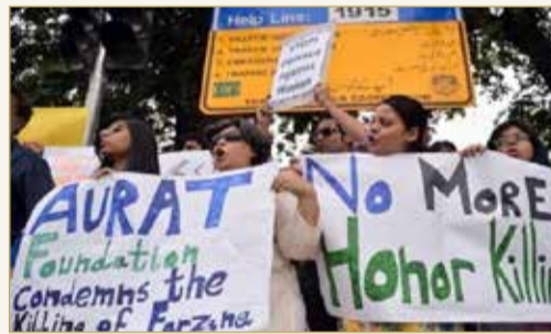
باكستانيات يتظاهرن ضد العنف الذي يطول النساء بسبب "جرائم الشرف"

لاشتباه في تسترهما على جريمة القتل والأدلة والجريمة هي أول قضية جنائية بارزة تتم متابعتها في منطقة القبائل التي كانت تتمتع بالحكم الذاتي سابقا، حيث تمثل العادات المحافظة للغاية تحديا كبيرا للشرطة. وقالت الشرطة إن أقارب الفتيات والسكان المحليين لا يريدون تسجيل قضية بسبب "التقاليد المحلية" التي تجيز القتل حفاظا على الشرف، لذا أصبحت الشرطة هي الجهة المدعية في القضية. وسنت باكستان العالقة حاليا بين سندان "طالبان" ومطرقة تفشي الفيروس التاجي تشريعات لحماية النساء من "جرائم الشرف" عام 2016.