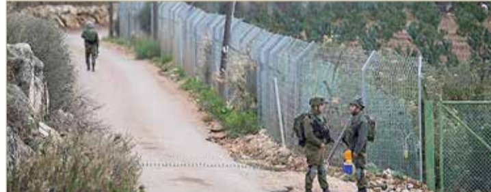
عناصر من الجيش الإسرائيلي على الحدود مع لبنان

◆ جيش الاحتلال يستعد لحرب على حدود لبنان وسوريا