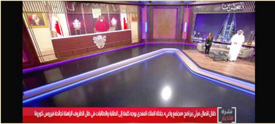
المشاركة الملكية ببرنامج قدمه العبدالله خلال شهر رمضان

السلام على جلالة الملك على الهواء مباشرة لن يمضى من ذاكرتي