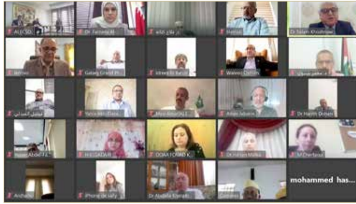
جانب من اجتماع لجنة البحث العلمي والابتكار بمنظمة الألكسو

المراغي سلطت الضوء على مستجدات البحث العلمي