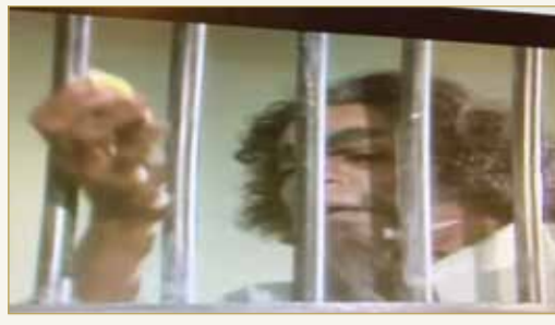
من نواذر الدراما البحرينية

اللهم إن كانت ليلة القدر أسالك يا الله أن تهدينا فيمن هديت، وعافنا فيمن عافيت، وتولنا فيمن توليت، وبارك لنا فيما أعطيت، وقنا واصرف عنا شر ما قضيت.