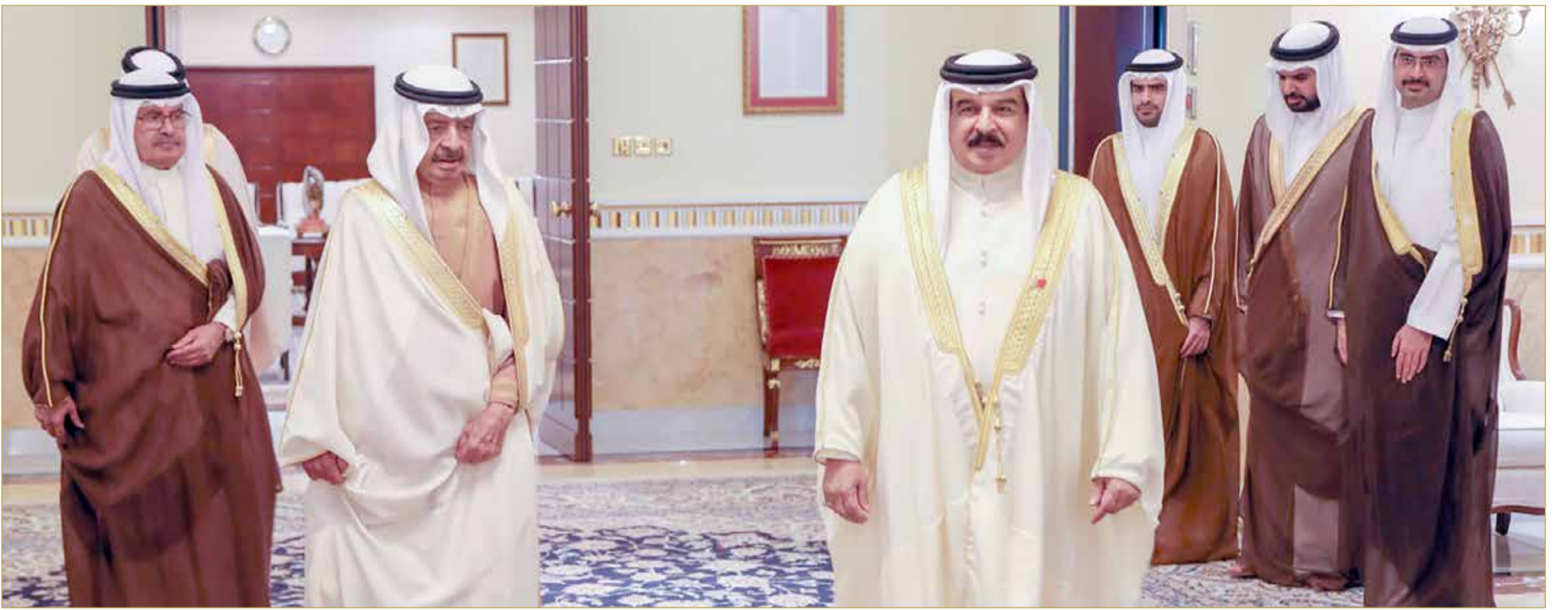
جلالة الملك لدى زيارته سمو رئيس الوزراء أمس

سمو الأمير خليفة بن سلمان: بتوجيهات جلالاته سنتجاوز تداعيات المرحلة