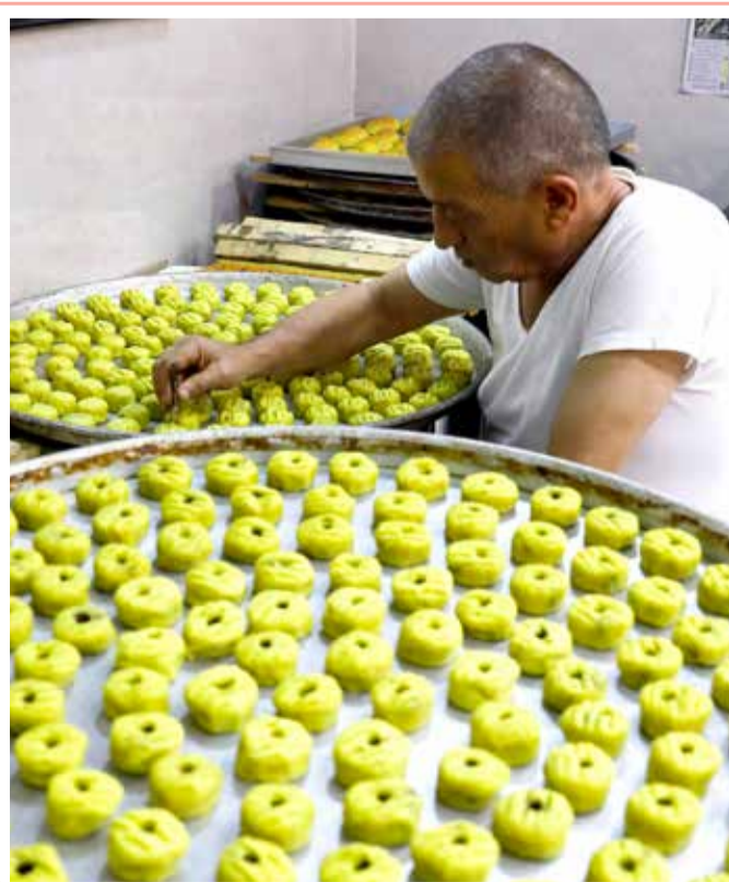
خباز فلسطيني يعد معمول التمر في مخبز في البلدة القديمة في القدس استعدادا لعيد الفطر المبارك

تقود الممثلة الأميركية الشهيرة جوليا روبرتس مجموعة من النجوم والمشاهير لتسليط الضوء على الجهود التي يبذلها العلماء والأطباء في مكافحة فيروس كورونا الجديد. وسيحول مشاهير من بينهم النجمة الأميركية جوليا روبرتس والممثل الأسترالي هيو جاكمان والمغني بوبي براون صفحاتهم على وسائل التواصل الاجتماعي إلى منصات لنشر الحقائق الطبية والترويج للأسلوب العلمي في مواجهة وباء "كوفيد-19"، الناجم عن فيروس كورونا الجديد. وتفتتح روبرتس، الحائزة على جائزة الأوسكار في 2001 عن دور البطولة في فيلم إيرين بروكوفيتش، المشروع بإجراء مقابلة مع مدير المعهد الوطني الأميركي للحساسية والأمراض المعدية، أنتوني فاونشي. وتتركز المبادرة على البيانات والعلم والحقائق، وفقا لوكالة رويترز.