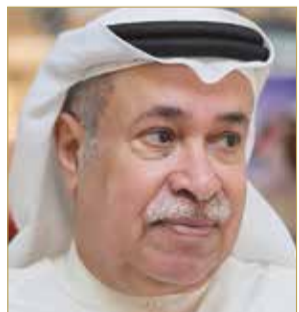
الشيخ عيسى بن راشد