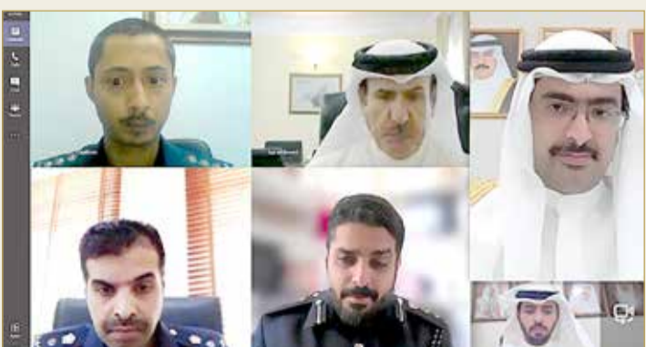
سمو محافظ الجنوبية يترأس اجتماعاً أمنياً عن بُعد