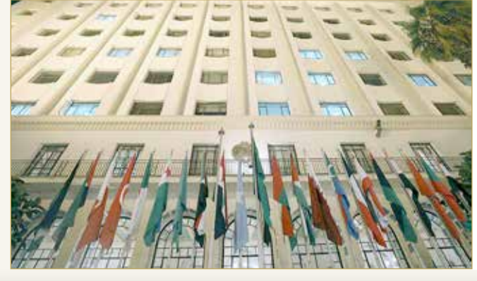
مقر جامعة الدول العربية في القاهرة

أكدت الأمانة العامة لجامعة الدول العربية، أمس، مجدداً إدانتها ورفضها للتدخلات الإيرانية في الشؤون الداخلية للدول العربية، سواء من خلال التدخل المباشر أو عن طريق وكلاء إيران في المنطقة، مؤكدة أن هذا الأمر يشكل تهديداً للأمن والاستقرار الإقليميين. ويأتي تجديد الأمانة العامة على هذا الموقف في ضوء استمرار السلوك العدائي والتصرفات الاستفزازية الإعلامية من جانب إيران والتي كان آخرها تعمد إظهار عدد من أعلام ورايات المليشيات والحركات المسلحة التي ترعاها وتمولها وتدعمها إيران في ظهور إعلامي مسؤول رفيع المستوى بالحرس الثوري الإيراني". (12)