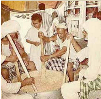
يضرب بـ "مضراب" خشب