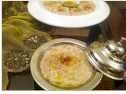
نجم موائد رمضان