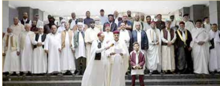
المجلس الأعلى لمشايخ وأعيان ليبيا طالب بتفعيل اتفاقية الدفاع العربي المشترك

◆ المسماري يتهم أردوغان بنقل "إرهابيين ومتطرفين" إلى ليبيا