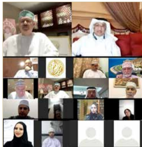
جانب من الندوة في مسقط