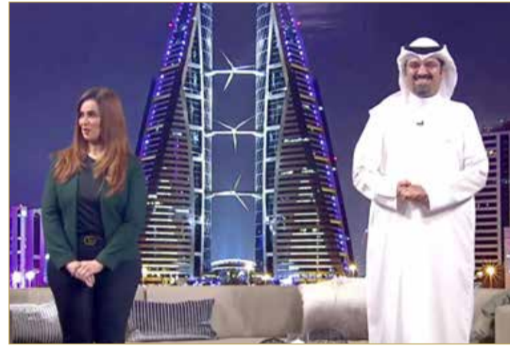
العبدالله ولولوة الودامة بالبرنامج