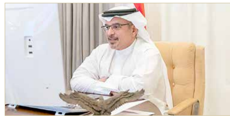
سمو ولي العهد يترأس اجتماع اللجنة التنسيقية

وتقليل عدد الموجودين بالمنشأة ومنع الاكتظاظ في المحلات مع ترك المسافة الكافية، والالتزام بالتعليم المستمر لهذه المحلات وفق إرشادات وزارة الصحة، وتنظيم الانتظار خارج المحلات وفق تدابير التباعد الاجتماعي حسب إرشادات وزارة الصحة، والسماح باستئناف العمل بالخدمات الطبية غير الأساسية وفق الاشتراطات الصحية وقواعد التباعد الاجتماعي، والسماح للاعبين المحترفين بالتمرن في المساحات الخارجية والمساح مع الالتزام بالاشتراطات الصحية، والسماح بعمل السينمات الخارجية وفق الاشتراطات الصحية وقواعد التباعد الاجتماعي، مع استمرار إغلاق دور السينما وكل صالات العرض التابعة لها. كما تقرر بدءاً من يوم الأربعاء المقبل السماح بإعادة فتح الصالونات ومحلات الحلالة مع الحفاظ على الاشتراطات.