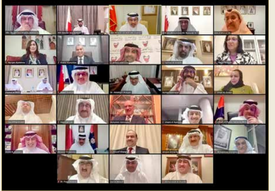
سمو ولي العهد يترأس اجتماع اللجنة التنسيقية

استئناف العمل بالخدمات الطبية غير الأساسية وفق الاشتراطات الصحية وقواعد التباعد الاجتماعي