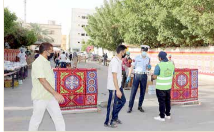
محافظ العاصمة، عملية التوزيع تمت وفق أعلى درجات تطبيق الإجراءات الاحترازية

أكد محافظ العاصمة الشيخ هشام بن عبدالرحمن آل خليفة أن إشراف محافظة العاصمة بالتعاون مع مديرية الشرطة على عملية توزيع وجبات إفطار صائم على العمالة الوافدة، ضمن حملة (فيينا خير) أسهم بتوزيع 400 ألف وجبة بمناطق العاصمة، مع انقضاء الشهر الفضيل، وهو ما يمثل، بعداً إنسانياً مهماً في ظل الجهود الوطنية المبذولة للحد من انتشار فيروس كورونا، مبرراً ذلك ما يجلب عليه أهل البحرين الكرام في التعاون والتعاقد بين جميع أفراد المجتمع، خصوصاً في ظل الظروف الراهنة. وأشاد المحافظ بتوجهات ممثل جلالة الملك للأعمال الإنسانية وشؤون الشباب مستشار الأمن الوطني رئيس مجلس أمناء المؤسسة الملكية للأعمال الإنسانية