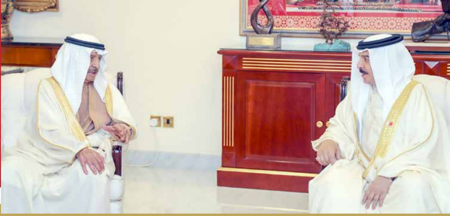
جلالة الملك يقوم بزيارة إلى سمو رئيس الوزراء