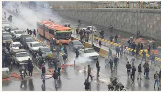
احتجاجات سابقة في إيران

◆ عائلات الضحايا تواصل جهودها من أجل العدالة وتواجه التهريب