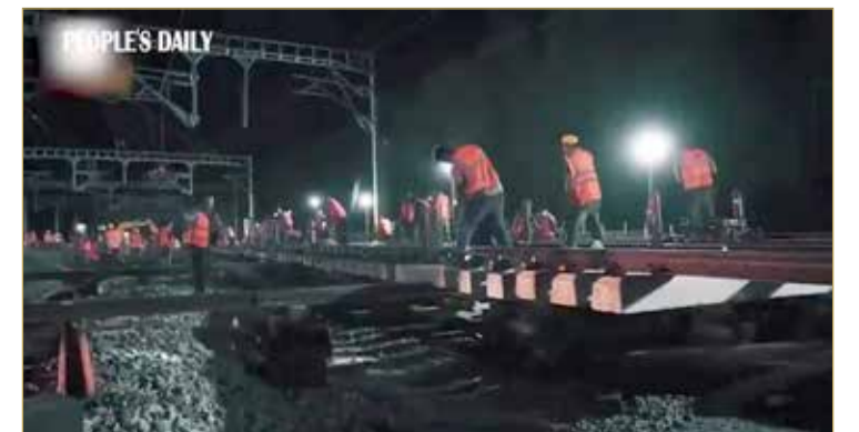
الفيديو نوه بما وصفه بـ "السرعة الصينية" التي تلخص إنجاز حجم هائل من الأعمال الإنشائية التي تم الانتهاء منها في وقت قياسي.

ويظهر العمال، الذين يصل عددهم إلى نحو ألف عامل، كأنهم خلية نحل يقوم كل منهم بمهام محددة بالسرعة والكفاءة المطلوبة. وبحسب الفيديو، تمكن العمال من تشييد المحطة خلال نحو 5 ساعات ونصف الساعة، مشيرا إلى أن عزمهم على هذا العمل هو سر نجاح المشروع واستكمالته في وقت قياسي.