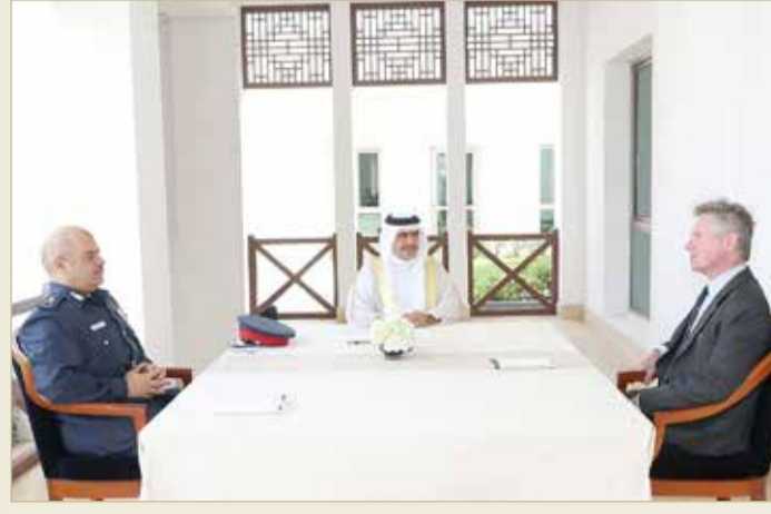
وزير الداخلية مستقبلاً المدير التنفيذي لفرع المعهد الدولي للدراسات الاستراتيجية

استقبل وزير الداخلية الفريق أول الشيخ راشد بن عبدالله آل خليفة، أمس، وبحضور رئيس الأمن العام الفريق طارق الحسن، المدير التنفيذي لفرع المعهد الدولي للدراسات الاستراتيجية بمنطقة الشرق الأوسط توماس بيكيت. وفي بداية اللقاء، رحب الوزير بيكيت، مشيداً بالمستوى المتطور الذي وصل إليه المعهد الدولي للدراسات الاستراتيجية في مجال الأبحاث والدراسات ودوره المتميز في تنظيم المؤتمرات الدولية، كما اطلع على برنامج عمل المعهد للفترة المقبلة، مؤكداً حرص الوزارة على تطوير التعاون المشترك بما يحقق الأهداف المرجوة. من جهته، أعرب توماس بيكيت عن شكره وتقديره لوزير الداخلية؛ على ما يوليه من دعم ومساندة لمؤسسات الدراسات والبحوث، وتشجيعه لها على مواصلة دورها العلمي والثقافي. وتم في اللقاء، بحث عدد من الموضوعات ذات الاهتمام المشترك.