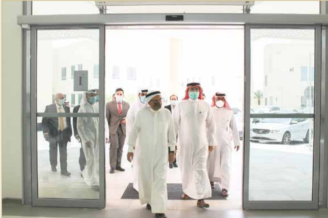
رئيس المجلس الأعلى للصحة يفتتح وحدة متكاملة لعلاج الحالات القائمة بـ"كورونا"

رئيس "الأعلى للصحة": فخورون بالإنجازات الوطنية وتكاتف الجميع لتجاوز التحدي