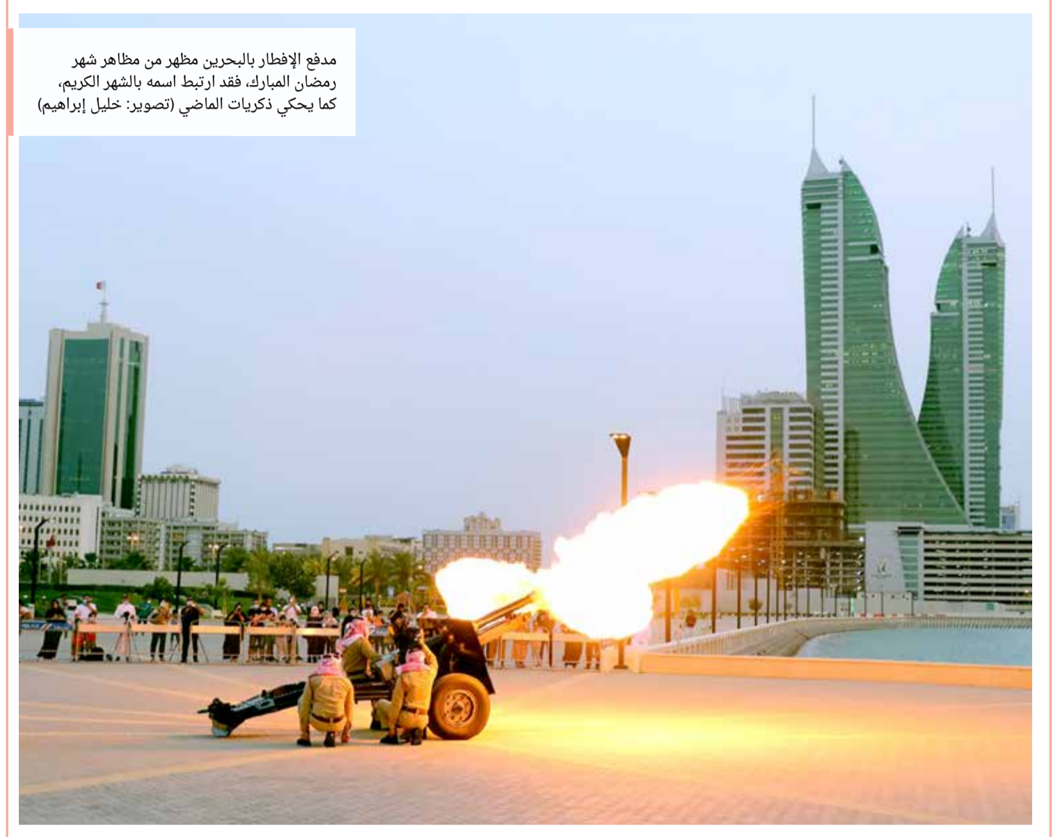
مدفع الإفطار بالبحرين مظهر من مظاهر شهر رمضان المبارك، فقد ارتبط اسمه بالشهر الكريم، كما يحكي ذكريات الماضي

انت تاريخ وتقاليدها وحضارة انت مسجد وبشارة ربانية انت حصن ورمز للقومية انت البحرين وأوطان عربية انت من الرحمن هدية انت راع وحارس رعية انت أفعال كاهم رئية انت مصباح ونور سجية مجالسك كلنا فيهم سوية شعاره دوما الكامة العربية ابتسامه وحب كلها مصداقية كم أسعدتنا بحنان الأبوية ليس فيها أيام منسية فكل ساعة نتمناها استمرارية يا خليفة أنت صبحنا ومساءتنا الوردية نحن أبناؤك معك وكل الرعية يحفظك رب السماء والبرية لننعم بتوجيهاتك ومسيرتك الوطنية أنت الأمل والروح الشجية ستبقى ونبقى معك للأبدية هذا خليفة ذراعنا القوية مسك الختام سلام وتحية فاطمة أحمد عنبر