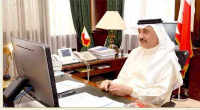
وزير العمل والتنمية الاجتماعية يشارك في الاجتماع الأول للأعضاء المؤسسين للنادي

وأكد أهمية العمل الخيري والاجتماعي والإنساني في مثل هذه الظروف الاستثنائية؛ بسبب مرض فيروس كورونا "كوفيد 19".