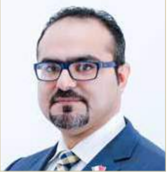
مدير إدارة الوقاية من الجريمة

أحرزت وزارة الداخلية، ممثلة في إدارة الوقاية من الجريمة، جائزة معهد ROI الدولية بالولايات المتحدة الأمريكية لسنة 2019 عن برنامج ساعي أعمال المنفعة العامة (سامع) كأحد أبرز برامج التأهيل والتدريب، الذي تطبقه مملكة البحرين في مجال تنفيذ قانون العقوبات والتدابير البديلة، حيث أحرز البرنامج، المركز الأول، في فئة أفضل دراسة أثر على المستوى الحكومي عالمياً، من بين مئات الدراسات المقدمة من 70 دولة مشاركة.