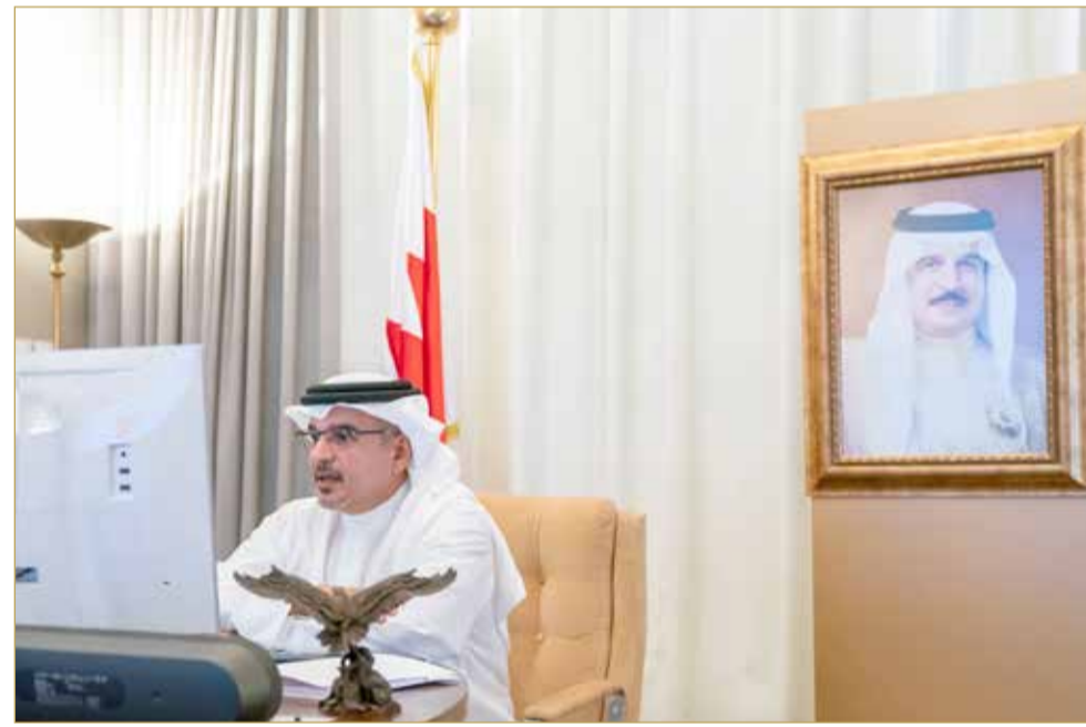
سمو ولي العهد يترأس اجتماع اللجنة التنسيقية

قال ولي العهد نائب القائد الأعلى النائب الأول لرئيس مجلس الوزراء صاحب السمو الملكي الأمير سلمان بن حمد آل خليفة إن الجهود الوطنية التي يبذلها فريق البحرين كل من موقعه تتطلب التزام الجميع بحس المسؤولية المجتمعية المشتركة بكافة التعليمات والإجراءات الاحترازية. منوها سموه بأن كافة الجهات المعنية ستواصل تقديم كل ما من شأنه أن يصب في تحقيق الأهداف المنشودة من خلال التصدي لفيروس كورونا وتعزيز الصحة العامة. جاء ذلك، لدى ترؤس سموه أمس اجتماع اللجنة التنسيقية عن بعد بحضور أعضاء اللجنة. ومن أجل مواصلة الحفاظ على صحة وسلامة الجميع وبناء على توصيات الفريق الوطني الطبي للتصدي لفيروس كورونا (كوفيد 19)، تقرر توسيع نطاق إلزامية ارتداء الكمادات وتم تكليف الفريق الوطني الطبي بوضع الاشتراطات والإجراءات التنفيذية اللازمة. (02)