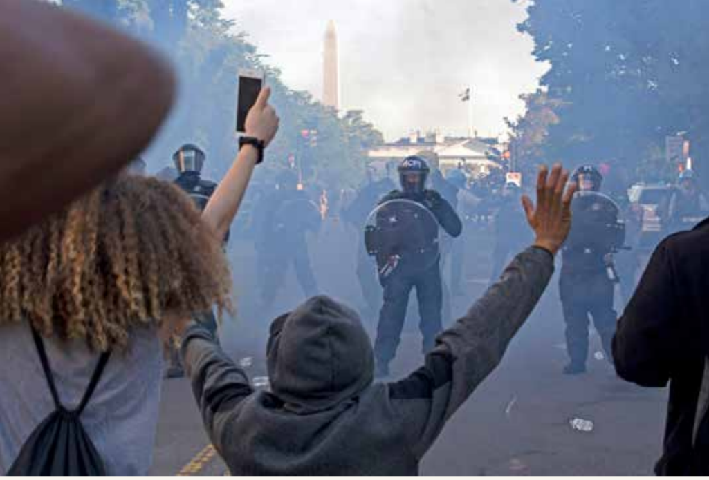
شرطة مكافحة الشغب يدفعون المتظاهرين إلى خارج البيت الأبيض