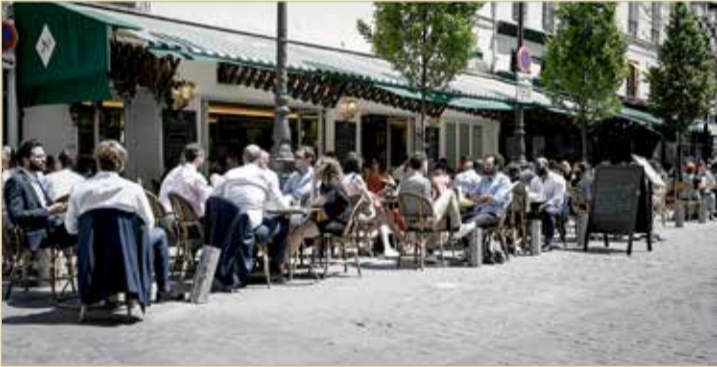
المقاهي والمطاعم الفرنسية تعيد فتح أبوابها

الجديدة التي يجري تسجيلها يومياً، أي أن عدد الحالات الجديدة لا يزال كبيراً، لكنه أخذ في التناقص باستثناء روسيا وأوروبا الشرقية، إذ لا تزال تشهد ارتفاعاً هناك. وفتحت المقاهي الباريسية أرصفتها مجدداً للرواد أمس، في مؤشر إلى عودة الحياة ببطء إلى طبيعتها في أفادت الصحف الثلاثاء.