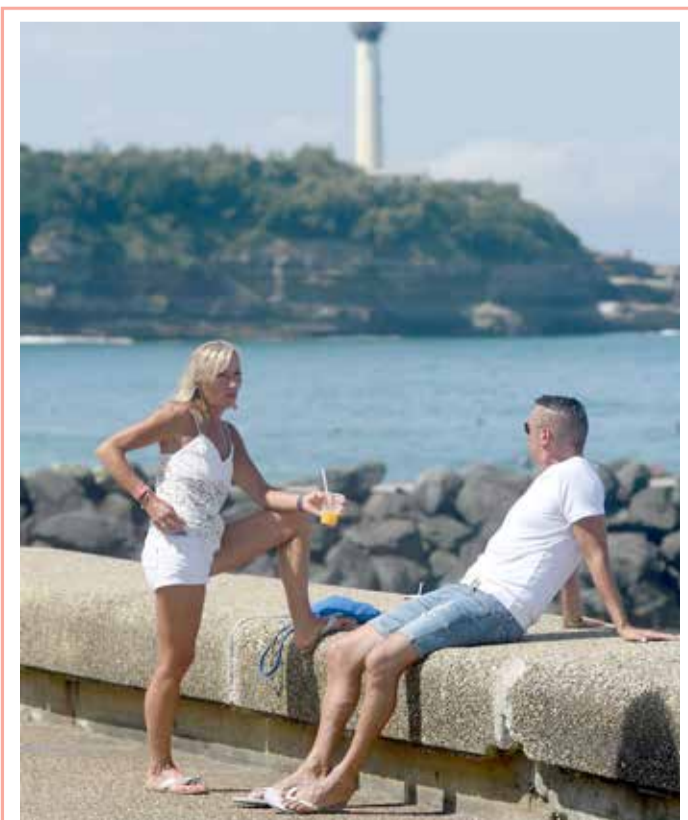
زوجان يستجمان في أنجليت بعد تخفيف فرنسا من إجراءات الإغلاق المتخذة للحد من انتشار جائحة كورونا