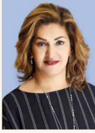
الشيخة هند بنت سلمان