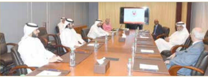
الاطلاع على سير العمل في ديوان رئيس الوزراء ووزارة شؤون مجلس الوزراء

المسؤولون حريصون على تنفيذ توجيهات سموه للارتقاء بالمنظومة الحكومية