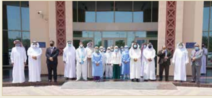
زيارة نيابية لمركز فحص كورونا

زينل: الرهان على الوعي المجتمعي لعودة الحياة إلى طبيعتها