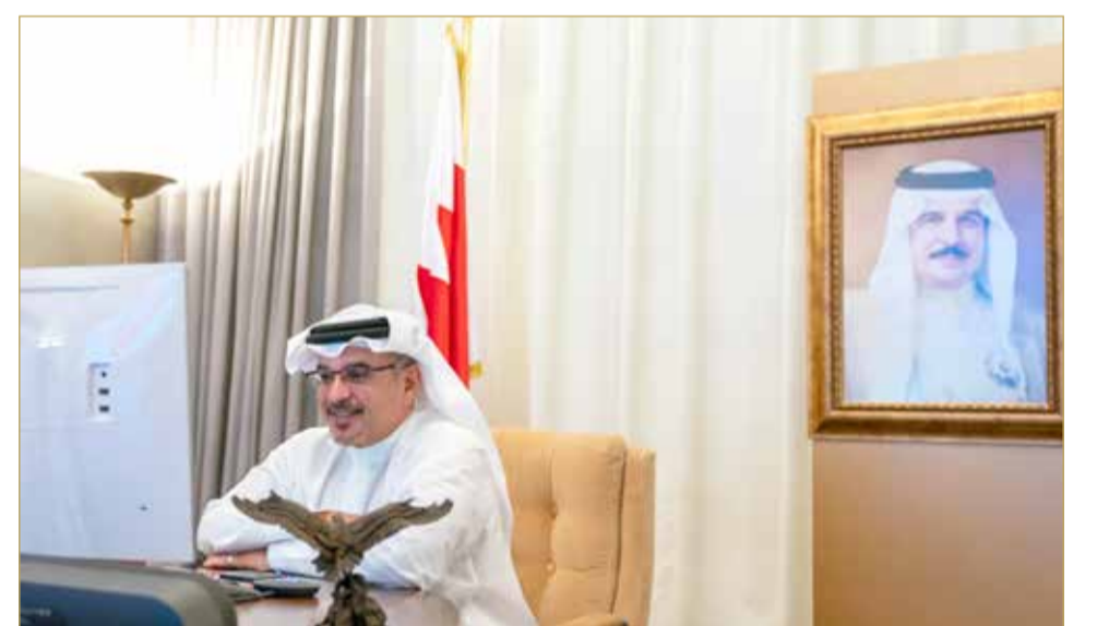
سمو ولي العهد ملتقياً السفير الأميركي وقائد القوات البحرية بالقيادة المركزية الأميركية عن بعد

المنامة - بنا أكد ولي العهد نائب القائد الأعلى النائب الأول لرئيس مجلس الوزراء صاحب السمو الملكي الأمير سلمان بن حمد آل خليفة أهمية تكثيف الجهود والتنسيق المشترك بين مملكة البحرين والولايات المتحدة الأميركية الصديقة، والدفع بها نحو أفق أوسع من التعاون على مختلف الأصعدة، ومواصلة تعزيز العلاقات التاريخية المتميزة التي تربط البلدين والشعبين الصديقين والتي تحظى باهتمام عاهل البلاد القائد الأعلى صاحب الجلالة الملك حمد بن عيسى آل خليفة. جاء ذلك لدى لقاء سموه أمس