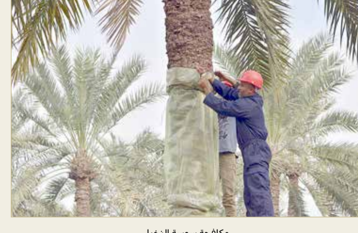
مكافحة سوسة النخيل

الأربع خلال شهر أبريل الماضي؛ من أجل تحديد المزارع والنخيل المصاب بحشرة سوسة النخيل الحمراء وتحديد نسبة الإصابة فيها، حيث تراوحت أعداد النخيل والفصائل المفعوسة (124,228)، حيث تبين نسبة الإصابة فيها 0.6%. وأشار التقرير إلى أن الهدف من هذه الزيارات الدورية هو الحد من انتشار سوسة النخيل الحمراء والسيطرة عليها للحد من أضرارها، والعمل على علاجها بالطرق المختلفة أو إزالة النخيل في حال الإصابة الشديدة، حيث تم علاج 626 نخلة وفسيلة مصابة بينما تم إزالة 114 نخلة وفسيلة، وهذا يأتي ضمن مشروع حصر ومكافحة سوسة النخيل الحمراء.