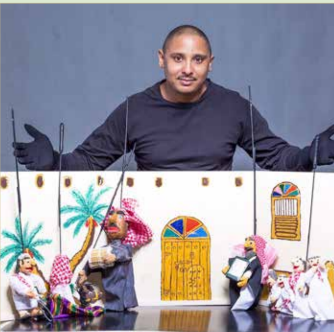
فعاليات الدمى والعرائس تنشط في مواسم معينة