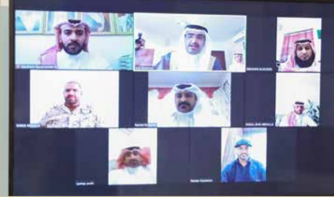
... وسموه يلتقي عدداً من المواطنين عبر الاتصال المرئي

المرافق العامة وتوفير الخدمات الضرورية، حيث تشهد مدينة خليفة عدداً من المشاريع الكبرى التي تعكس البعد التنموي المستقبلي للمدينة في مختلف الأصعدة.