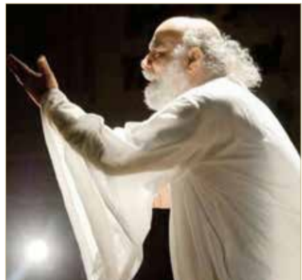
جاء بغزو المسرح