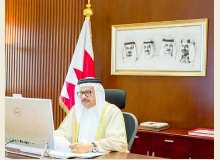
وزير الخارجية مشاركاً في الاجتماع

مملكة البحرين لجهود مبعوث الأمين العام للأمم المتحدة إلى اليمن مارتن غريفيثس، وعلى أهمية الحل السياسي لإنهاء الحرب في اليمن وفق المرجعيات الدولية المعتمدة، مؤكداً أن على الحوثيين أن يدركوا أن لا حل للنزاع في اليمن إلا بقبول قرارات الشرعية الدولية وتنفيذ ما عليها من التزامات، حتى يعود الأمن والاستقرار والسلام مجدداً إلى ربوع اليمن الشقيق.