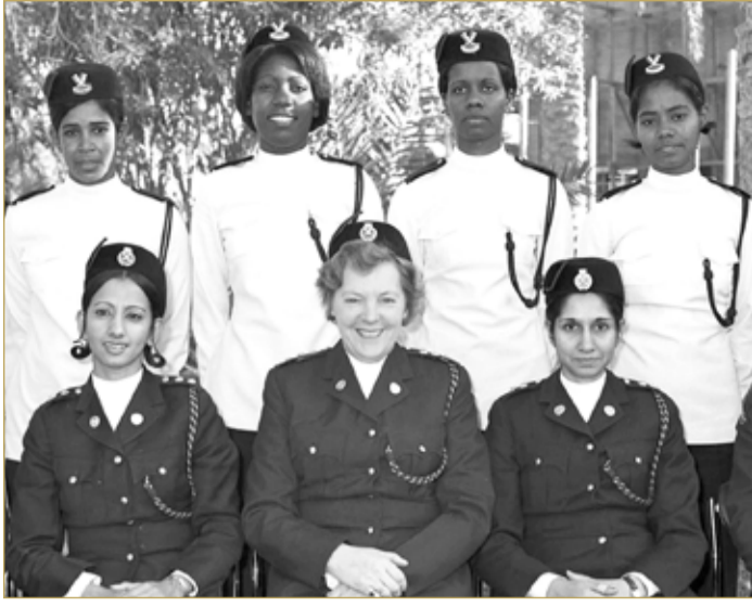
صورة تذكارية لمجموعة من الضابطات والأفراد بالشرطة النسائية، التي يعود تاريخ تأسيسها إلى العام 1970

الفجر: 03:13 الظهر: 11:36 العصر: 03:02 المغرب: 06:27 العشاء: 07:57