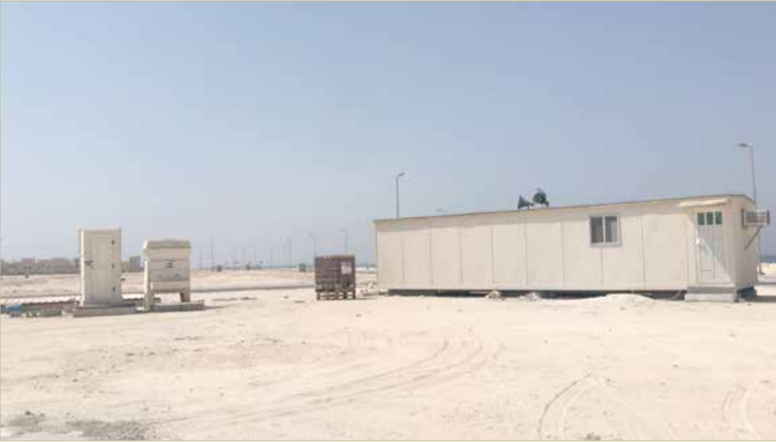
كبينة مؤقتة لأداء الصلاة

الدوسري لـ "البلاد": مجمع 581 يفتر للخدمات الأساسية وأبرزها الجوامع