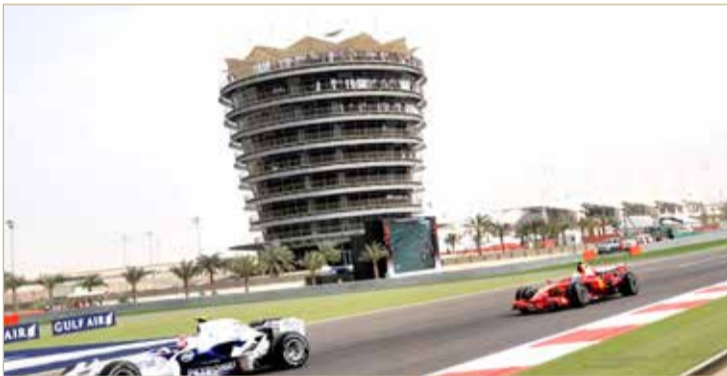
من سباقات الفورمولا 1 في البحرين

وتأمل فورمولا 1 إقامة عدد يتراوح بين 15 و18 سباقاً في الموسم الجاري، على أن يكون الختام في أبوظبي في ديسمبر، وبعد إقامة سباق أيضاً في البحرين.