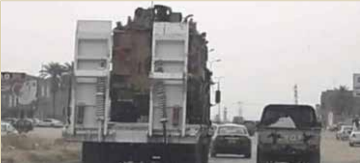
صور متداوله لدبابات حملتها السفينة التركية

تركية كانت قريبة منها، علاوة على رصد موقع مختص على "تويت" بتاريخ 29 مايو بعد وصول السفينة بيوم "مغردون يشكرون تركيا وقطر على إرسال دبابات M60". وتابع المتحدث العسكري الليبي أن مغردين "نشروا صورة لشاحنة بالقرب من مصراته تحمل آلية عسكرية تبدو دبابة".