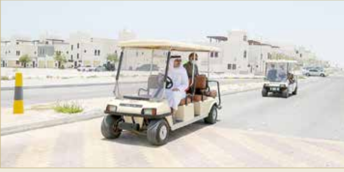
سمو محافظ الجنوبية يقوم برحلة ميدانية إلى مدينة خليفة

سمو الشيخ خليفة بن علي يتفقد مدينة خليفة ويستمع لمقترحات المواطنين