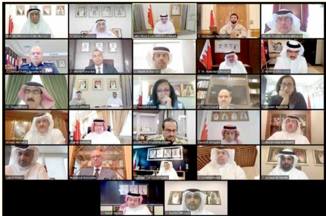
سمو ولي العهد يترأس اجتماع اللجنة التنسيقية

♦ سمو ولي العهد يؤكد أهمية التزام الجميع بالتعليمات الخاصة بالتصدي للفيروس