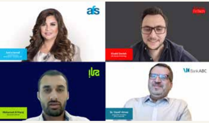
المشاركون في ابرام الشراكة بين الجانبين