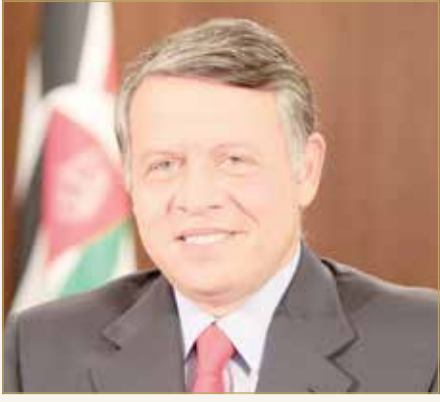
الملك عبدالله الثاني