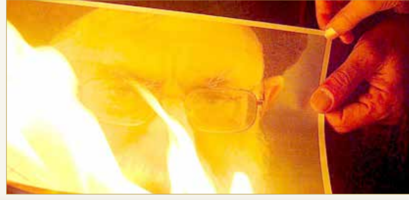
اشتعال صورة خامنئي خلال تظاهرة ضد الظلم في مشهد

أحرق متظاهرون إيرانيون صورة المرشد الأعلى الإيراني علي خامنئي في مدينة مشهد شمال شرقي إيران في تعبير عن غضبهم، مطالبين بالحرية ورفض الظلم في البلاد. وظهر في الفيديو صوت مصور، وهو يقول أثناء اشتعال صورة خامنئي: "فلتسقط سلطة الظلم والفساد والجور والاستبداد والكذب والمراوغة.. على أمل النصر"، مضيفاً "نحن مناضلو طريق الحرية".