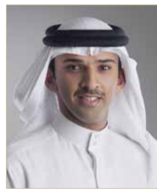
علي بن خليفة

وفي بداية الاجتماع، أشاد الشيخ علي بن خليفة بن أحمد آل خليفة، بالجهود الكبيرة التي يبذلها فريق البحرين بقيادة صاحب السمو الملكي الأمير سلمان بن حمد آل خليفة ولي العهد نائب القائد الأعلى النائب الأول لرئيس مجلس الوزراء، مؤكداً تنفيذ الاتحاد البحريني لكرة القدم التوجهات الصادرة من اللجنة التنسيقية برئاسة سمو ولي العهد، وفي هذا الإطار، فقد اطلع رئيس وأعضاء مجلس إدارة الاتحاد البحريني لكرة القدم على الإجراءات الاحترازية والتدابير الوقائية التي قام بها الاتحاد في مقده، كما اطلع على خطة العمل التي اعتمدها الأمانة