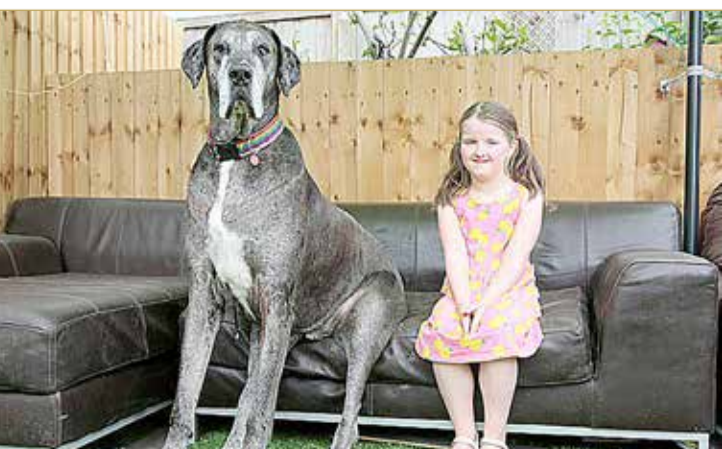
كلب قال "دائماً ما يصدم الناس بحجمه ويخافون منه، ويقولون لي إنني أسير مع حصان في الشارع".

حقق أطول كلب في العالم رقماً قياسياً عالمياً آخر، ليصبح أكبر كلب دنماركي على قيد الحياة بعد الاحتفال بعيد ميلاده الثامن. ويبلغ ارتفاع الكلب الذي اسمه "فريدي الهائل"، أكثر من 7 أقدام وهو يقف على ساقيه الخلفية. وأصبح أقدم كلب دنماركي كبير يعيش في العالم بعد الاحتفال بعيد ميلاده في 17 مايو. وكان "فريدي الهائل" قد حصل بالفعل على المركز الأول كأطول كلب في العالم من موسوعة "غينيس للأرقام القياسية". بعد أن تم قياس طوله رسمياً وبلغ 1.035 متراً. وتميل المالكة للكلب، كبير من مقاطعة نورفولك البريطانية، لإخراجه للتنزه في الصباح الباكر حتى لا يتسبب في اختناق الناس بالشارع، بحسب صحيفة "ديلي ميل" البريطانية.