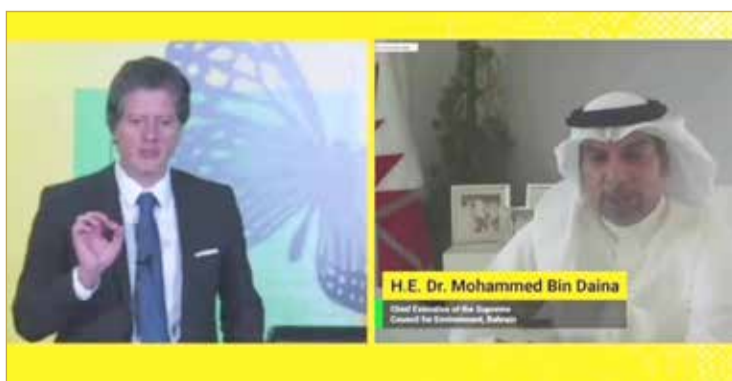
المنامة - المجلس الأعلى للبيئة

♦ بن دينه متحدثا رئيسا في افتتاح أولى فعاليات المؤتمر العالمي الافتراضي