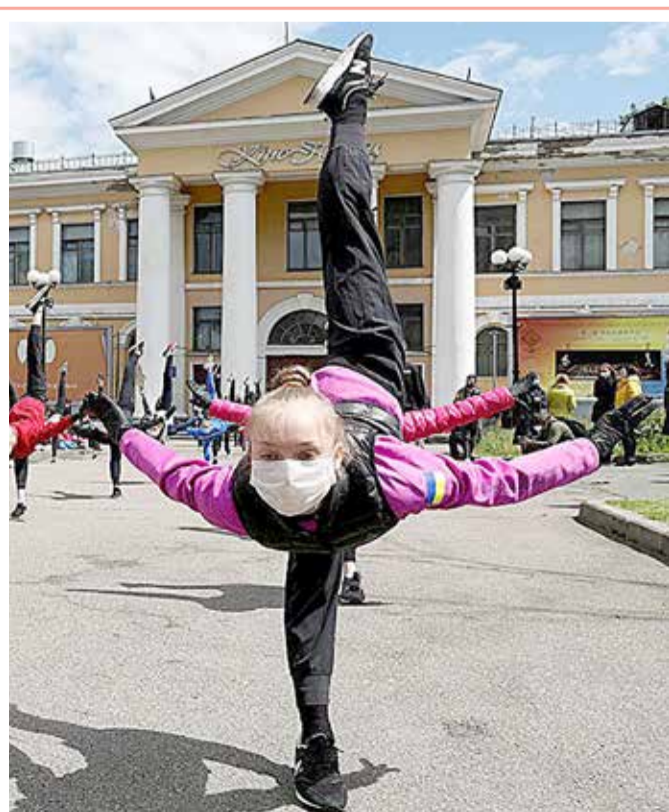
تلميذات مدرسة الجمباز الإيقاعي في كيبف، يرتدون كامات وقفازات في إطار منع الإصابة بمرض 'كوفيد-19' في أوكرانيا.

تمكن أطباء في إزالة شاحن هاتف محمول طوله 60 سم من مئانة شاب، من خلال عملية جراحية استمرت نحو ساعة. ووفقاً لصحيفة "منرو" البريطانية، أعطى الأطباء في مستشفى "جواهااتي" شمال الهند، الشاب دواء مليناً لمدة يومين قبل إجراء العملية، لإزالة الشاحن، الذي تسبب بأوجاع مبرحة للمريض. وقالت الصحيفة نقلاً عن وسائل إعلام هندية، إنه من غير الواضح حتى الآن ما إذا كان الرجل قد ابتلع الشاحن، مشيرة إلى أن الأطباء قالوا إنهم لم يشهدوا مثل هذه الحالة طوال حياتهم العملية. وقال أحد الأطباء المشاركين في العملية: "لم يشأ أن يخبرنا الحقيقة لأنه كان يشعر بالحرج، ورغم أنني لست متأكدًا من حالة المريض العقلية إلا أن بعض الأشخاص يقومون بمثل هذه الأشياء للمتعة، لكن يبدو أن هذا الرجل تجاوز الحدود".