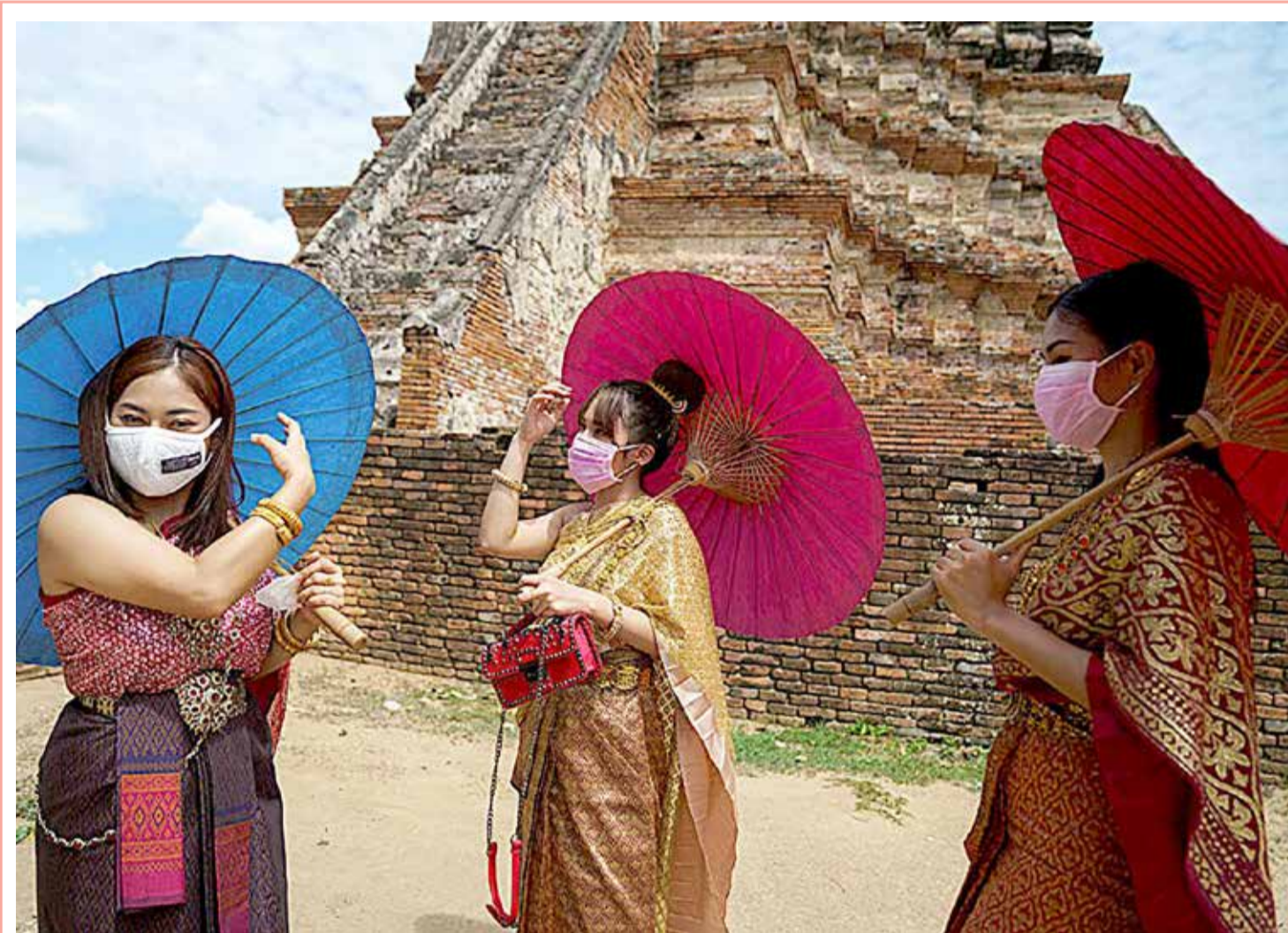
نساء يرتدين كامات وأزياء تقليدية أثناء زيارة إلى معبد وات شايواتانارام بعد أن خففت الحكومة التايلندية من إجراءات الحجر المنزلي المفروض لمنع الإصابة بمرض 'كوفيد-19' في مدينة أيوتتايا، تايلند. (رويترز)