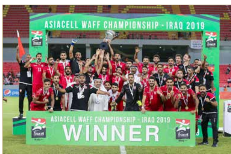
منتخبنا الوطني بطل النسخة الأخيرة لبطولة غرب آسيا للرجال

وتطفو على السطح بطولة غرب آسيا للرجال المقرر إقامتها في دولة الإمارات العربية المتحدة خلال يناير من العام المقبل (2021)؛ كونها المسابقة الأبرز، وستستحوذ على الاهتمام الأكبر في الاجتماع للمناقشة، إذ ستبحث الاتحادات موضوع التأجيل، خصوصاً بعد التغييرات العديدة التي طالت على جداول المباريات الدولية المتعلقة بالتصفيات المزدوجة على وجه التحديد، إضافة إلى البداية المتأخرة المنتظرة لمسابقات الموسم الرياضي الجديد 2020-2021؛ كون مسابقات