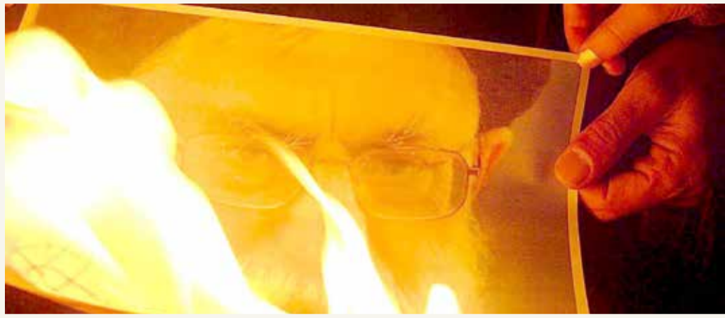
اشتعال صورة خامنئي خلال تظاهرة ضد الظلم في مشهد

أحرق متظاهرون إيرانيون صورة المرشد الأعلى الإيراني علي خامنئي في مدينة مشهد شمال شرقي إيران في تعبير عن غضبهم، مطالبين بالحرية ورفض الظلم في البلاد. وظهر في الفيديو صوت مصور، وهو يقول أثناء اشتعال صورة خامنئي: "فلتسقط سلطة الظلم والفساد والجور والاستبداد والكذب والمراوغة.. على أمل النصر، مضيافا نحن مناوئو طريق الحرية".