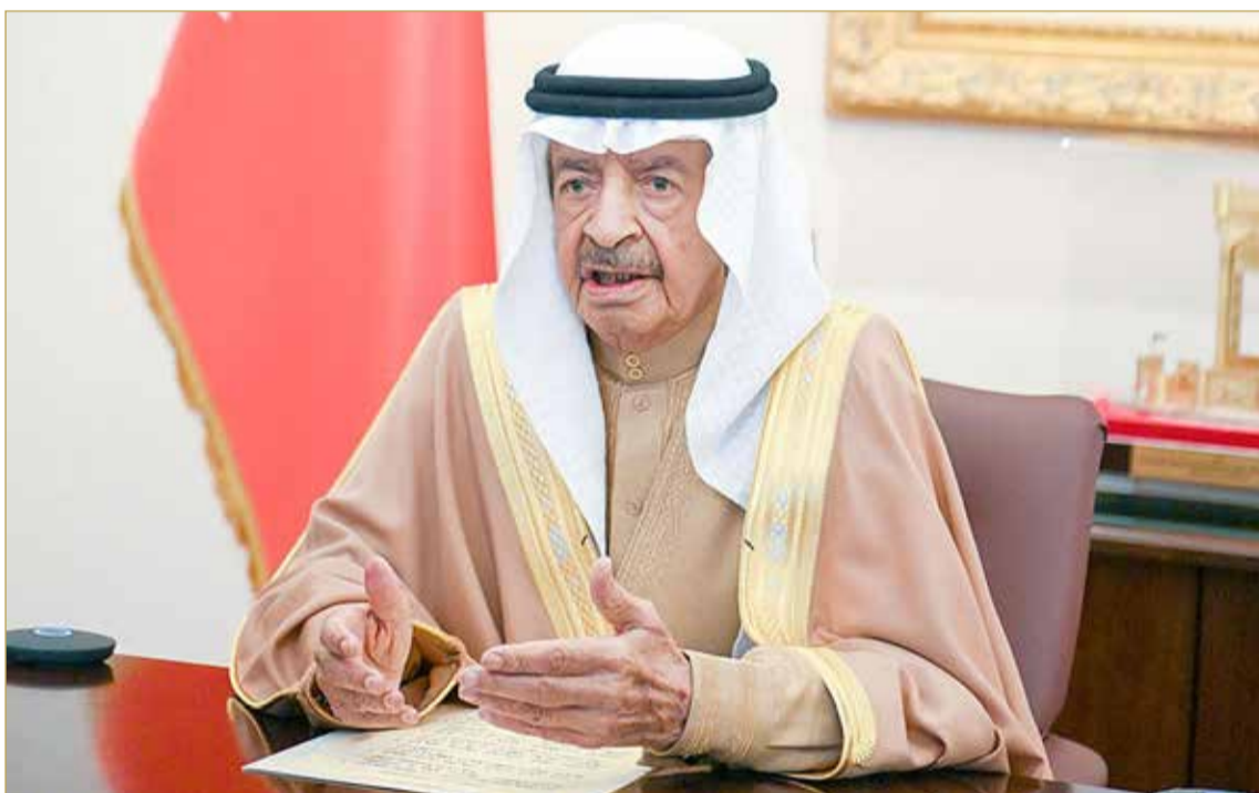
سمو رئيس الوزراء مترئسا جلسة مجلس الوزراء أمس

♦ سمو رئيس الوزراء للوزارات: تجاوزوا مع ما يطرح بوسائل الإعلام بأقصى سرعة