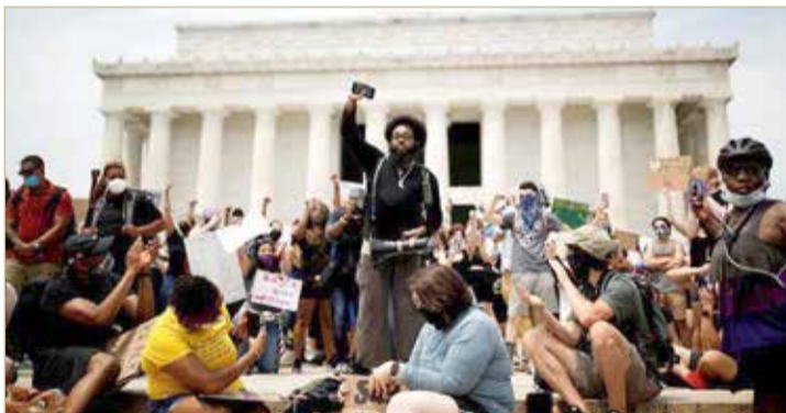
متظاهرون خلال احتجاج ضد العنصرية وعنف الشرطة في واشنطن