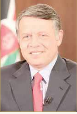
الملك عبدالله الثاني