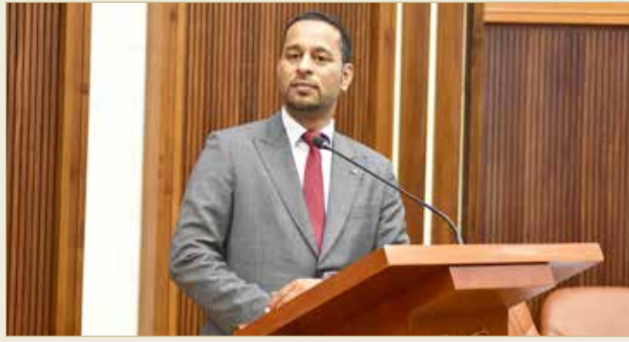
النائب محمود البحراني

♦ البحراني يشكر توجيهات سموه لتلبية احتياجات "الغربية"