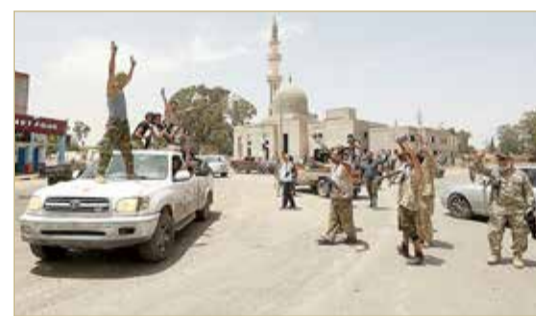
عناصر من فصائل الوفاق في تهرونة