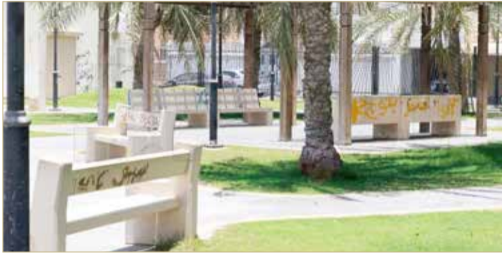
حديقة علاء الدين

“حاتم الطائي” بعهددة مستثمر بحريني وستفتتح بنهاية أغسطس