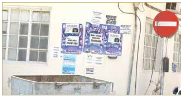
ملصقات إعلانية عشوائية في شارع اللولو

البلاد | راشد الغائب