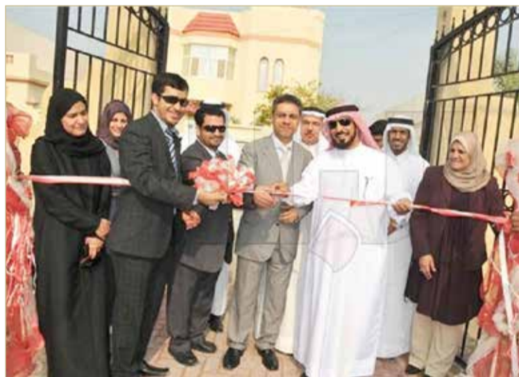
افتتاح حديقة مركوبان في ديسمبر 2009

البلاد | راشد الغائب | تصوير رسول الحجيري