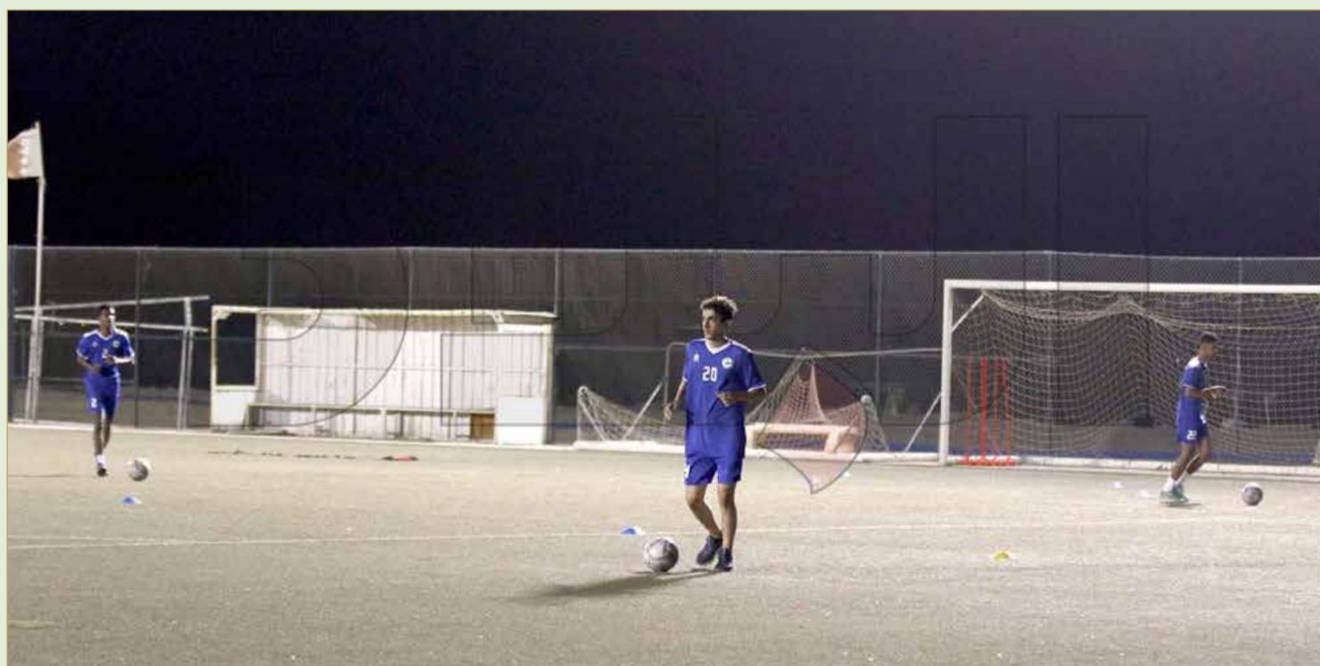
من تدريبات فريق البديع

وأعدت الأندية الحياة للملاعب التي ظلت مهجورة وخالية أكثر من 3 شهور بعد تعليق الأنشطة الرياضية؛ بسبب فيروس كورونا، إذ كان نادي الحد أول نادٍ يعلن استئناف التدريبات وعودة لاعبيه للملاعب، تبعه نادي الرفاع الشرقي والنجمة والبديع.