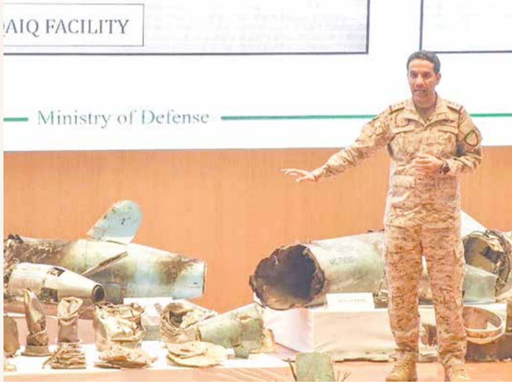
الصواريخ التي هاجمت السعودية أصلها إيراني بحسب الأمم المتحدة

بعد أشهر على التحقيقات، أبلغ الأمين العام للأمم المتحدة أنطونيو غوتيريش مجلس الأمن الدولي في تقرير، أن صواريخ كروز التي هجومت بها منشأتان نفطيتان تابعتان لأرامكو ومطار دولي في السعودية العام الماضي "أصلها إيراني".