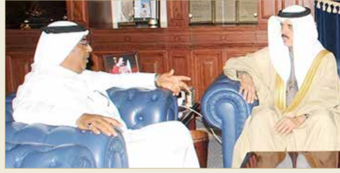
وزير التربية مستقبلا النائب الدمستاني قبل فترة

متضررون ينتظرون 6 أشهر... وطلبات الموظفين كثيرة والتواصل معهم ممل