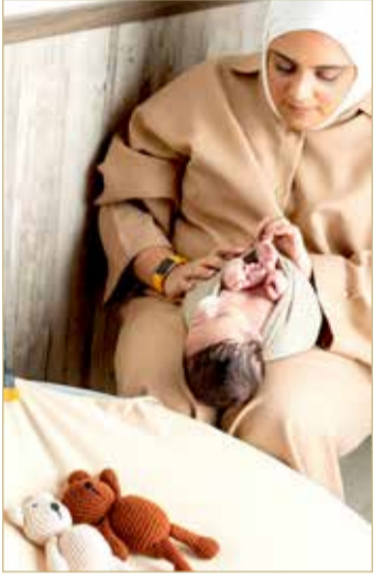
« التصوير مهنة مطلوبة في العمل الإعلامي لماذا لا تخرطين في هذا الوسط؟ »

هذا مجال مهم وفيه الكثير من التحديات وأنا أحب ذلك، وشخصيا لا أقف فيما أقدمه من تصوير فقط، لكني أتعلم كل يوم في هذا المجال وأطور نفسي بالتشعب كدمج التصوير في مجالات أخرى.