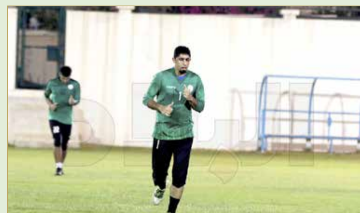
من تدريبات فريق الحد