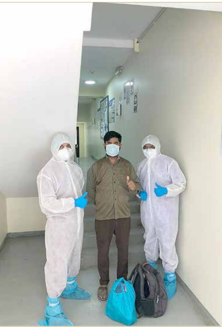
المريض رقم 500 خارجا من المستشفى

تشاندران: شركاء في تقديم الرعاية الصحية والعلاجية بأسعار تنافسية