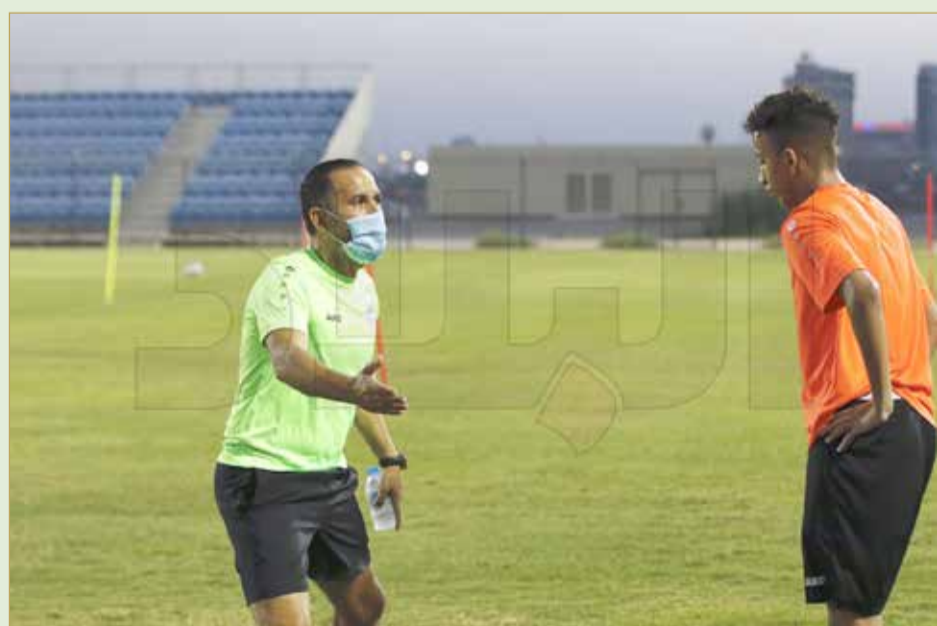
من تدريبات فريق النجمة