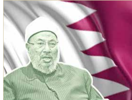
حسابات القرضاوي في بنك قطر الوطني مولت جرائم أودت بحياة أميركيين

تشهد نيويورك دعوى قضائية ضد قطر تتهمها بتمويل قتل أميركيين. وجاء في الدعوى أن "دوائر قطرية رسمية ومؤسسات مالية وفرت مبالغ طائلة لإرهابيين". إلى ذلك، اتهمت الدعوى الأميركية، قطر بتمويل إرهابيين نفذوا عمليات موجعة ضد أميركيين". كما ذكرت أن الدوحة "استخدمت قنوات مالية أميركية لتمويل إرهابيين".