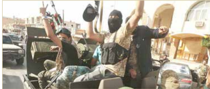
فصائل وميليشيات موالية لحكومة الوفاق في طرابلس

محاور القتال غرب سرت. يذكر أنه أواخر الشهر الماضي، أعلن الجيش الليبي، اعتقال "محمد الرويضاني" وهو أحد أخطر عناصر داعش الذين انتقلوا من سوريا إلى ليبيا، وقائد ما يسمى "فيلق الشام"، يتهم بعدة جرائم قتل وخطف لنساء واغتصاهن، قبل قدومه إلى ليبيا لمؤازرة قوات حكومة الوفاق.