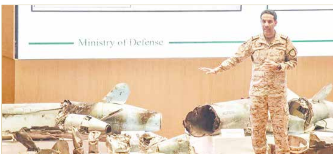
الصواريخ التي هاجمت السعودية أصلها إيراني بحسب الأمم المتحدة

وذكر أن "هذه القطع ربما نُقلت بطريقتين لا تتسق" مع قرار مجلس الأمن لعام