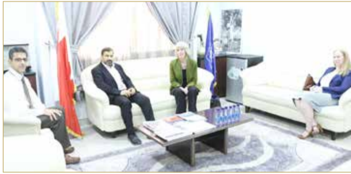
جين ونائب السفير والشهابي والحلواجي

◆ "النقابات": لتتوحد جميع الجهود لحين انتهاء الجائحة