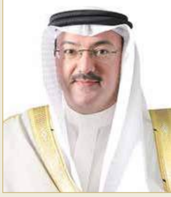
الشيخ محمد بن خليفة