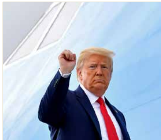
دونالد ترامب رافعا قبضته مع صعوده على متن الطائرة الرئاسية بقاعدة اندروز الجوية في 11 يونيو الجاري

جو بايدن، ومع ذلك، يتعين على مؤيدي ترامب التوقيع على تنازل، متعهدين بعدم اتخاذ أي إجراءات قضائية ضد الحملة إذا اصيوا بـ "كوفيد 19" أثناء مشاركتهم في التجمعات، وفقا لموقع حملته على الانترنت.