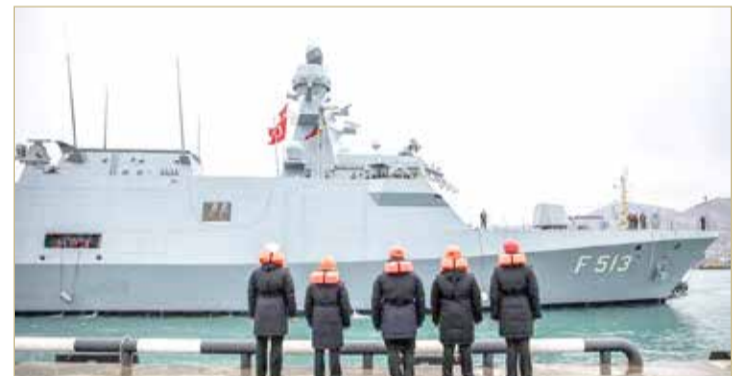
سفن حربية تركية منعت تفتيش سفينة متجهة لليبيا

إلى ليبيا. وقد رافقت هذه السفينة سفن عسكرية تركية أخرى. وانطلاقا من هذا الحرق، يبحث وزراء دفاع الناتو حاليا الطريقة التي يمكن أن يساعد بها الحلف مهمة إيريني البحرية، بما يضمن تطبيق حظر الأسلحة الذي أقرته الأمم المتحدة كاملا، وفقا لما قاله