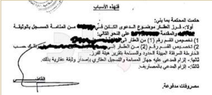
حكم قضائي بتقسيم أرض

الأخ الفاضل... شكرا على تواصلكم معنا. بعد التحقق في تفاصيل طلبك رقم... إحاطتك علما بأن فرز الأملاك من اختصاص وزارة العدل والشؤون الإسلامية والأوقاف. كما نفيدكم بأن هيئة التخطيط والتطوير العمراني لم تصدر أي قرار بوقف الأحكام القضائية الصادرة بشأن فرز الأملاك، حيث قام جهاز المساحة والتسجيل العقاري بالتنسيق مع هيئة التخطيط والتطوير العمراني لإبداء الرأي من الناحية الفنية والتخطيطية. لمزيد من المعلومات يسعدنا تلقي اتصالاتكم من خلال الخط الساخن 17682888 أو عبر نظام تواصل خدمة أفضل لكم