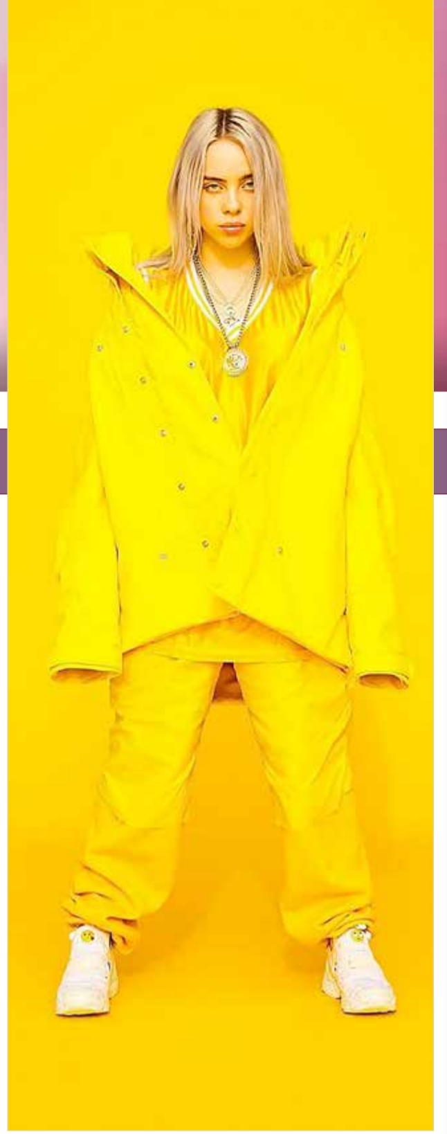
« أطلقت النجمة بيبي ايليش فيديو كليب أغنيها الجديدة "Not My Responsibility"، وذلك على قناتها الرسمية على يوتيوب. وقد تخطى الكليب المليون ونصف مشاهدة بعد يوم واحد من طرحه. يذكر أن بيبي ايليش فازت مؤخرا بجوائز Grammys أمام كل من النجمات العالميات لانا ديل ري، اريانا غراندي وبيونسي.

يجب استغلال وقت الفراغ لتسجيل تلك الذكريات بطريقة مرحة وظرفية لتضاف إلى الذكريات السابقة، فلكل منها مثيراته الجميلة التي تبعث في النفس رائحة الماضي الجميل.