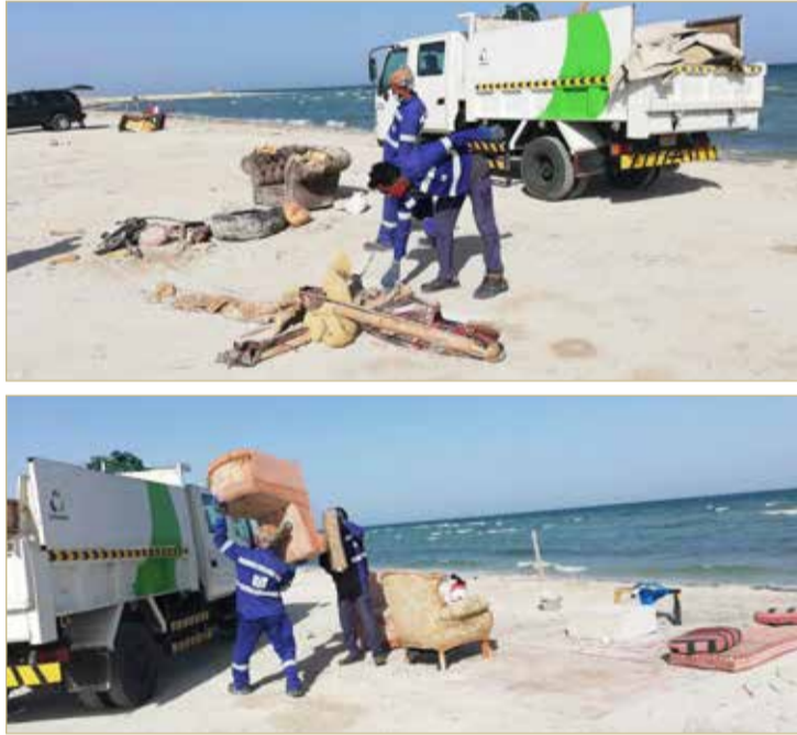
البلدية تزيل النفايات