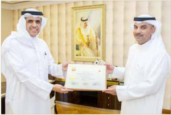
وزير الإعلام يستقبل المدير العام لوكالة أنباء البحرين

إثر مشاركته واجتيازه دورة الدفاع الوطني الثانية