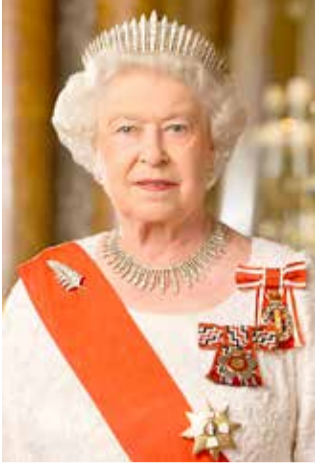
الملكة اليزابيث الثانية

إشادة بحرينية بعمق العلاقات التاريخية بين البلدين