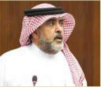
النائب خالد بوعناق

به البحرين بجميع مدنها وقراها وإن سموه شخصية عالمية لها إسهام كبير في تعزيز الاهتمام بالقضايا الإنسانية وقضايا السلام والتنمية المستدامة، معرباً عن عظيم التقدير لجهود سموه المتواصلة في إثراء العمل الدولي بمبادرات وخطوات رائدة يحتاجها العالم من أجل بناء مستقبل أفضل لأجياله القادمة، ومنها يوم الضمير الدولي الذي يعد مبادرة نوعية تستهدف ترسيخ قيم الحب والمشاركة والتضامن والسلام والرخاء للجميع، وإيجاد حياة قوامها الإحساس بالمسؤولية والتأكد من أن لدى الدول تنمية مستدامة تتطابق وأهداف التنمية المستدامة السبعة عشرة.