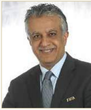
سلمان بن إبراهيم

أعرب رئيس الاتحاد الآسيوي لكرة القدم النائب الأول رئيس الاتحاد الدولي لكرة القدم الشيخ سلمان بن إبراهيم آل خليفة عن عميق مشاعر التعزية والمواساة إلى الاتحاد العراقي لكرة القدم بوفاة النجم الدولي السابق والمدرّب علي هادي، الذي توفي يوم الجمعة عن عمر يناهز 53 عامًا، بعد إصابته بفيروس كورونا المستجد (كوفيد 19).