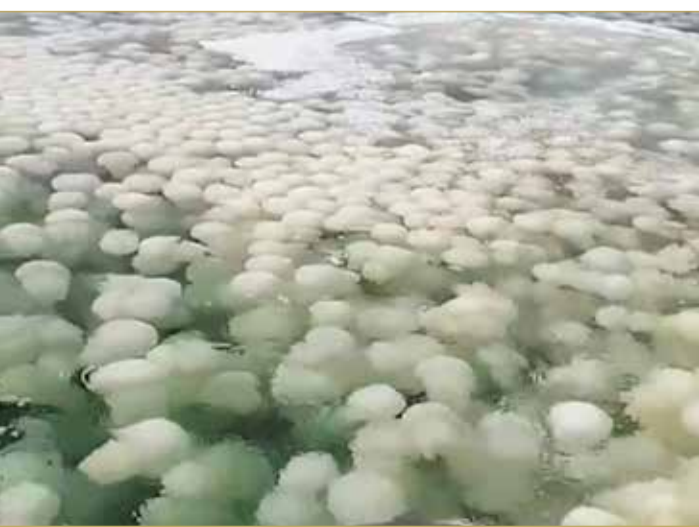
مئات من قناديل البحر (الفعاليل) ببحر البحرين

ويشكل الماء نسبة عالية من جسمه لما يصل إلى نحو 95% من وزنه وبه بعض الأعضاء، وفتح فمه بالوسط وله العديد من اللوامس أو المجسات الحسية، يتحرك في المياه بانقباض جسمه، ثم فرده بحركة حرة مع لوامسه، وتساعد حركة التيار المائي في الانتقال لمسافات بعيدة.