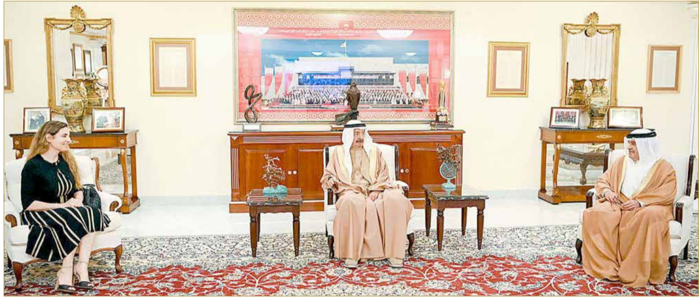
سمو رئيس الوزراء مستقبلاً السفيرة الإيطالية