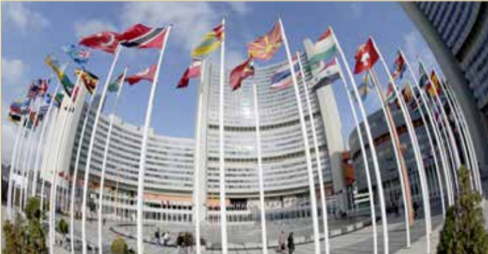
واشنطن تعتقد أن تمديد حظر الأسلحة على إيران يجب أن يكون لأجل غير مسمى

♦ يدين الهجوم على "أرامكو" ويحظى بدعم فرنسا وألمانيا وبريطانيا