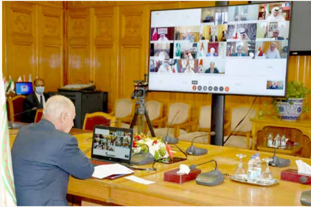
الأمين العام أحمد أبو الغيط أثناء اجتماع الجامعة العربية

♦ مصر لن تسمح بسيطرة الإرهابيين.. والعراق يدين التدخل الخارجي في الشأن العربي