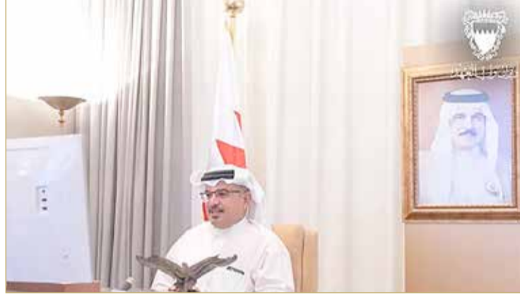
سمو ولي العهد يترأس اجتماع اللجنة التنسيقية