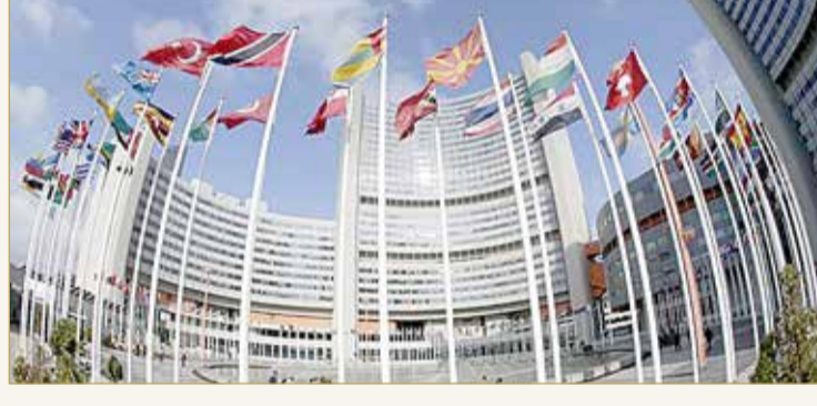
واشنطن تعتقد أن تمديد حظر الأسلحة على إيران يجب أن يكون لأجل غير مسمى (12)