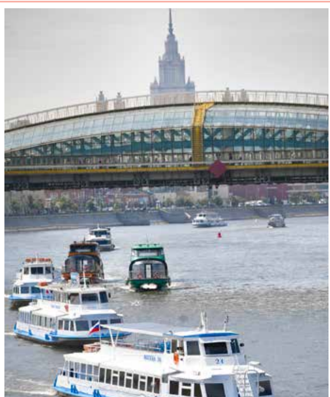
قوارب ترفيهية تشارك في عرض على نهر موسكفا، احتفالا ببداية موسم الملاحة في موسكو الذي تم تأجيله بسبب جائحة "كوفيد 19"