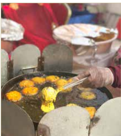
فاطمة فوزي أحمد خلف

وحصلت المشاركة فاطمة فوزي أحمد خلف على جائزة أعلى نسبة تصويت من الجمهور