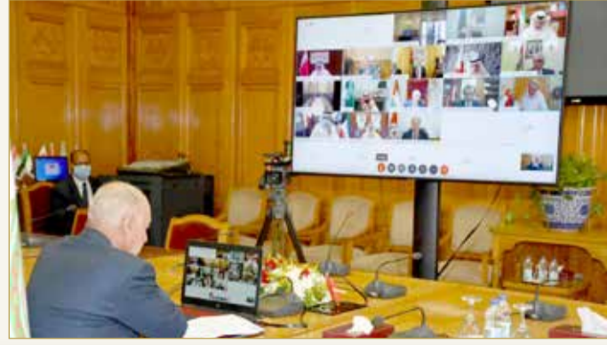
الأمين العام أحمد أبو الغيط أثناء اجتماع الجامعة العربية

طالب الأمين العام للجامعة العربية أحمد أبو الغيط بـ"ضرورة إخراج المرتزقة والمقاتلين الأجانب من ليبيا". وأعلن أبو الغيط في الاجتماع الوزاري العربي عن ليبيا، أمس، أن "تدويل الأزمة الليبية مقلق، وليبيا تمر بمنعطف خطير". وأكد وزير الخارجية المصري سامح شكري في اجتماع الدورة غير العادية لمجلس جامعة الدول العربية أن مصر لن تتهاون مع الإرهاب وداعميه، ولن تتوانى عن اتخاذ كل إجراء كفيل بمنع وقوع ليبيا وشعبها الأبي الكريم تحت سيطرة الجماعات الإرهابية والمليشيات المسلحة. (12)