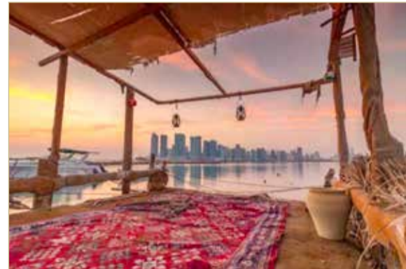
عيسى صالح عيسى آل طريف

أعلن المكتب التنفيذي للخطة الوطنية لتعزيز الانتماء الوطني وترسيخ قيم المواطنة “بحريننا”، عن أسماء الفائزين في مسابقة “بحريننا في عيوننا” للتصوير الفوتوغرافي والفيديو، التي انطلقت في 8 يناير واستمرت على مدار شهر كامل، بحصوله أعمال مشاركة بلغت نحو 500 عمل مقدم من أكثر من 210 مشاركين في المسابقة.