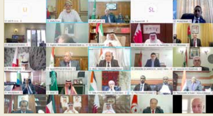
وزير الخارجية يشارك في الاجتماع

ورحب المجلس بالمبادرات والجهود الدولية كافة وجهود دول الجوار الرامية إلى وقف العمليات العسكرية واستئناف العملية السياسية في ليبيا برعاية الأمم المتحدة، وفي هذا السياق الترحيب بإعلان القاهرة بشأن ليبيا الصادر يوم 6 يونيو 2020، الذي يركز على أن الحل في ليبيا يجب أن يستند إلى الاتفاق السياسي الليبي وقرارات مجلس الأمن ذات الصلة ومخرجات مؤتمر برلين والقمة والجهود الدولية الأممية السابقة التي نتج عنها طرح لحل سياسي شامل يتضمن خطوات تنفيذية واضحة في المسارات السياسية والأمنية والاقتصادية واحترام حقوق الإنسان والقانون الإنساني الدولي والطلب من كافة الأطراف الليبية والدولية التعاطي بإيجابية مع هذه المبادرات. وأكد المجلس على ضرورة التوصل الفوري إلى وقف دائم لإطلاق النار، والاتفاق على ترتيبات دائمة وشاملة لتنفيذه والتحقق من الالتزام به من خلال استكمال أعمال مسار المباحثات الدائرة في إطار اللجنة العسكرية المشتركة (5x5) بجنيف برعاية الأمم المتحدة، والعودة السريعة لمفاوضات الحل السياسي واستكمال تنفيذ مسارات مؤتمر برلين في جانبها السياسي والاقتصادي لتحقيق تسوية شاملة للأزمة، تمهيداً لإجراء الانتخابات لانتاح الفرصة للشعب الليبي لاختيار ممثله بحرية، والانتقال إلى بناء الدولة المدنية الديمقراطية.