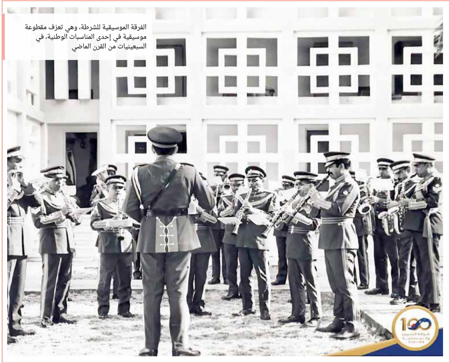
الفرقة الموسيقية للشرطة، وهي تعزف مقطوعة موسيقية في إحدى المناسبات الوطنية، في السبعينيات من القرن الماضي