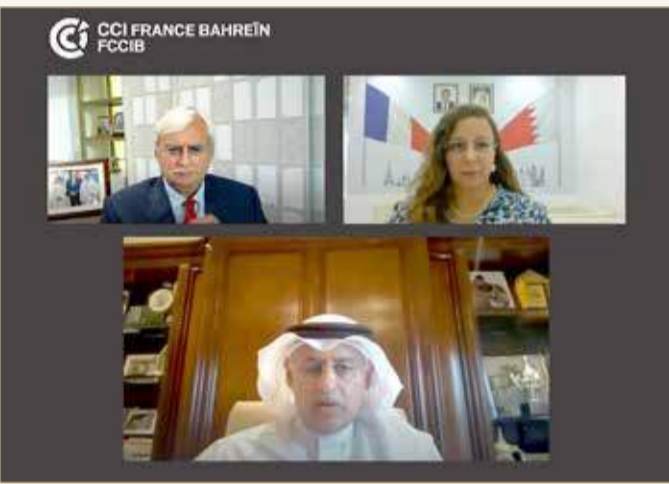
الاجتماع السنوي للغرفة الفرنسية بالبحرين

وقالت جلالي "إن كان العام 2019 عامًا مثيراً لـ "FCCIB"، وعلى الرغم من الصعوبات التي واجهتها الغرفة في العام 2020،