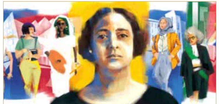
ورأست شعراوي العديد من الجمعيات والاتحادات النسائية وواصلت عملها حتى وفاتها في 12 ديسمبر 1947.

الشعراوي، في مدينة المنيا بصعيد مصر في 23 يونيو 1879، وهي تنتمي إلى الجيل الأول من الناشطات النسويات المصريات اللاتي شكلن تاريخ الحركة النسوية في مصر في نهايات القرن التاسع عشر وحتى منتصف القرن العشرين. وفي حياتها، خاضت هدى شعراوي معارك عدة في سبيل تحرير المرأة، وكتبت ودعت مرارا إلى حياة أكثر انتاحا للمرأة تتجاوز نطاق الأسرة.