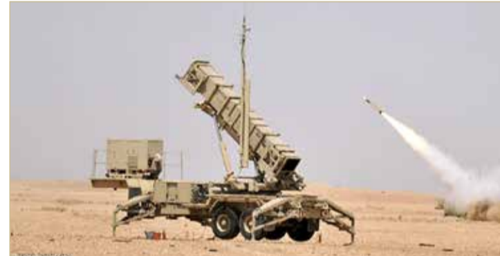
الدفاع الجوي السعودي اعترض غالبية الصواريخ الحوثية

♦ بعد ساعات على إحباط محاولة للميليشيات إطلاق مسيرة مفخخة