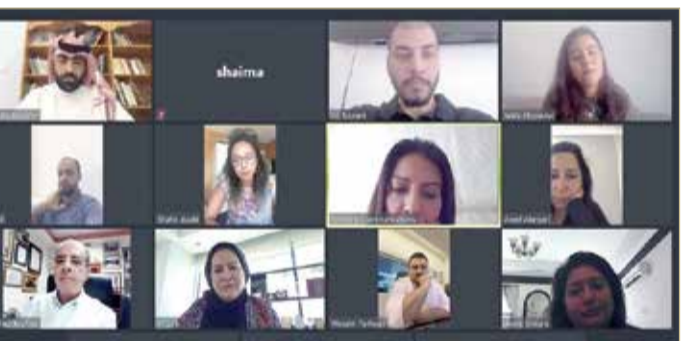
الاجتماع الافتراضي لممثل "تنظيم الفعاليات"

ممثلو الشركات: القطاع أكثر تضرراً من جائحة كورونا