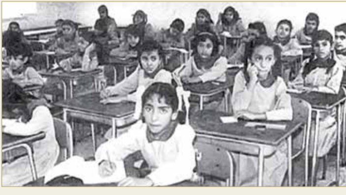
أحد صفوف المرحلة الابتدائية في مدارس البنات

كل من أنهى المرحلة الابتدائية، ففي العام الدراسي (61 - 1962) قُسم التعليم الثانوي إلى مرحلتين الإعدادية ومدتها سنتان، والثانوية ومدتها 3 سنوات، وكان هذا التعليم منذ نشأته عاماً للجميع، ونظامه موحد بين البنين والبنات، وأهدافه تتمثل في إعداد التلميذات لما يمكنهن من العمل بعد تدريب مهني أو إلى مواصلة الدراسة في المرحلة الثانوية العامة.