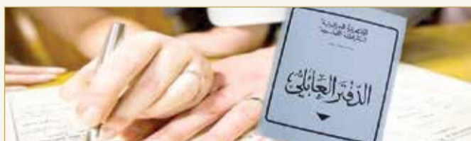
ولايات جزائرية تحظر إبرام عقود الزواج وحفلات الزفاف حتى إشعار آخر

في وقت سابق، أمرت الحكومة جميع ولايات الجمهورية بمنع كل التجمعات السكانية في الأماكن العمومية أو داخل القاعات. وتسجل الجزائر في الآونة الأخيرة ارتفاعا ملموسا لتفشي فيروس كورونا، خاصة في الفترة التي أعقبت رفع الحجر الصحي عن بعض الولايات وإعادة إطلاق بعض الأنشطة التجارية. وأكد وزير الصحة، عبد الرحمان بن بوزيد، يوم الاثنين، أن الحكومة لن تعود مجددا إلى فرض الحجر الصحي الجائحة. وهذه القرارات جاءت نتيجة عدم احترام تدابير الصحة والوقاية والإخلال بقواعد التباعد الاجتماعي.