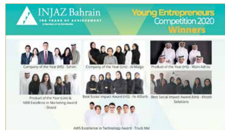
الفرق الفائزة بمسابقة إنجاز البحرين

وأقيمت مسابقة هذا العام برعاية "تمكين"، وبنغاز وشركة أمازون ويب سيرفيسز (AWS)، وبنك البحرين الوطني (NBB).