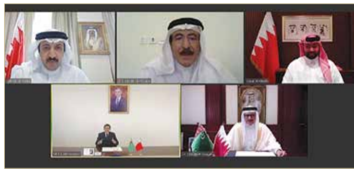
من جلسة مشاورات ثنائية بين وزارة الخارجية في البحرين ووزارة الخارجية في تركمانستان

جلسة مشاورات ثنائية لبحث تفعيل الاتفاقات الموقعة