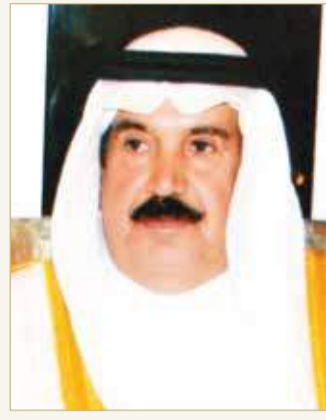
دعيج بن سلمان

ضاحية السيف - المجلس الأعلى للشباب والرياضة