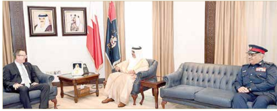
وزير الداخلية مستقبلاً وبحضور رئيس الأمن العام، السفير الأميركي

وزير الداخلية يؤكد تنامي العلاقات مع واشنطن في المجال الأمني