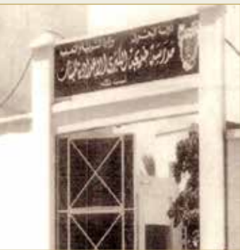
صورة لمدرسة خديجة الكبرى للبنات