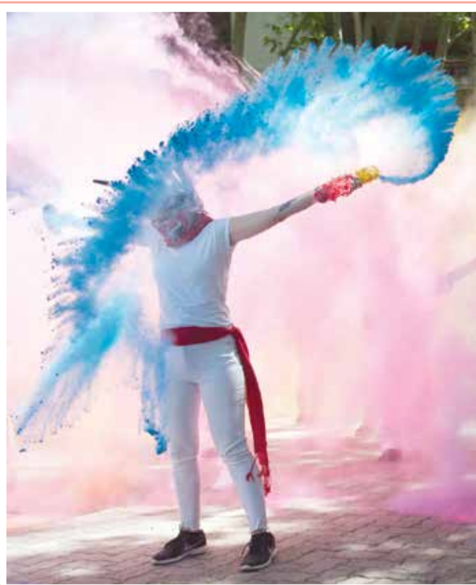
ناشطة تحتفل بإلغاء مصارعة الثيران في مهرجان سان فيرمين بعد مظاهرة لجماعات حقوقية مؤيدة للحيوانات في بامبلونا الاسبانية

«وأوضح الأطباء أن بكتيريا موجودة في لعاب القطة تسببت للمرأة بالتهاب سحايا بكتيري المنشأ. ودخلت السيدة في غيبوبة لمدة 9 أيام، قبل أن تفارق الحياة مساء الاثنين الماضي.»