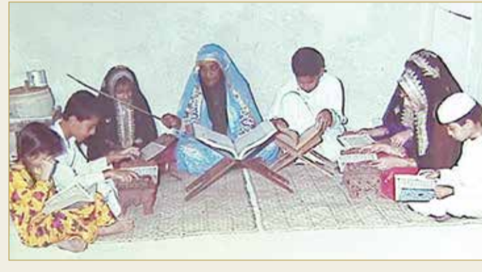
المطوعة وهي تعلم الأولاد والبنات داخل منزلها