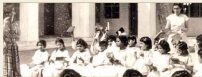
أحد الصفوف الدراسية بالعام 1947

المرأة البحرينية عرفت طريقها إلى التعليم عبر "المطويات"