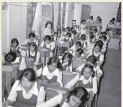
طالبات المرحلة الثانوية أثناء الامتحانات النهائية للعام 1976