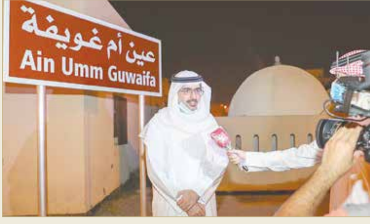
سمو محافظ الجنوبية يحضر حملة التعقيم والتطهير

عن تقديرهم لما يقوم به سمو محافظ الجنوبية من جهود بارزة لدعم المبادرات الأمنية والمجتمعية الرائدة.