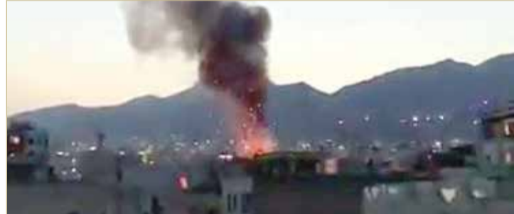
مقتل شخصين بانفجار وقع في مصنع بالعاصمة طهران

◆ إيران تهدد بـ "الرد المناسب" إذا ثبت تدخل خارجي بانفجار نطنز