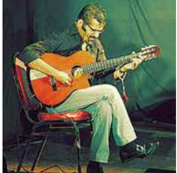
آخر وهج العظمة والفرح المتبقي