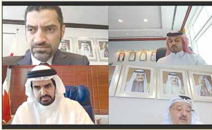
جانب من الاجتماع عبر تقنية الاتصال المرئي

على الكهرباء والماء لمختلف قطاعات التنمية. من جانبه، أشاد وكيل وزارة شؤون مجلس الوزراء سمو الشيخ عيسى بن علي بن خليفة آل خليفة، بجهود وزارة شؤون الكهرباء والماء وما تقدمه من حلول وجهود متواصلة لتقديم أعلى مستويات الخدمة للمواطنين والمقيمين، منوهاً بما اتخذته الوزارة من استعدادات لمواجهة الطلب المتزايد على الطاقة في فصل الصيف، متمنياً للوزارة والقائمين عليها كافة دوام التوفيق في خدمة عجلة التنمية بالمملكة.