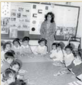
أحد صفوف الروضة في الستينات