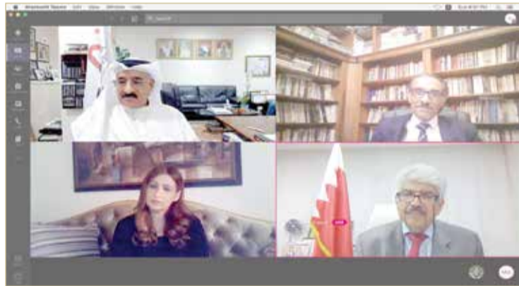
فعالية الشراكة المجتمعية

السيد: "فيينا خير" كشفت المعدن الطيب والأصيل لشعب المملكة