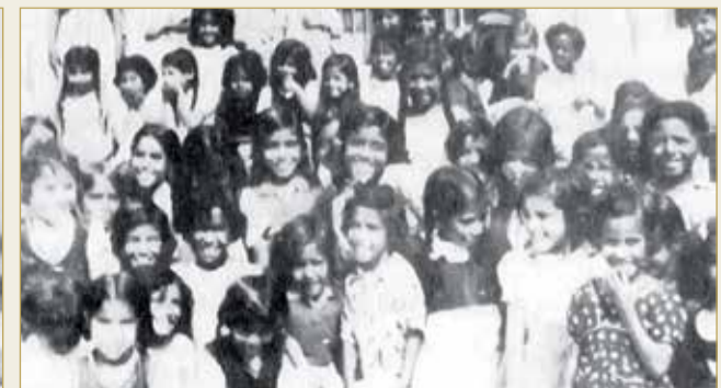
مجموعة من الطالبات بإحدى مدارس البحرين في الأربعينات