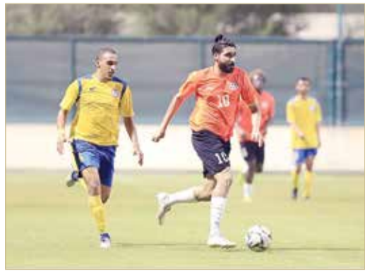
من اللقاء الودي بين النجمة وقلالي