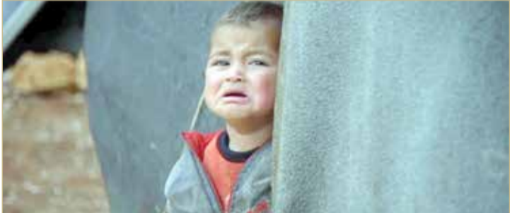
طفل لعائلة سورية لجأت لاستخدام سجن مهجور كماؤ في إدلب

◆ التقرير ندد بهجمات لنظام الأسد ولمقاتلين متشددين