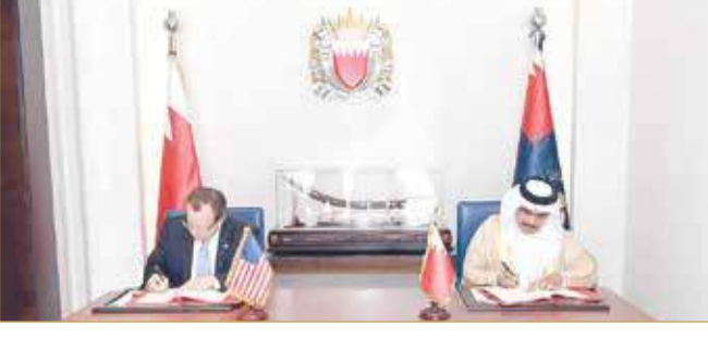
(02) وزير الداخلية يوقع خطاب اتفاق مع السفير الأميركي