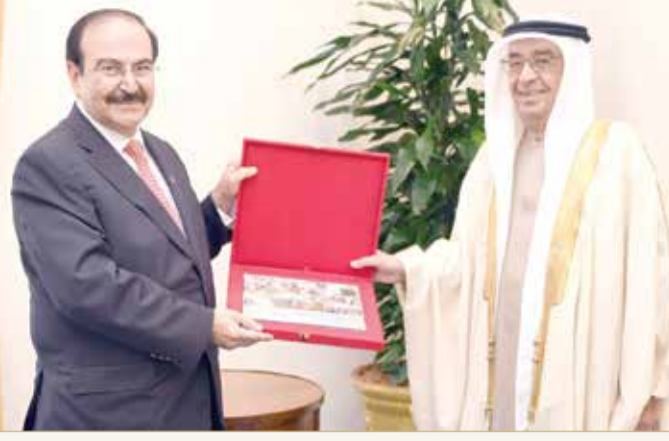
سمو نائب رئيس مجلس الوزراء مستقبلاً رئيس هيئة الطاقة المستدامة