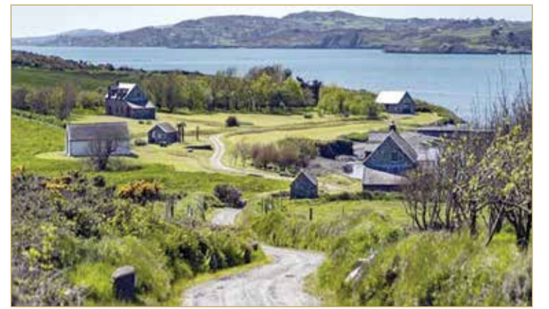
الجزيرة توفر ريفيا خاصا للعبارات والقوارب، ومهبطا للطائرات، وبيت ألعاب، وصالة ألعاب رياضية، وملعب تنس، كما تتمتع ببنسبات كهرباء ومياه وصرف صحي وطرق خاصة.

بيعت جزيرة خاصة قبالة ساحل أيرلندا تضم 3 شواطئ و7 منازل، وتتميز بحياة برية طبيعية، مقابل 6.3 مليون دولار، رغم عدم زيارة المشتري المجهول للموقع شخصيا قبل إتمام الصفقة. وبحسب شبكة "سي إن إن"، تم بيع جزيرة "هورس" أو الحصان، التي تبلغ مساحتها 157 فدانا (القدان يساوي 4200 متر مربع)، بعد مفاوضات جرت على الأرجح عبر تطبيق المراسلة "واتساب". وتتمتع الجزيرة بمناظر طبيعية خضراء ومنزل رئيسي والعديد من المنازل الريفية المطلة على المحيط الأطلسي. ولم يشاهد المشتري الأوروبي المجهول، إلا عبر مقطع فيديو قبل الصفقة، ليصبح الأحدث في قائمة الأشخاص الأغنياء الذين بحثوا عن جزر خاصة أثناء جائحة فيروس كورونا.