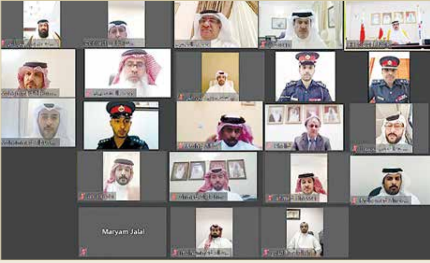
سمو محافظ الجنوبية يلتقي أهالي عسكر وجو والدور

خليفة الصحي وصالة أهالي الدور. وتابع سموه آخر المستجندات في مناطق المحافظة، منوهاً بأهمية تنمية وتطوير المرافق العامة والخدمية، بالتعاون مع الجهات المعنية حتى تتحقق التنمية الشاملة في مختلف المجالات الأمنية والخدمية والاجتماعية.