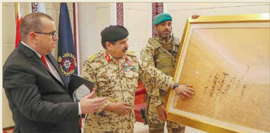
المنامة - بنا

♦ جلالته يثني على الجهود الطيبة لمؤسس "دبلوماسية بروتوكول"