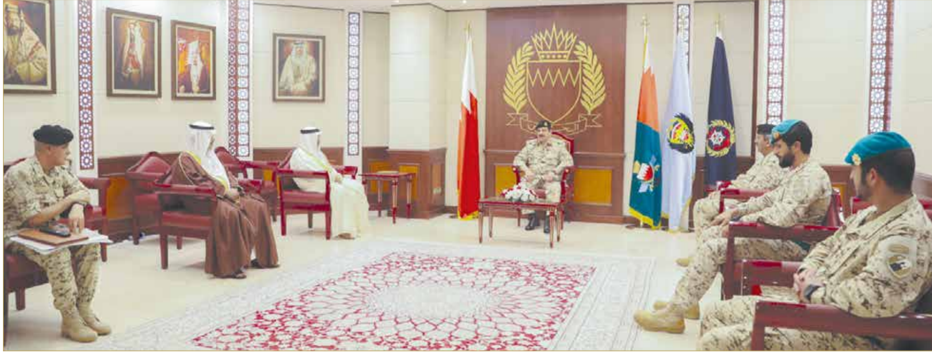
المنامة - بنا

♦ جلالة الملك يؤكد أهمية تعزيز كل مساعي الدعم لذوي الدخل المحدود