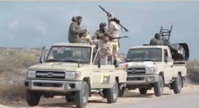
الجيش الليبي: تركيا تحشد 10 آلاف من المرتزقة وسنصد أي هجوم

وأكد الأمين العام أحمد أبو الغيط، أنه لا يمكن للجامعة القبول بأن تكون ليبيا مسرحا للتدخلات العسكرية الأجنبية أو منفذا لتحقيق أجندات خارجية أو أطماع إقليمية في إحدى دولها الأعضاء، مشددا على أن هناك التزاما عربيا مطلقا بالحفاظ على سيادة واستقلال الدولة الليبية وسلامة أراضيها ووحدةها. وقال في مقابلة مع وكالة أنباء الشرق الأوسط: لا أحد يرغب في تكرار السيناريو السوري في ليبيا. وأضاف: الجامعة العربية لا يمكن أن