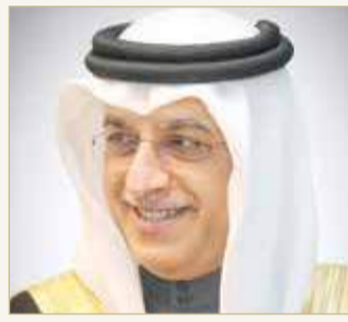
سلمان بن إبراهيم

وأكد معالي الشيخ سلمان بن إبراهيم آل خليفة أن المرسوم الملكي يضاف إلى سلسلة المنجزات المتوالية