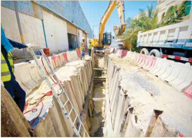
المرحلة الأولى من مشروع السهلة