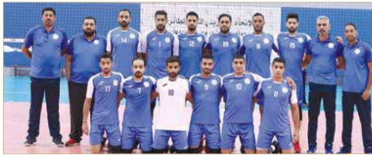
فريق طائرة عالي