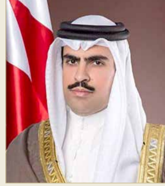
الشيخ عبدالله بن راشد

تسجل البحرين، نمواً في الناتج المحلي الإجمالي الحقيقي بنسبة 3 % العام 2021، وأن ينتعش اقتصاد دول الجوار أيضاً، وبالتالي نأمل أن نرى المنطقة ككل في وضع أفضل في المستقبل. قامت البحرين ودول الجوار بخفض الإنفاق الحكومي بنسبة 30 % للمساعدة على تجاوز الأزمة، وستقوم أيضاً بإعادة جدولة بعض مشاريع البناء والاستشارات لعدم تجاوز ميزانية المصروفات لعام 2020 وإفساح المجال لاحتياجات الإنفاق الأخرى. بشكل أساسي، نحن نتطلع لما هو أفضل في العام المقبل.