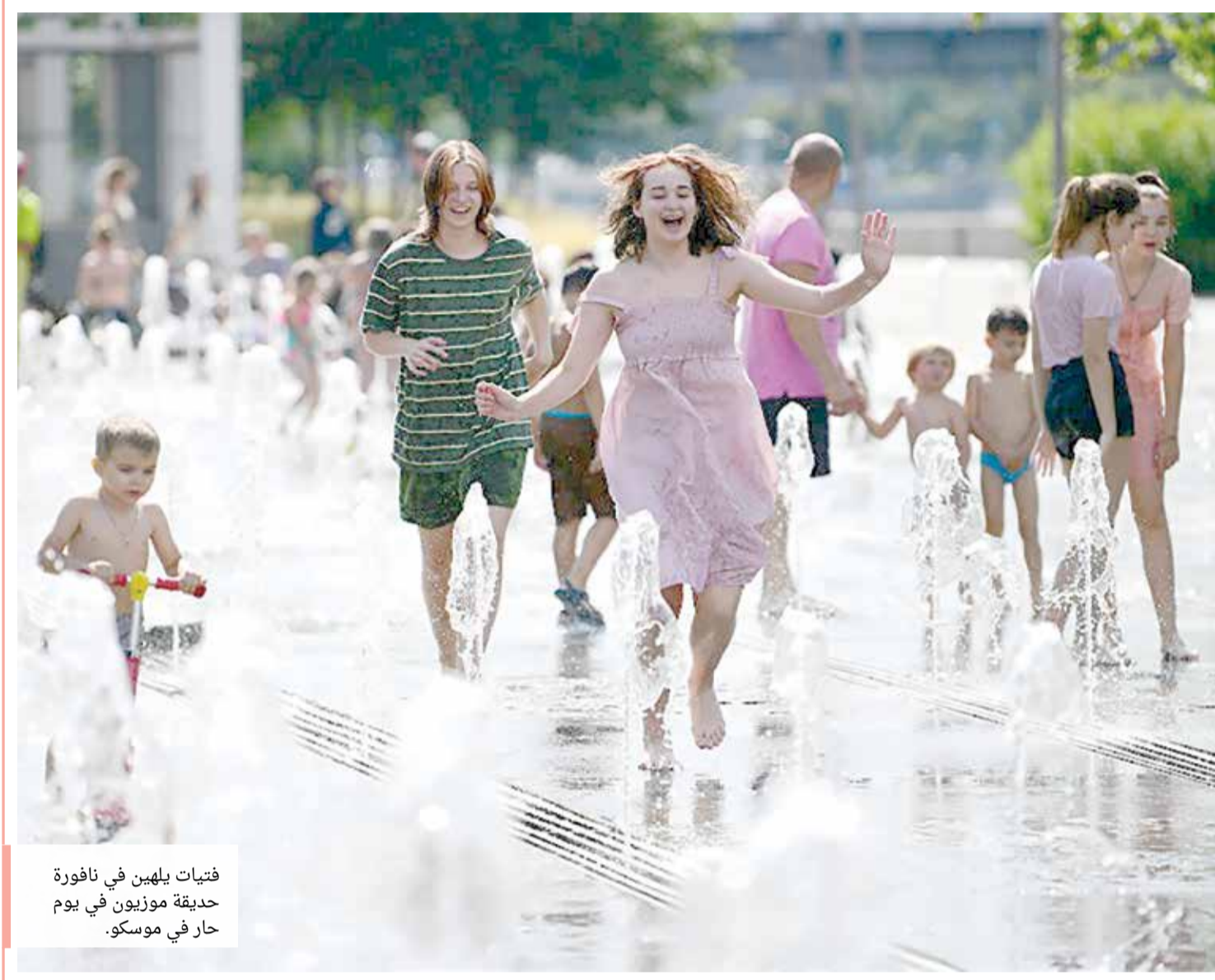
فتيات يلهين في نافورة حديقة موزيون في يوم حار في موسكو.

إدارة التحرير: +973 17111444 / +973 17111467 / 385 Local @albiladpress.com / 2008 تصدر عن دار البلاد للصحافة والنشر والتوزيع • س.ت 67133 • تطبع في مؤسسة الأبرام للنشر • قسم الإعلانات: 508 / +973 17111501 / +973 32224492 / 39615645 / +973 17111432 / +973 17111434