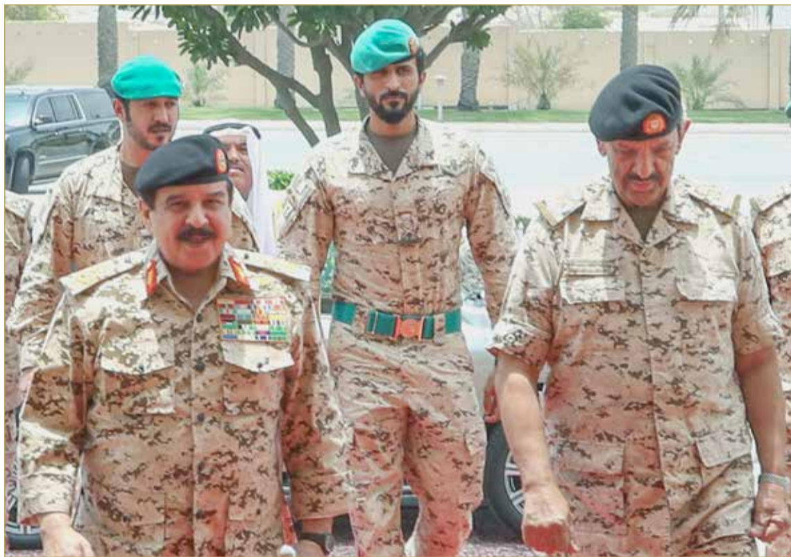
جلالة الملك في زيارة للقيادة العامة لقوة دفاع البحرين أمس