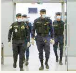
عناصر من الشرطة الكويتية

وكان أفراد العصا يجتمعون بأحد "الشاليهات" في منطقة "بنيدر"، وبعد أخذ الإجراءات القانونية، تمت مدهامته قبل 3 أيام أيام، وعقب ذلك، اعتقل 5 أفراد من بينهم مواطنان و3 مقيمين. وأوردت الصحيفة أن عددا من مشاهير المنصات الاجتماعية في الكويت جرى استدعاؤهم، نظرا إلى علاقتهم بالحساب الذي يروج سيارات فارهة. وخلال العملية الأمنية، تم العثور على سيارات فارهة وساعات ثمينة وكمية من المشروبات الكحولية المستوردة من الخارج.