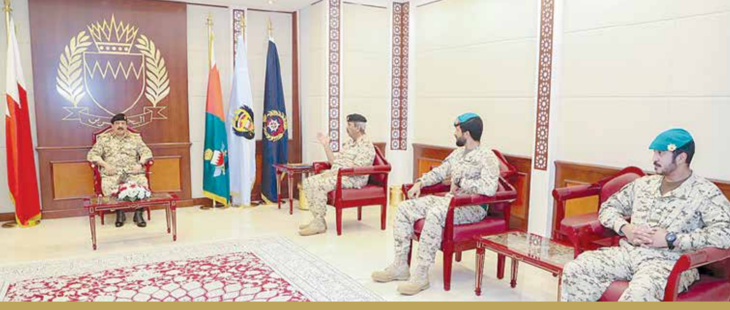
جلالة الملك يزور القيادة العامة لقوة الدفاع