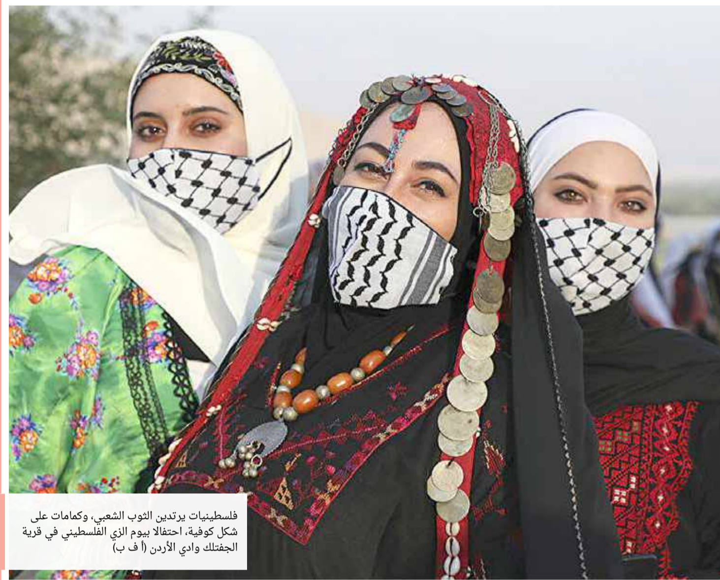
فلسطينيات يرتدين الثوب الشعبي، وكمامات على شكل كوفية، احتفالا بيوم الزي الفلسطيني في قرية الجفلك وادي الأردن (أ ف ب)

وعلمت عليه بالقول: "شأن عائلي ملكي في غابة غير، وثقها زوبين أشارا". وطالبت الصفحة متابعيها بوضع سماعات الأذن أو رفع الصوت، للاستماع لزئير اللبوة الغاضبة. وانتشرت موجة من السخرية على تويتر عقب نشر الفيديو الذي بلغت مدته 22 ثانية، وحصد نحو 170 ألف مشاهدة في غضون 9 ساعات. وقال مستخدم يدعى رامكريشان: "حياة كل زوج عندما يقرر أن يخوض في شجار دون منطق". فيما قالت مستخدمة أخرى تدعى فالقوني: "الإثا يرأن دوما، سواء كن من البشر أو الحيوانات".