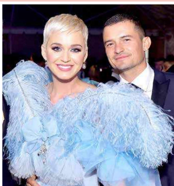
أجلت المغنية الأمريكية كاتي بيري حفل زفافها من الممثل البريطاني أورلاندو بلوم مرة أخرى. وكان من المتوقع أن يتزوج العريس في الشتاء الماضي باليابان، لكنهما أجلا الحفل إلى هذا الصيف. وكان على العريسين تأجيل الزفاف مرة ثانية إثر تفشي فيروس كورونا وانتشارهما ولادة طفلها الأول.

كشفت مجموعة من الباحثين المختصين بعلوم الفضاء والنجوم عن تحركات غريبة لأسراب من النجوم في مجرة درب التبانة، تدل على حدوث "معركة كونية" في الماضي السحيق. وبحسب العلماء فإن هذه النجوم تتحرك بطريقة غريبة مخالفة لحركة النجوم الأخرى في مجرة "درب التبانة"، بينما تدور جميع النجوم حول مركز مجرة درب التبانة، فإن هذه النجوم المارقة، كما أطلق عليها العلماء، تدور حول بعضها البعض بشكل حلزوني متعرج أصبح أكثر تشابهاً في الفترات الأخيرة. وقالت الباحثة في معهد علوم الكون (ICCUB) التابع لجامعة برشلونة، تيريزا أنتوجا، "لقد لاحظنا هذه التحركات المريبة".