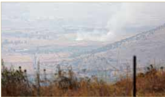
دخان يتصاعد فوق منطقة مزارع شبعا المحتلة

ذكرت مصادر لبنانية وإسرائيلية أن "حزب الله" اللبناني نفذ أمس الاثنين هجوماً استهدف الجيش الإسرائيلي في منطقة مزارع شبعا الحدودية. ونقلت وكالة "رويترز" عن "مصادر لبنانية مطلعة" أن "حزب الله نفذ عملية ضد الجيش الإسرائيلي في منطقة مزارع شبعا على الحدود مع إسرائيل". وذكرت أن "حزب الله أطلق صاروخاً موجهاً على آلية إسرائيلية"، موضحة أن "العملية جاءت رداً على هجوم إسرائيلي قتل فيه عضو في الجماعة في سوريا الأسبوع الماضي".