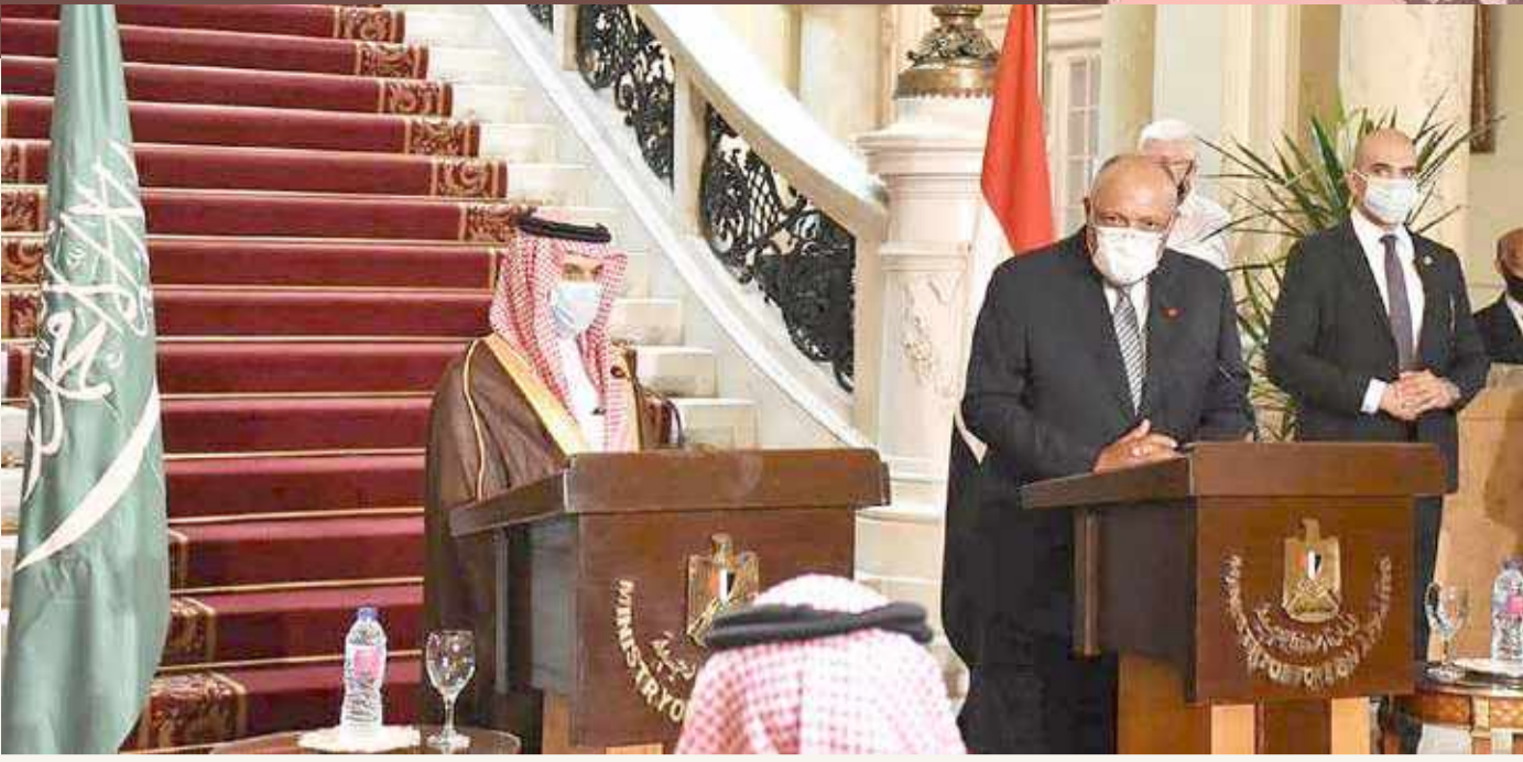
المؤتمر الصحافي المشترك لوزير الخارجية المصري ونظيره السعودي

international@albiladpress.com 10 البلاد