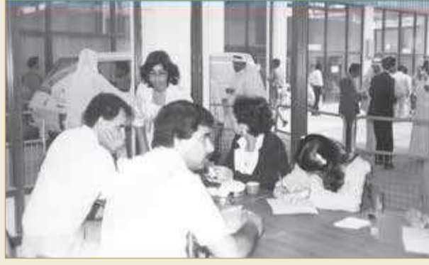
صورة توضح عمل المرأة في القطاع التجاري في السبعينات