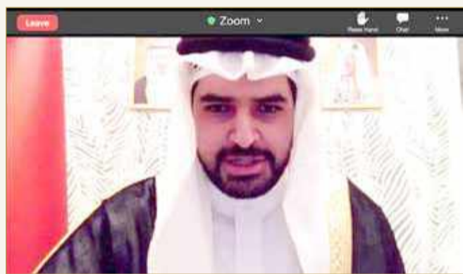
سمو الشيخ عيسى بن علي يلقي كلمته

برعاية كريمة من وكيل وزارة شؤون مجلس الوزراء سمو الشيخ عيسى بن علي آل خليفة، أقيم مساء أمس، الملتقى العربي الافتراضي الأول من نوعه لتطوير الذات تحت شعار “العودة إلى الداخل”، بتنظيم من