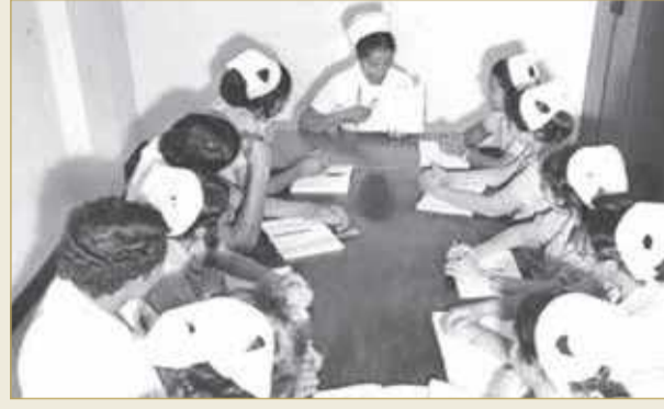
تدريب الممرضات في مستشفى السلمانية العام 1977