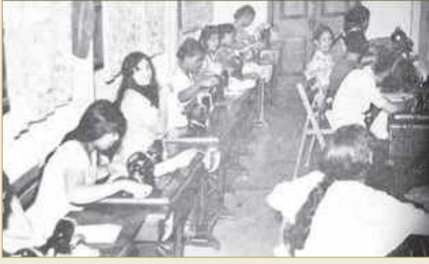
أحد صفوف تعليم الخياطة في السبعينات

ضمن تقارير تسرد فصول كتاب "المرأة البحرينية والتعليم"