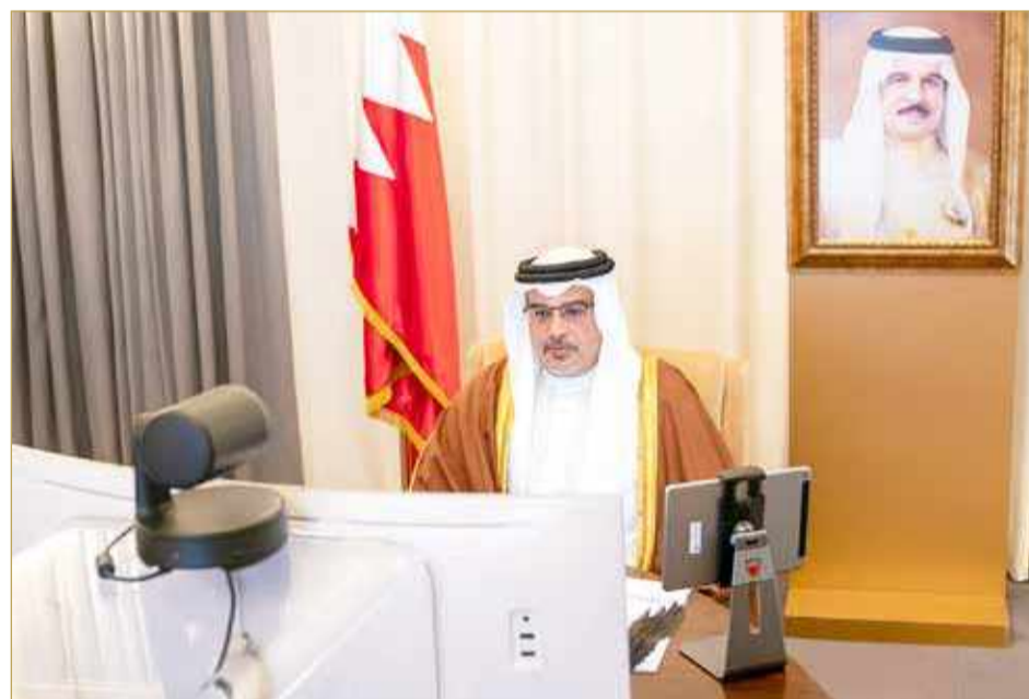
سمو ولي العهد يترأس الاجتماع الأسبوعي لمجلس الوزراء

وجه ولي العهد نائب القائد الأعلى النائب الأول لرئيس مجلس الوزراء صاحب السمو الملكي الأمير سلمان بن حمد آل خليفة وزارة التربية والتعليم لاتخاذ كافة الإجراءات والاستعدادات للعام الدراسي 2021 / 2020 في المدارس الحكومية والخاصة، على أن يترك الخيار لأولياء الأمور في حضور أبنائهم الطلبة والطالبات إلى المدارس أو تلقي التعليم عن بعد، وأن تتخذ الوزارة كل الاستعدادات التي تكفل التحصيل العلمي في بيئة مدرسية مناسبة عند تطبيق الخيارين أعلاه. وكان سموه قد ترأس الاجتماع الاعتيادي الأسبوعي لمجلس الوزراء. وأهاب مجلس الوزراء بالمواطنين والمقيمين الكرام بالالتزام بالتعليمات والإرشادات الصحية خصوصاً التقيد بإجراءات التباعد الاجتماعي والابتعاد قدر الإمكان عن التجمعات خلال عيد الأضحى المبارك لمقتضيات الظروف الحالية وما تستوجبه من إجراءات لتجنب ارتفاع الحالات والتقليل من انتشار فيروس كورونا (كوفيد 19).