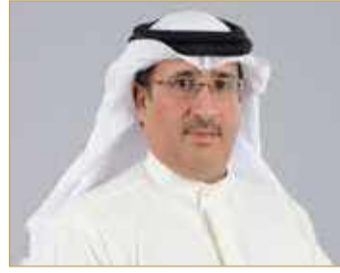
الشيخ محمد بن عيسى

استفادة 1914 صالوناً و393 مطعمًا ومقهى و346 مكتبا للسفر و205 ناديا وصالة بالمرحلة الثالثة