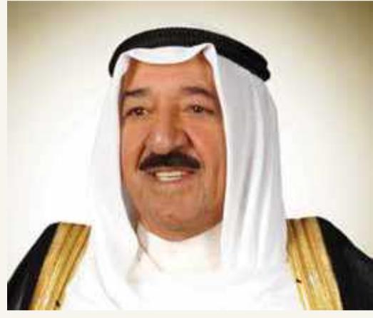
سمو أمير دولة الكويت