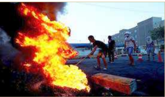
جانب من التظاهرات بالقرب من ساحة التحرير في بغداد