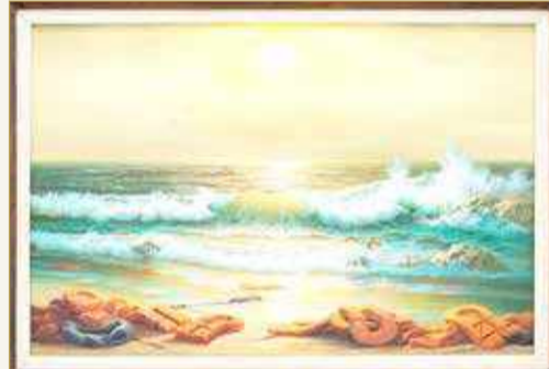
"مشهد البحر الأبيض المتوسط لعام 2017"

رئيس الفن المعاصر الأوروبي في سوئي: "هذه اللوحة الثلاثية معلقة في معارض سوئي إلى جانب أعمال بعض أعظم رسامي المناظر الطبيعية في التاريخ، بما في ذلك بيلوتو وفان جوين وتورنر". سوف تذهب عائدات بيع العمل (مشهد البحر الأبيض المتوسط لعام 2017) نحو بناء وحدة للسكنة الدماغية الحادة ومعدات إعادة تأهيل الأطفال لمستشفى جمعية بيت لحم العربية لإعادة التأهيل (BASR) في بيت لحم.