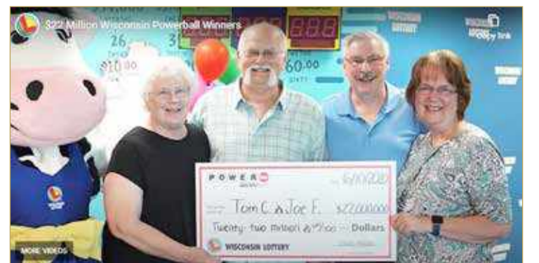
لا توجد لدى الفائزين أي خطط للترحم من وراء هذا المبلغ سوى إنفاقه للاستمتاع بسنوات تقاعدهما