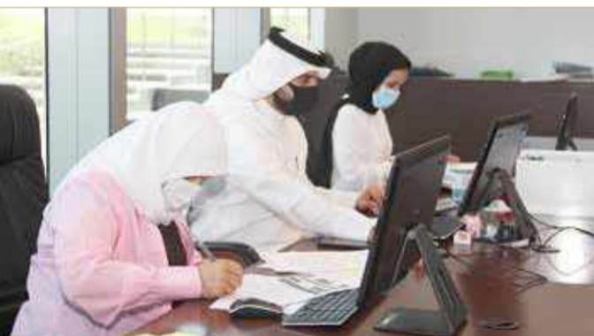
جانب من جلسة المناقصات أمس

6 مناقصات لمركز الرعاية للإقامة الطويلة في المحرق