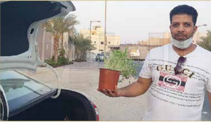
مواطن ابتاع مجموعة لأطفاله

كما ورد في التراث، إذ يتم سقايتها والاعتناء بها قبل رميها في البحر، وعادة ما يردد الأطفال في البحرين والخليج أهازيج معروفة ومشاركة من قبيل "حيه بيه.. راحت حيه.. ويات حيه.. ويضيف عليها أهل البحرين "على درب لحنيبة.. غذيناك وعشيناك ويوم العيد في البحر رميناك.. لا تدعين علي.. حلييني يا حيتي"، ويكتفي بعض الأطفال بترديد عبارة "مع السلامة يا حيتي". ووفق المرويات الشعبية، فإن معنى "الحية