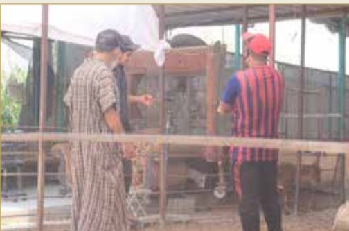
الباعة فرحون والغنم حزني