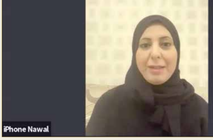
مجلس النفيعي يناقش قصص نجاح التعليم عن بعد بالبحرين

وعن الورش التدريبية التي تم تنفيذها في المدارس عن بعد، قالت "خلال شهر مارس-مايو (502) برنامج، خلال شهر يونيو (149) برنامجاً، في حين تم تدريب (4865) متدرباً خلال شهر مارس-مايو، و(2204) خلال شهر يونيو".