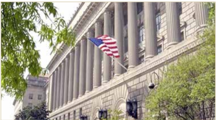
واشنطن - وكالات

◆ أكبر اقتصاد عالمي يسجل انكماشاً بالربع الثاني 2020