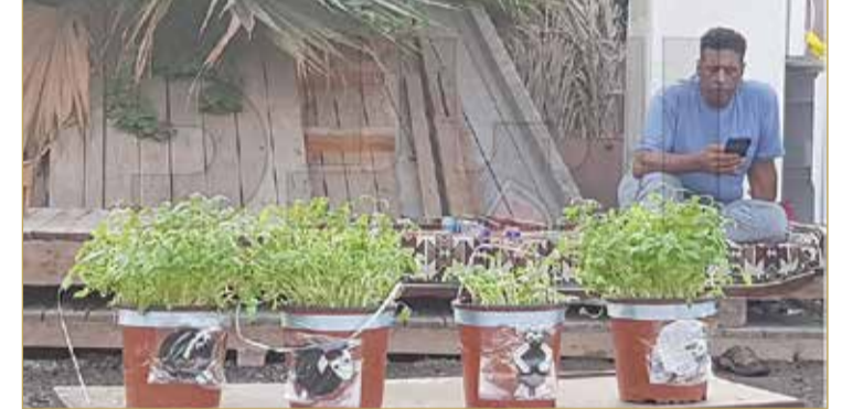
باقي البقية وبالتأكيد لها من يبحث عنها