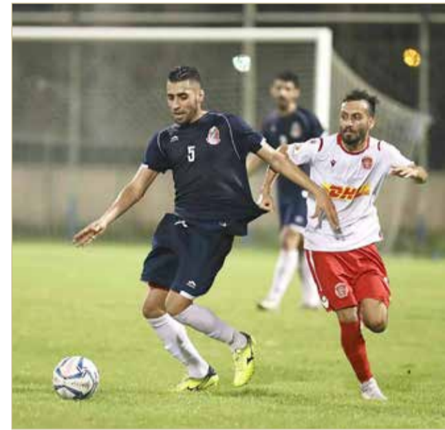
من مباراة الشباب والمحرق