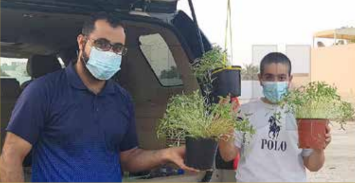
شباب أكملوا البيع ولم يتبق إلا القليل