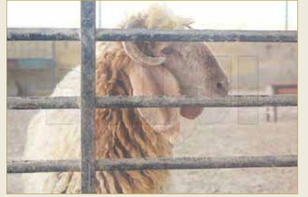
رجاء لا تصوري تراني حزين ومالي مزاج