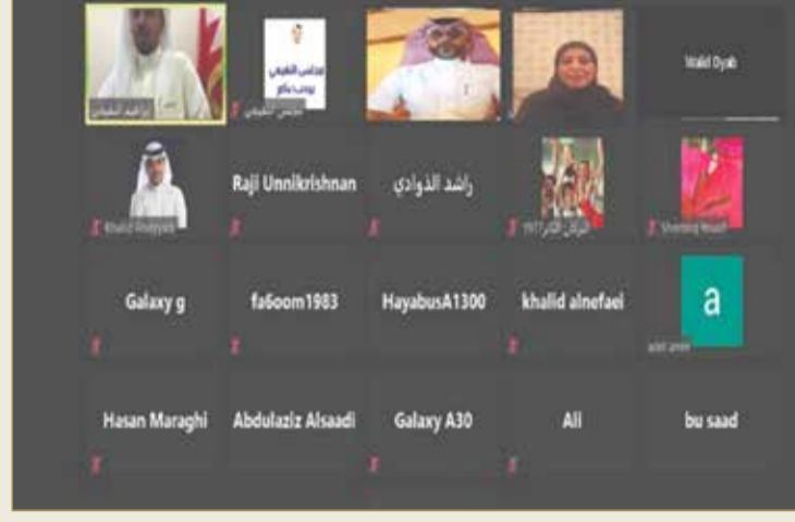
الفصول الافتراضية نجحت بتوفير بيئة تعليمية تفاعلية على شبكة الإنترنت

وعن مستخدمو البوابة التعليمي أوضحت "تشمل الخدمات التعليمية وهي الجدول الدراسي، وجدول الامتحانات، والدرجات، والحضور اليومي، والرسائل والتنبيهات، والمحتوى التعليمي الرقمي، والمواد الدراسية، والدروس، والأثرعات، والأنشطة والتطبيقات، وحلقات النقاش، وحساب ميكروسوفت 365".