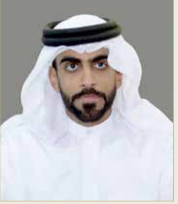
الشيخ خالد بن راشد بن عبدالله

"إسلاميات" و"سداد" وبالإمكان تحميلهما والتبرع بأي مبلغ دون تحديد تفاصيل الشخص المتبرع، كما توفر الخدمة التبرع بالمبالغ بناءً على حالات حرجية يتم إدراجها في التطبيق لكي يتم جمع مبلغ مالي معين لكل حالة حسب المبلغ المترتب، علماً أنه يتم إقرار الحالات، بحسب الضوابط والاشتراطات لمستحقيها من قبل لجنة "فاعل خير".