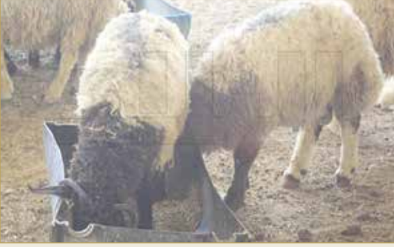
نصيحة لا تاكل وتسمن روحك يا الخروف خلك ضرعوك