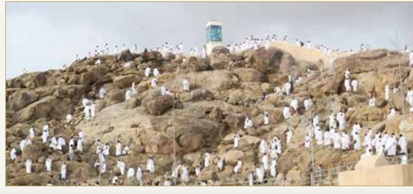
الحجيج يؤدون المناسك عند جبل الرحمة بمشعر عرفات أمس الخميس

مع غروب شمس أمس، بدأ حجاج بيت الله الحرام، النفرة من صعيد عرفات على أفواج وفق البروتوكولات الصحية متوجهين إلى مشعر المزدلفة لقضاء ليلتهم استعداداً ليوم النحر أول أيام عيد الأضحى المبارك. وأشادت منظمة الصحة العالمية، أمس، بالإجراءات التي اتخذتها السعودية لحماية الحجاج.