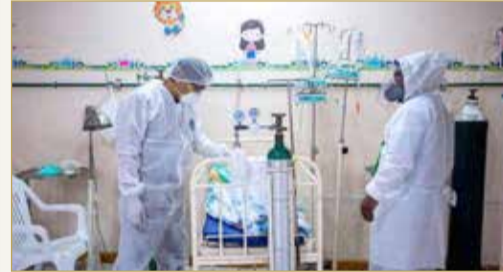
ثلث الأطفال في أنحاء العالم لديهم مستويات مرتفعة من الرصاص

التي لا لبس فيها لهذا البحث هي أن الرصاص يسمم الأطفال في أنحاء العالم على نطاق هائل ولم يتم التعرف عليه من قبل، حسبما نقلت "رويترز". وأشار التقرير إلى مجموعة واسعة من العوامل المسؤولة عن المستويات المرتفعة من الرصاص في دم الأطفال منها التخلص غير الملائم من بطاريات الرصاص الحمضية والبيوت المطلية بالرصاص ومستودعات النفايات الإلكترونية المطلية بالرصاص والأغذية الملوثة بسبب الأواني الخزفية المطلية بالرصاص.