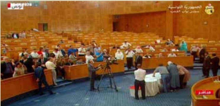
من عملية فرز الأصوات بالبرلمان التونسي