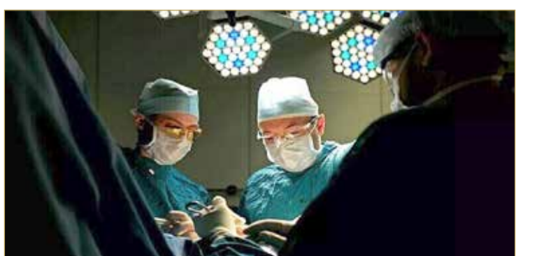
يشير الأطباء إلى أن قلة النوم، وكذلك زيادته، تزيد من خطر النوبات القلبية، لذلك ينصحون بضرورة النوم ما لا يقل عن 6 ساعات في اليوم.

كادت فتاة صينية تعاني من مشكلات في القلب، أن تفارق الحياة، ولكنها بفضل جهود الأطباء، ظلت واعية على الرغم من توقف قلبها عن النبض، وبقيت على قيد الحياة. وفقاً لصحيفة "جلوبال تايمز"، وقعت الحادثة في مدينة شيان بمقاطعة شينسي، حيث بدأت مشكلات القلب عند هذه الفتاة بسبب عدم النوم عدة ليال، إضافة إلى إصابتها بالبرد قبل أيام من نقلها إلى المستشفى، جراء التهاب عضلة القلب، الذي يتطور بسرعة وفي لحظة