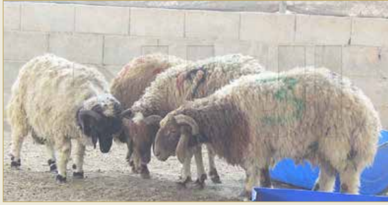
الشور شورك يا الكبير.. عجل نقول ما في ذباح بسبب كورونا ها