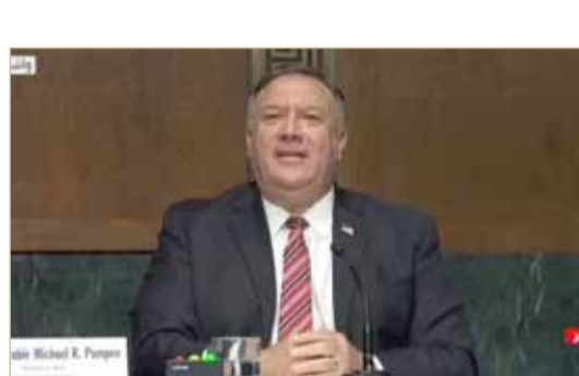
بومبيو في شهادته أمام الكونغرس الأميركي