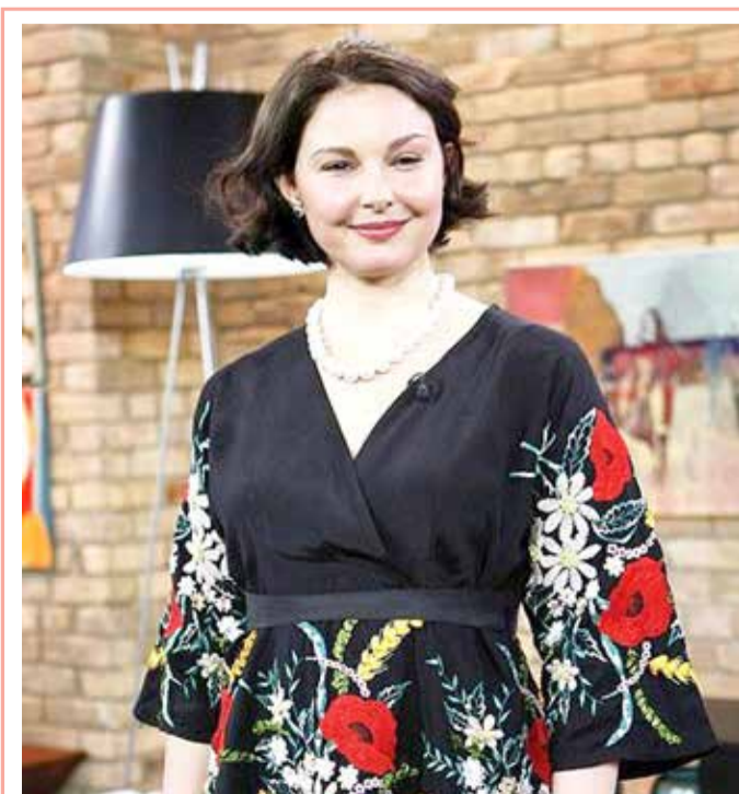
أعدت محكمة استئناف اتحادية فتح دعوى قضائية، أقامتها الممثلة الأميركية أشلي جود لاتهام المنتج السينمائي السابق هارفي واينستين بالتحرش الجنسي بها، قائلة إنه يمكن لوجود مقاضاته بموجب قانون ولاية كاليفورنيا في اتهامات بأنه حاول دعم مسيرتها الفنية مقابل عروض جنسية.

تم اكتشاف مقبرة قديمة تعود إلى عهد أسرة تانغ (618-907) في محافظة فوشنغ بمقاطعة خبي في شمالي الصين. وتم اكتشاف أكثر من 20 قطعة من الآثار الثقافية من المقبرة، بما في ذلك وعاء خزفي أبيض وفخار مزجج ثلاثي الألوان ومرآة برونزية وثور يمشي وأرنب خزفي ووعاء فخاري أحمر ومئات العملات المعدنية النحاسية المكتوب عليها "كايبوان تونغباو". وتشير تصميمات وهيكل بناء المقبرة وآثار الفخار الأحمر والعملات النحاسية ذات علامات "كايبوان تونغباو" جميعها إلى عهد أسرة تانغ المتوسطة والمتأخر، الذي يعود تاريخها إلى أكثر من 1000 عام.