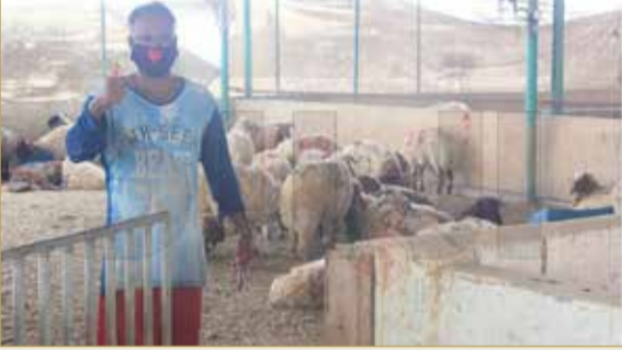
لا مهرب من يد بهاء الدين