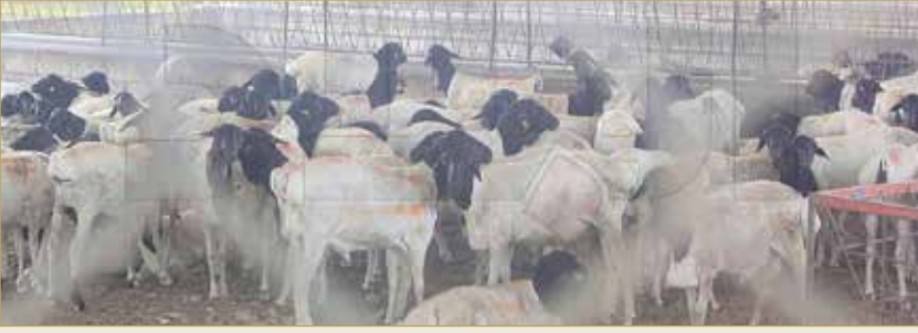
جاي بصورنا حق الشمانة يا الربع