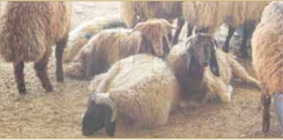
لا تبجي ما في فائدة راح الريح والوداع يوم العيد

الغالب على الإقبال هو على الخرفان النعيمية والصومالية، فالأولى أسعارها لدينا بين 145 إلى 170 والثانية بين 55 إلى 60 دينارًا. أما الأبقار، فبأسعارها بين 450 إلى 700، وبالنسبة لي، لا أجد تأثيرًا لكورونا على السوق في مثل هذا الموسم.