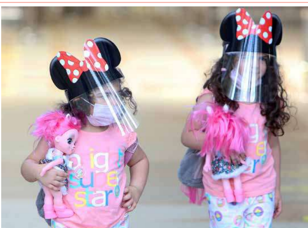
طفلتان، ترتديان أقنعة الوجه للحماية من فيروس كورونا المستجد وتحملان العايمها، أثناء سفرهما مع أسرتهما من مطار الكويت الدولي في محافظة الفروانية، على بعد نحو 15 كيلومترا جنوبي مدينة الكويت، حيث استؤنفت الرحلات الجوية التجارية يوم أمس بعد أشهر من الإغلاق بسبب وباء "كوفيد 19" (أ ف ب)