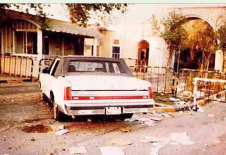
سيارة الشهيد وتظهر بالقرب منها بقعة الدم

« نقرأون في حلقة الغد: “البحرين تفتح أحضانها للاشقاء!”