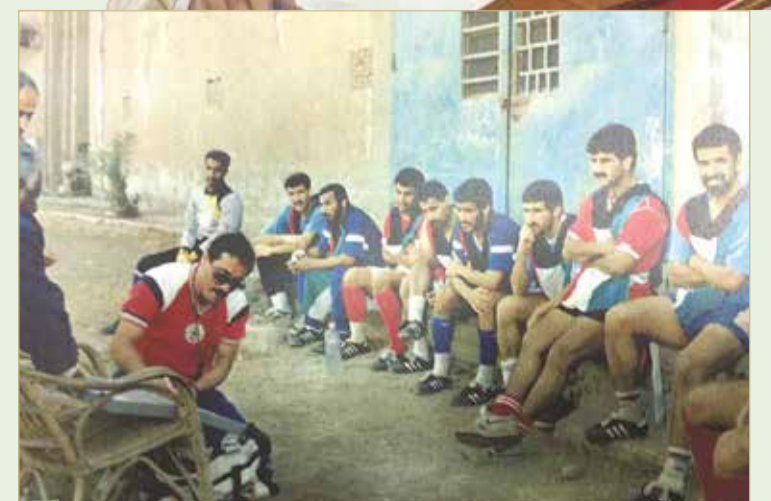
مجموعة من رياضي الكويت في القاهرة ابان الغزو