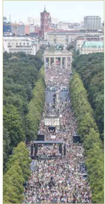
الآلاف يتظاهرون في شوارع العاصمة الألمانية برلين أمس

برلين - أ ف ب تظاهر آلاف الأشخاص المناهضين للتدابير التي تحد من الحريات الفردية لمكافحة وباء "كوفيد 19"، بشكل سلمي بعد ظهر أمس وسط برلين، مرددين هتافات "تسقط الأقنعة"، "لا تلتقي إجباريا" أو "عودة الحريات".