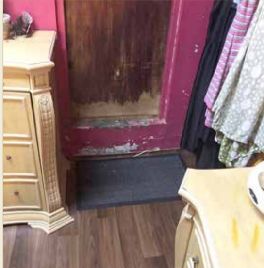
غرفة يتكدس فيها كثيرون

وقال: نتمنى أن نحصل على بيت قريب؛ تعبنا من الانتظار في بيت قديم رمنناه قد ما نقدر والله المستعان وإن شاء الله ما يطيح على رؤوسنا".