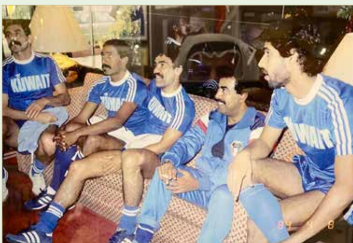
الشهيد مع لاعبي منتخب الكويت