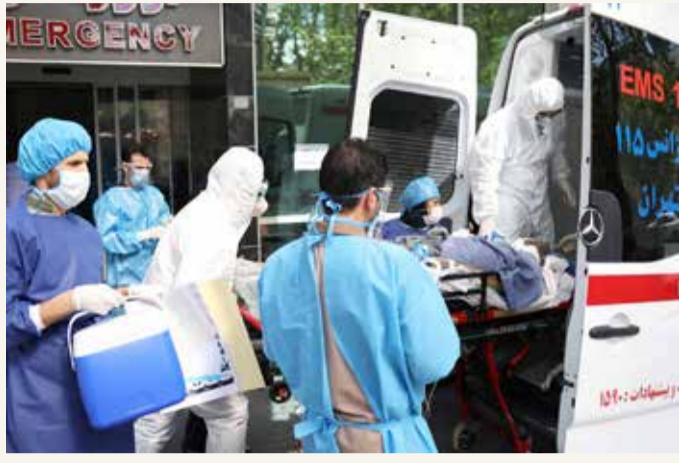
600 شخص يدخلون المستشفى في طهران كل يوم

وكان مركز أبحاث البرلمان الإيراني قد ذكر من قبل أن عدد ضحايا كورونا في إيران ضعف العدد المعلن من قبل وزارة الصحة.