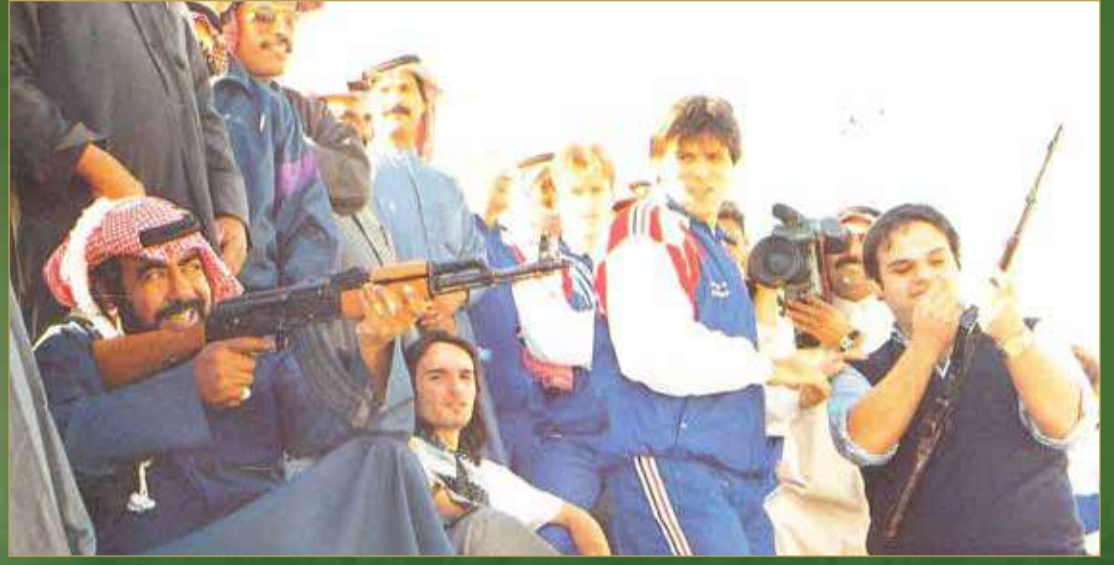
الفهد يمارس هواية القنص