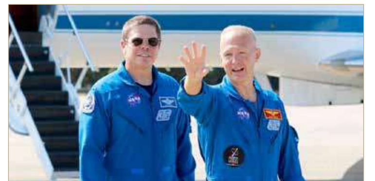
رائدا الفضاء بوب بينكن (إلى اليسار) ودوج هيرلي في مركز كينيدي بفلوريدا يوم 20 مايو

من المقرر أن يعود رائدا فضاء تابعين لإدارة الطيران والفضاء الأمريكية (ناسا) إلى الأرض اليوم الأحد بعد أن وصلا إلى محطة الفضاء الدولية على متن الكبسولة كرو دراغون الجديدة المملوكة لشركة سيسيس إكس، وذلك بعد رحلة استغرقت نحو 4 أشهر وكانت أول مهمة لناسا انطلاقا من الأراضي الأميركية منذ 9 سنوات.