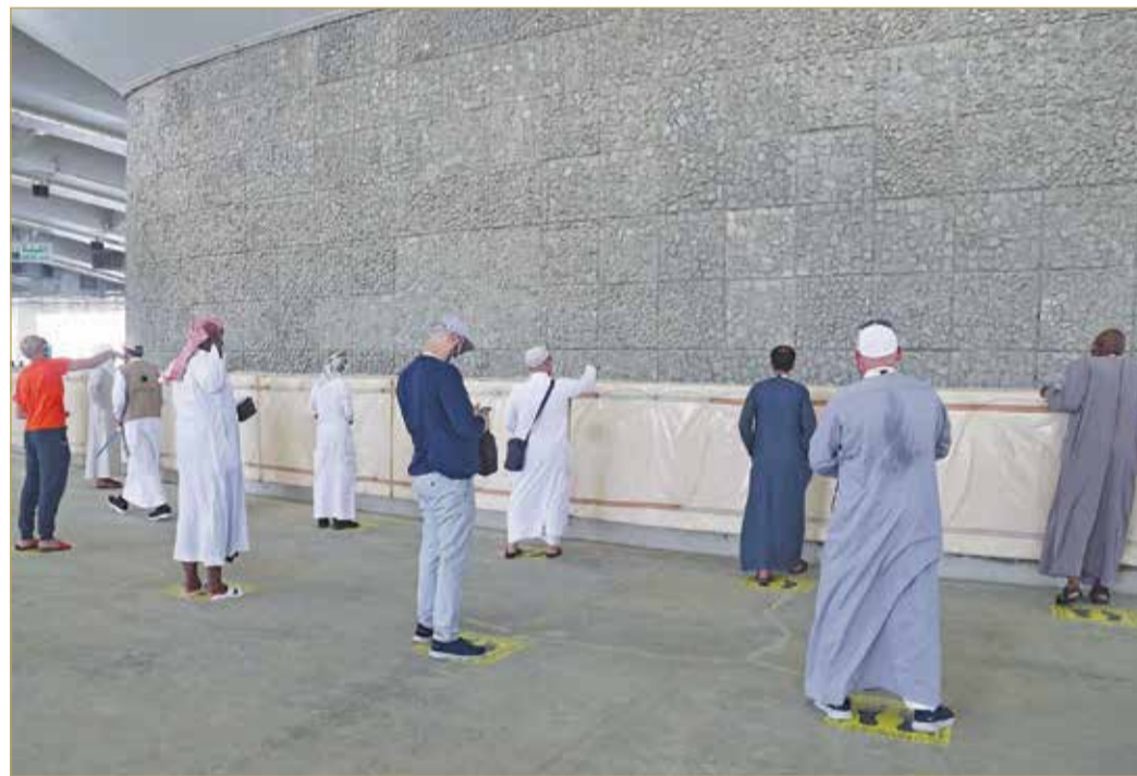
الحجاج يقفون على مسافات آمنة أثناء رمي الجمرات أمس

بعث عاهل البلاد صاحب الجلالة الملك حمد بن عيسى آل خليفة ورئيس الوزراء صاحب السمو الملكي الأمير خليفة بن سلمان آل خليفة وولي العهد نائب القائد الأعلى النائب الأول لرئيس مجلس الوزراء صاحب السمو الملكي الأمير سلمان بن حمد آل خليفة، بقرقيات تهنيئة إلى ملك المملكة العربية السعودية الشقيقة خادم الحرمين الشريفين الملك سلمان بن عبدالعزيز آل سعود، أعربوا فيها عن خالص تهنيتهم على التنظيم الدقيق والناجح لشعبيرة الحج هذا العام، والذي واكب ظروفًا استثنائية بسبب جائحة فيروس كورونا. ويواصل حجاج بيت الله الحرام رمي الجمرات خلال أيام التشريق الثلاثة التي بدأت أمس، في ظل تدابير وقائية مشددة، ويبيت الحجاج في منى استعداداً لأداء طواف الوداع اليوم الأحد، ثم العودة مرة أخرى لمسكن الحجاج في مكة المكرمة. (02 و 11)