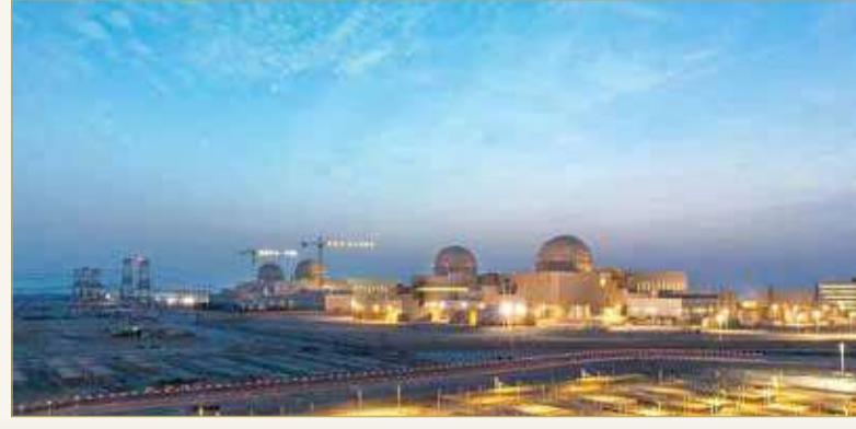
محطات بركة للطاقة النووية السلمية

أعلن نائب رئيس الإمارات رئيس مجلس الوزراء حاكم دبي الشيخ محمد بن راشد، نجاح الدولة في تشغيل أول مفاعل سلمي للطاقة النووية في العالم العربي، في محطات بركة للطاقة النووية بأبوظبي. وقال الشيخ محمد بن راشد في تغريدات بحسابه على "تويتر"، أمس: "نجحت فرق العمل في تحميل حزم الوقود النووي وإجراء اختبارات شاملة وإتمام عملية التشغيل بنجاح. أبارك لأخي محمد بن زايد هذا الإنجاز". (11)