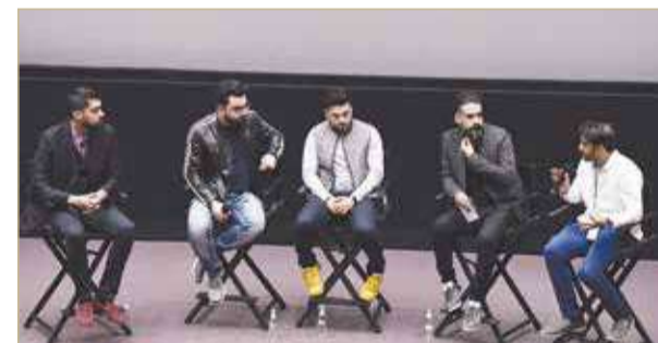
من أعمال الدورة السابقة