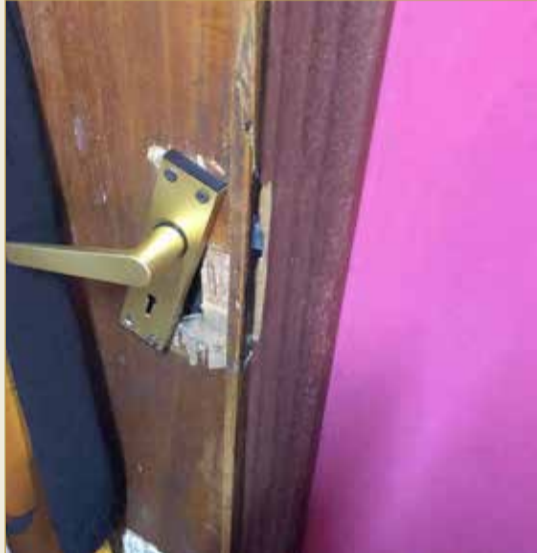
باب خارج الخدمة

عن طلبي الاسكاني علما بأني أتيت والعائلة من شهر مارس 2019 وإلى الان مازال الطلب الاسكاني مجمدا".