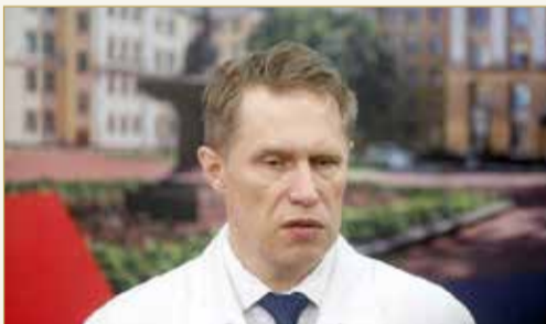
وزير الصحة الروسي ميخائيل موراشكو

العلم والسلامة. وكان كيريل ديمترييف رئيس صندوق الاستثمار المباشر الروسي قد شبه ما وصفه بنجاح روسيا في تطوير لقاح بإطلاق الاتحاد السوفيتي للقمر الصناعي سبوتنك 1 العام 1957 ليصبح أول قمر صناعي في العالم. ويجري تطوير أكثر من 100 لقاح محتمل على مستوى العالم سعيا لوقف جائحة "كوفيد 19".