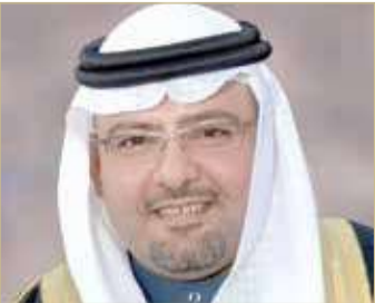
الشيخ خالد بن علي

وقال "إن النجاح الكبير لتنظيم موسم الحج لهذا العام وسلاسة وتصعيد وتفويض الحج بين المشاعر، هو امتداد للمسيرة التاريخية المباركة للمملكة العربية السعودية الشقيقة قيادة وحكومة وشعباً في استقبال ضيوف الرحمن وحسن التنظيم لأداء مناسك هذه الشعيرة العظيمة لجميع الحجاج دون استثناء".