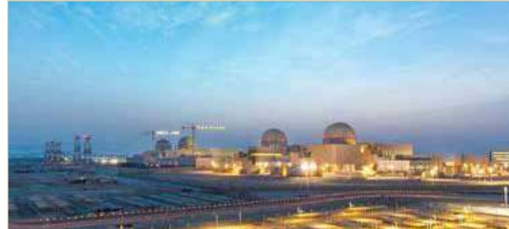
محطات بركة للطاقة النووية السلمية