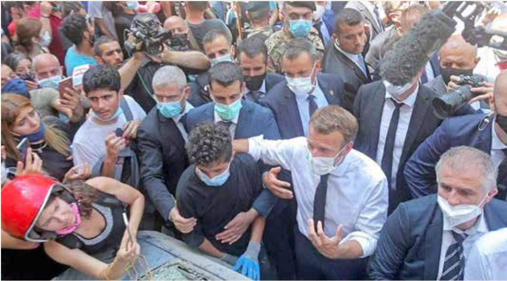
إيمانويل ماكرون في حي الجميزة ببيروت

بهتافات "الشعب يريد إسقاط النظام" و"ساعدونا"، استقبل لبنانيون الرئيس الفرنسي ايمانويل ماكرون الذي تفقد سيراً على الأقدام شارع الجميزة الأثري في شرق بيروت المتضرر بشدة جراء انفجار المرفأ قبل يومين.