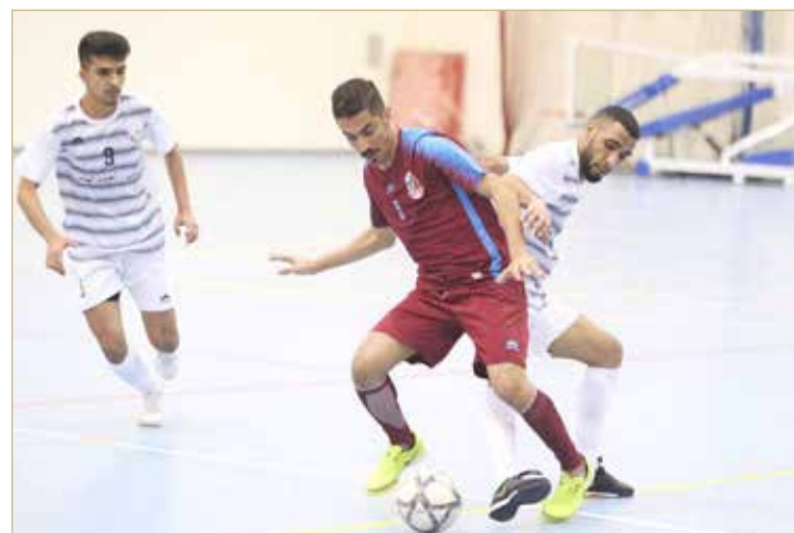
من منافسات دوري كرة الصالات