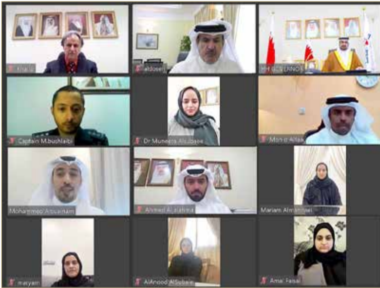
سمو محافظ الجنوبية يبدن الموقع الإلكتروني الجديد في حفل افتراضي عن بعد

◆ سمو الشيخ خليفة بن علي: جعل الاتصال مع المواطنين أكثر فاعلية