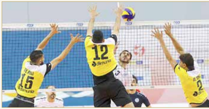
من لقاء النجمة والأهلي