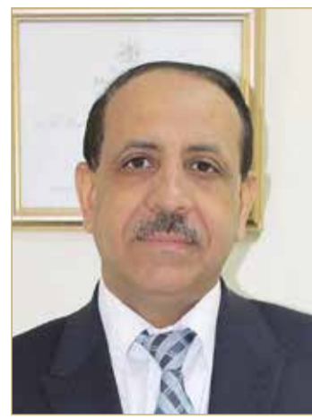
البلدي عبدالله القبيسي