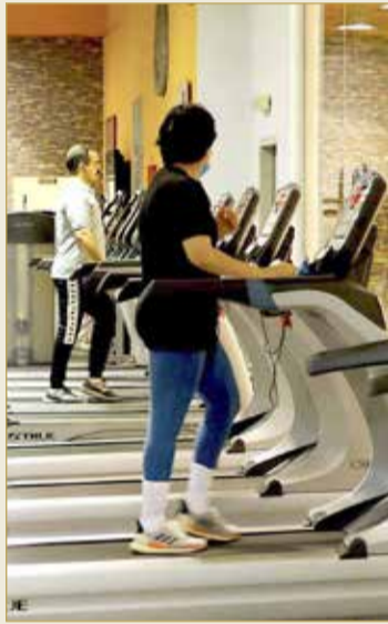
الحياة تعود لصالات التربية البدنية

بعد توقف دام حوالي أربعة شهور ونصف تقريباً بسبب وباء كورونا (كوفيد - 19) فتحت صالات التربية البدنية والصحة (الجيم) أبوابها أمام عشاق ومحبي الصحة والرياضة والتربية البدنية ولاعبي رياضي كمال الأجسام ورفع الأثقال إثر قرار اللجنة التنسيقية برئاسة سمو ولي العهد السماح لها باستئناف نشاطها ابتداء من 6 أغسطس 2020. واستقبلت صالات التربية البدنية زبائنها منذ الصباح الباكر وسط تطبيق المزيد من التدابير الاحترازية والوقائية وإجراءات التباعد الاجتماعي، مثل وجود حواجز بلاستيكية ما بين الأجهزة، واستخدام أدوات التعقيم، وإجراء عملية إخلاء الصالة على فترات متقطعة لإجراء عمليات تعقيم الأجهزة، وفحص المشاركين، والعديد من الإجراءات الصحية الأخرى الموصى بها من قبل الجهات المختصة. وتسابق أصحاب الصالات الرياضية في الترويج للإجراءات الاحترازية المطبقة لديها عبر وسائل التواصل الاجتماعي لكسب أكبر عدد من الزبائن، كما تم تعويض المشتركين عن فترة التوقف السابقة. وشهدت مملكة البحرين في الآونة الأخيرة ازدهاراً كبيراً وانتشاراً واسعاً لمراكز الصحة والتربية البدنية في مختلف مناطق المملكة في ظل الإقبال الكبير من قبل المواطنين للاشتراك في تلك ”الجيمات“ وارتفاع مستوى الوعي بأهمية الرياضة في تعزيز الصحة الجسدية والنفسية. وقدمت صحيفة البلاد بزيارة صالة مركز فليكس الرياضي، وصالة غسان، وصالة المرباطي وسط إقبال متوسط للمشاركين في أول يوم من الافتتاح.