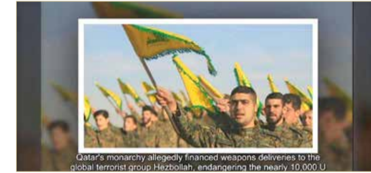
فوكس نيوز تكشف تمويل قطر شحنات أسلحة لحزب الله

ورأى أن مطالبات البرلمانيين الأوروبيين ستعزز تكتيف الضغوط على الميليشيات في القارة، بعد خطوات بريطانيا وألمانيا في هذا الاتجاه، كما رأى أنها ستساعد في حسم موقف ترامب تجاه قطر.