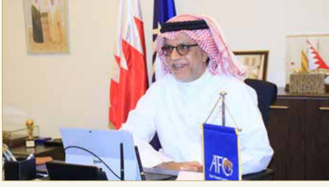
سلمان بن إبراهيم

المنامة - مكتب رئيس الاتحاد الآسيوي لكرة القدم