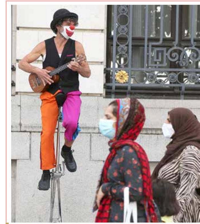
مهرج يرتدي قناعاً وقائياً أثناء تسليته للمشاة في أحد شوارع أوتوبرب، حيث تقترض السلطات البلجيكية تدابير إضافية لمحاولة الحد من انتشار فيروس كورونا

وقال القاضي المسؤول عن القضية تيان جانلين، إنه بعد مراجعة حشيات القضية لم يجدوا أي شيء يدين تشانغ أو يربطه بمقتل الطفلين.