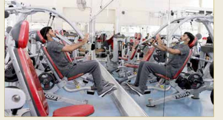
تطبيق التباعد الاجتماعي أثناء التمارين

بعد توقف دام حوالي أربعة شهور ونصف تقريباً بسبب وباء كورونا (كوفيد - 19) فتحت صالات التربية البدنية والصحة (الجيم) أبوابها أمام عشاق ومحبي الصحة والرياضة والتربية البدنية ولاعبي رياضي كمال الأجسام ورفع الأثقال إثر قرار اللجنة التنسيقية برئاسة سمو ولي العهد السماح لها باستئناف نشاطها ابتداء من 6 أغسطس 2020. واستقبلت صالات التربية البدنية زبائنها منذ الصباح الباكر وسط تطبيق المزيد من التدابير الاحترازية والوقائية وإجراءات التباعد الاجتماعي، مثل وجود حواجز بلاستيكية ما بين الأجهزة، واستخدام أدوات التعقيم، وإجراء عملية إخلاء الصالة على فترات متقطعة لإجراء عمليات تعقيم الأجهزة، وفحص المشاركين، والعديد من الإجراءات الصحية الأخرى الموصى بها من قبل الجهات المختصة.