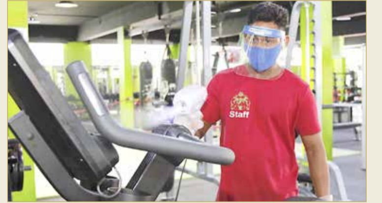
تعقيم الأجهزة الرياضية قبل استخدامها