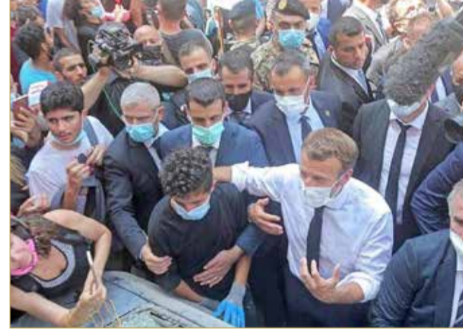
إيمانويل ماكرون في حي الحميرة ببيروت

بهاتفات "الشعب يريد إسقاط النظام" و"ساعدونا"، استقبل اللبنانيون الرئيس الفرنسي إيمانويل ماكرون الذي تفقد سيراً على الأقدام شارع الجميزة الأثري في شرق بيروت المتضرر بشدة جراء انفجار العرفاً قبل يومين. ورد ماكرون على الغضب الذي عبر عنه الحشد الصغير الذي لاقاه أثناء جولته بالحديث عن "مبادرة سياسية جديدة" سيقترحها على المسؤولين والقادة اللبنانيين. (12)