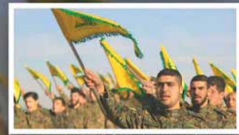
Qatar's monarchy allegedly financed weapons deliveries to the global terrorist group Hezbollah, endangering the nearly 10,000 U