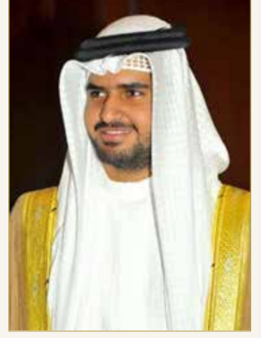
سمو الشيخ عيسى بن علي

صرح وكيل وزارة شؤون مجلس الوزراء الرئيس الفخري لجمعية الكلمة الطبية سمو الشيخ عيسى بن علي آل خليفة بأنه "تقديرًا للكوادر الماثلة في الصفوف الأمامية لمكافحة فيروس كورونا (كوفيد 19)، وما يقدمونه من تضحية وفداء وكفاءة عالية، ومسؤولية وطنية مشهودة، ومعاني سامية للمواطنة الصالحة والمخلصة، وتفان في تقديم الخدمات العلاجية والوقائية، والحملات التوعوية