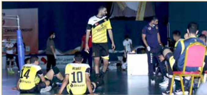
تعطل الانارة بسبب الانقطاع الكهربائي

البلاد | حسن علي