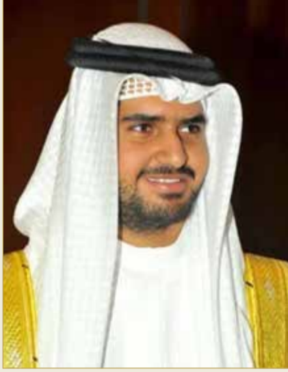
سمو الشيخ عيسى بن علي

صرح وكيل وزارة شؤون مجلس الوزراء الرئيس الفخري لجمعية الكلمة الطيبة سمو الشيخ عيسى بن علي آل خليفة بأنه "تقديرًا للكوادر الماثلة في الصفوف الأمامية لمكافحة فيروس كورونا (كوفيد 19)، وما يقدمونه من تضحية وفداء وكفاءة عالية، ومسؤولية وطنية مشهودة، ومعان سامية للمواطنة الصالحة والمخلصة، وتغان في تقديم الخدمات العلاجية والوقائية، والحملات التوعوية والإرشادية، فقد خصصنا جائزتنا للعمل التطوعي في دورتها العاشرة هذا العام لتكريم الكوادر البحرينية البارزة في الصفوف الأمامية والتي كان لها إسهامات كبيرة في التخفيف من تداعيات وآثار جائحة كورونا (كوفيد 19)".