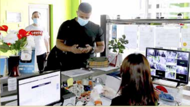
المشتركون بدأوا بالتوافد على الصالات منذ اليوم الأول