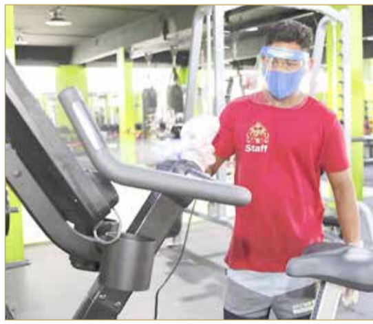
تعليم الأجهزة الرياضية قبل استخدامها

بعد توقف دام نحو 4 شهور ونصف تقريبا بسبب وباء كورونا (كوفيد -19)، فتحت صالات التربية البدنية والصحية (الجيم) أبوابها أمام عشاق ومحيي الصحة والرياضة والتربية البدنية ولاعبي رياضي كمال الأجسام ورفع الأثقال إثر قرار اللجنة التنسيقية برئاسة سمو ولي العهد السماح لها باستئناف نشاطها ابتداء مع 6 أغسطس 2020.