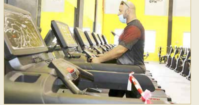
الفصل بين أجهزة المشي