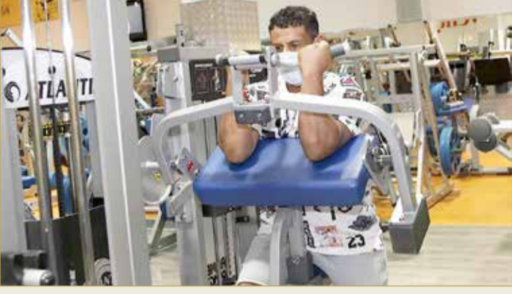
أحد المشتركين يزاول التدريبات الرياضية مرتدياً الكمامة

تطبيق التدابير الاحترازية وإجراءات التباعد الاجتماعي