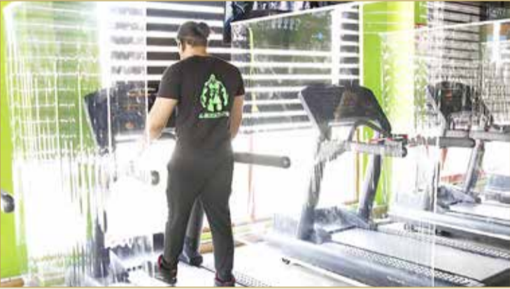
حواجز بلاستيكية بين الأجهزة