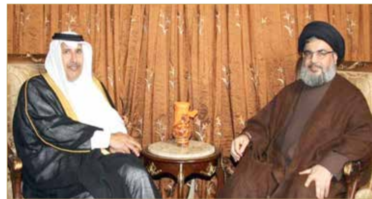
أمين عام حزب الله حسن نصرالله ورئيس وزراء قطر السابق حمد بن جاسم

تم التقاط طرف الخيط لهذه الحلقة من مسلسل التمويل القطري للجماعات الراديكالية والإرهابية حول العالم عندما تمكن عنصر استخباراتي ألماني الجنسية من زرع مقال مبيعات أسلحة وهمي كجزء من عملية شراء المعدات العسكرية في قطر لصالح حزب الله.