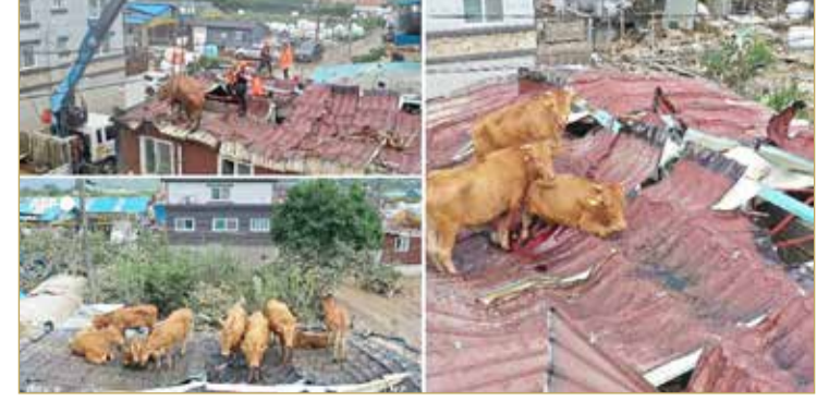
عدد الذين نجوا من الأضرار من خلال عملية الإنقاذ من سلطة الإطفاء بلغ نحو 1400 شخص خلال الأيام الأربعة الأخيرة.

علقت عشرات الأبقار على أسطح المنازل بسبب الفيضانات في كوريا الجنوبية، ما طرح تحديات كبيرة أمام فرق الإنقاذ بسبب ضخامة الكثير منها. وكانت رؤوس الماشية تطفو إلى الأعلى مع تصاعد مياه الفيضانات في مدينة غوريي الزراعية جنوبي البلاد، إلى أن بلغت بر الأمان على أسطح منازل ومبان، بحسب ما ذكرت وكالة الأنباء الفرنسية. وبلغ عدد ضحايا الفيضانات 13، بينما