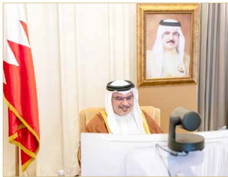
سمو ولي العهد مترسدا جلسة مجلس الوزراء أمس

◆ مجلس الوزراء: التوجيهات الملكية دعمت جهود الحكومة في محاصرة الجائحة