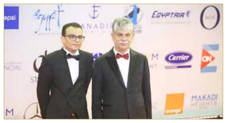
انتشال التميمي وامبر رمسيس

حالم يتورط في عملية سرقة متجر تُغرق والده، الذي تربطه به علاقة صعبة، في ديون هائلة. يقرر إبراهيم أن يسخر كل جهده من أجل أن يصلح الوضع ويستعيد احترام والده. ومن الدمارك، يتتبع "دورة ثانية" لتوماس فينتربرج، 4 أصدقاء - كلهم من معلمي المدارس الثانوية - بينما يختبرون نظرية تدعم فكرة أنهم يستطيعون تحسين حياتهم من خلال الحفاظ على مستوى معين من الشكر في جميع الأوقات. الفيلم تم اختياره ضمن الاختيارات الرسمية لمهرجان كان السينمائي، وسيشارك في الدورة الـ 68 لمهرجان سان سباستيان السينمائي الدولي. فيلم آخر مميز من صربيا يلتحق بالبرنامج، هو "واحة" لإيفان إيكيتش، وهو فيلم روائي طويل يعرض لنا لمحات من حياة الأطفال المولودين بإعاقات ذهنية، المهجورين من قبل الأهل، والكائنين بمؤسسات متخصصة. تم الإعلان عن ضم الفيلم ضمن الاختيارات الرسمية لمسابقة أيام فينيسيا السينمائية 2020. ويحكي "الصبي صائد الحيتان" (بولندا) لفيليب يوريف، قصة مغامرة تحدث لصبي يُدعى شوكتشي هانتر ليوشكا، يقع في حب فتاة جميلة رآها على