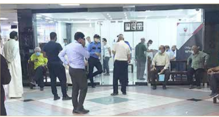
زحمة بمركز الخدمة

400 طلب يوميًا.. ومطالبة المدير السهلي بإيجاد آلية أكثر سلاسة