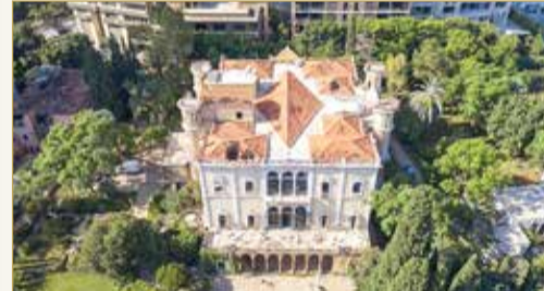
قصر سرسق... صمد أمام 3 حروب ودُمر "في لحظة"

يقول رودريك سرسق، بحسب موقع "لبنان 24": إن "مستوى الدمار الناجم عن الانفجار الهائل في مرفأ بيروت الأسبوع الماضي أسوأ 10 مرات مما فعلته 15 سنة من الحرب الأهلية".