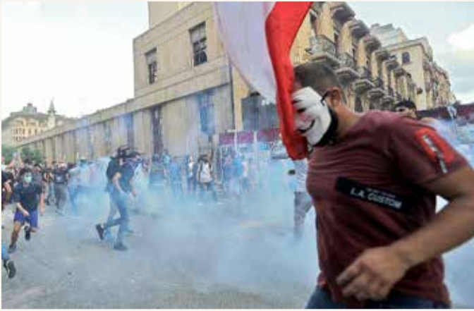
متظاهرون يفرون من الغاز المسيل للدموع أثناء اشتباكات في محيط مبنى البرلمان وسط بيروت (أ. ف. ب.)

القضاء يحقق في انفجار المرفأ وسط غليان الشارع وتجدد المواجهات