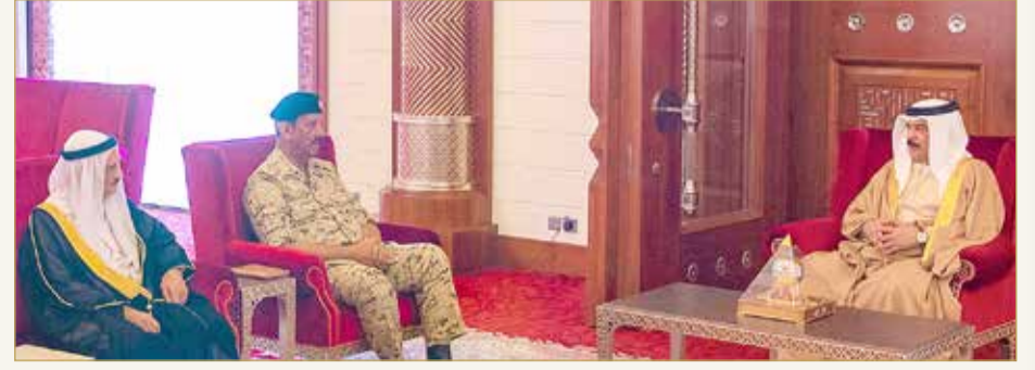
جلالة الملك مستقبلاً القائد العام لقوة دفاع البحرين وعدداً من كبار المسؤولين

مشاركة 6000 متطوع في التجارب السريرية تبعث على الفخر والاعتزاز سمو ولي العهد يقود فريق البحرين بكل اقتدار لمواجهة "كورونا" (02)