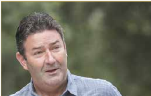
المدير التنفيذي لـ"ماكودالز" ستيف إيستربروك

لماكودالز في 4 نوفمبر 2019، بعد أن انكشف أمر علاقته الغرامية بإحدى الموظفات. وذكرت قناة تلفزيون "360" أن تعويضات نهاية الخدمة لـ 6 أشهر (التي تلقاها إيستربروك) بلغت 8 ملايين دولار. يُذكر أن ستيف إيستربروك ولد العام 1967 في بريطانيا، وانضم إلى ماكودالز العام 1993، وغادرها في العام 2011 ثم ما لبث أن عاد بعد عامين، وأصبح الرئيس التنفيذي للشركة في العام 2015، وبقي في منصبه حتى نوفمبر 2019.