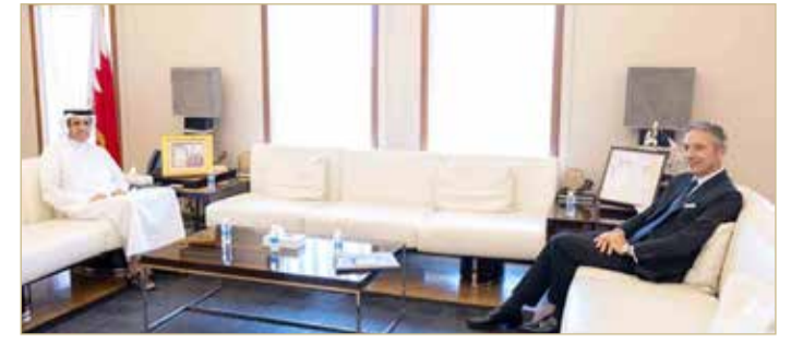
وزير الإعلام يستقبل سفير الجمهورية الفرنسية لدى مملكة البحرين