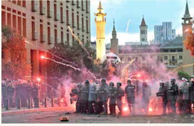
اشتباكات في محيط مبنى البرلمان وسط بيروت

وأضاف البيان "أصدرت القيادة أمراً بإجراء تحقيق عدلي، فتم ذلك بموجب قانون أصول المحاكمات الجزائية وضمن أصول العمل في مجال الضابطة العدلية. وبتنحية هذه التحقيقات أرسلت كتاباً قضائياً إلى رئاسة هيئة إدارة واستثمار مرفأ بيروت للقيام بالإجراءات الضرورية على جميع الصعد.