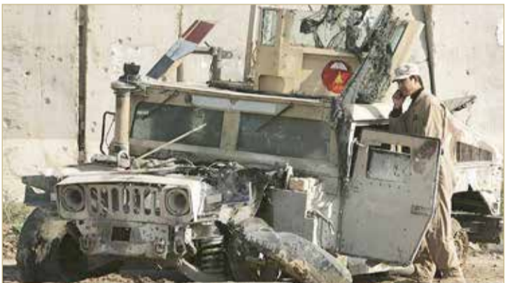
جندي عراقي يقف بجانب مركبة للجيش تضررت في اعتداء سابق.

وأضافت أن الهجوم استهدف "عجلة عسكرية لحرس الحدود في منطقة سيدكان، وأسفر عن مقتل أمر اللواء الثاني حرس الحدود المنطقه الأولى وأمر الفوج الثالث اللواء الثاني وسائق العجلة". واستهدفت الطائرة مسيرة التركية قادة حرس الحدود العراقي فيما كانوا