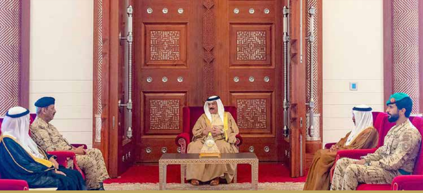
جلالة الملك مستقبلاً القائد العام لقوة دفاع البحرين وعدداً من كبار المسؤولين