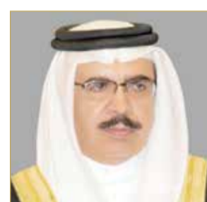
الشيخ راشد بن عبدالله

أصدر وزير الداخلية قراراً بتشكيل لجنة برئاسة المدير العام لإدارة العامة للدفاع المدني، وعضوية ممثلي الإدارات المعنية، تتولى حصر المواد الخطرة ومواقع تخزينها وآليات التفتيش عليها، والتأكد من الالتزام بالإجراءات الاحترازية المعمول بها في هذا الشأن، وذلك منذ وصول هذه المواد إلى منافذ المملكة حتى نقلها إلى أماكن تخزين آمنة، بعيدة عن الحيز العمراني. وتضمن قرار تكليف اللجنة، مراجعة الاشتراطات