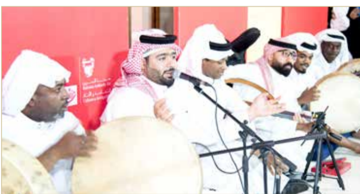
فرقة دار شباب الرفاع

استأنف الفنان كريم عبدالعزيز تصوير دوره في فيلم "كيرة والجن"، اليوم الجمعة، داخل أحد مواقع التصوير في القاهرة. ومن المقرر سفر أسرة الفيلم إلى عدد من المحافظات خلال الفترة المقبلة، منها الغردقة وأسوان لتصوير عدد من المشاهد الخارجية هناك. يذكر أن فيلم "كيرة والجن" مأخوذ عن رواية "1919" للكاتب أحمد مراد، ويتشارك في البطولة هند صبري، سيد رجب، أحمد مالك، هدي المفتي، وكوكبة من النجوم.