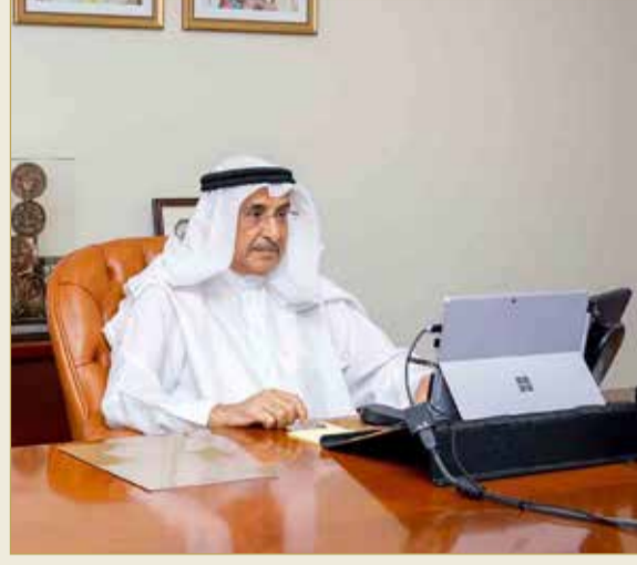
الشيخ خالد بن عبدالله

قصر القضيبيّة - مكتب نائب رئيس مجلس الوزراء