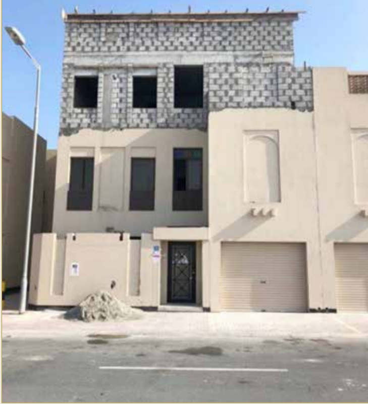
الحبس لمن يبني “طابوقة” دون ترخيص

تفويض الوزير بتحديد مقدار الرسوم ومبالغ التأمين