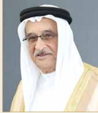
الشيخ محمد بن عبدالله

واصل الفريق الوطني الطبي برئاسة رئيس المجلس الأعلى للصحة رئيس الفريق الوطني الطبي للتصدي لفيروس كورونا الفريق طبيب الشيخ محمد بن عبدالله آل خليفة اجتماعاته الدورية لمناقشة مستجدات الإجراءات الاحترازية والتدابير الوقائية التي تم اتخاذها للتصدي لفيروس كورونا.