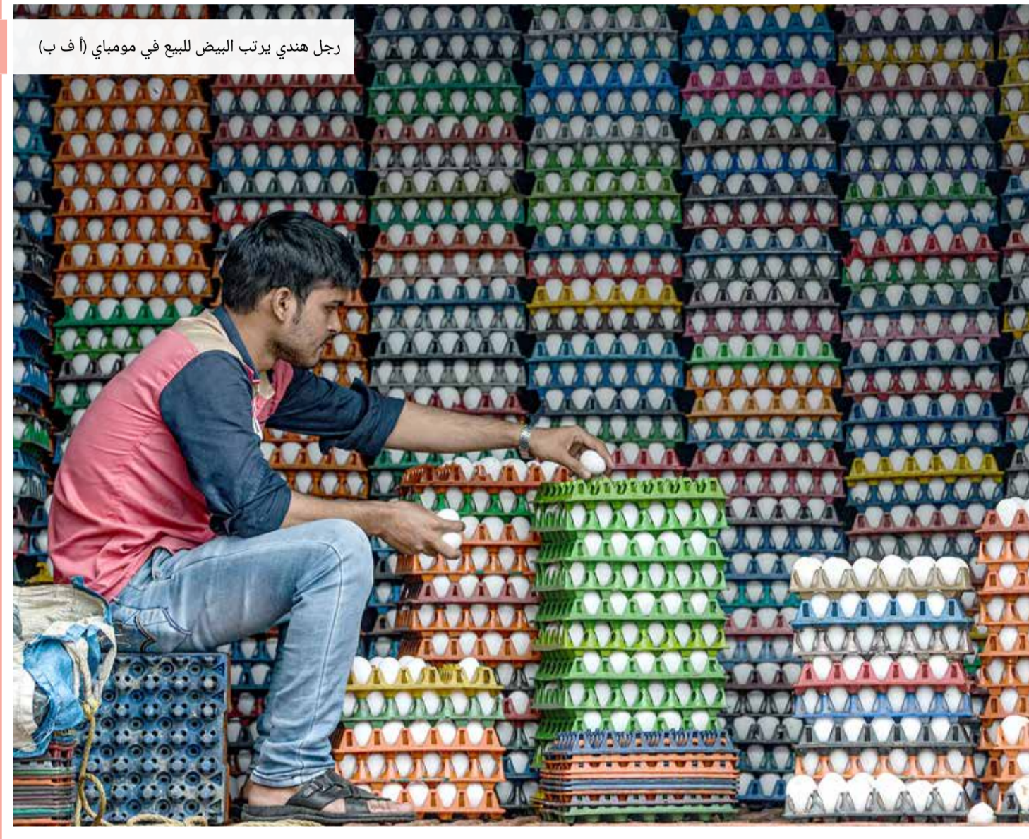
رجل هندي يرتب البيض للبيع في مومباي (أ ف ب)