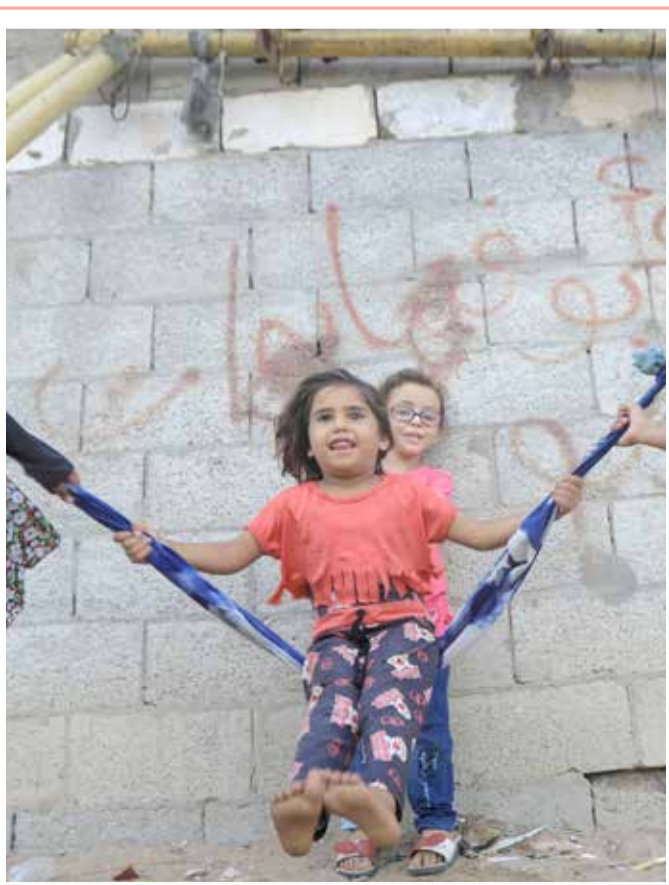
فتيات فلسطينيات يتأرجحن ويلعبن بجوار منزلهن في خان يونس، جنوب قطاع غزة

وقالت وكالة الإحصاء، التي قيمت نفس الـ 3527 شخصا البالغين قبل وأثناء الوباء، إن مشاعر التوتر أو القلق كانت أكثر الطرق شيوعاً لتعبير البالغين عن شعورهم بشكل من أشكال الاكتئاب.