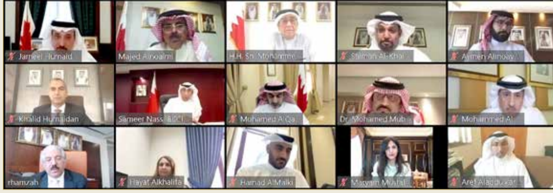
سمو الشيخ محمد بن مبارك يترأس المجلس الأعلى لتطوير التعليم والتدريب

مشروع تطوير الهيكل المؤسسي لوزارة التربية والتعليم من خلال التعاون مع الاستشاري الدولي للمشروع في تنفيذ مبادرات المشروع التي يبلغ عددها 17 مبادرة ومنها تطوير وزيادة كفاءة إدارة العملية التعليمية في الوزارة وداخل المدارس ووضع آلية مركزية لعملية التخطيط وزيادة كفاءة إدارة الموازنات، بالإضافة إلى تطوير المناهج الدراسية وتحسين جودة عملية التعليم والتعلم في المدارس وتطوير المنشآت والبنية التحتية للوزارة وتعزيز منصة التعليم الإلكتروني بأحدث التقنيات، إذ قامت الوزارة بتشكيل فرق العمل وإنشاء مكتب لإدارة المشروع والبدء في عملية التدريب وبناء القدرات للعاملين على المشروع وموظفي الوزارة؛ تحقيقاً لأهداف مشروع تطوير التعليم والتدريب في مملكة البحرين.