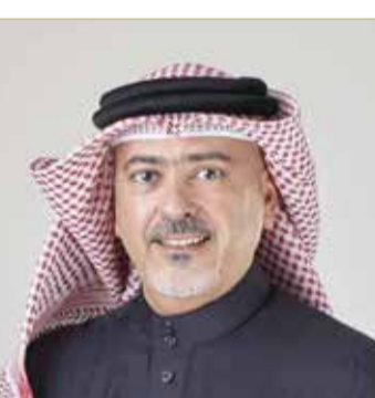
الشيخ بدر بن راشد

تقوم بها الحكومة في مكافحة جائحة (كوفيد 19). ونحن فخورون جداً بهذا التعاون الذي يعكس تكاتف