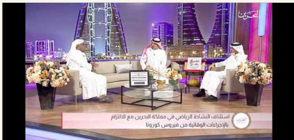
استئناف النشاط الرياضي في مملكة البحرين مع الالتزام بالإجراءات الوقائية من فيروس كورونا

◆ "مجتمع واعٍ" يسلط الضوء على تضارب مواعيد المباريات