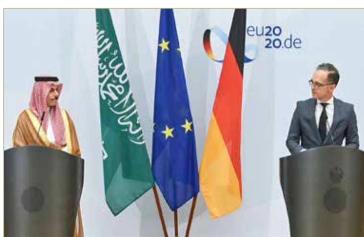
من المؤتمر الصحفي المشترك للوزراء

يجب تمديد حظر السلاح على إيران ودعم الحل السياسي باليمن