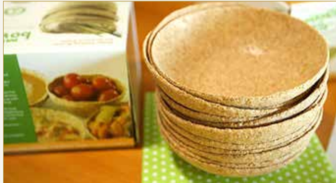
أطباق قابلة للأكل للقضاء على التلوث

ونشر موقع "ماشابل" الأميركي مقطع فيديو، قال إنه يرصد طريقة صناعة أطباق من نخالة القمح، التي يتم تصميمها بأشكال مختلفة تحت ضغط ودرجات حرارة عالية تمنحها قدر من الصلابة التي تجعلها صالحة للاستخدام بسهولة ويسر. ويقول الموقع إن تلك الأطباق يمكنها تحمل درجات الحرارة للأطعمة الساخنة كما يمكن تناولها لما لمكونات القمح من فائدة على الجسم، إضافة إلى كونها قابلة للتحلل بنسبة 100% إذا تم التخلص منها مباشرة. ورصد الفيديو لقطات لبعض الأشخاص يتناولون تلك الأطباق بعد الأكل، مشيراً إلى أن طنا واحداً من نخالة القمح يكفي لصناعة 10 آلاف طبق من هذا النوع.