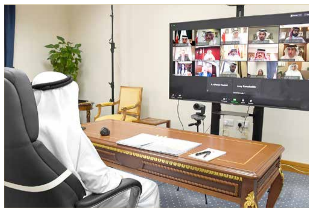
سمو الشيخ محمد بن مبارك يترأس اجتماع المجلس الأعلى لتطوير التعليم والتدريب "بعث"

توجيه جامعة البحرين للبدء في الخطة المستقبلية لرفع جودة التعليم