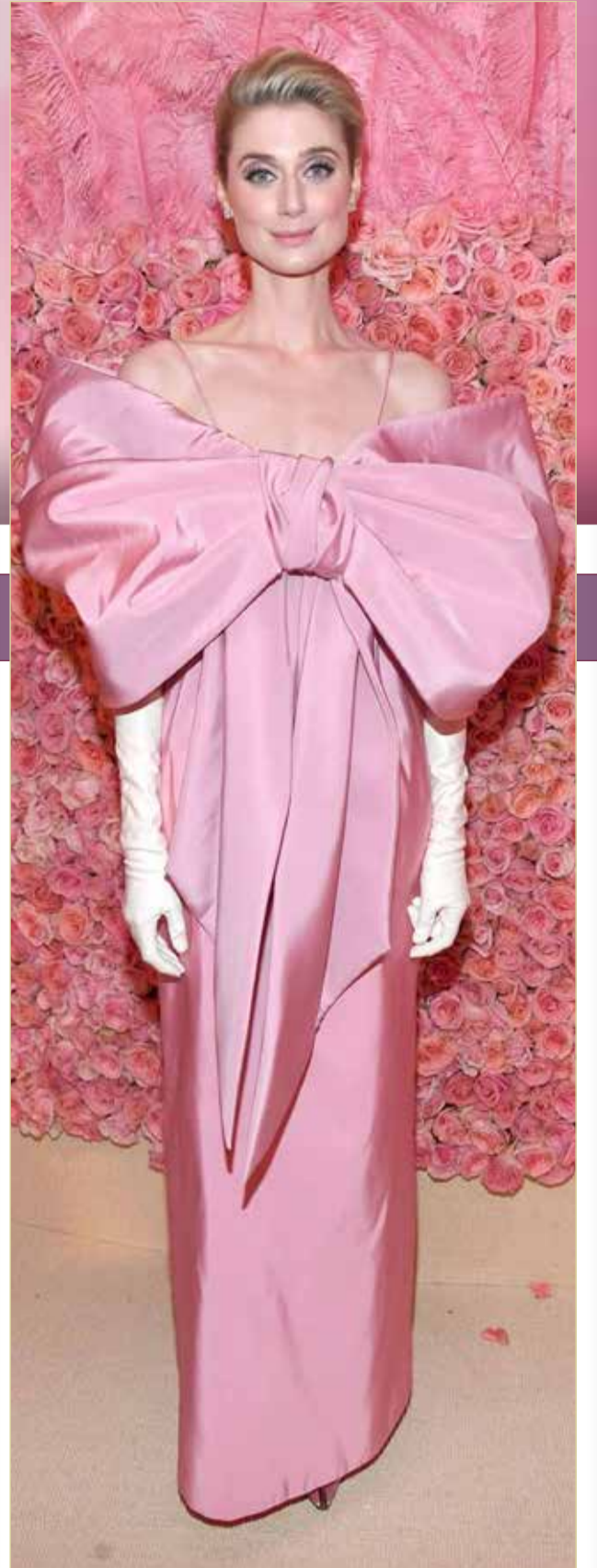
« اختارت "تفليكس" الممثلة الأسترالية إليزابيث ديبكي للعب دور الأميرة ديانا في الموسمين الخامس والسادس من مسلسل "The Crown". وقالت ديبكي في تغريدة "يشرفني الانضمام لهذا المسلسل الذي أدمنت مشاهدته منذ الحلقة الأولى".»

أعلنت مؤسسة "فن" المعنية بتعزيز ودعم الفن الإعلامي للأطفال والناشئة في الإمارات، عن تأجيل الدورة الثامنة من مهرجان الشارقة السينمائي الدولي للأطفال والشباب حتى أكتوبر من العام المقبل 2021؛ نظرا للظروف الاستثنائية التي فرضها انتشار فيروس كورونا المستجد حول العالم، واستجابة للإجراءات الوقائية التي اتخذتها دولة الإمارات للحيلولة دون انتشاره. وتسعى المؤسسة من خلال المهرجان الذي انطلقت أولى دوراته في العام 2013 إلى الارتقاء بذائقة الأطفال والشباب وقيادتهم نحو اكتساب المهارات العلمية والتقنية والتعرف على آخر ما توصلت له صناعة الأفلام من خلال اطلاعهم على خبرات وتجارب أبرز المخرجين والمؤلفين والممثلين العالميين ودعمهم بأحدث الأعمال السينمائية الموجهة ليكون لديهم القدرة في المستقبل على الارتقاء بهذه الصناعة الإبداعية عربيا. وعن هذا الإعلان، مدير مؤسسة فن مدير مهرجان الشارقة السينمائي الدولي للأطفال والشباب أكدت الشخبة جواهر القاسمي، أن السينما وعلى مرّ التاريخ استطاعت بما تمتلكه من فنون وإبداعات