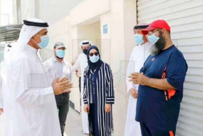
الحمر للمواطن: الوزارة لا تتقاضى رسوما أو أتعابا هندسية

◆ الوزارة مسؤولة عن البيوت لـ 100 عام... واطلبوا مشورتها ونصيحتها