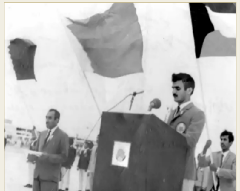
بوجيري أثناء ناديه قسم "خليجي 1"

ولد المرحوم بوجيري في مدينة المحرق العام 1948، وفرض المرحوم نفسه في تاريخ