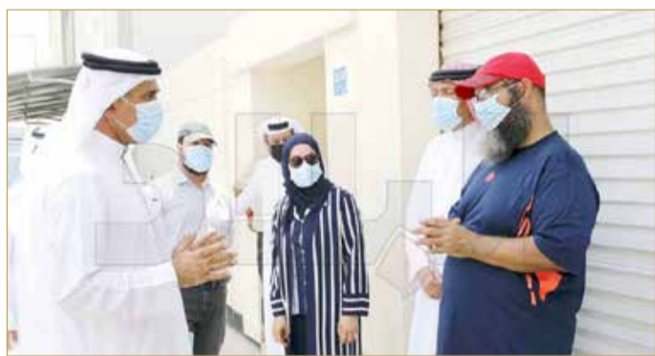
رئيسة مجلس النواب ووزير السكان خلال الزيارة

زينل: لسرعة معالجة الملاحظات الإسكانية وتلبية الاحتياجات