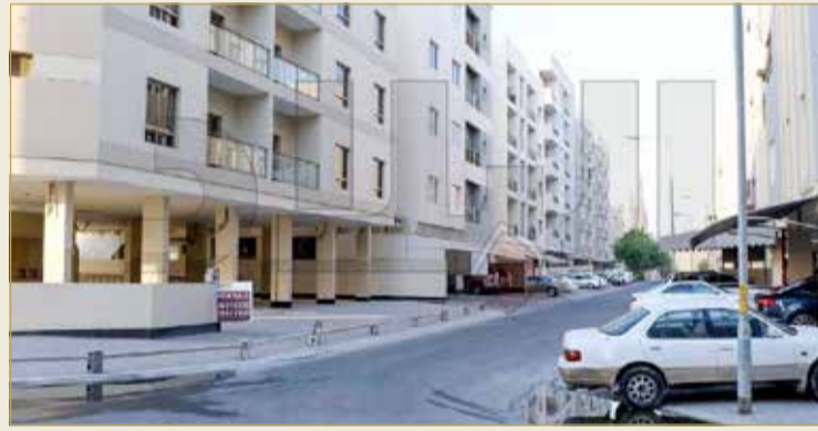
أكثر المتضررين سكان المجمعين 109 و111