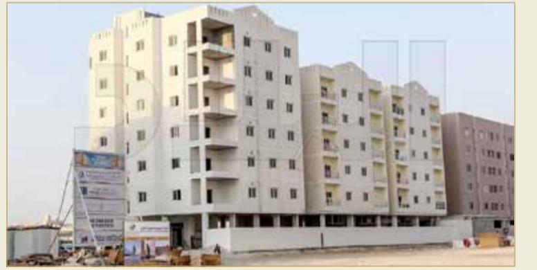
حركة عمرانية مطردة بالمنطقة