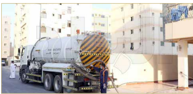
سيارات شفط المجاري

وبيّن أن عمليات الشفط المسائية، لا تجدي نفعاً، إذ يفاغأ الأهالي بوجود تجمعات جديدة للمياه الخضراء في الصباح الباكر، بأحيائهم السكنية، وفي كل الاتجاهات. كدلالة على أن آلية الشفط التقليدية لم تعد مجدية،