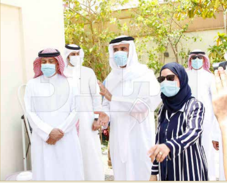
الرئيسة زينل والوزير الحمر والبلدي عبداللطيف

« وأكدت الرئيسة زينل ضرورة سرعة معالجة الملاحظات وتلبية الاحتياجات التي أبادها المواطنون وبما يعكس الاهتمام الرفيع للملف الإسكاني وتعزيز الخدمات الإسكانية المتطورة.