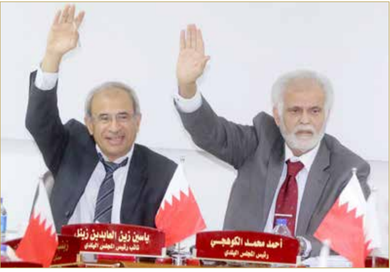
رئيس ونائب رئيس بلدي الشمالية

دعت الحكومة إلى إعادة النظر في مشروع قانون بإضافة مادة جديد برقم 11 مكررا إلى قانون البلديات الصادر بالمرسوم بقانون رقم 35 لسنة 2001؛ باعتبار أنه يتعارض مع نص المادة (9) من المرسوم بقانون رقم 35 لسنة 2001 بإصدار قانون البلديات. ويهدف الاقتراح بقانون حسب ما ورد في مذكرته الإيضاحية إلى منح أعضاء المجالس البلدية المكافأة المقررة لهم من تاريخ اكتساب العضوية أي من تاريخ إرسال شهادة العضوية إلى العضو الفائز بالمقعد البلدي، وذلك كما هو معمول به مع أعضاء مجلس النواب الذين يستحقون المكافأة من تاريخ اكتساب العضوية وليس من تاريخ القسم كما هو جار مع أعضاء المجالس البلدية.