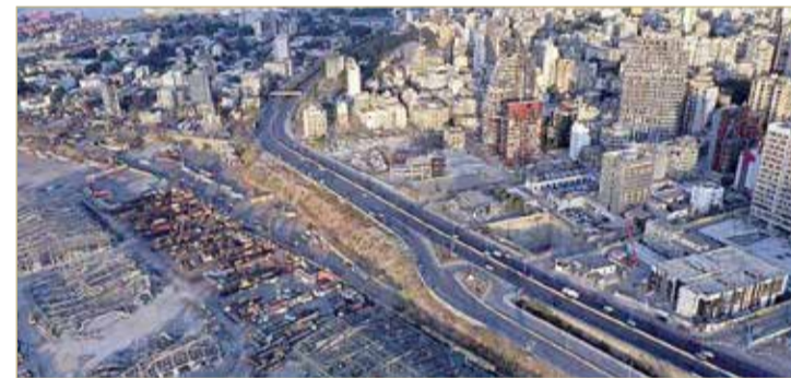
الانفجار دمر مساحات شاسعة من بيروت

◆ انفجار مرفأ بيروت تسبب في أضرار بقيمة 15 مليار دولار