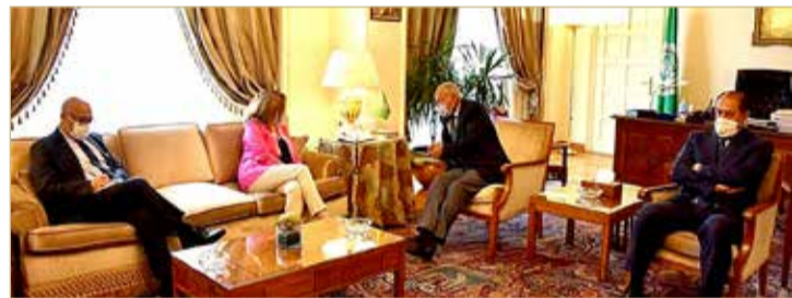
أبو الغيط مستقبلاً ستيفاني وليامز في القاهرة أمس

◆ أبو الغيط ووليامز يتفقان على استئناف الحوار بين أطراف النزاع الليبي