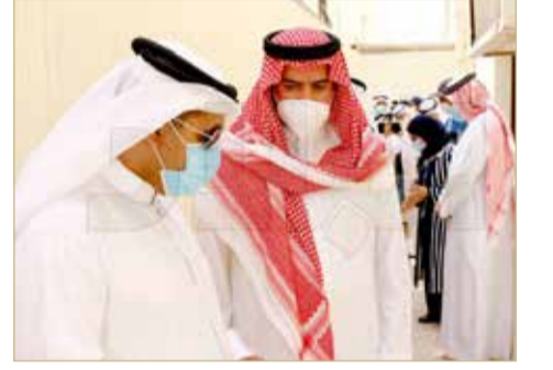
الوكيل خالد بن حمود

« زيارة بيوت الحنينية هي الجولة الميدانية الثانية التي يحضرها الوكيل الجديد لوزارة الإسكان الشيخ خالد بن حمود آل خليفة بعد زيارته الأولى لمجلس نائب المدير وسمايح هشام العشري. وشاركت "البلاد" بتغطية الزيارتين.