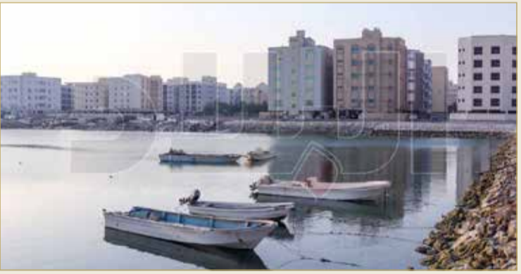
العمارات تعانق البحر

الصرف المتراكمة هنا وهناك، بخلاف العمارات المملوكة للمستثمرين، حيث يلزمون بذلك على حسابهم الخاص، والبلدية تتساعدهم أحياناً إذ ما رأّت بأن الأمور خرجت عن السيطرة". ويكمل الكعبي "بعض العمارات تستفيد من الأراضي الفضاء الملاصقة لها