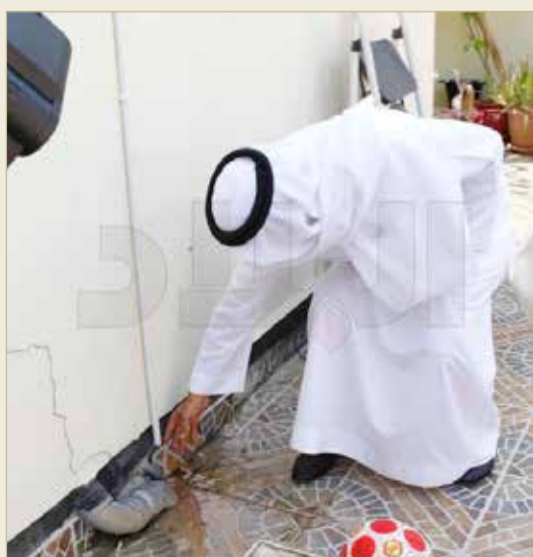
تخصيص مهندسين مفرغين لمتابعة الاحتياجات

◆ تطوير خدمات الصيانة... وطلبها إلكترونيا عبر موقع الوزارة