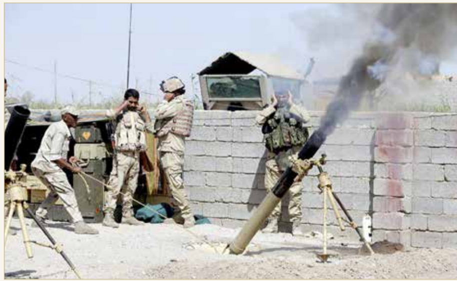
جانب من عمليات القوات العراقية ضد "داعش" في الأنبار

دعت الأمم المتحدة، أمس الأحد، إلى "إجراء تحقيقات مستقلة وفعالة لتحديد مصير ما يقرب من 1000 من الرجال والسيبان المدنيين الذين اختفوا أثناء العمليات العسكرية ضد تنظيم "داعش" بمحافظة الأنبار في 2015 - 2016 ومحاسبة الجناة وتوفير العدالة والإنصاف لأسر الضحايا".