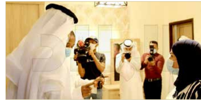
المواطن: "بداية الشرخ كان بسيطا"

◆ الوزارة تعمل بأقل من 30% من طاقتها.. والاتصالات "ضعيفة"