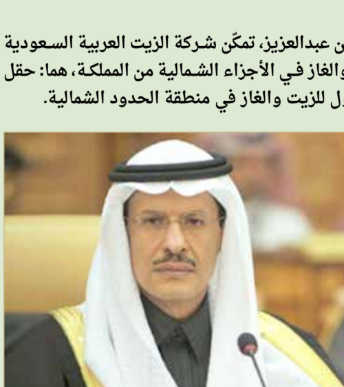
وزير الطاقة السعودي

حفر مزيد من الآبار لتحديد مساحة وحجم الحقلين