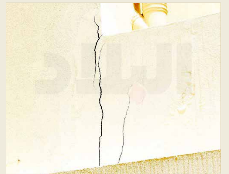
التشققات بجدران البيوت

البلاد كشفت الزيارة لمشروع الحنينية الإسكاني عن أن صور تشققات الجدران، التي نشرتها "البلاد" بموضوعها، قد التقطت حديثا وبكاميرا محرار الصحيفة. وزارة الإسكان في معرض تعقيبه على موضوع "البلاد" اعتبرت الصور المنشورة بأنها قديمة، وليبت نفذت الوزارة صيانة له، ولكن كشفت الزيارة عن وجود عدد من البيوت تعاني من المشكلة ذاتها، ونشرت صورها "البلاد"، وشوهت المشكلة بعين المسؤولين وعدسات المصورين يوم أمس.