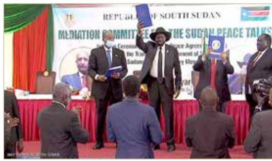
مراسم اتفاق سلام السودان بجوبا

◆ برعاية إماراتية... وخطوة لتحقيق أهداف الحركة الانتقالية