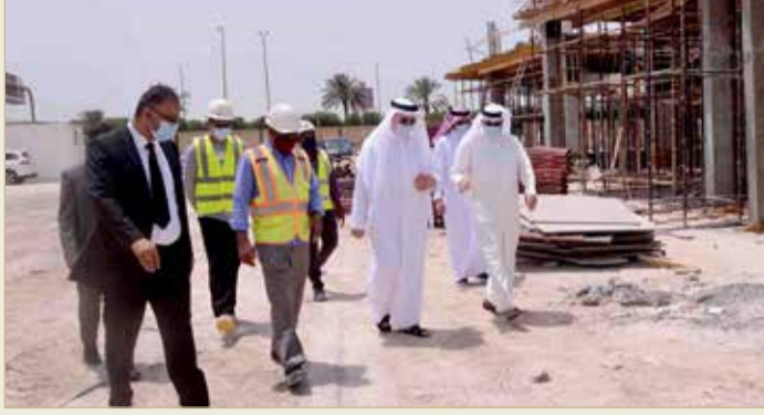
مدينة عيسى - وزارة العمل

فترة الحظر، تم فيها مخالفة 30 منشأة فقط، فيما بلغ عدد العمال المخالفين 42 عاملاً، إذ تم إحالة المخالفين إلى القضاء لاتخاذ الإجراءات المنصوص عليها في قانون العمل الأهلي وفقاً للمادة 192 منه، التي تنص على أنه 'يعاقب كل من يخالف أحكام هذا القرار بالعقوبات المنصوص عليها في المادة 192 من قانون العمل الأهلي الصادر بالقانون رقم 36 لسنة 2012، والتي تنص على أنه يعاقب كل من يخالف أياً من أحكام الباب 15 والقرارات الصادرة تنفيذاً له بالحبس مدة لا تزيد عن ثلاثة أشهر وبالغرامة التي لا تقل عن 500 دينار، ولا تزيد عن ألف دينار أو بإحدى هاتين العقوبتين.'