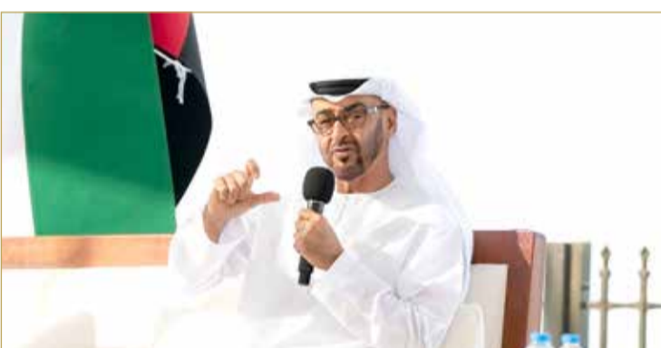
ولي عهد أبوظبي الشيخ محمد بن زايد

♦ الإمارات وإسرائيل: اتفاقنا أوقف ضم الأراضي