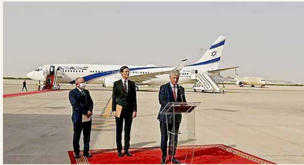
وصول وفد أميركي إسرائيلي مشترك إلى أبو ظبي

◆ وفد أميركي إسرائيلي يزور أبو ظبي في أول رحلة مباشرة بين البلدين