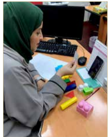
جانب من تطبيق الاختبارات

طريق التهيئة المسبقة لولي الأمر وتجاوبه الفاعل لاجتياز المقابلات. وأضاف: في هذه المقابلات التشخيصية يتم تقسيم الطلبة إلى قسمين، القسم الأول هم الطلبة الذين لا يعانون من أي صعوبات وإعاقات فيتم تسجيلهم على الفور، أما الطلبة الذين تم تشخيصهم تحت بند صعوبات التعلم فيخضعون لمقابلات إضافية واختبارات تشخيصية خاصة لكل حالة، ومن ثم يتم تسجيلهم بناءً على نتائج هذه الاختبارات.