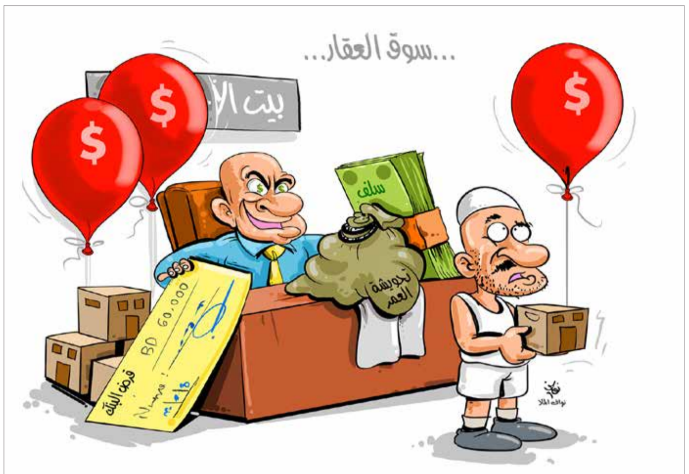
كاركاتير فخاف الملل البلاد

إن من أهم سمات التخطيط الناجح لأي مسؤول من أجل بناء مجتمع مشع ومشرق بالمشاريع والبرامج، النزول إلى الشارع والتفقد بصفة