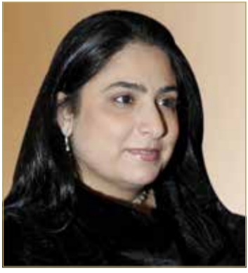
الشيخة رنا بنت عيسى

يضيء على تجربتها العلمية والعملية وجانب من حياتها الشخصية