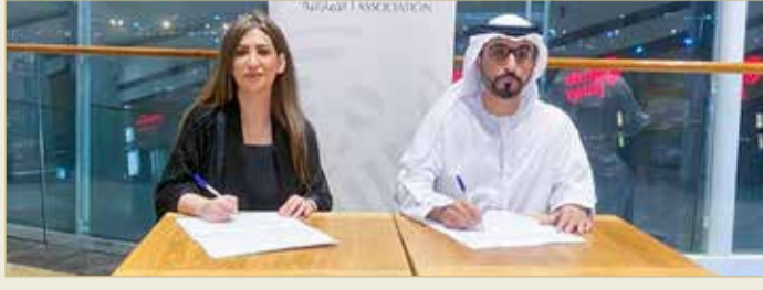
دبي - جمعية الصحفيين

تنفيذ برامج تدريبية وورش عمل في مجال الإعلام