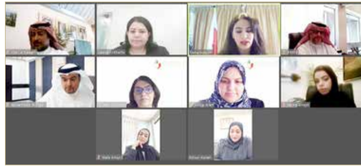
الأعلى للمرأة ووزارة العدل يناقشان مستجدات عمل لجنة تكافؤ الفرص بالوزارة

تعزيز جودة الخدمات المقدمة للنساء والأسرة البحرينية