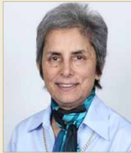
دام بارفين كومار

2009. وعمل استشارياً عامًا وجراحًا للأوعية الدموية، كما شغل منصب نائب عميد الكلية لشؤون تطوير المناهج في الكلية الملكية للجراحين، وحصل على جائزة باتي المرموقة لجمعية الجراحين في بريطانيا وأيرلندا. 4. البروفيسور دام بارفين كومار، بريطانية الجنسية، أستاذ الطب والتعليم بكلية بارتس ولندن للطب وطب الأسنان بجامعة كوين ماري في لندن، وهي طبيبة وأخصائية أمراض الجهاز الهضمي، وقد طورت أول ماجستير في أمراض الجهاز الهضمي في المملكة المتحدة، وتولت منصب رئيسة الجمعية الطبية البريطانية، ورئيسة الجمعية الملكية للطب، ورئيسة اتحاد الطبيات النسائي، وحصلت على درجات فخرية من عدة جامعات، ونالت العديد من الجوائز، ومنحتها الملكة اليزابيث الثانية ملكة المملكة المتحدة أرفع وسامين من أوسمة الأمبراطورية البريطانية. 5. البروفيسور كينيث كريستوفر، أمريكي الجنسية، حاصل درجتي