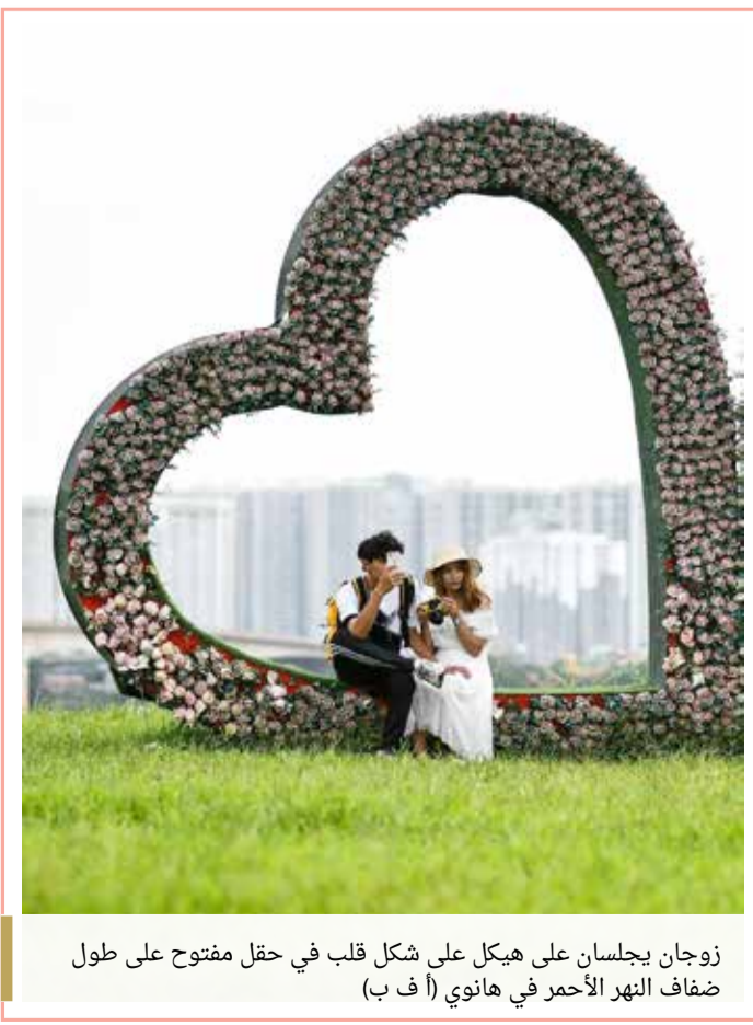
زوجان يجلسان على هيكل على شكل قلب في حقل مفتوح على طول ضفاف النهر الأحمر في هانوي

« وتعمل القفازات الإلكترونية عن طريق تحفيز مناطق معينة على سطح الجلد بحيث تعطي المستخدم نفس الشعور باللمسة، كما لو كان متلامساً فعلياً مع نفس الأغراض في الحقيقة.