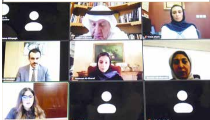
جانب من المنتدى الافتراضي لـ "الغرفة"