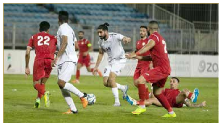
من لقاء النجمة والشرقي