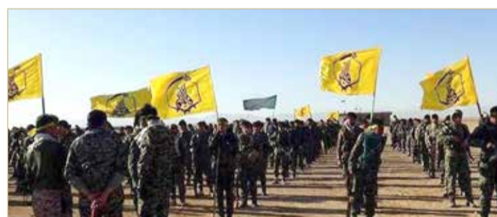
مليشيات إيرانية في سوريا

بمليدين وبأديتها وضواحيها ومنطقة البوكمال وغيرها بريف دير الزور غرب نهر الفرات، أو ضمن ما يعرف بـ "سرايا العرين" التابع للواء 313 الواقع شمال درعا، إضافة لمراكز في منطقة اللجاة ومناطق أخرى بريف درعا، وخان أرنية ومدينة البعث بريف القنيطرة على مقربة من الحدود مع الجولان السوري المحتل.