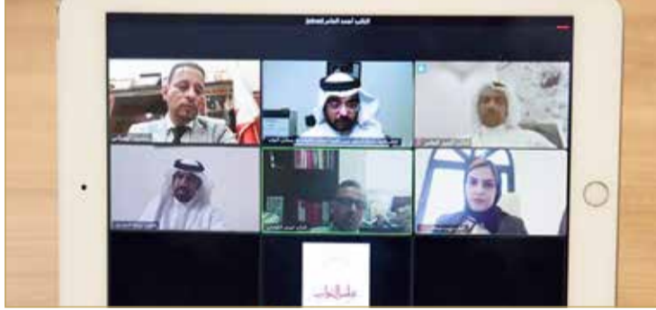
اجتماع لجنة الشؤون المالية والاقتصادية

حكيمه من لدن جلاله الملك في إطار تحقيق السلام العالمي، منوها بدور المملكة الريادي في مد جسور السلام والوئام و تعزيز التقارب الإنساني بين شعوب العالم في سبيل تحقيق السلام في المنطقة والعالم أجمع. وأكد السياسي أن موقف البحرين ثابت وراسخ في دعمه للشعب الفلسطيني وأن أي اتفاقية أو خطوة في اتجاه السلام العادل والشامل للجميع ولا تظال من هذه القناعة وإيماننا بحق الشعب الفلسطيني وأن الخطوة الشجاعة لجلالة الملك سيسجلها التاريخ في إرساء عملية السلام في المنطقة.