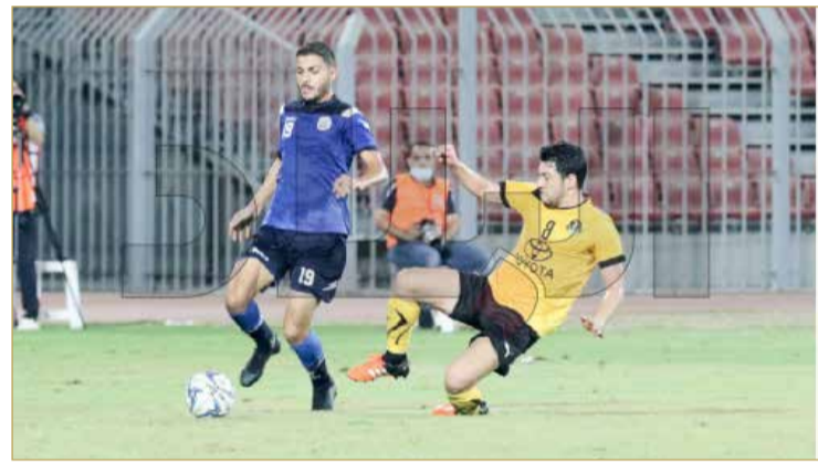
لقاء البيسيتين والأهلي

البلاد | أحمد مهدي