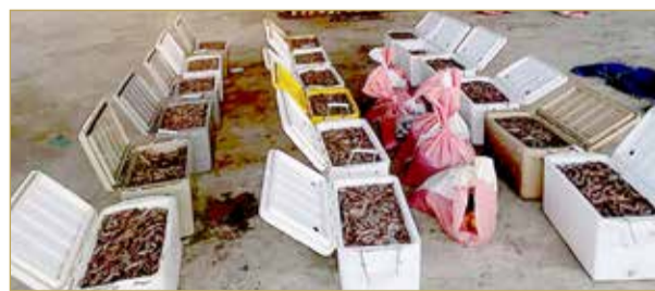
كمية الروبيان المصادرة

مخالفيين للأنظمة والقوانين بحوزتهم حوالي 620 كيلوغراماً من الروبيان، تم صيده بواسطة شبك الجر القاعية (الكوفة) الممنوع استخدامها استناداً إلى القرار الوزاري رقم (205) لسنة 2018، بشأن حظر الصيد البحري بواسطة شبك الجر القاعية (الكراف). (05)