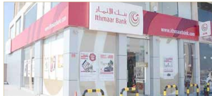
أحد البنوك التابعة لشركة الإثمار القابضة

لاستمرار وقف تداول أسهمها لأكثر من 6 أشهر