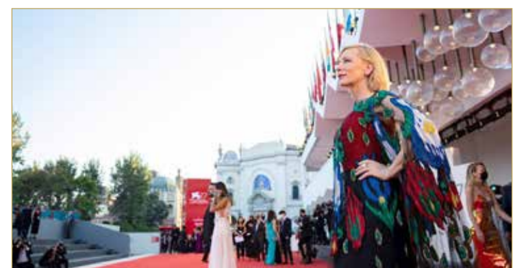
وفرض المهرجان برونوكولا صارماً للسلامة شمل وضع الكمادات خلال مشاهدة الأفلام وترك نحو نصف المقاعد بقاعات العرض فارغة.

اقتنص الفيلم الأميركي "نومادلاند" (أرض الرحل)، جائزة الأسد الذهبي لأفضل فيلم في النسخة الـ 77 لمهرجان البندقية السينمائي. وتدور أحداث الفيلم حول مجموعة من قاطني عربات الفان أثناء عبورهم الغرب الأميركي الشاسع، ويقوم ببطولته الممثلة الحائزة على جائزة "أوسكار"، فرانسيس مكدورماند، التي تؤدي دور أرملة في الستينات تحول عريبتها الفان إلى منزل متنقل وتعمل بوظائف موسمية على امتداد الرحلة. وأخرج الفيلم كلوي تشاو، وهو مخرج صيني يقيم بالولايات المتحدة. والمهرجان هو أول حدث من نوعه ينظم في حضور جمهور منذ تفشي فيروس "كورونا".