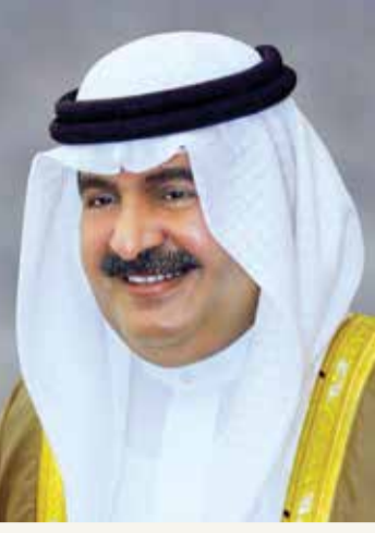
سمو الشيخ علي بن خليفة