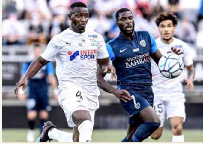
لقطة لفريق "باريس أف سي"

الذي يقدمه الفريق في كل جولة، ويدل على أن الفريق يمتلك العديد من الإمكانيات المتميزة التي ستظهر في الدوري يرى المستوى المتصاعد