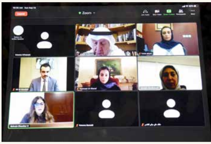
جانب من المنتدى الافتراضي لـ "الغرفة"

وأشار المولاني إلى أن الاقتصاد المعرفي يتركز على 4 ركائز رئيسية هي: مؤسسات الابتكار، مهارات الابتكار، منظومة الابتكار إضافة إلى تكنولوجيا المعلومات، لافتاً إلى أن البحرين خطت خطوات كبيرة نحو تحقيق جميع تلك الركائز، إذ يتبقى بعض الأمور التي يجب التركيز عليها خصوصاً البحث والتطوير والابتكار لنصل إلى قمة الاقتصاد المعرفي. ولفت إلى أن تقديرات مؤتمر الأمم المتحدة للتجارة والتنمية الأخير أشار إلى مدى أهمية التكنولوجيا والتحول الرقمي في العالم، مبيّناً أن المؤتمر قدّر حجم الاقتصاد الرقمي العالمي يتراوح بين 4.5% إلى 15.5% من الناتج الإجمالي العالمي الذي يبلغ 87 ترليون دولار في 2019، أي ما بين 3.9 ترليون إلى 13.5 ترليون دولار، مؤكداً أن هذا التفاوت في النسب المقدر راجع إلى عدم وجود تعريف واضح ومتفق عليه عالمياً للاقتصاد الرقمي حتى الآن.