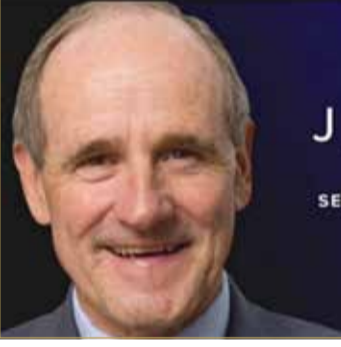
السيناتور جيم ريتش

خليفة، على ما أبداه من روح قيادية في هذه اللحظة التاريخية، مشيدا بجهود المملكة المستمرة للإسهام في فتح الأبواب نحو مزيد من الازدهار للشعب الفلسطيني. واختتم ريتش بيانه بالإعراب عن أمله أن تتجه مزيد من الدول العربية والإسلامية لاغتنام هذه الفرصة نحو تعزيز السلام والاستقرار في الشرق الأوسط.