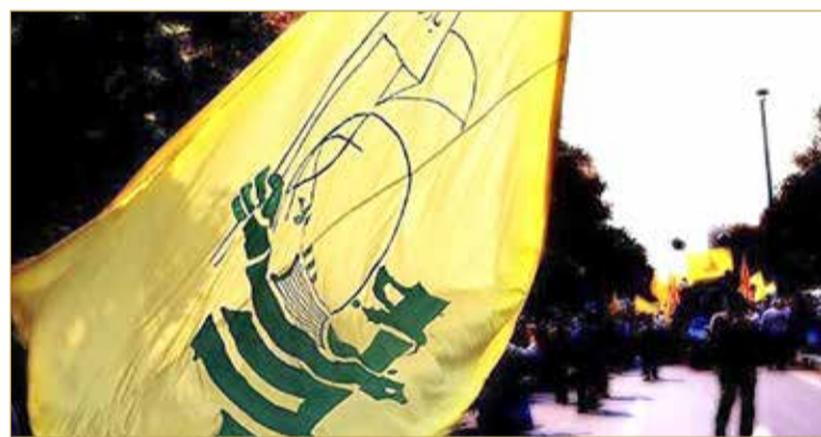
مسؤولون قطريون رفيعو المستوى نسقوا المدفوعات

تمويل شبكة شحنات الأسلحة من أوروبا إلى الميليشيات عبر طريق الذهب