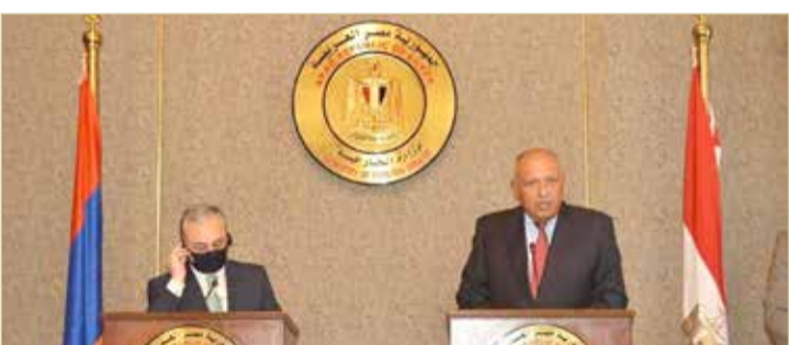
مؤتمر صحفي لوزيري الخارجية المصري والارمني

وعلى الرغم من وساطة دولية بدأت قبل سنوات طويلة، لم يتمكن البلدان من التوصل إلى حل للنزاع حول ناغورني قره باغ الذي تهدد باكوا باستمرار باستعادة السيطرة عليه بالقوة. وتمتعت المنطقة المتنازع عليها بحساسية كبيرة، إذ تنتمي أرمينيا لتحالف سياسي عسكري تقوده موسكو، ويتمثل بمنظمة معاهدة الأمن الجماعي، في حين تحظى أذربيجان بدعم من تركيا.