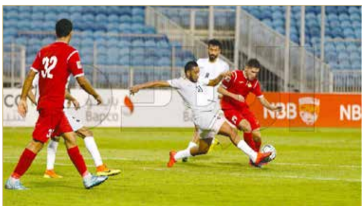
من لقاء النجمة والشرقي

صوفه، إلا أن ذلك لم يكن كافيًا؛ كونه افتقد اللسة الأخيرة في أكثر من مناسبة، وفي الوقت بدل الضائع ألقى الحكم هدفًا للشرقي بداعي التسلسل؛ لينتهي اللقاء بفوز النجمة.