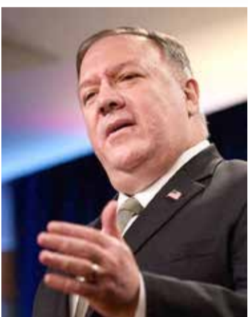
وزير الخارجية الأميركي مايك بومبيو

« والأسبوع الماضي، أعلنت واشنطن فرض عقوبات على وزيرين لبنانيين سابقين لدعم "حزب الله" والتورط في الفساد. وقالت وزارة الخزانة الأميركية في بيان، إن العقوبات تشمل الوزيرين بالحكومة اللبنانية السابقة يوسف فيناتوس وعلي حسن خليل، لتقديمهما الدعم لحزب الله والتورط في الفساد. وقالت الخزانة الأميركية إن الوزيرين السابقين مازالا فاعلين رغم خروجهما من الحكومة، وهما وزير الأشغال العامة في الحكومة اللبنانية السابقة يوسف فيناتوس ووزير المالية السابق علي حسن خليل. والعقوبات الأميركية على الوزيرين اللبنانيين تشمل تجميد الأصول والعقارات.