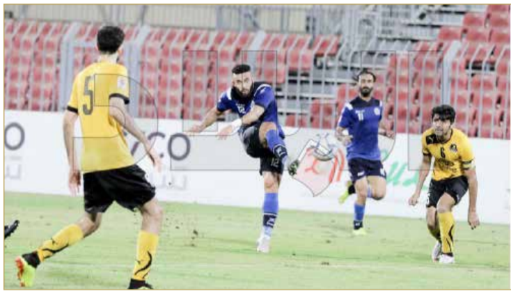
لقاء البيسيتين والأهلي