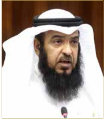
الشيخ عادل المعاودة

على التفاصيل الطبية والمعلومات الصحيحة سيدرك حجم الدراسة المتأينة والعمل الجاد من قبل العاملين في القطاع الطبي الذي يمتلكون من الكفاءة والعلم والاطلاع الكثير. وحث الجميع وتشجيع الناس على المشاركة الإيجابية في أخذ اللقاح، لإنجاح جهود الفريق الوطني الطبي للتصدي لفيروس كورونا ووضع نهاية لهذه الجائحة.