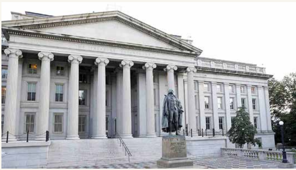
وزارة الخزانة الأميركية

طهران تقر: الحرس الثوري يساعدنا لنلتف على العقوبات