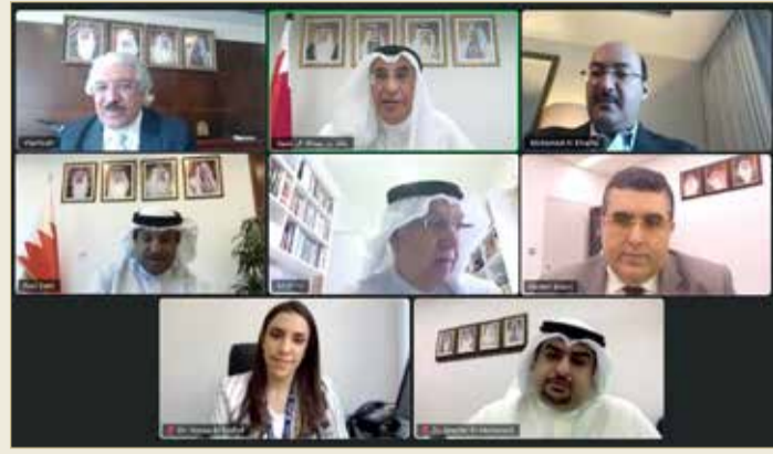
نائب رئيس مجلس الوزراء يتراس الاجتماع الذي عُقد عن بعد

♦ خالد بن عبدالله يطلع على خطة ماجستير "التطوير" بجامعة البحرين