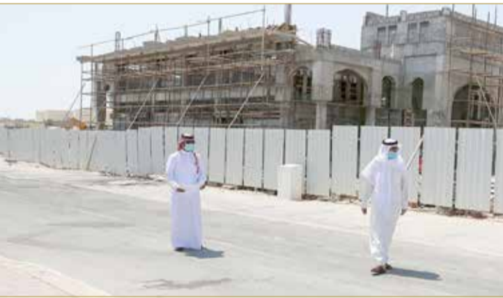
أثناء الزيارة التفقدية

المنبثقة من المجلس التنسيقي الذي يعتبر حلقة تواصل مستمرة بين المحافظة والجهات الحكومية؛ لمتابعة احتياجات الأهالي وتلبية تطلعاتهم مع مواصلة الارتقاء بالخدمات المقدمة لهم كمشروع مركز مدينة خليفة الصحي، ومشروع صالة متعددة الاستخدامات (صالة أهالي الدور). وفي ختام الزيارة نوه سموه إلى أهمية المشروعات التنموية الكبرى بمدينة خليفة بما يرتقي إلى تطلعات المواطنين وبما يتماشى مع النمو العمراني الذي تشهده المنطقة، وذلك في سياق اهتمام المحافظة بالمشروعات التي تعكس الصورة الحضارية للمحافظة الجنوبية.