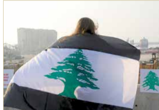
حزب الله يعرقل حكومة لبنان

محاولة أخيرة لتبديد معوقات حالت دون ولادتها رغم انتهاء المهلة