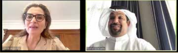
المنامة - وزارة المالية والاقتصاد

أكد وزير المالية والاقتصاد الوطني الشيخ سلمان بن خليفة آل خليفة أهمية مواصلة تعزيز التعاون المشترك بين مملكة البحرين والجمهورية الإيطالية بما يساهم في خلق فرص استثمارية واعدة. وأشار إلى النتائج المثمرة لزيارة ولي العهد نائب القائد الأعلى النائب الأول لرئيس مجلس الوزراء صاحب السمو الملكي الأمير سلمان بن حمد آل خليفة الأخيرة لإيطاليا. وأكد أهمية العمل على استكمال ترجمة الاتفاقيات ومذكرات التفاهم المبرمة وتعزيز التعاون الثنائي بما يخدم المصالح المشتركة والتطلعات المنشودة للبلدين والشعبين الصديقين. كما تم في الاجتماع تبادل وجهات النظر عن آخر المستجدات الاقتصادية والمالية على الساحتين الإقليمية والدولية.