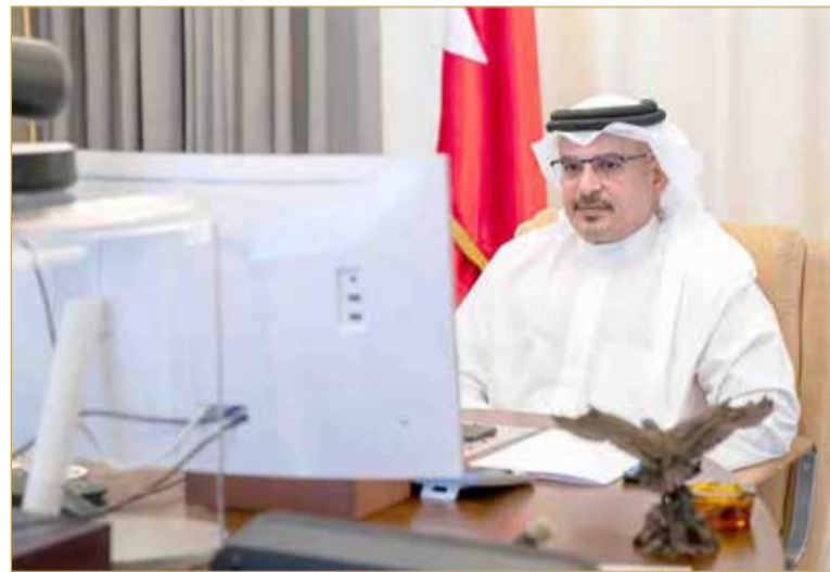
سمو ولي العهد مترسدا اجتماع اللجنة التنسيقية

وإجراءات بعزم ومسؤولية خلال الأسبوعين المقبلين حتى الأول من أكتوبر؛ لتحقيق معاً الانخفاض