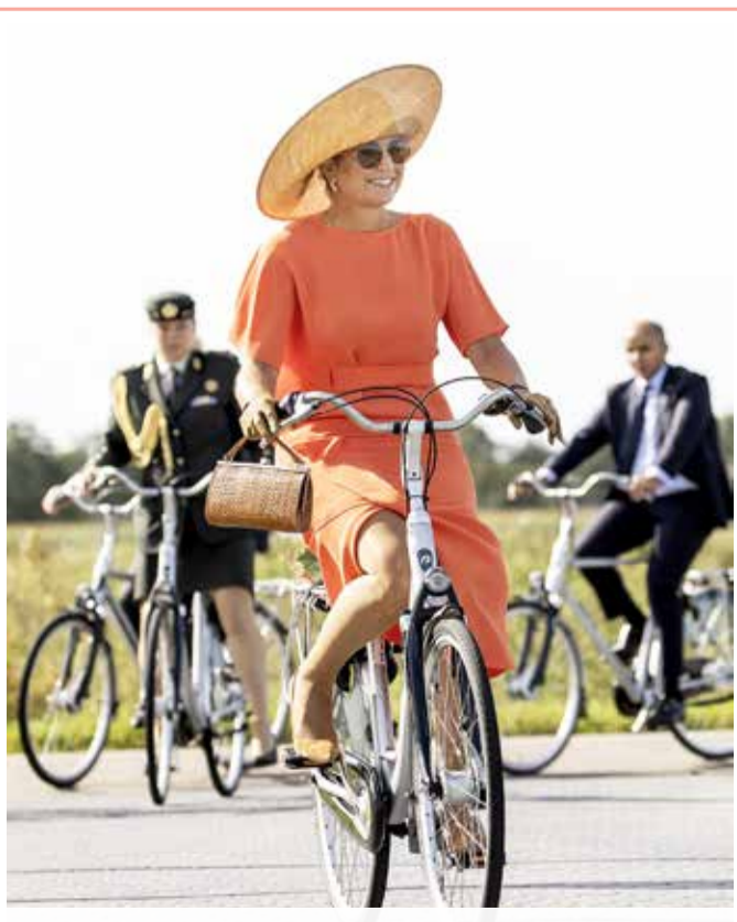
ملكة هولندا ماكسيما تتركب الدراجة الهوائية خلال زيارتها لمقاطعة فيريزلاند

عثر رجل من سكان مدينة بيسك بجنوب سيبيريا على حجر غريب الشكل وذلك بعد أن ذهب لجمع الفطر في غابة. وقرر الرجل أن يأخذه للبيت، إذ درسه واشتبهه بأن الحجر هو نيزك فقرر استشارة الخبراء. وأكد البروفيسور في جامعة "الناني" للتربية والعلوم الإنسانية أناتولي غوسيف أن الشظية التي وجدها الرجل هي نيزك. وقال غوسيف في حديث أدلى به لصحيفة "كومسومولسكايا برافا": إن النيزك الحديدي الذي وزن 530 غراما سقط على الأرض منذ أسبوعين بالقرب من قرية فومينسكي. وبلغت كتافته 5.3 غرام/ سنتيمتر مربع. ويتكون النيزك من الحديد الصافي. وأوضح أن عمره يقدر بـ 4.5 مليار عاما، ما يتناسب عمر كوكب الأرض.