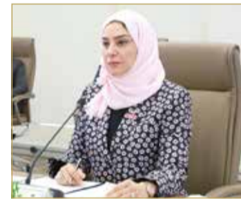
اجتماع مجلسي الشورى والنواب بوزير الخارجية

جلالته مركز الملك حمد العالمي للتعايش السلمي، كما أن جميع أصحاب الأديان والمعتقدات يلقون رعاية تامة من الدولة ومن الحكومة الموقرة والشعب البحريني، مؤكداً أن مبدأ التعايش يمثل أحد مرتكزات السياسة الخارجية لمملكة البحرين، وهي ملتزمة بمبادئ حسن الجوار مع كل الدول. وأكد وزير الخارجية أن إعلان تأييد السلام خطوة مهمة للبحرين، وهي ليست موجهة ضد أحد، أو دول أو قوى؛ لأن مملكة البحرين تؤمن بمبدأ حسن الجوار وعدم التدخل في الشؤون الداخلية وحل الخلافات بالطرق السلمية، وهي ملتزمة بحسن الجوار باعتباره مبدأً آمياً ينص عليه ميثاق الأمم المتحدة، وتريد أن تكون علاقاتها مع الجميع قوية ومتطورة لمصلحة جميع الشعوب. وأضاف وزير الخارجية أن خطاب البحرين بمناسبة التوقيع على إعلان تأييد السلام هو "رسالة ملك وشعب" إلى العالم، شعب اشتهر بالطيبة والتعددية والتعايش والتسامح وتقبل الآخر، مؤكداً أن مملكة البحرين نالت احترام وتأييد دول العالم بهذه الخطوة التاريخية المهمة لتعزيز السلام والاستقرار في منطقة الشرق الأوسط.