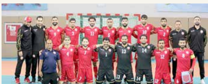
منتخب كرة الصالات

الصين وإندونيسيا وأوزبكستان. وينص نظام التأهل في البطولة الآسيوية على ترشح صاحبي المركزين الأول والثاني لربع النهائي، فيما ستأهل 5 منتخبات من البطولة ذاتها لمونديال 2021.