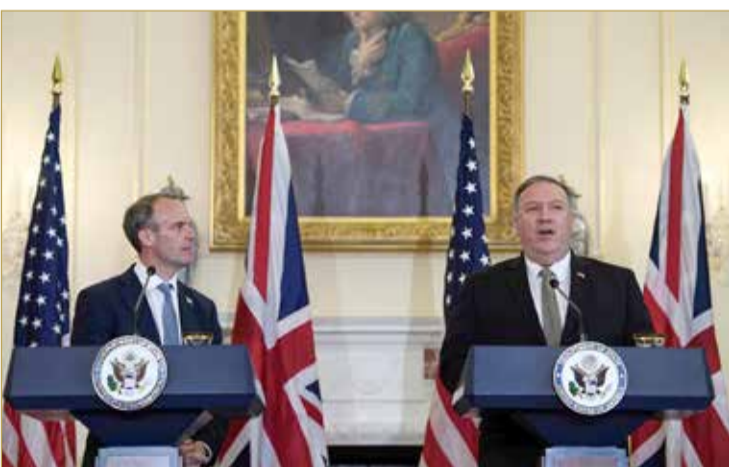
وزير الخارجية البريطاني يتحدث في إيجاز صحفي مشترك مع نظيره الأميركي

♦ وزير الخارجية البريطاني والأميركي: فرصة للحوار بين الفلسطينيين والإسرائيليين