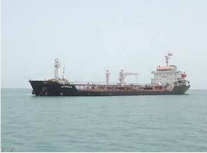
ينذر نصدع ”صافر“ بتسرب كميات كبيرة من النفط الخام