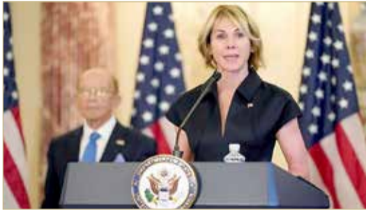
السفيرة الأميركية لدى الأمم المتحدة كيلي كرافت

كرافت، أمس بأن تنضم دولة عربية أخرى إلى عملية التطبيع مع إسرائيل في غضون اليومين المقبلين. وذكرت كرافت، أن الولايات المتحدة ”تخطط لانضمام المزيد من الدول العربية، سنعلن عنها قريباً، مضافةً أن ”دولة عربية أخرى ستوقع على اتفاق في غضون يوم أو يومين، وسائر الدول ستحذو حذوها“. وتشير وسائل الإعلام الإسرائيلية إلى عمان والمغرب والسودان كدول محتملة مرشحة للانضمام إلى اتفاقات التطبيع مع إسرائيل التي ترعاها الولايات المتحدة.