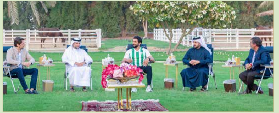
لقطات من الاستقبال

سموه يؤكد: دور مهم للبحرين في السوق الأوروبية ويساهم بتحقيق رؤية البحرين 2030