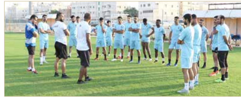
لقطة سابقة لتدريب فريق الشباب

وجودة حالة واحدة إيجابية متمثلة في اللاعب المصاب