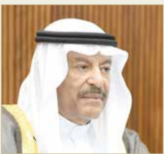
رئيس مجلس الشورى

بتقديم الرعاية الصحية للمواطنين والمقيمين لتجاوز هذا التحدي الذي يواجهه العالم. كما أشاد رئيس مجلس الشورى على ما بينه جلالته العاهل في كلمته من مواقف مسؤولة تجاه القضايا العربية والإسلامية، والتي تشكل ثوابت السياسة الخارجية لمملكة البحرين والعلاقة الاستراتيجية بالشقيقة الكبرى المملكة العربية السعودية، وكل من دولة الإمارات العربية المتحدة وجمهورية مصر العربية، ومساندة جهودهم لإرساء الأمن والاستقرار على المستوى الدولي، مثنياً عليه في ذات السياق تأكيد جلالته العاهل على الأهداف العالمية والجهود التي تقوم بها المملكة للمساهمة بإنجاحها.