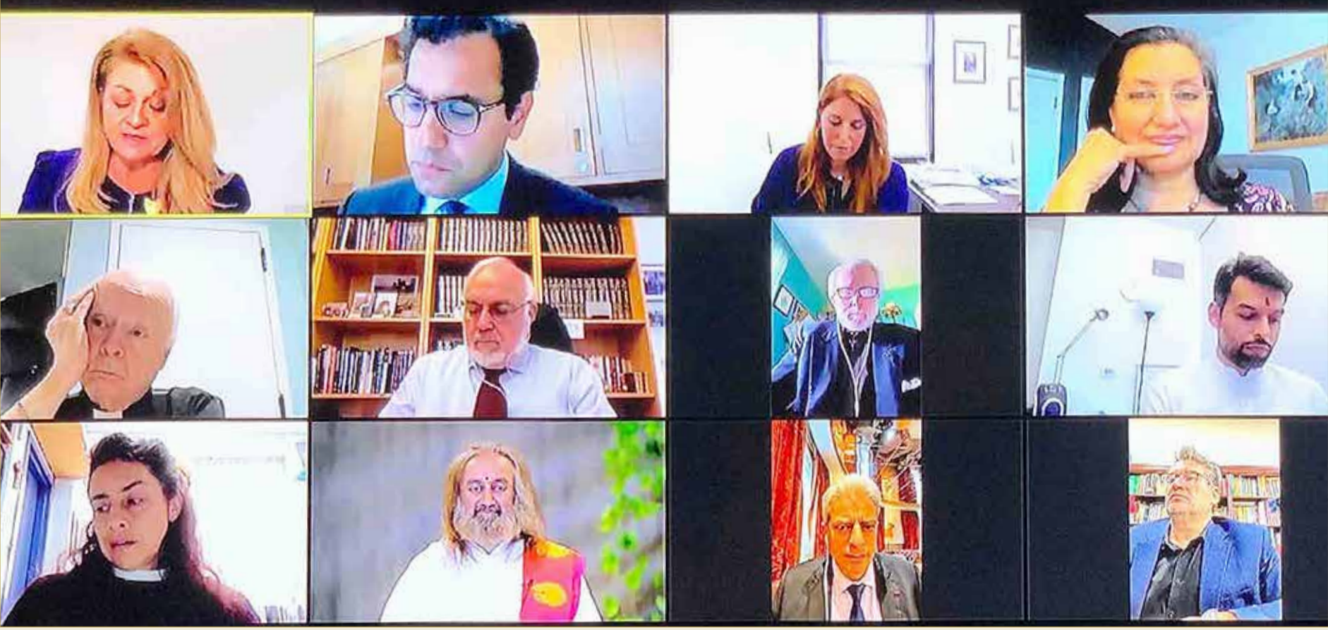
المشاركين في الندوة

جلالة العاهل يثني على جهود نشر رسالة البحرين الداعية للسلام والتعايش