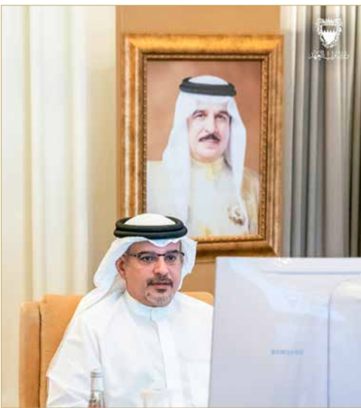
سمو ولي العهد يترأس اجتماع اللجنة التنسيقية الذي عقد عن بُعد

اللجنة تستعرض برئاسة سمو ولي العهد مستجدات التعامل مع "كورونا"