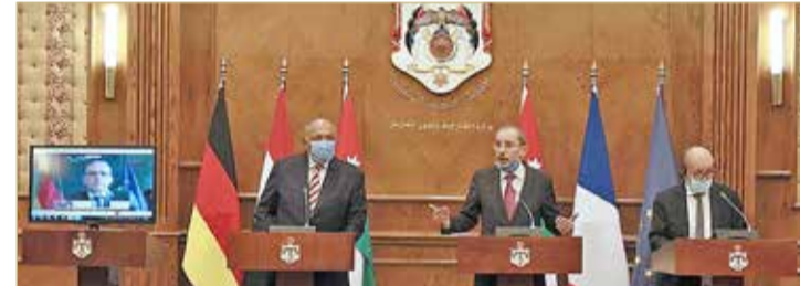
وزراء خارجية مصر والأردن وفرنسا

شكري، أن اتفاقات السلام بين البحرين والإمارات وإسرائيل خطوة مهمة، مؤكداً على أهمية التوصل لحل شامل يلبي مطالب الشعب الفلسطيني. وقال: ”اتفاقات السلام بين البحرين والإمارات والفلسطينية وإسرائيل، وحل الصراع الفلسطيني الإسرائيلي يمكن بإقامة دولة فلسطينية“. وشدد على ضرورة ”استئناف المفاوضات بين السلطة الفلسطينية وإسرائيل“.