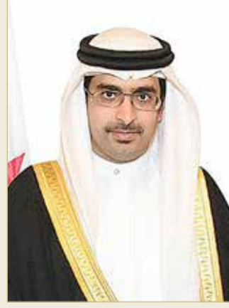
سمو الشيخ خليفة بن علي

الثانية لعام 2020، إذ شهد البرنامج إقبالا واسعا من الناشئة من مختلف مناطق المحافظة، مؤكدا سموه حرص المحافظة الجنوبية على استمرار المبادرات والبرامج الأمنية والمجتمعية الهادفة، والتي تسهم في رفع مستوى الوعي وترسخ دعائم الأمن والأمان في مختلف أرجاء المحافظة.