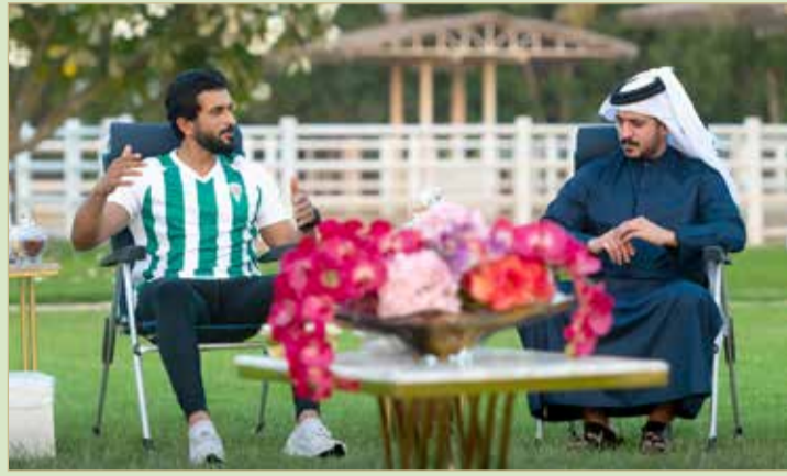
سمو الشيخ ناصر بن حمد وسمو الشيخ خالد بن حمد