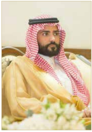
الأمير سلطان بن أحمد