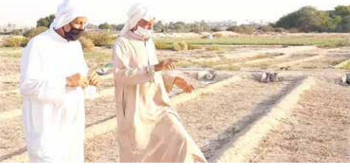
مزارعان في إحدى مزارع بوري (03)