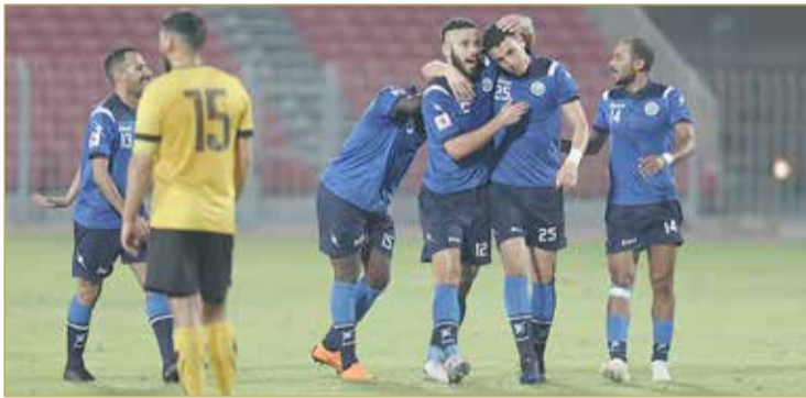
البسيتين حقق انتصاراً ثميناً على الأهلي