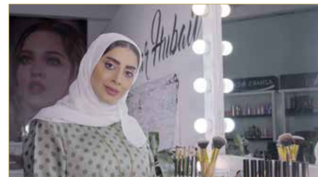
أزهار حبيل

دشنت صحيفة "البلاد" سلسلة حلقات بالفيديو مع رواد الأعمال، تناقش تداعيات فيروس كورونا على نشاطهم التجاري، وكيف أبدعوا بمسارات موازية لمواجهة التحديات.