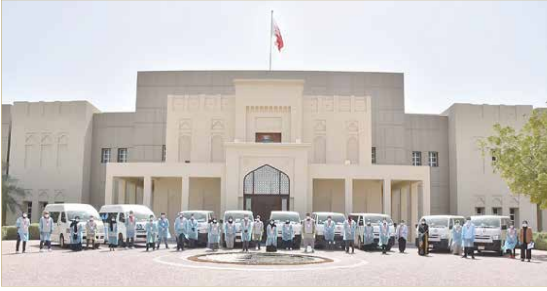
الحملة الوطنية "متكاتفين لأجل سلامة البحرين"

♦ 75 % نسبة العاملات ضمن صفوف الفريق الوطني