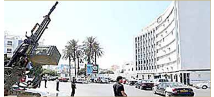
استنطار امني في طرابلس الليبية (إرشيفية)