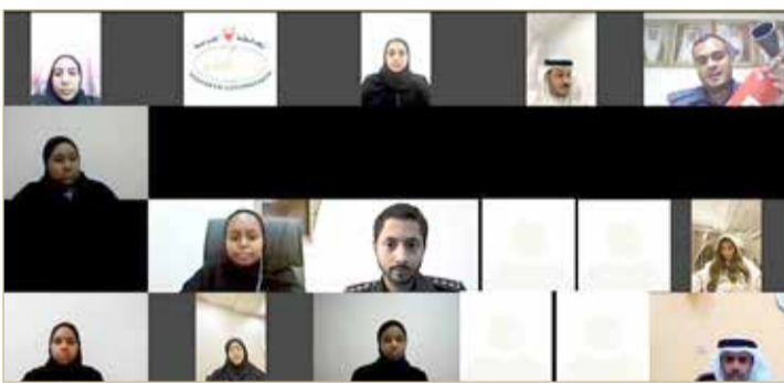
المنامة - وزارة الداخلية

في إطار برنامجها التوعوي، تستمر المحافظة الجنوبية في تقديم ورش العمل لبرنامج سمو المحافظ الأمني الاجتماعي (الافتراضي) عن بعد في نسخته الثانية للعام 2020، في إطار متابعة محافظ الجنوبية سمو الشيخ خليفة بن علي بن خليفة آل خليفة، إذ يهدف البرنامج إلى تعزيز مفهوم مستوى الوعي الأمني والاجتماعي لدى الناشئة لضمان أمنهم وسلامتهم. وشهد البرنامج مشاركة أبناء المحافظة الجنوبية، بلغ عددهم 60 مشاركاً بنسبة (60%) إناث و(40%) ذكور، وتضمن البرنامج تقديم الإرشادات وفق برنامج افتراضي عبر استخدام تقنيات الاتصال المرئي، من أجل توعية المشاركين ووقايتهم أمنياً واجتماعياً.