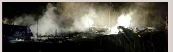
كيبيف - وكالات

أعلنت وزارة الداخلية الأوكرانية، عن تحطم طائرة عسكرية تابعة للسلاح الجوي. وقالت الوزارة، ببيان على حسابها بوقع التواصل الاجتماعي (فيسبوك)، إن طائرة طراز AN-26 تابعة لسلاح الجو الأوكراني تحطمت، مما أسفر عن مقتل 22 شخصاً من أصل 28 فرداً كانوا على متن الطائرة. والمحت، إلى وجود عدد جريحين جراء الحادث، فضلاً عن 4 أشخاص مفقودين. وأوضح سلاح الجو الوطني الأوكراني أن الطائرة تحطمت عند مرحلة الهبوط وكان فيها إضافة إلى