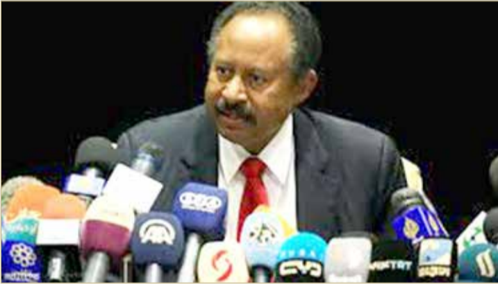
رئيس الوزراء السوداني

ملف العلاقات مع إسرائيل يحتاج إلى نقاش مجتمعي متعمق. ويمثل التضخم المستشري في السودان وتراجع قيمة العملة أكبر تحد لاستقرار الحكومة الانتقالية بقيادة حمدوك والتي تحكم البلاد مع الجيش منذ الإطاحة بالبشير.