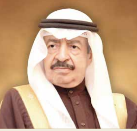
سمو رئيس الوزراء

وسيشترك في المنتدى الذي يعقد هذا العام تحت شعار "أهداف التنمية المستدامة في مرحلة ما بعد جائحة كوفيد - 19"، نخبة من المسؤولين الدوليين رفيعي المستوى والخبراء والمختصين، منهم: دينيس موكوبجي الحائز على جائزة نوبل للسلام لعام 2018، ومحمود محيي الدين المبعوث الخاص للأمم المتحدة لأجندة التمويل 2030. ويركز المنتدى هذا العام عبر محاوره المتعددة على أهداف التنمية المستدامة في مرحلة ما بعد كورونا، وطرح رؤى مشتركة تسهم في مواجهة التحديات الراهنة وسبل دعم الجهود الدولية لتنفيذ أجندة أهداف التنمية المستدامة.