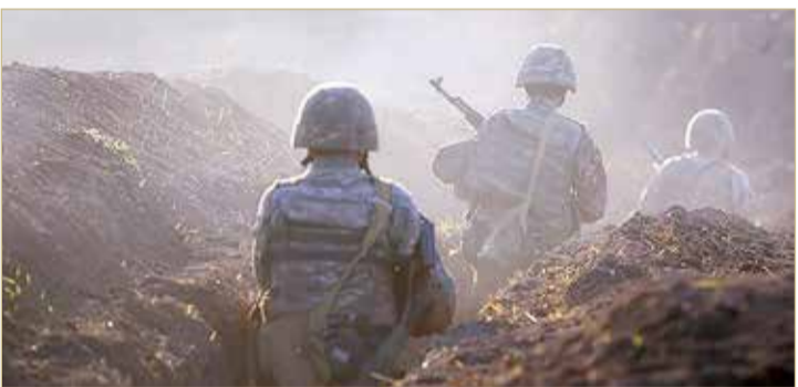
أرمينيا تطالب بالتدخل ضد أذربيجان.. وبأكو: نخوض حربا وطنية

الأخرى، روسيا وفرنسا والولايات المتحدة وإيران والاتحاد الأوروبي، إلى وقف فوري لإطلاق النار.