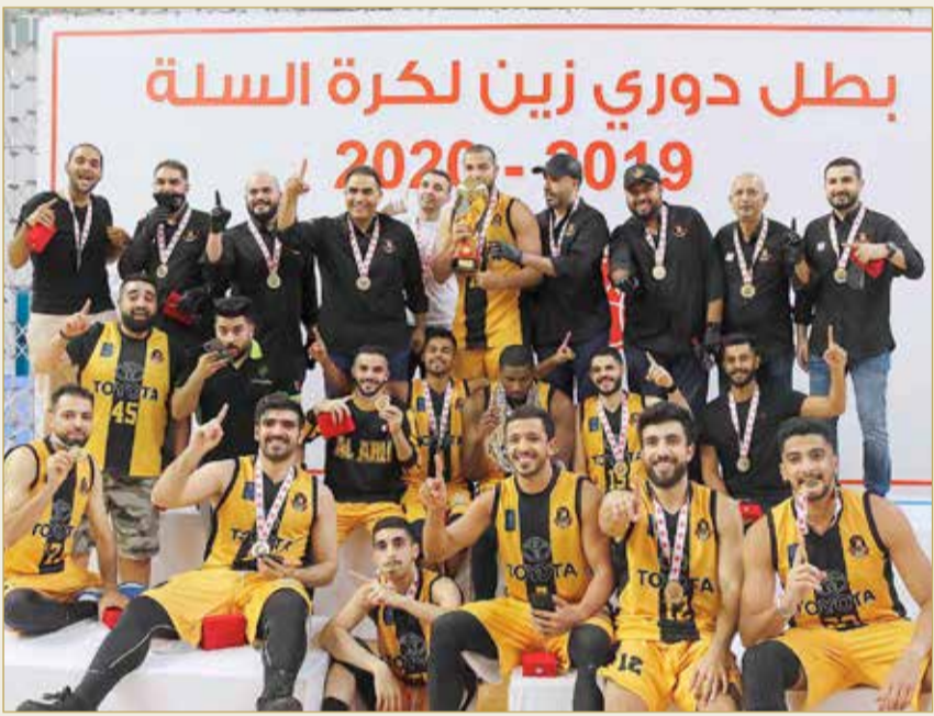
الأهلي بطل الدوري

شركة ألبا، الشيخ دعيح بن سلمان بن دعيح آل خليفة، عن فخره واعتزازه بالمساهمة التي قدمتها الشركة ألبا لدعم مسابقة كأس جلالة الملك ومسابقة دوري ناصر بن حمد الممتاز لكرة القدم، مؤكداً