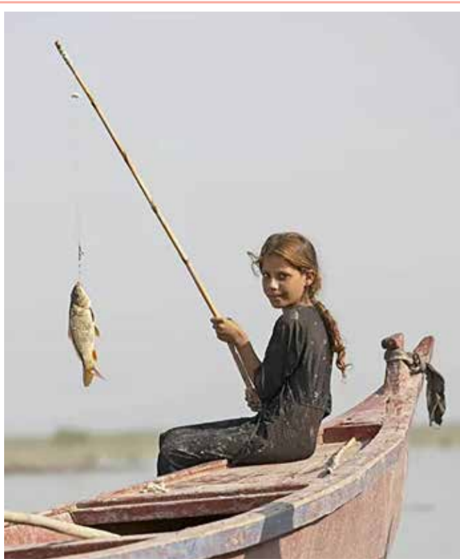
فتاة تصطاد سمكة في مستنقعات منطقة شبايش الجنوبية بمحافظة ذي قار، شمال غرب مدينة البصرة الجنوبية

ذكرت السلطات المكسيكية أن مذبحه في حانة خلفت 11 قتيلا، في الوقت الذي تعاني فيه البلاد من معدل جرائم قتل قياسية، على الرغم من تعهد الحكومة بوقف عنف العصابات. وقال مكتب المدعي العام في ولاية جواتاخواتو بوسط المكسيك "إن السلطات عثرت على جثث 7 رجال و4 نساء في الحانة في الساعات الأولى من صباح الأحد في مدينة خارال ديل بروجريسو. وقالت السلطات في بيان صحفي "إنها عثرت على امرأة أخرى مصابة مسرعا للعنف الإجرامي في المكسيك على نحو متكرر. وفي يوليو، قتل مسلحون 24 شخصا في مركز لإعادة تأهيل مدمني المخدرات في جواتاخواتو، في واحدة من أسوأ عمليات القتل الجماعي.