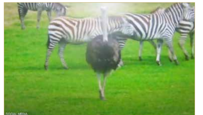
وأضاف العامل أن المشكلة تكمن في الحاجة إلى الطائر للجلوس على البيض كي يفقس بعد تزواجه مع نعامة، الأمر الذي يجعل الحديقة تفكر بجلب ذكر نعامة آخر.

أثار سلوك ذكر نعامة استغراب العاملين في "لينغليت سفاري بارك" ببريطانيا، وذلك لتصرفه كما لو أنه حمار وحشي. ولاحظ العاملون في الحديقة أن ذكر النعامة يميل للركض مع الحمير الوحشية، كما أنه يتناول طعامه معهم، ويحاول تقليدهم عندما يقومون بتحريك ذيولهم. واكتشف سلوك النعامة الغريب بعدما رفض الطائر الجلوس على البيض الذي يفقس عادة بعد مرور 46 يوما، وفضل اللعب مع قطع الحمير الوحشية. ونقلت صحيفة "صن" البريطانية عن أحد العاملين في الحديقة قوله "إن النعامة تقضي وقتها مع قطع الحمير الوحشية والتي تبدو هي الأخرى كما لو أنها تتقبل وجوده بينها".