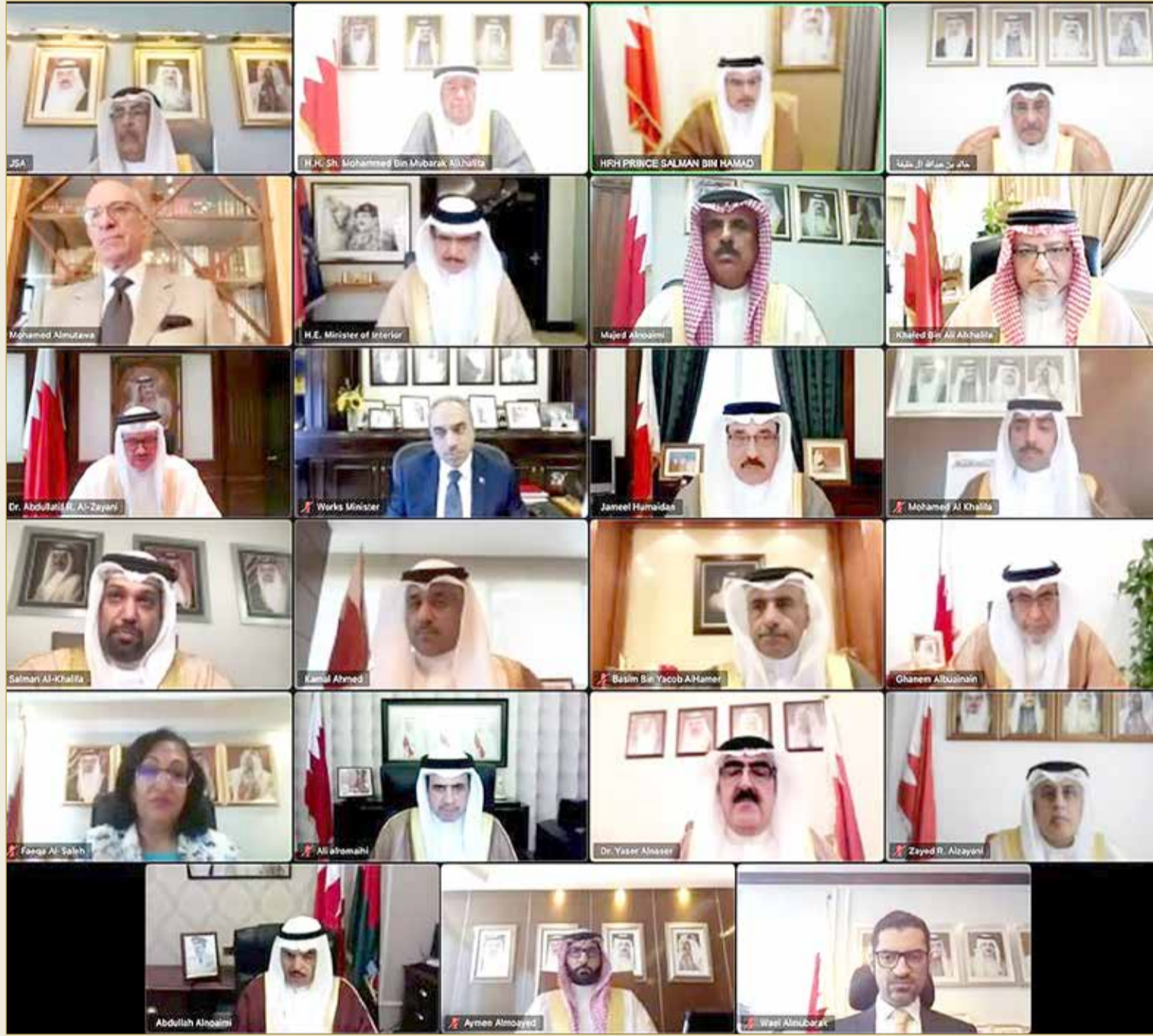
سمو ولي العهد يترأس جلسة مجلس الوزراء

مجلس الوزراء: كلمة جلالة الملك نقلت رسالتنا للعالم أن السلام ضمانة للشعب