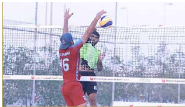
مستويات فنية جيدة بدوري الشواطئ

ملاعب الطائرة الرمالية تشهد منافسات قوية