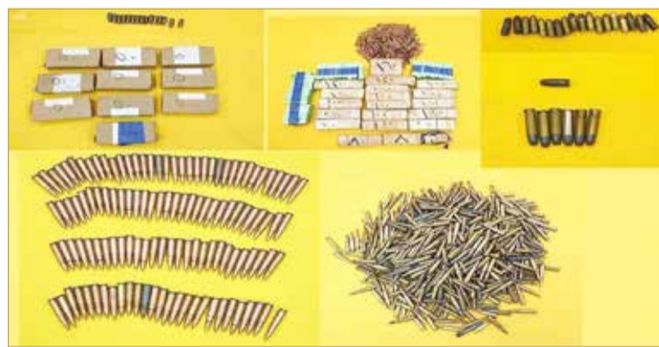
كمية من الأسلحة والمتفجرات المضبوطة مع الخلية الإرهابية

الـ "الخارجية" تطالب المجتمع الدولي بإجراءات حازمة ضد طهران