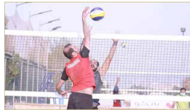
تنافس قوي بين الأندية المشاركة