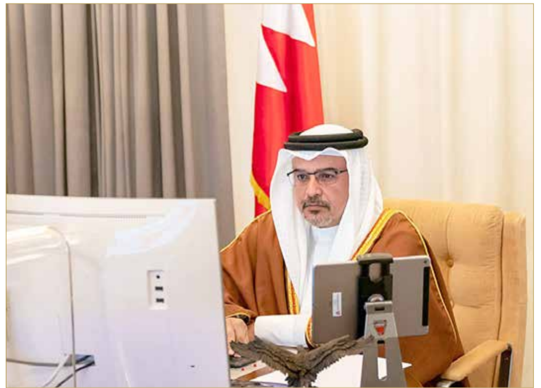
سمو ولي العهد يترأس جلسة مجلس الوزراء

تنفيذاً للتوجيهات الملكية السامية لعاهل البلاد صاحب الجلالة الملك حمد بن عيسى آل خليفة بتوحيد الجهود الوطنية على المستوى المحلي لمواجهة انعكاسات انتشار فيروس كورونا كوفيد - 19 عالمياً بما يحافظ على صحة وسلامة المواطنين والمقيمين بالتوازي مع استمرار برامج الدولة ومسيرة عملها تحقيقاً لمساعي التنمية المستدامة لصالح المواطنين، قرر مجلس الوزراء أن تتكفل الحكومة بدفع 50% من رواتب البحرينيين المؤمن عليهم في القطاع الخاص للمقطاعات الأكثر تضرراً لمدة 3 أشهر بدءاً من أكتوبر 2020، وسيستفيد منه 23 ألف عامل بحريني و4 آلاف منشأة. ورأس ولي العهد نائب القائد الأعلى النائب الأول لرئيس مجلس الوزراء صاحب السمو الملكي الأمير سلمان بن حمد آل خليفة، الاجتماع الاعتيادي الأسبوعي لمجلس الوزراء.