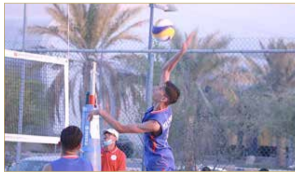
من منافسات دوري الشواطئ