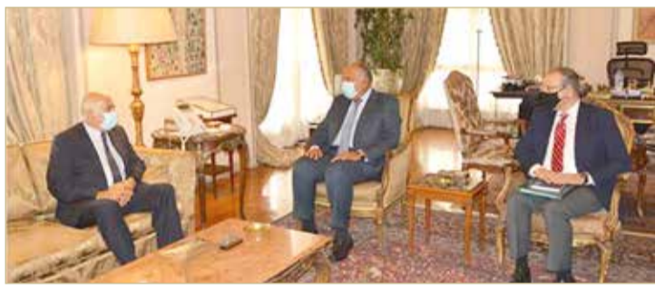
سامح شكري مجتمعًا بجبريل الرجوب وروحي فتوح

الحقوق المشروعة للشعب الفلسطيني وصولاً لإقامة الدولة الفلسطينية المستقلة على حدود الرابع من يونيو 1967 وعاصمتها القدس الشرقية". وإطلع المسؤولون الفلسطينيون، شكري على "المساعي الجارية لاستعادة اللحمة وإعادة توحيد الصف الفلسطيني". يأتي ذلك بعد أيام من اتفاق حركتي فتح وحماس على إجراء انتخابات تشريعية ورئاسية في غضون ستة أشهر.