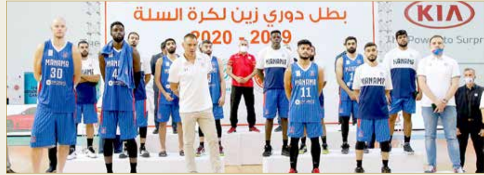
تتويج المركز الثاني فريق المنامة

◆ نهائي دوري زين لكرة السلة في مرصد ”البلاد سبورت“