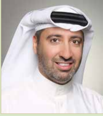
دعيح بن سلمان