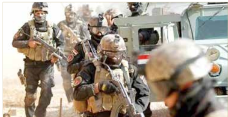
عناصر من الأمن العراقي