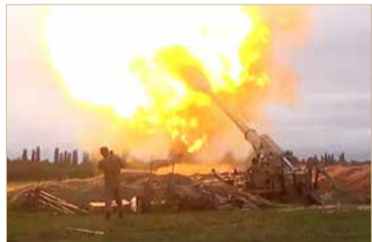
لقطة من المعارك المشتعلة في ناغورنو كاراباخ