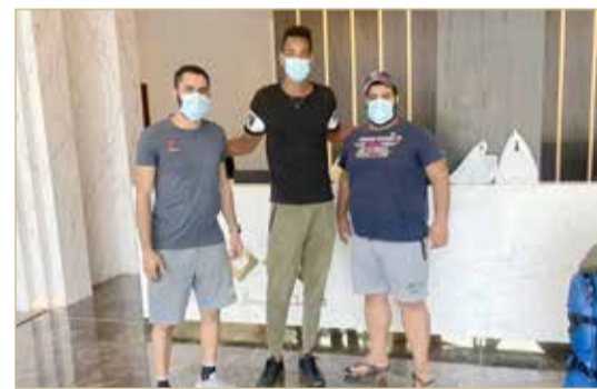
المحترف الكوبي لدى وصوله المملكة