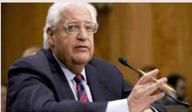
سفير الولايات المتحدة في إسرائيل ديفيد فريدمان

« أبوظبي - سكاى نيوز عربية : قال السفير الأميركي لدى إسرائيل ديفيد فريدمان، أمس الأحد، إن فوز جو بايدن بالانتخابات الرئاسية سيصب في مصلحة إيران. وذكر فريدمان، في حوار مع موقع "العين الإخبارية"، أن الديمقراطي بايدن كان جزءا من إدارة باراك أوباما التي أبرمت الاتفاق النووي مع إيران، الذي يعتبره ترامب "أسوأ صفقة دولية أبرمتها أميركا على الإطلاق". وأضاف "اتفاق أوباما أوجد مسارا لإيران لامتلاك سلاح نووي، ولم يفعل شيئا لكبح طهران عن نشاطها الخبيث في دعم الإرهابيين في سوريا ولبنان والعراق واليمن، ولم يفعل شيئا لكبح جماحها