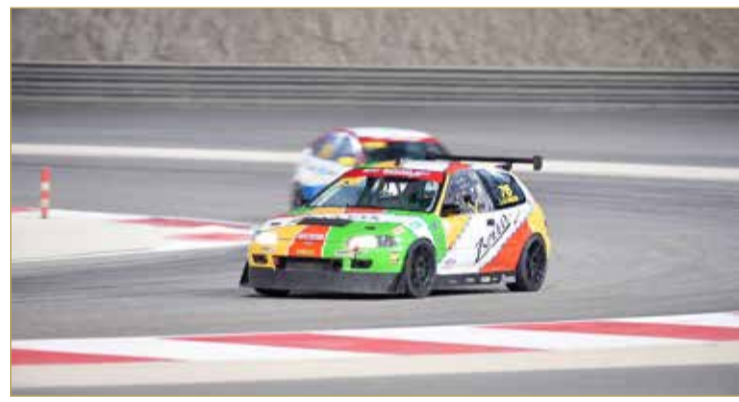
جانب من السباقات

59.983 و5.983 ثانية، وفي المركز الثاني تمكن ريفعي من التقدم للمركز الثاني بفارق 3.613 ثانية عن المركز الأول،