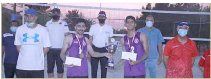
فريق داركليب البطل

◆ فاز على اتحاد الريف بالنهائي.. وبني جمرة ثالثا