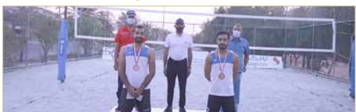
فريق بني جمرة الثالث

الثالث والنبيه صالح الرابع مستويات لافتة وعروضا متميزة كسبوا من خلالها احترام الجميع لتظهر لنا وجوه جديدة من لاعبي الكرة الطائرة الشاطئية والذين كانوا تحت مرصد الكابتن علي جعفر مدرب المنتخب الوطنية.