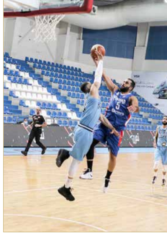
لقاء المنامة والرفاع

أنهى فريق المنامة الشوط الأول لصالحه بفارق 7 نقاط وبنتيجة (29/36) بعد مستوى متفاوت في الربعين الأوليين في الجانبين الدفاعي والهجوم، كما هو حال الرفاع أيضاً. الدقائق الأولى كانت مليئة بالسجال والندية، إلا أن المنامة أخذ بتوسيع الفارق لصالحه معتمداً