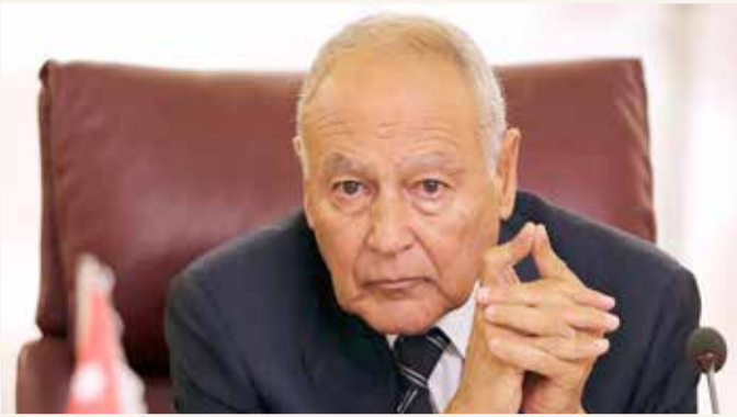
الأمين العام للجامعة العربية أحمد أبو الغيط

قال الأمين العام لجامعة الدول العربية أحمد أبوالغيط، في مقابلة مع صحيفة "الأخبار" المصرية، نشرتها السبت، إن المنطقة تمر بمرحلة ليس لها مثيل من حيث حجم التهديدات والتحديات، خصوصا التدخلات الإقليمية من جانب إيران وتركيا.