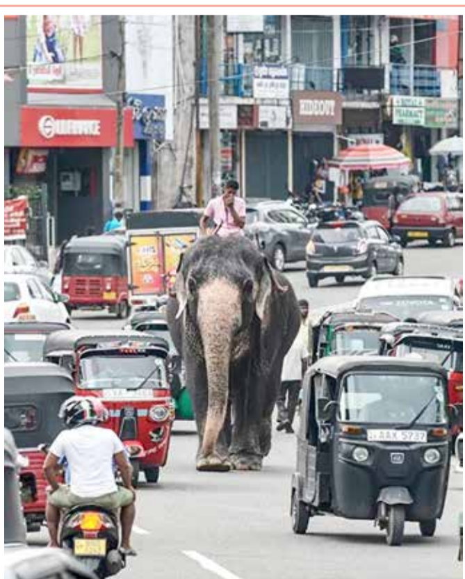
فيال يقود فيلا وسط حركة المرور في أحد شوارع بيلياندا، إحدى ضواحي العاصمة السريلانكية كولومبو

في عملية دقيقة وحساسة، تمت تحت حراسة مشددة، نقل البنك المركزي الهولندي مخزونه المحلي من الذهب، وهو 14 ألف سبيكة وزهاء ألف صندوق من العملات الذهبية، من مقره في أمستردام، إلى خزينة ضخمة بمدينة هارلم القريبة. وإلى جانب السبائك التي تبلغ قيمتها 10 مليارات يورو (11.7 مليار دولار)، نقل البنك سندات بقيمة 4.5 مليارات يورو أخرى (5.3 مليارات دولار) في العملية التي قادتها الشرطة العسكرية الملكية الهولندية. وتم نقل الذهب والذهب حوالي 20 كيلومترا في شاحنات، حرسها الشرطة العسكرية المسلحة، وسط طوابير من الدراجات النارية التابعة للشرطة، وتحت رقابة مروحية تابعة للشرطة حلقت في سماء المنطقة.