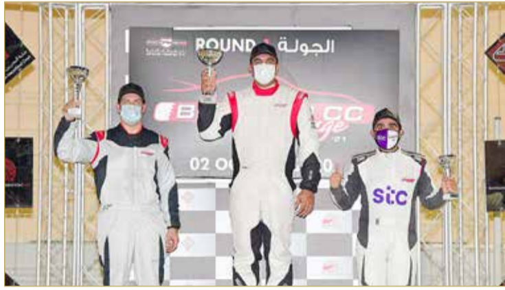
جانب من التتويج

في بطولة تحدي حلبة البحرين الدولية "2000 سي سي"