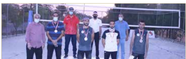
فريق اتحاد الريف الثاني