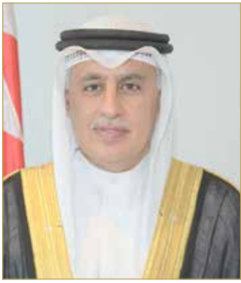
وزير الصناعة والتجارة والسياحة

الوطني. كما قدر الوزير الأوامر الملكية بإنشاء صندوق يستثمر ويدعم طاقات وطموحات وابتكارات الشباب البحريني، حيث إن الاستثمار فيهم هو الاستثمار الناجح للمستقبل المزدهر، منوها بأهمية مواصلة العمل على خلق الفرص النوعية أمامهم عبر تحفيز مشاركتهم الفعالة كقوة عمل وبناء تسهم في التطوير الإيجابي لهضنتنا الوطنية. وأشاد وزير الصناعة والتجارة والسياحة بتوجيه جلالته المؤسسات الاستثمارية في القطاعين العام والخاص بتوجيه رؤوس أموالها على المجالات التنموية ذات القيمة المضافة، وأن التشريعات والقوانين في البحرين تحفظ حقوق الجميع في ظل الدستور والقانون، تعزيزاً لمشاركتهم الفعالة في التطوير الإيجابي وهي أولوية تستدعي أقصى درجات التعاون بين السلطين التشريعية والتنفيذية.