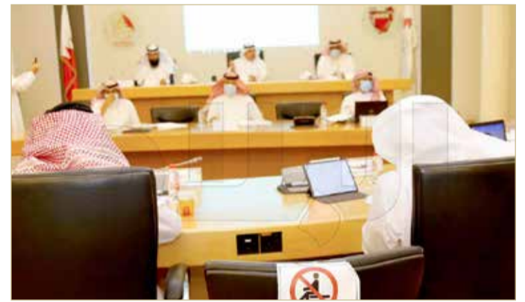
تبادل اجتماعي بقاعة المجلس البلدي

وأشار إلى أن تحقيق المشروع الذي سيرفع المعاناة عن الأسر البحرينية التي كانت على قوائم الانتظار سيصعب في ارتقاء مساكنهم وتطويرها، عبر رصد 50 ألف دينار لترميمها. وأكد أن المجلس يطلب سنوياً تخصيص ميزانية لمشروع ترميم البيوت الآيلة للسقوط. وأردف أن جائحة كورونا تعد تحدياً أمام العديد من المشاريع ومنها مشروع الترميم.