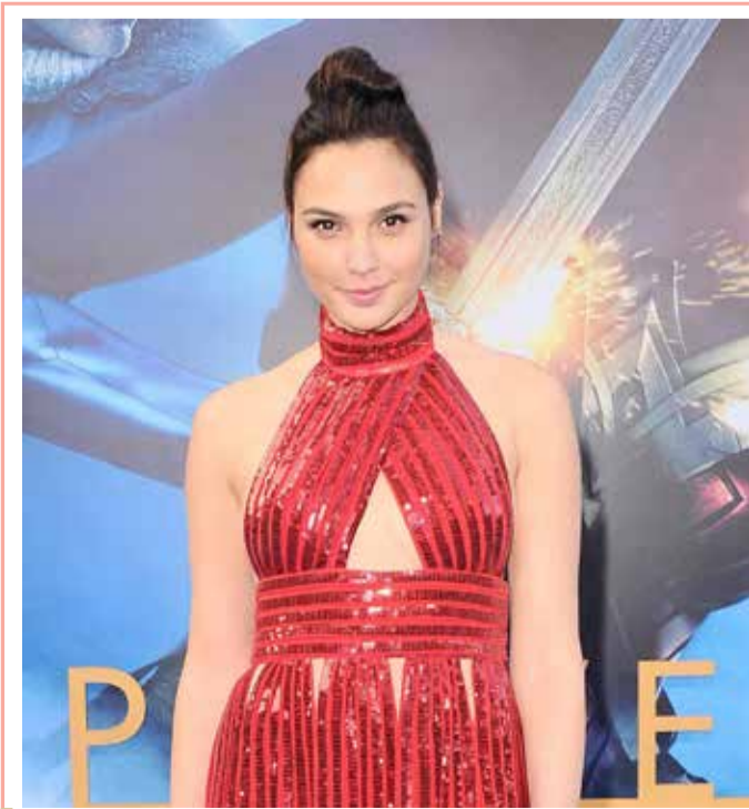
أثارت الممثلة الإسرائيلية جال جادوت، ضجة على مواقع التواصل الاجتماعي، بعد إعلانها تجسيد شخصية الملكة الفرعونية "كليوباترا" على شاشة السينما. وأشارت جادوت، إلى أنها ستعاون في الفيلم مع المخرجة باتي جنكنز، التي سبق وأن أخرجت لها فيلم البطلة الخارقة "واندر وومان"، الذي كان سبباً في شهرتها المدوية حول العالم.

نفتت الآلاف من حيوانات المنك في مزارع الفراء، في يوتا وويسكونسن الأميركييتين، بعد سلسلة من تفشي فيروس كورونا، في الأسابيع القليلة الماضية. في ولاية يوتا، فقد مربّي الماشية ما لا يقل عن 8000 من المنك؛ بسبب "كوفيد 19" بين الحيوانات الشهيرة بالفراء الحريري الفاخر، حسبما نقلت شبكة "سي إن إن". يوم الجمعة، قال كيفن هوفمان، المتحدث باسم وزارة الزراعة والتجارة وحماية المستهلك في ولاية ويسكونسن، إن 2000 منك ماتت، بسبب فيروس كورونا في إحدى المزارع. وقال هوفمان في بيان "إن المسؤولين فرضوا الحجر الصحي على المزرعة، ما يعني أنه لا يجوز للحيوانات أو المنتجات الحيوانية مغادرة مقر مقاطعة تايلور".