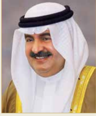
سمو الشيخ علي بن خليفة

وأعرب سمو نائب رئيس مجلس الوزراء عن أصدق التهاني إلى صاحب الجلالة الملك بمناسبة افتتاح دور الانعقاد الثالث من الفصل التشريعي الثاني لمجلسي الشورى والنواب، والذي يشكل صفحة جديدة في كتاب الديمقراطية الوطنية التي يفخر الجميع اليوم بما وصلت إليه من نضج وتطور في ظل العهد الزاهر.