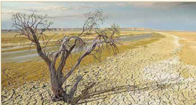
أودت الكوارث بحياة 1,2 مليون شخص خلال العقدين الماضيين

فضلًا عن تقديم مساعدات مالية للدول النامية. وفي سنة 2016، جرى توقيع اتفاق باريس للمناخ، من أجل خفض ما يعرف بمعدل "الاحتراق" في العالم إلى أقل من 2%، فضلاً عن حصره في 1.5%. ويقوم الاتفاق الأكبر من نوعه، على إعادة رسم الأهداف كل 5 سنوات، المخاطر.