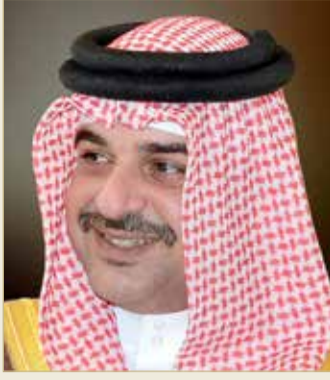
سمو الشيخ عبدالله بن حمد

وأكد سموه أن المجلس الأعلى للبيئة يولي أهمية فائقة لارتفاع منسوب مياه البحر، ويرصد مناطق ارتفاع موج البحر، وتحليل الأسباب المؤدية لهذا الارتفاع، حيث قام المجلس بتحديد المناطق المتأثرة بارتفاع منسوب مياه البحر، ويتم الآن تحديد المناطق بصورة تفصيلية ووضع التوصيات اللازمة للتخفيف من تأثير ارتفاع منسوب مياه البحر.