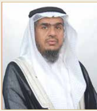
رئيس ديوان الخدمة المدنية

وأضاف أن جلالته الملك حرص في خطابه السامي على تقديم الشكر والتقدير للقوات المسلحة الدفاعية والأمنية لما تحمله من مسؤوليات وطنية ذات أهمية بالغة تمتاز بالكفاءة والحرفية العالية والتفاني في خدمة الوطن والحفاظ على وحدته واستقراره، منوهاً بإشادة جلالته بالروح الوطنية الأصيلة للشعب الوفي، التي تمثلت في استمرار بذلهم وعطائهم وولائهم لوطنهم، مشيراً إلى أن الخطاب السامي خص بالذكر الكوادر الطبية والصحية العاملة في الصفوف الأولى وهو ما من شأنه رفع معنويات الكوادر المخلصة لوطنها التي تبذل كل وقتها وجهدها وطاقاتها في خدمة المواطنين.