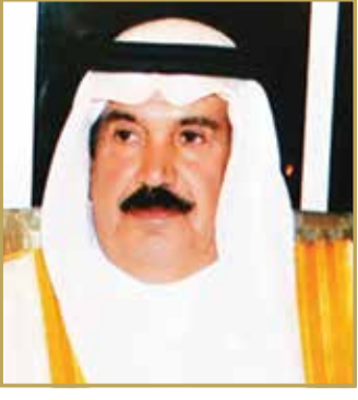
الشيخ دعيج بن سلمان