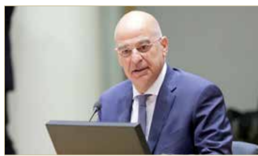
وزير الخارجية اليوناني نيكوس ديندياس

وأضاف الوزير أنه أوضح لنظرائه الأوروبيين "أن القاسم المشترك في كل المواقف الإشكالية في المنطقة، كقره باغ، وسوريا، والعراق، وقبرص، وجنوب شرق البحر الأبيض المتوسط.. القاسم المشترك هو تركيا". وأضاف: "تركيا تعمل كمخرب للسلام والاستقرار في المنطقة، وتعمل ضد القانون الدولي". ودانت وزارة الخارجية اليونانية، أمس، قرار تركيا إعادة سفينة تنقيب إلى شرق المتوسط كانت محور نزاع بين البلدين بشأن حقوق استكشاف موارد الطاقة. من جانبه قال رئيس الوزراء اليوناني كريكوس ميتسوتاكيس في مقابلة الاثنين مع صحيفة "تا نيا" اليونانية جرت قبل إعلان