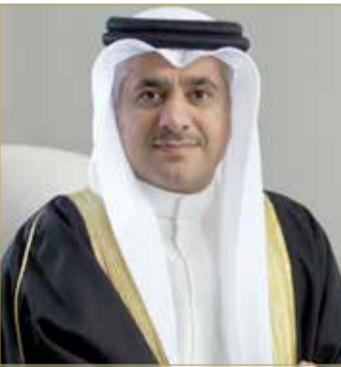
وزير المواصلات والاتصالات

الحركة التنموية في المملكة باعتبارهم الثروة الحقيقية للبلاد والرهان المضمون للمستقبل. واختتم وزير المواصلات والاتصالات تصريحه بتقديم عظيم الشكر الوافر والامتنان لجلالة الملك على خطابه السامي، مؤكداً تطلع السلطين التنفيذية والتشريعية لتنفيذ برامج طموحة تتوافق مع ما جاء من تطلعات كبيرة في خطاب عاهل البلاد.