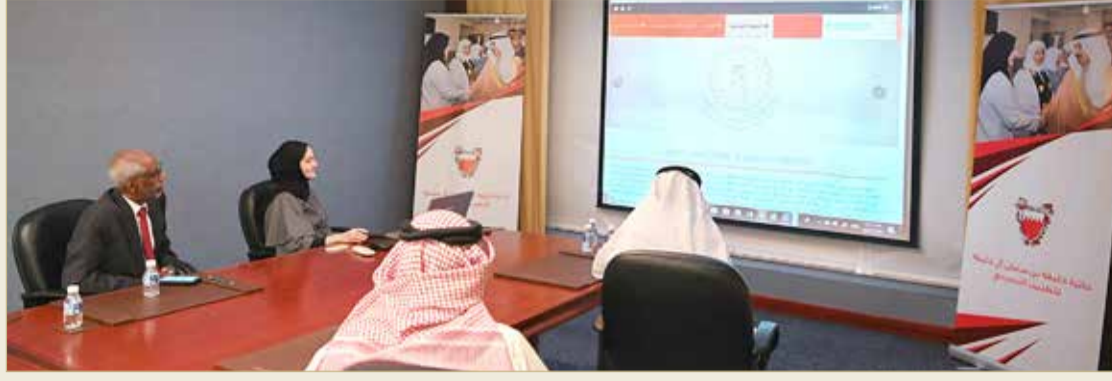
تدشين الموقع الإلكتروني لجائزة خليفة بن سلمان آل خليفة للطبيب البحري

الأبحاث المقدمة لنيل الجائزة عن فئتها الأولى مع المعايير الموضوعية، بالإضافة لدراسة طلبات الترشيح لنيل الجائزة عن فئتها الثانية، علماً بأن الجائزة تتكون من درع وشهادة ومكافأة مالية لكل فائز في الفئتين بمجموع 200 ألف دولار.