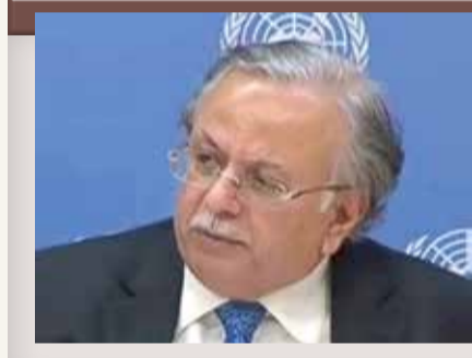
السفير عبدالله المعلمي

جهود المبعوث الأممي لليمن، مؤكداً أنه لا فائدة من الحوار مع إيران وهي تمارس التخريب. وتدعم إيران مليشيات موالية لها كحزب الله في سوريا، والحشد الشعبي في العراق، والحوثيين في اليمن وغيرها في سوريا.