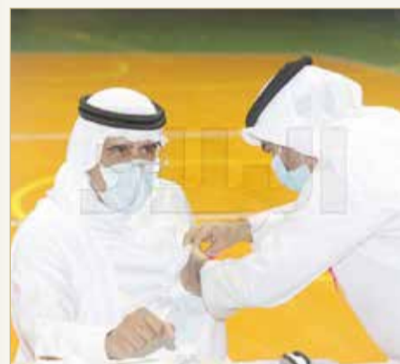
تثبيت الشريطة الوردية بشهر التوعية بسرطان الثدي

لحل مشكلات الجيران من وقوف سياراتهم أمام المنازل