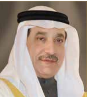
وزير العمل والتنمية الاجتماعية

المنامة - بنا أشاد وزير العمل والتنمية الاجتماعية جميل حميدان بمضامين الخطاب السامي لعاهل البلاد القائد الأعلى صاحب الجلالة الملك حمد بن عيسى آل خليفة لدى تفضل جلالته برعاية افتتاح دور الانعقاد الثالث للمجلس الوطني. وقال في تصريح صحفي بالمناسبة "إن الخطاب السامي يعد نموذجاً يحتذى به لفتح آفاق طموحة لمستقبل بلادنا والتطلع لوطن عصري مزدهر يلي طموح الجميع، إذ بعد الخطاب السامي خريطة طريق تتسجم مع تطلعات ورؤى مملك البحرين في الفترة المقبلة، والتي تجعل من الوطن والمواطن محوراً للتطلعات وفق برامج طموحه تسهم حقاً في