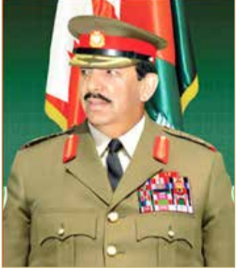
القائد العام لقوة دفاع البحرين

بصحته وسلامته، ستساهم في التخفيف من عبء كاهل المواطن جراء تداعيات الوباء الذي يمر به العالم. ودعا القائد العام لقوة دفاع البحرين أن يديم على جلّالته نعمه الأمن الصحة والسعادة وطول العمر وأن يديم جلالته الملك ذخرًا وسندًا لمسيرة التقدم والازدهار ويسدد على طريق الخير خطاه.