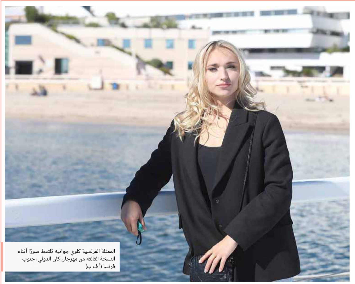
الممثلة الفرنسية كلوي جوانيه تلتقط صوراً أثناء النسخة الثالثة من مهرجان كان الدولي، جنوب فرنسا