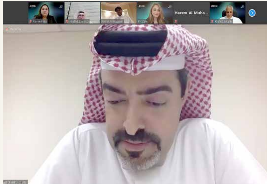
الشيخ عبدالله بن خالد

استضافت زين البحرينية وبشكل افتراضي، النسخة الخامسة من مبادرة “زينوفيت” بالشراكة مع شركة الكري، وهي شركة تعني بالمؤسسات المبتدئة ويقع مقرها في البحرين، وشبكة عقال، وهي شبكة رائدة تعمل في مجال ترتيب ملتقيات الاستثمارات الرقمية للمستثمرين الملائكة (Angel Investors) في السعودية و أول فرع لها في البحرين. وتعد مبادرة “زينوفيت”، التي انطلقت في العام 2019، بمثابة المنصة الاستراتيجية التي تدعم زين من خلالها، وبالتعاون مع شريكها الكري وعقال الشركات الناشئة في البحرين من خلال مساعدتها على النمو والتطور والاستدامة.