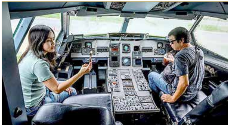
وكانت الخطوط الجوية السنغافورية أعلنت عن خسارة فياسية بلغت 827 مليون دولار حتى يونيو الماضي، وقامت بالاستعانة عن 20% من قوتها العاملة بسبب جائحة كورونا.

أعلنت شركة الخطوط الجوية السنغافورية تحويل طائرتين من طراز "A380" متوقفتين إلى مطاعم مؤقتة، في خطوة لربح بعض الأموال بعد تعليق الرحلات؛ بسبب فيروس كورونا. ووفقاً لصحيفة "ذا بيزنيس تايمز"، فإن شركة الطيران أكدت أن جميع المقاعد في مطعمها المؤقتة تم حجزها في غضون 30 دقيقة من الإعلان عنها، مبينة أن نحو نصف المقاعد في كل طائرة ستكون متاحة، بما يتماشى مع إرشادات السلامة في المطاعم بشأن المسافة الآمنة. وتبلغ تكلفة الغذاء لمدة 3 ساعات 50 دولاراً سنغافورياً في المقصورة الاقتصادية، و90 دولاراً سنغافورياً لأولئك الذين يرغبون في الجلوس في المقصورة الاقتصادية الممتازة، و300 دولاراً سنغافورياً لدرجة رجال الأعمال و600 دولاراً سنغافورياً للأجنحة.