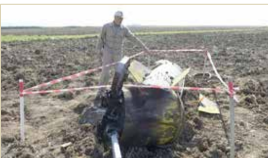
انتهاكات متبادلة بانتهاك الهدنة بين أرمينيا وأذربيجان