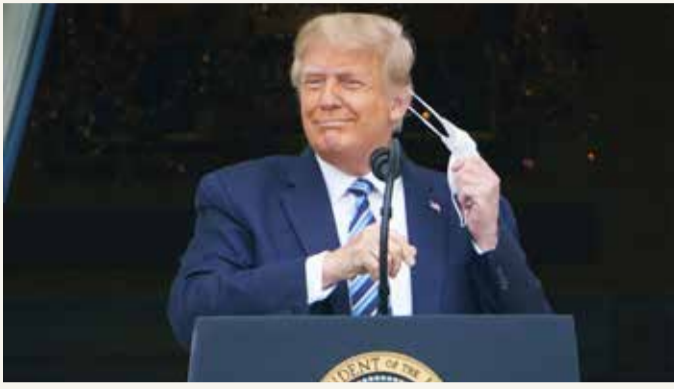
الرئيس الأميركي دونالد ترامب

هاجم الرئيس الأميركي دونالد ترامب الرئيس الأسبق باراك أوباما ومنافسوه المرشح الديمقراطي جو بايدن من جديد، واصفاً عهد حكمهما بالمريع. وطلب ترامب عبر تغريدة نشرها على حسابه في "تويتر" من الأميركيين استذكار أنه لم يكن ليكون رئيساً للولايات المتحدة لو قام أوباما وبايدن بعملهما ولم يكونا مريعين في الحكم.