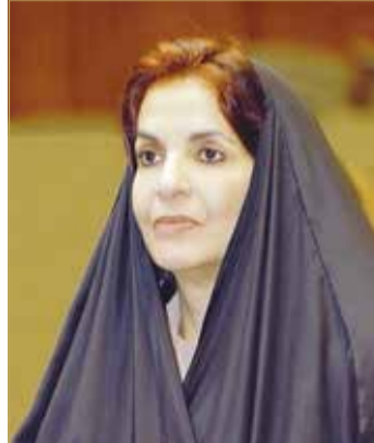
سمو الأميرة سبيكة بنت إبراهيم

ويكل فخر، قصة نجاح وطنية ذات تأثير دولي، وذلك بتوفيق من الله، وبفضل الرعاية المتواصلة لقائد مسيرة الخير والرخاء، عاهل البلاد صاحب الجلالة الملك حمد بن عيسى آل خليفة، وللدعم والمساندة الكريمة لحكومته. في الختام كررت قرينة عاهل البلاد المفدى شكرها وتقديرها على ما تفضلت به رئيس مجلس النواب من رأي مقدر تجاه نساء الوطن وهي مشاعر تحملها النفس تجاه كل امرأة بحرينية تجعل من خدمة بلادها واستقرار مجتمعتها وأسررتها هدفاً سامياً لا تحيد عنه في مسيرة عطائها الوطني.