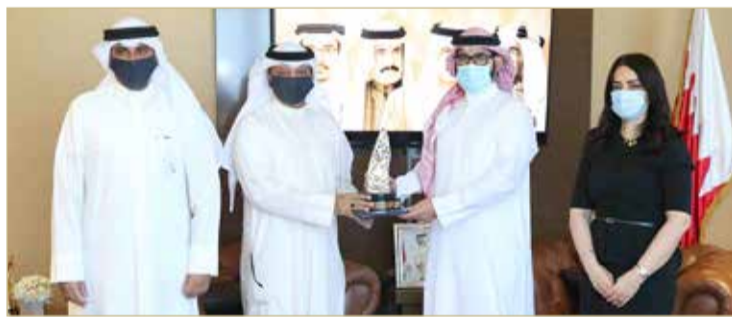
أثناء تسليم الجائزة

لمواجهة تداعيات فيروس كورونا على القطاع الشبابي والرياضي، والعمل على مراقبة تنفيذ القطاعات الشبابية والرياضية كافة لتلك الاحترازاات بصورة مستمرة، معرباً عن سعادته باختيار وزارة شؤون الشباب والرياضة ضمن المؤسسات الحكومية التي حظيت بالتكريم في جائزة سمو الشيخ عيسى بن علي آل خليفة للعمل التطوعي. وأشاد وزير شؤون الشباب والرياضة بالجهود الكبيرة التي يبذلها رئيس وأعضاء جمعية الكلمة الطبية ودورها البارز في العديد من المجالات، خصوصاً جوانب تعزيز العمل التطوعي في المجتمع البحريني.