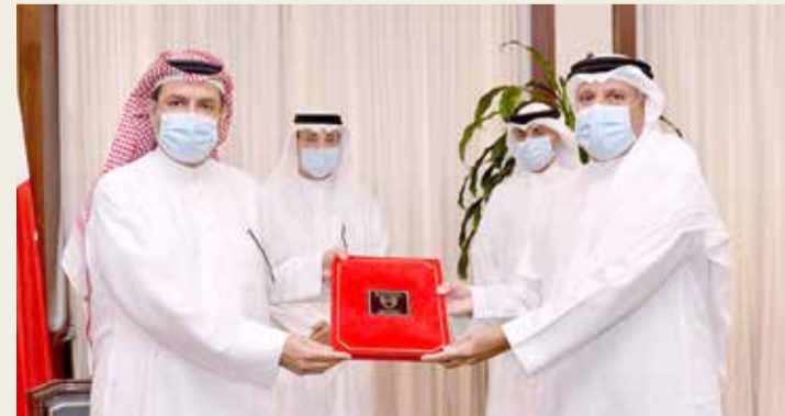
عقب توقيع مذكرة التفاهم

فرص العمل أمامها، خصوصاً وأن قطاع أمن المعلومات يرتبط بشكل مباشر مع التقنيات الحديثة التي تشكل عماد الثورة الصناعية الرابعة مثل الذكاء الصناعي وإنترنت الأشياء والحوسبة السحابية وغيرها. وأوضح أن هذه المبادرة لا تهدف فقط إلى تشجيع الناشئة والخريجين على دراسة اختصاصات ذات صلة بأمن المعلومات، وإنما إلى رفع مستوى وعي مختلف شرائح المواطنين بأهمية الخصوصية على شبكة الإنترنت والحفاظ على أمن معلوماتهم وبياناتهم، خاصة مع التوسع في الخدمات الحكومية الرقمية والتحويلات المالية في ظل الأوضاع الراهنة.