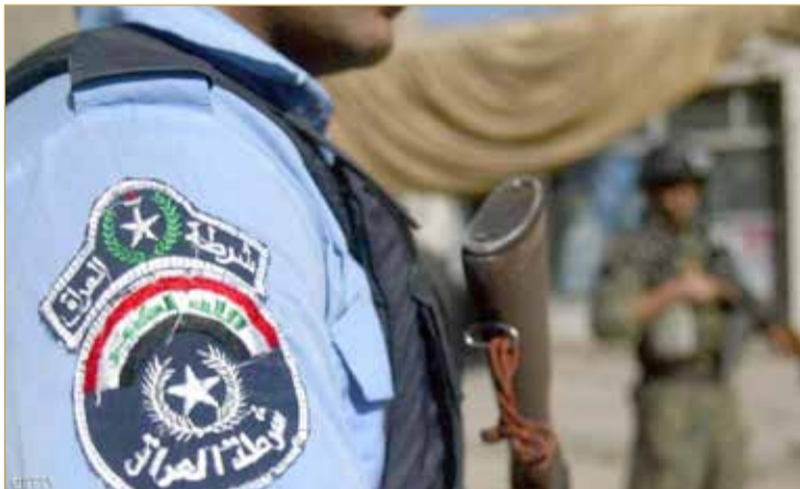
عنصر من الشرطة العراقية

وفي اجتماع طارئ للمجلس الوزاري للأمن الوطني، الذي رأسه الكاظمي دان المجلس "الاعتداء الإرهابي" في قضاء بلد بمحافظة صلاح الدين.