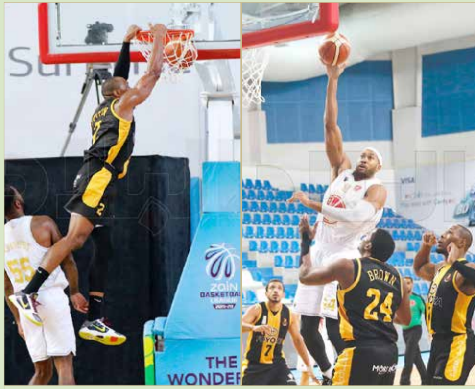
لقاء الأهلي والمحرق