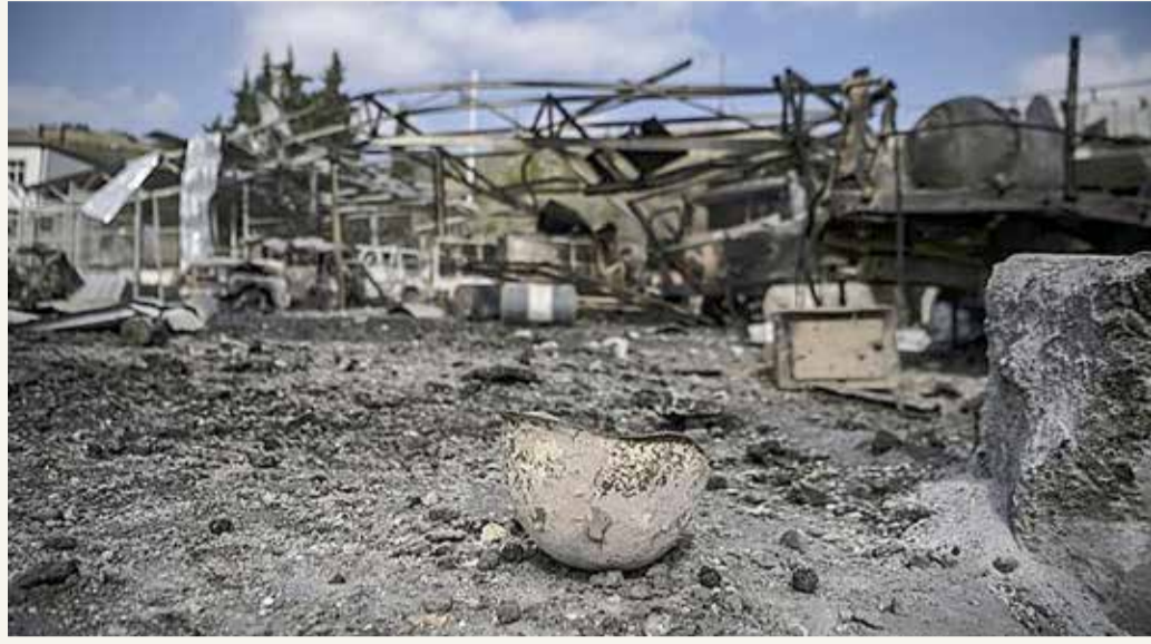
الصراع يندب بكارثة إنسانية

عقب مقتل 13 مدنياً واصابة أكثر من 40 في مدينة كنجه