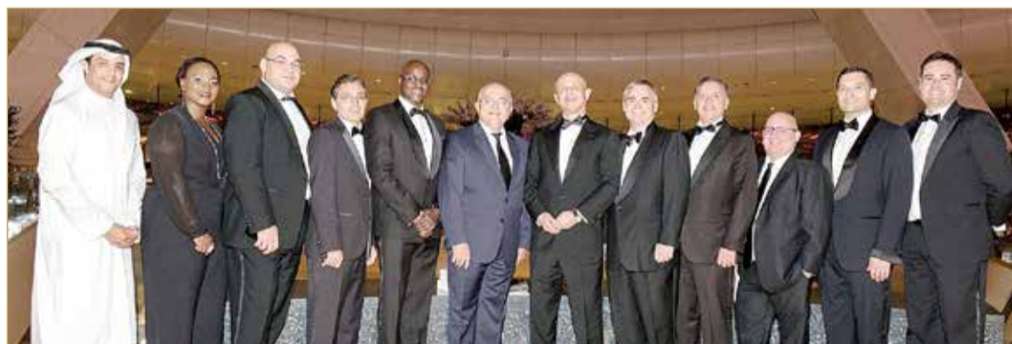
الحضور في الاحتفال بالجائزة

تضمنت تحويل خيارات الأسهم بين شركتي “Careem” و”Uber”