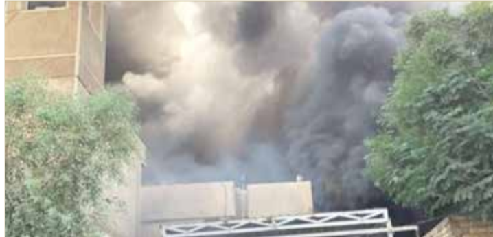
بغداد - وكالات

تنديدا بانتقادات زيباري للفصائل الموالية لإيران