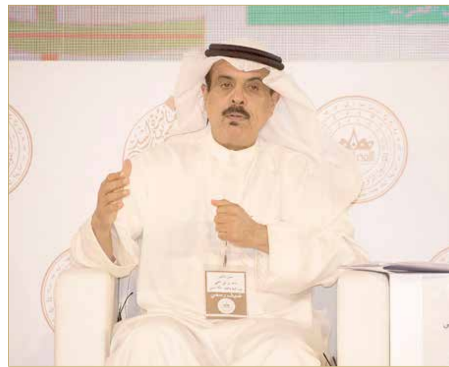
وزير التربية والتعليم

ويبين أن الهيكل الجديد جاء بعد مرور أكثر من 16 سنة ونتيجة للتطورات والتغيرات العديدة التي كان من الضروري النظر مجدداً في تطوير ومراجعة هذا الهيكل، بما يستجيب لتلك المستجدات والبرامج التطويرية والطموحات العديدة. (06)