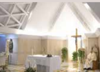
الفاتيكان - وكالات

أعلن الفاتيكان أمس اكتشاف إصابة بكوفيد - 19 في بيت القديسة مرتا، مقر إقامة البابا فرنسيس. وقال مكتب الإعلام في الكرسي الرسولي إنه "تم اكتشاف حالة إيجابية أخرى بكوفيد-19 لشخص من بين سكان دولة الفاتيكان. ووضع المصاب الذي لا يزال من دون عوارض حتى الساعة، في العزل على غرار كل من كانوا على احتكاك مباشر معه". وأضاف أنه "غادر مؤقتاً بيت القديسة مرتا حيث يقطن عادة". في المقابل، لم يُذكر أي تفصيل عن الوضع الصحي للبابا فرنسيس الذي فضل عند انتخابه السكن في بيت