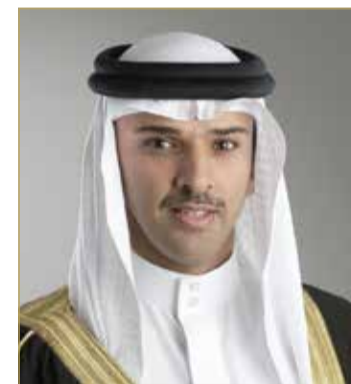
الشيخ علي بن خليفة

◆ بمناسبة إنجاز سباق نصف الماراتون الدولي