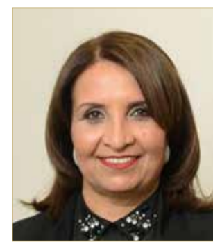
الشيخة حياة بنت عبدالعزيز

رئاسة اتحاد الطاولات قدمت الشيخة حياة بنت عبدالعزيز آل خليفة التهاني والتبريكات إلى سمو الشيخ ناصر بن حمد آل خليفة ممثل جلالة الملك للأعمال الإنسانية وشؤون الشباب رئيس المجلس الأعلى للشباب والرياضة وإلى سمو الشيخ خالد بن حمد آل خليفة النائب الأول لرئيس المجلس الأعلى للشباب والرياضة رئيس اللجنة الأولمبية البحرينية؛ بمناسبة فوز مملكة البحرين بالمركز الأول عالمياً في تنظيم سباق نصف الماراتون الدولي الذي أقيم في شهر مارس العام 2019. وأكدت الشيخة حياة بنت عبدالعزيز آل خليفة أن هذا الإنجاز يعكس الاهتمام الذي يقدمه سموها للرياضة البحرينية وحرص سموها على تقديم كامل الدعم للقطاعين الشبابي والرياضي في المملكة، حيث جسّد هذا الإنجاز مكانة مملكة البحرين على خارطة الدولية وأكد بأن المملكة وجهة