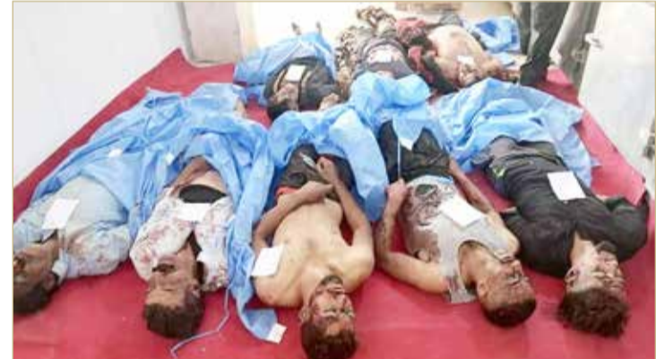
الصحيا اختطفوا أمس مع 4 آخرين

رئيس الوزراء يبعث وفداً أمنياً لمحافظة صلاح الدين