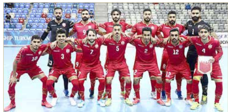
منتخب كرة الصالات

◆ الاتحاد القاري يرحلها إلى العام المقبل