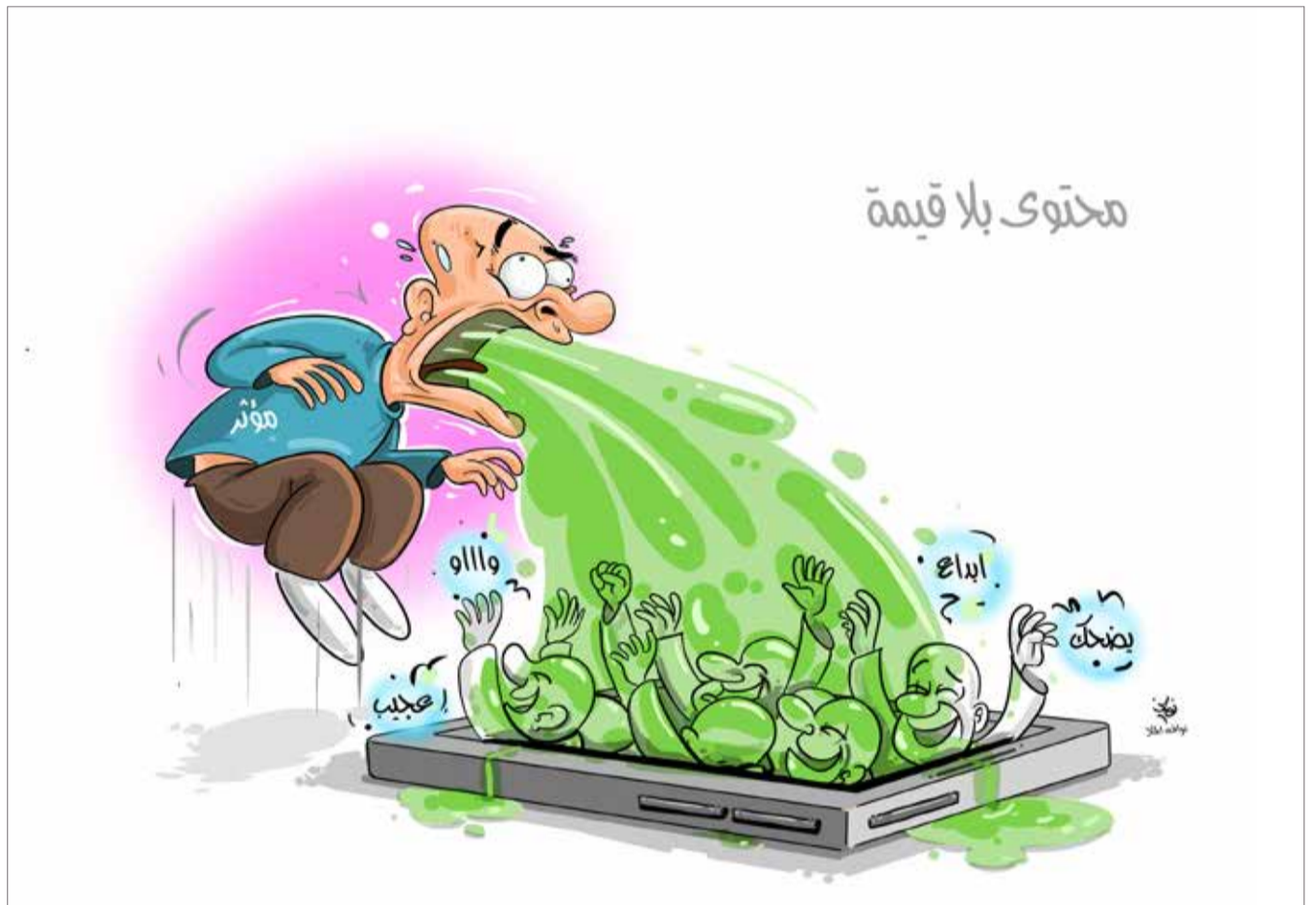
كاركاتير فاخف الممل البلاد

إن كلمة نجاح تأتي في مقدمة المسائل عند المرأة البحرينية التي شاهداها العالم وكل من يتأمل التاريخ العربي بقوة عزميتها وتصميمها على احتلال موقع أفضل في كل ميادين الحياة والمساهمة مع الرجل في ردف الحضارة الإنسانية وإغنائها، فالمرأة البحرينية عبر التاريخ كسبت الرهان في كل المجالات وشاركت بفعالية في بناء المجتمع وتطوره وتحقيق أهدافه المستقبلية وتحمل المسؤولية، فكانت