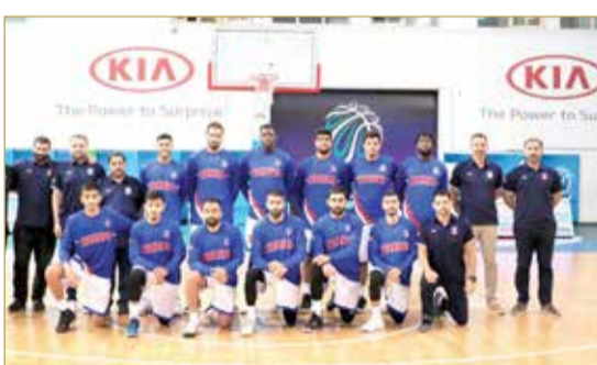
فريق المنامة لكرة السلة

اليوم نهائي كأس خليفة بن سلمان لكرة السلة