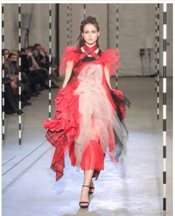
زي مبتكر للمصممة الليتوانية ديانا بوكستيت في مهرجان الموضة في فيلنيوس، ليتوانيا