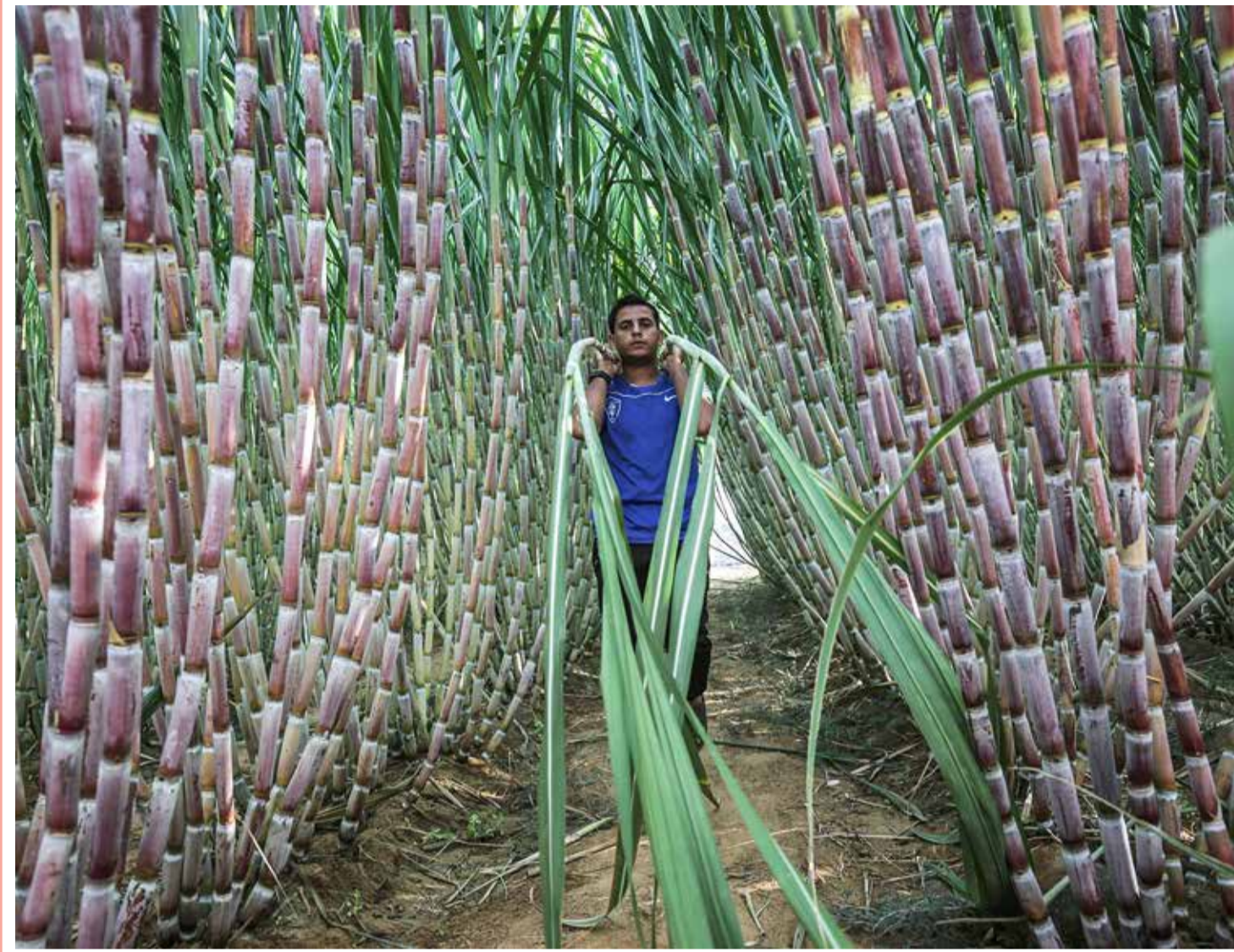
فلسطيني يحمل سيقانها في مزرعة قصب السكر في مدينة خان يونس جنوب قطاع غزة

إدارة التحرير: +973 17111444 / +973 17111467 / 385 @local @albiladpress.com / 2008 / تصدر عن دار البلاد للصحافة والنشر والتوزيع / س ت 67133 / تطبع في مؤسسة الأبرام للنشر / قسم الإعلانات: 508 / +973 17111501 / 32224492 / 39615645 / +973 17580939 / الاشتراكات والتوزيع: +973 17111432 / +973 17111434