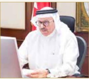
وزير الخارجية يشارك في المنتدى

قال وزير الخارجية عبداللطيف بن راشد الزياني إن مملكة البحرين على ثقة بأنها اتخذت الخطوة الأولى نحو واقع جديد للشرق الأوسط، قائم على التعاون وليس المواجهة، وعلى الاندماج معاً وليس العداء، على السلام والوثام والتعايش؛ الأمر الذي يعطي زخماً جديداً نحو حل الصراع الفلسطيني الإسرائيلي الذي عصف بالمنطقة لعقود عديدة، ويفتح الباب أمام الجهود المشتركة لتحقيق السلم والاستقرار والازدهار لجميع شعوب المنطقة، مؤكداً أن هذا النهج الطموح من شأنه أن يوفر فرصاً جديدة لزيادة النشاط والتبادل التجاري بين دول المنطقة، ولتسخير إمكانيات شبابنا والموارد الطبيعية في المنطقة لتحقيق الازدهار الدائم والتنمية في جميع