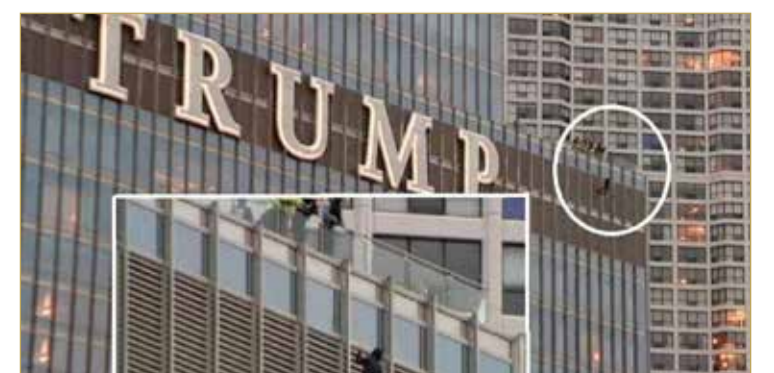
يبلغ ارتفاع برج ترامب في وسط مدينة إلينوي بشيكاغو حوالي 423 مترا وتقدر قيمته بـ 847 مليون دولار، وتم الانتهاء منه في عام 2009.

تداولت وسائل إعلام أميركية، مقطع فيديو لرجل يتدلى بحبل من أعلى برج الرئيس الأميركي دونالد ترامب في شيكاغو. الرجل الذي وصف بأنه "آسيوي"، هدد بالانتحار إذا لم يتحدث إلى الرئيس الأميركي ووسائل الإعلام. ويتسلح الرجل بسكين وأكد أن سيقطع الحبل إذا لم تلب مطالبه. ويتدلى الرجل الآسيوي من شرفة الطابق 16 في المبنى المكون من 98 طابقا، منذ السادسة مساء الأحد بالتوقيت المحلي. وتعمل فرق من قوات التدخل السريع ووحدة من مشاة البحرية إلى جانب الشرطة المحلية من أجل إنقاذ الرجل. وتُظهر اللقطات الرجل معلقا بجوار كلمة "ترامب" المرسومة على مقدمة المبنى، وفقا لصحيفة "ميور" البريطانية.