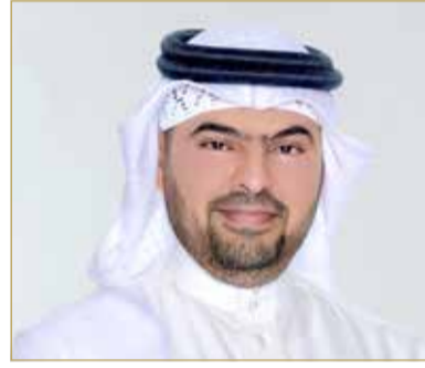
الشيخ مشعل بن محمد

والمهارات العلمية والكفايات الأساسية في العلوم الشرعية والعلوم المساندة وتأهيلهم لخدمة المجتمع، وربط المجتمع البحريني بترائه وثقافته العربية والإسلامية وتعريفه بالثقافات الأخرى لدعم التواصل والحوار.