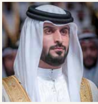
سمو الشيخ ناصر بن حمد

أكد أن اسم البحرين بات بارزاً في الدوريات الأوروبية