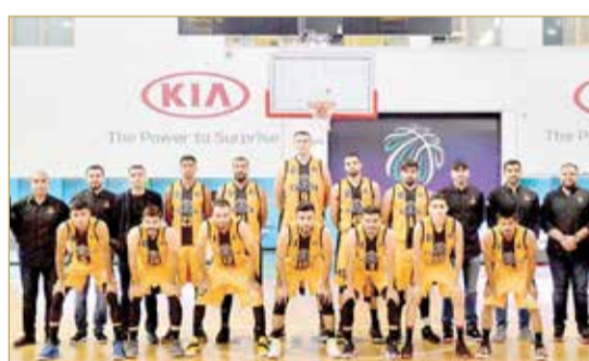
فريق الأهلي لكرة السلة