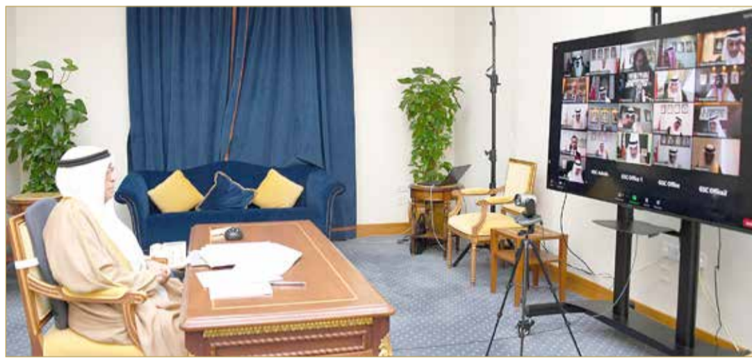
سمو الشيخ محمد بن مبارك مترسا الاجتماع الاعتيادي الأسبوعي لمجلس الوزراء

أقر مجلس الوزراء عدداً من الاتفاقات ومذكرات التفاهم بين مملكة البحرين ودولة إسرائيل لإقامة علاقات دبلوماسية والتعاون بين وزارتي الخارجية والمالية في البلدين بالإضافة إلى التعاون التجاري والاقتصادي والخدمات الجوية والزراعة ومجال الاتصالات وتكنولوجيا المعلومات والبريد. ورأس نائب رئيس مجلس الوزراء سمو الشيخ محمد بن مبارك آل خليفة الاجتماع الاعتيادي الأسبوعي لمجلس الوزراء الذي عقد صباح أمس. ورحب مجلس الوزراء بانخفاض أعداد الحالات القائمة اليومية لفيروس كورونا بنسبة بلغت 45% خلال أربعة أسابيع، واعتبرها المجلس خطوة تعكس الالتزام المجتمعي ووعي أفراد