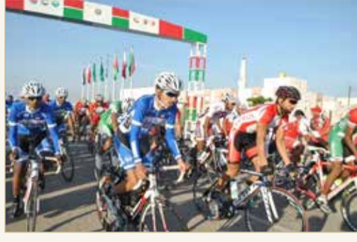
إحدى بطولات الخليج للدراجات الهوائية