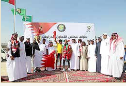
بطولة طواف مجلس التعاون (أرشيفية)

الأولمبياد الخليجي ربما يشهد أول نشاط بعد الجائحة