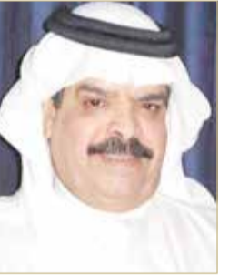
الشيخ أحمد بن سلمان