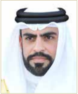
الشيخ عبدالله بن راشد