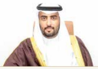
الشيخ نايف بن خالد

حيث سيتم عرض أحدث المنتجات والحلول المبتكرة في مجال المشتريات الإلكترونية وعمليات الشراء الاستراتيجي وإدارة الفئات وإدارة الإنفاق، والتحول الرقمي وغير ذلك الكثير.