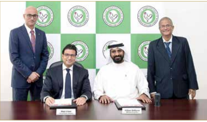
أثناء توقيع العقد

الشركة تطلق خطتها التوسعية في الأسبوع الثاني من نوفمبر