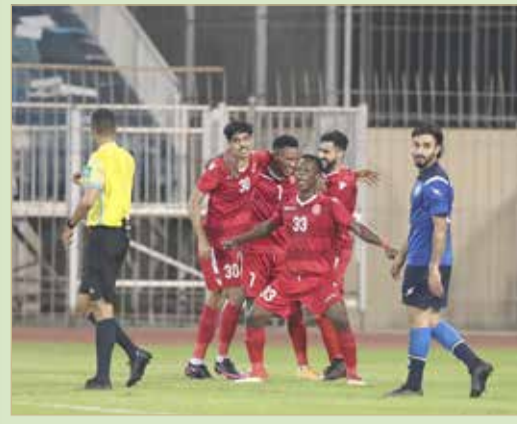
فرحة محرقاوية تكررت 4 مرات في نهائي كأس الاتحاد

مساعدة مدرب المحرق يشيد بمستويات اللاعبين الشباب