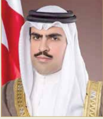
الشيخ عبدالله بن راشد

◆ سفير البحرين بواشنطن: الشرق الأوسط تواق للتغيير