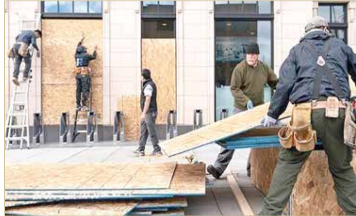
إغلاق نوافذ المتاجر بالخشب خوفاً من العنف

متاجر تغلق واجهاتها بألواح خشبية تحسبا لتظاهرات