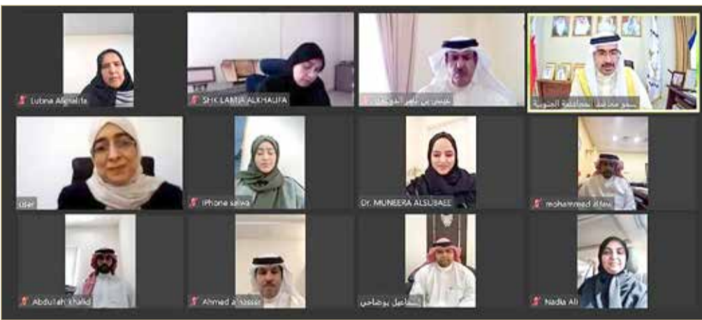
سمو محافظ الجنوبية في لقاء افتراضي بمناسبة ذكرى المولد النبوي

♦ سمو محافظ الجنوبية يدعو إلى الاقتداء بالسيره النبوية والنهج القويم