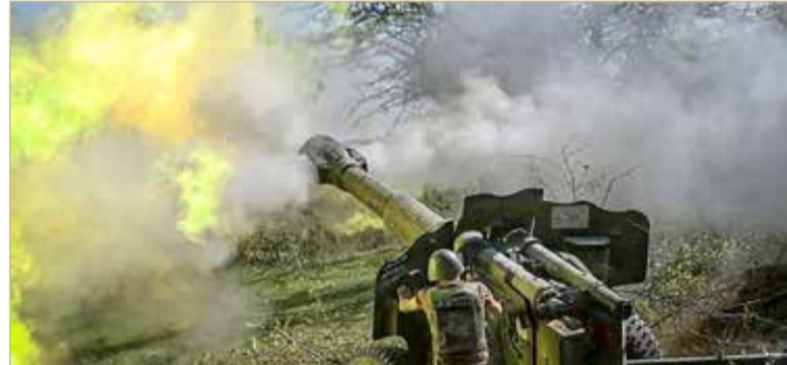
دعوات لوقف إطلاق النار بين البلدين

الجميع الابتعاد عنها، وفق قوله. وكانت أرمينيا وأذربيجان أخفقتا خلال محادثاتهما في جنيف، في الاتفاق على وقف جديد لإطلاق النار في ناغورنو قره باغ، لكنهما اتفقتا على تدابير لتخفيف التوتر بما في ذلك التهدد بعدم استهداف المدنيين.