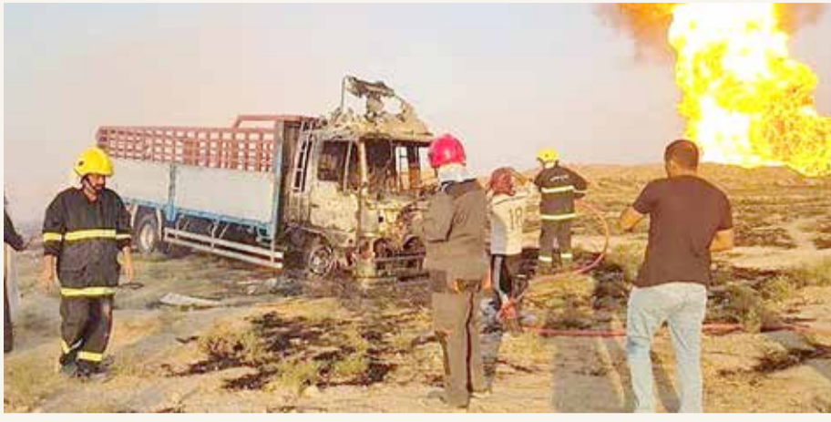
جانب من الانفجار في المنن

فتح ساحة التحرير وسط بغداد أمام حركة السير