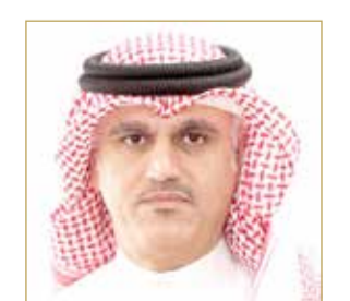
الشيخ محمد بن أحمد

♦ محمد بن أحمد: التنفيذ قبل موسم الأمطار