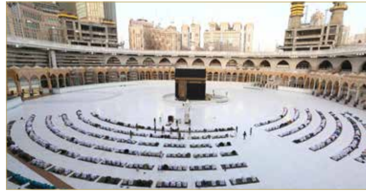
معتمرون في الحرم المكي ضمن المرحلة الثانية