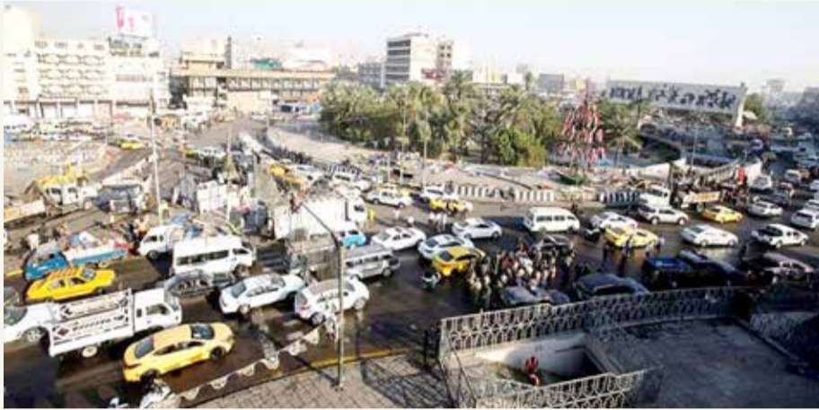
فتح ساحة التحرير أمام حركة السير

وتسبب الحجر وتراجع أسعار النفط العالمية بإغراق العراق في أزمة اقتصادية خانقة لم يشهد مثلها في تاريخه، مع تضاعف معدل الفقر ليلغ 40%. وفي هذا السياق، ارتفعت أصوات عديدة مطالبة بفتح التحرير والجمهورية لتسهيل حركة السير في العاصمة التي يبلغ عدد سكانها 10 ملايين نسمة، وإحياء الحركة التجارية من جديد في بغداد. وتولى مصطفى الكاظمي في مايو رئاسة الحكومة في العراق بعد أشهر من أزمة سياسية، متعهداً بتضمين مطالب المحتجين خطط حكومته وإجراء انتخابات مبكرة وإخراج البلاد من الأزمة السياسية والاقتصادية. لكن رغم تأكيده العمل على إعادة الحياة إلى مسارها الطبيعي، إلا أنه لم يطلق بعد الإصلاحات التي طالب بها المتظاهرون.