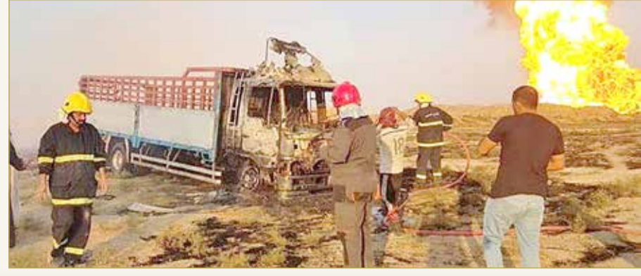
جانب من الانفجار في المثنى

أفادت مصادر مطلعة أمس، بوقوع انفجار غامض في أنبوب ناقل للغاز في محافظة المثنى جنوب العراق، خلف عددا من القتلى وعشرات المصابين بينهم عناصر من ميليشيا الحشد الشعبي كانوا متواجدين في معسكر قريب من الموقع. (10)