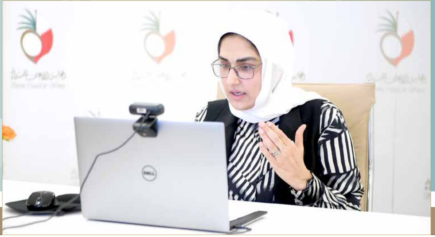
الأمين العام للمجلس الأعلى للمرأة متحدة بمنى "البلاد"