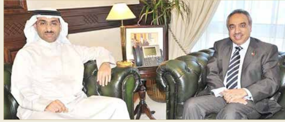
وزير الأشغال مستقبلاً مدير عام أمانة العاصمة بصورة إرشيفية

بعثت طلب استيضاح لوزير الأشغال ومدير "العاصمة" لتعديل القانون