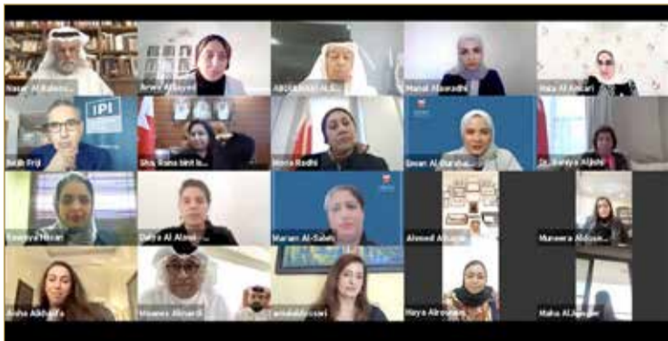
جانب من المشاركين بمنتدى "البلاد"