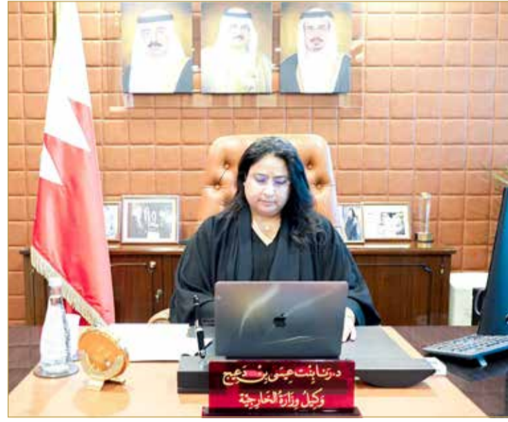
الشيخة رنا بنت عيسى متحدثة بمنتهى "البلاد"

إرث العمل الدبلوماسي، وتضيف عليه الكثير مما يتاح لها من دعم ومساندة قوية من أعلى المستويات القيادية في الدولة، إضافة إلى حقوقها المكفولة دستوريا، ثم قدرتها الشخصية على خوض غمار التحدي والمنافسة، وتسجل لنفسها بصمة في المجال الدبلوماسي أن المرأة البحرينية سجلت رسيدا هائلا من الإنجازات الدبلوماسية، ولن يعجزها تحقيق مزيد من الإنجازات طالما أن هناك قيادة ملكية سامية تؤمن بقدراتها وتتيح لها الحقوق والتسهيلات كافة لأداء أدوار تتشارك فيها مع أخيها الرجل لخدمة الوطن. وختمت "تتوجه بالشكر والتقدير لمقام لصاحبة السمو الملكي الأميرة سبيكة بنت إبراهيم آل خليفة رئيسة المجلس الأعلى للمرأة والسيدات الفاضلات عضوات المجلس وأمانته العامة كافة على اختيار يوم المرأة البحرينية هذا العام للاحتفاء بالمرأة في المجال العمل الدبلوماسي".