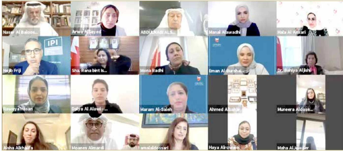
جانب من المشاركين بمنى "البلاد"

تحسنت نسب "الخارجية" في التقرير الوطني للتوازن بين الجنسين