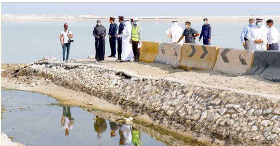
لقطات من الجولة الميدانية لامتداد السواحل

اليوم أن ندرس المشكلة ونضع الحلول وكيفية القيام بإزالة الضرر والتحسين والتأهيل وإيجاد متنفس طبيعي للمجتمع، ليس فقط لقرى شارع النخيل فالسواحل مفتوحة للجميع من مختلف مناطق البحرين، وعدم تعريض السواحل لمخاطر التدهور والحطام البري، فالهدف الرابع عشر من أهداف التنمية المستدامة يختص بحماية الحياة تحت المياه.