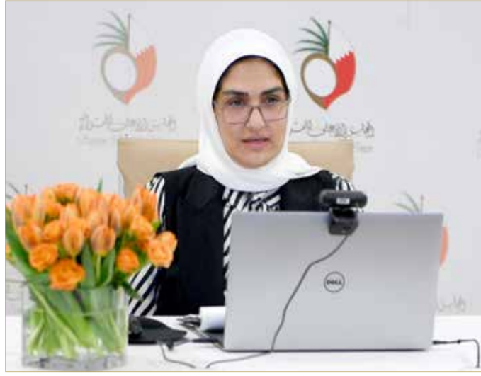
الانصاري: الرجل والمرأة يسيران في ذات المسير