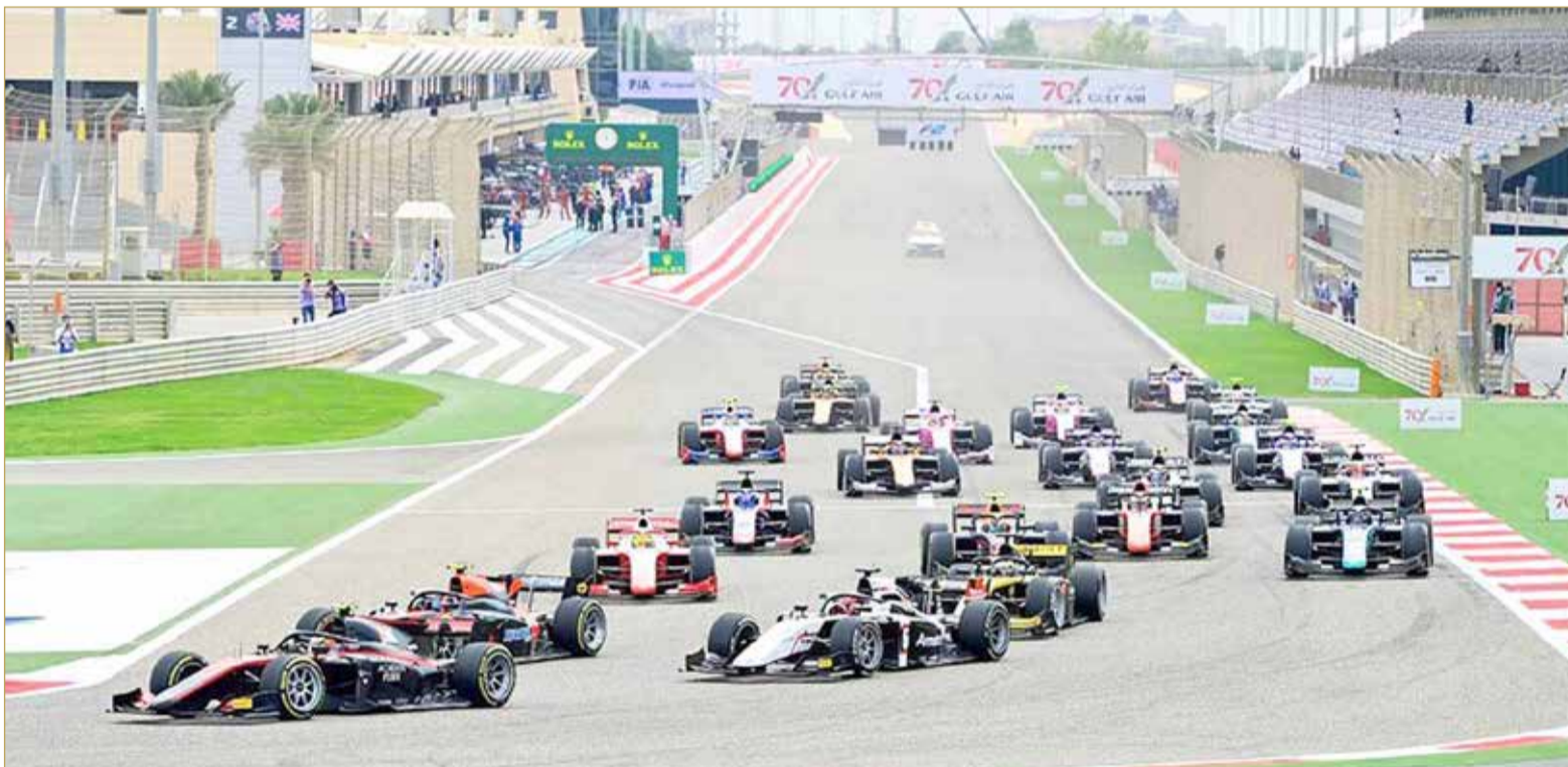
ينطلق اليوم سباق الـ FORMULA 1 جائزة البحرين الكبرى لطيران الخليج 2020 الساعة 5:10 مساء ويستمر ساعتين