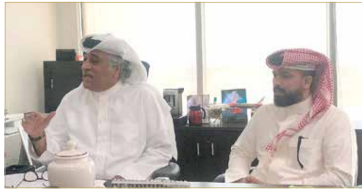
رئيس التحرير في المنتدى

عند الأرقام والإحصاءات فقط، ولكن سنعبّر لقصص البحرينيات الملهمات اللاتي يعمل في السلك الدبلوماسي