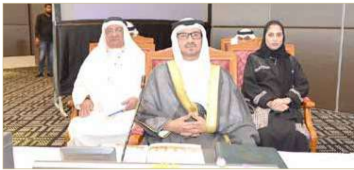
النصف لدى حضوره اجتماع المكتب التنفيذي (الرشيفية)

للمكتب التنفيذي لرؤساء اللجان الأولمبية الخليجية