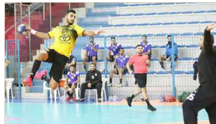
لقاء الاهلي وباربار