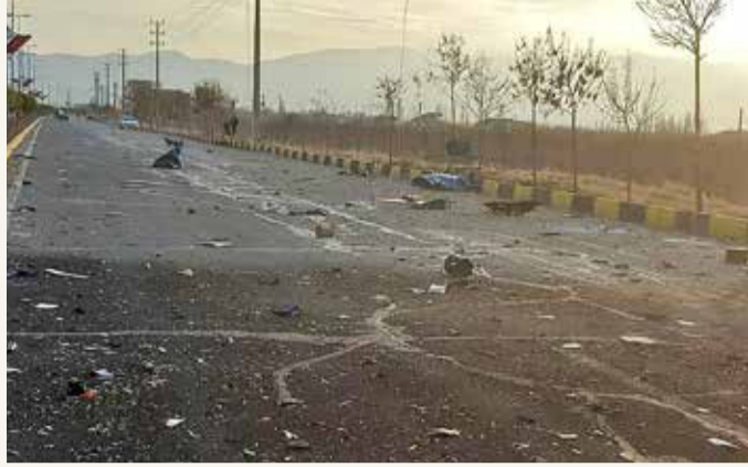
موقع اغتيال العالم النووي الإيراني

من جهة أخرى، اتهم الرئيس الإيراني حسن روحاني أمس إسرائيل بالوقوف خلف اغتيال العالم النووي البارز محسن فخري زاده، والسعي لإثارة "فوضى" في المنطقة، مؤكدا أن بلاده لن تقع في هذا "الفخ". وفي حين شدد روحاني على رد "في الوقت المناسب"، أكد المرشد الأعلى للجمهورية الإسلامية، علي خامنئي ضرورة