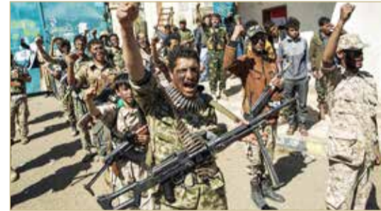
ميليشيات الحوثي تقوم بعمليات ابتزاز للمواطنين