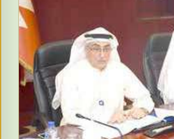
الشرر مشاركة في اجتماع "الغرف الخليجية"

يذكر أن اتحاد غرف دول مجلس التعاون الخليجي يعتبر من أهم الأطر المؤسسية الراقية للقطاع الخاص في دول الخليج العربية، إذ عمل منذ تأسيسه في العام 1979 على تمثيل المصالح الاقتصادية لمؤسسات وأفراد هذا القطاع؛ بهدف تنمية وتطوير دوره الاقتصادي من خلال تقديم مختلف أنواع الخدمات له وتمثيل مصالحه سواء في الداخل أو الخارج.