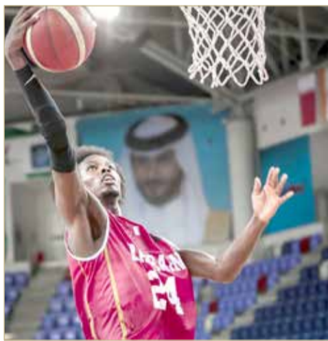
مباراة مهمة تنتظر الأحمر مساء اليوم

الجولة الثانية من التصفيات الآسيوية لكرة السلة 2021