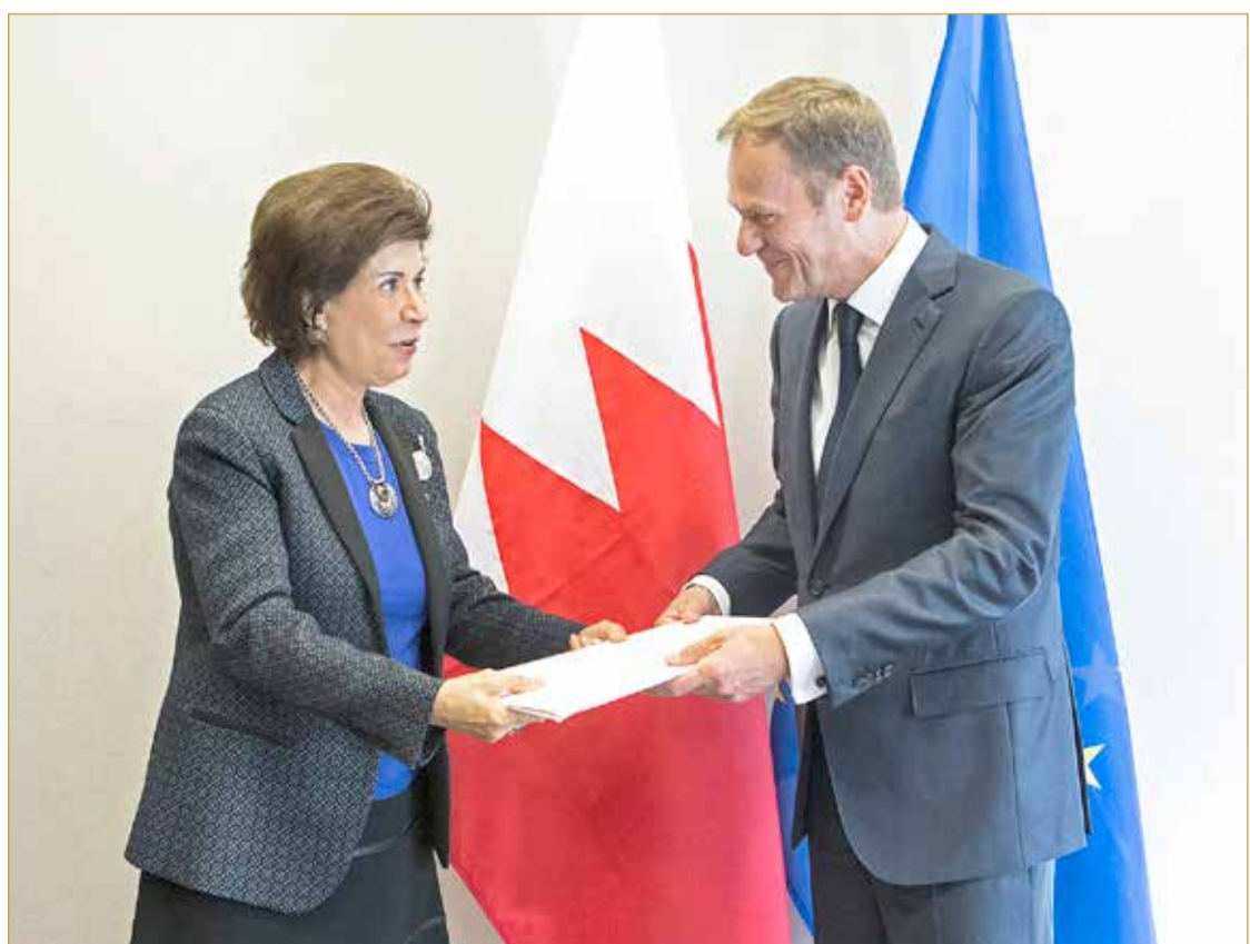
الجشي مقمدا أوراق اعتمادهما سفيرة لدى الاتحاد الأوروبي

سفيرتنا بالاتحاد الأوروبي: جهود كبيرة تبذل من «المجلس الأعلى» لدعم المرأة