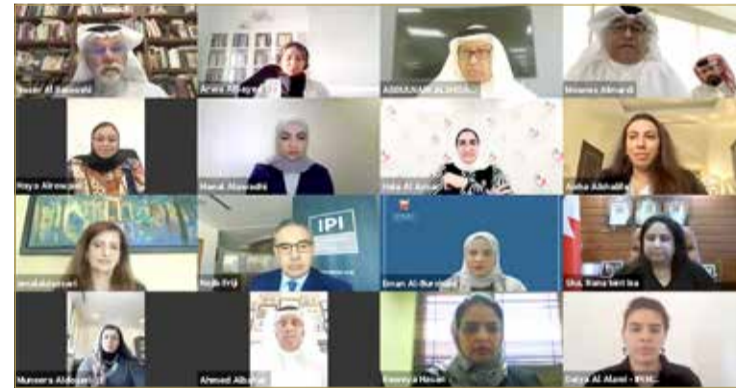
المشاركون بمنتهى "البلاد"

البحرين الحديثة التي يتطلع لها الجميع. وقال: أنا على ثقة تامة بوجود الكثير من قصص النجاح والمشروعات المميزة والمبادرات الراقية لدى الدبلوماسيات البحرينيات وهو ما يتطلب تسليط الضوء على هذه التجارب والممارسات الناجحة وهو دور الإعلام والصحافة. وختم "إن هذه الفعالية أو غيرها تسلط الضوء على المنجزات البحرينية الحضارية، وأؤكد استعداد صحيفة البلاد) بشكل مستمر على التعاون البناء والمثمر مع جميع الشركاء لتبني أي مشروعات تسهم في دعم تقدم المرأة في مختلف المجالات".