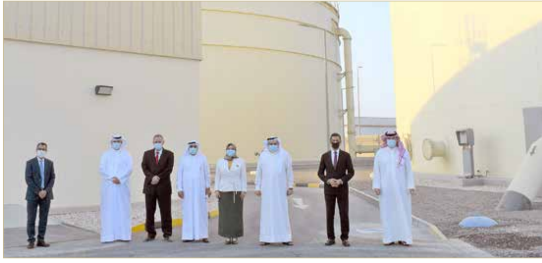
المنامة - هيئة شؤون الكهرباء والماء

بكلفة 10.6 مليون دينار وزيادة بسعة التخزين