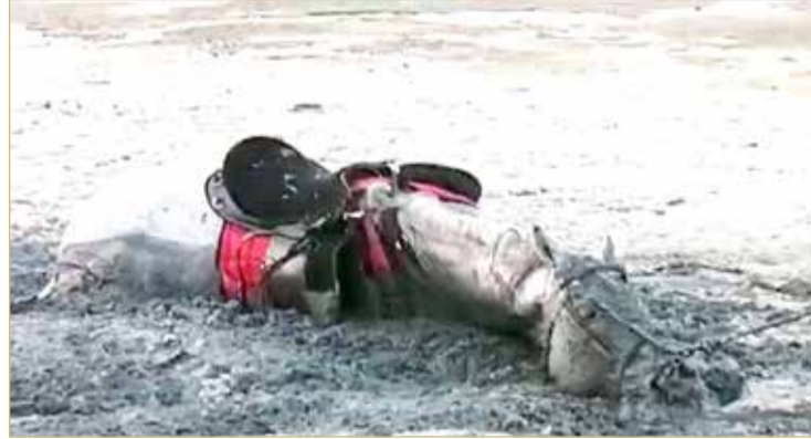
موقع غمر الحصان في المياه الطينية

واختتم بالإشارة إلى أنه بعد استلام كل التقارير، سيقدم مشروعًا لتحسين الامتداد الساحل لقرى شارع النخيل.