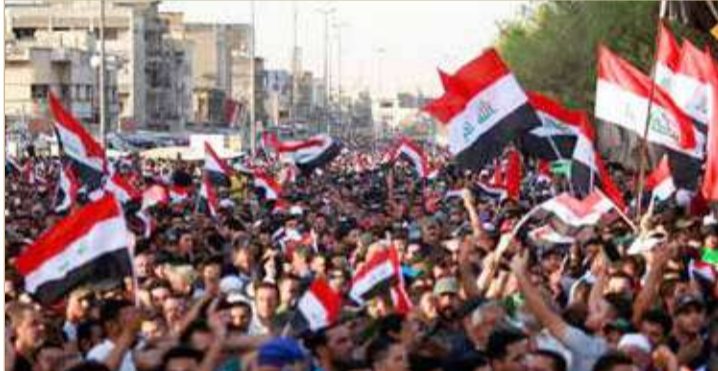
تصاعد التوتر بمدن عراقية أمس

وكان الصدر وجه دعوة إلى أنصاره إلى التظاهر الجمعة لاستعراض قوة تياره السياسية، استجاب لها عشرات الآلاف في بغداد ومدن أخرى. وفي مدينة الناصرية في جنوب العراق، اتهم نشطاء مناهضون للحكومة