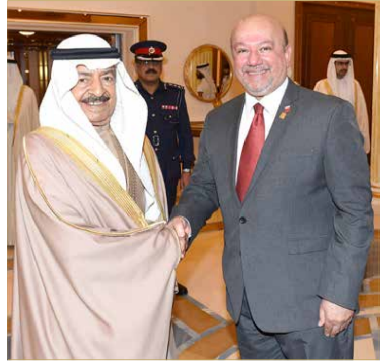
سمو الأمير الراحل مستقبلاً حسين إسماعيل

سموه افتتح مبنى "BIBF" بالجفير في مارس 1989