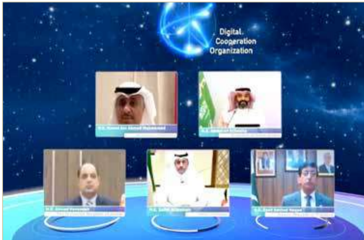
وزير "المواصلات" مشاركة في الفعالية

وتهدف منظمة التعاون الرقمي والتي تم إطلاقها من قبل البحرين والأردن والكويت وباكستان والمملكة العربية السعودية إلى تحقيق مستقبل رقمي للجميع من خلال تمكين المرأة والشباب ورواد الأعمال وتنمية الاقتصاد الرقمي من خلال قفزات تنموية قائمة على