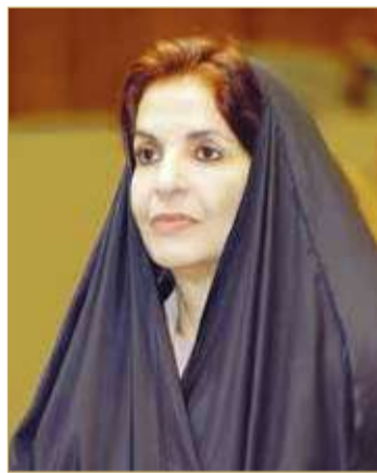
سمو الاميرة سبيكة بنت ابراهيم آل خليفة

نستذكر بالخير جهود الأمير الراحل في دعم المجلس منذ التأسيس