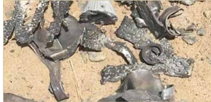
بقايا صاروخ لمليشيات الحوثي