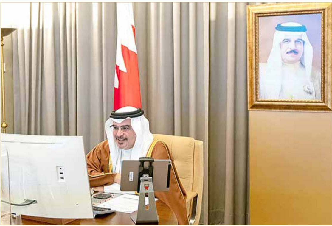
سمو ولي العهد رئيس الوزراء مترئسا جلسة مجلس الوزراء