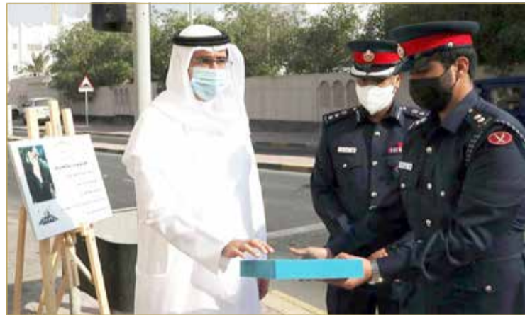
سمو محافظ الجنوبية يدشن عدداً من إشارات العبور الضوئية

مع مختلف الجهات المختصة؛ من أجل تطوير البنية التحتية والطرق الحيوية وفق أفضل المعايير لتلبية لاحتياجات الأهالي. وبيّاني إطلاق مبادرة (سلامة دريك) في 2018 بتوجيه من محافظ الجنوبية سمو الشيخ خليفة بن علي بن خليفة آل خليفة ضمن حزمة مبادرات تهدف إلى الحفاظ على سلامة المواطنين والمقيمين، والسعي لتوفير بيئة آمنة للجميع.