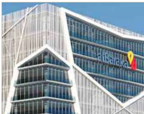
مقر مجموعة البركة المصرفية في خليج البحرين بالمنامة

يتم طلبها من قبل مصرف البحرين المركزي وأية جهات تنظيمية أخرى ذات علاقة. كما تمت الموافقة على تعديل عقد التأسيس للمجموعة ونظامها الأساسي وإعادة صياغتهما بالكامل بغرض إحداث التعديلات اللازمة بموجب تعديلات قانون الشركات التجارية، متطلبات المجلد الرابع (أعمال الاستثمار) من مجلد توجيهات مصرف البحرين المركزي، متطلبات الفصل الخاص بحوكمة الشركات من المجلد السادس من مجلد توجيهات مصرف البحرين المركزي وكذلك القرار الوزاري رقم 19 لسنة 2018 بشأن ميثاق حوكمة الشركات، ودمج جميع التعديلات السابقة في عقد التأسيس والنظام الأساسي المعدلين والمعاد صياغتهما وذلك خاضع لموافقة الجهات الرقابية المعنية، بالإضافة للموافقة على أية تعديلات لاحقة يتم طلبها من قبل مصرف البحرين المركزي وأية جهات تنظيمية أخرى ذات علاقة.