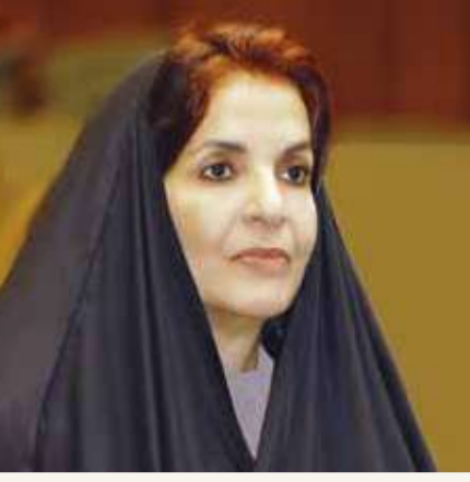
سمو الاميرة سبيكة بنت ابراهيم

وبشعار متجدد يحتفي بالمرأة التي قرأت فتعلمت فشاركت في بناء مسيرة الدولة البحرينية الحديثة التي تحظى بقيادة جلالاتكم بخطاها الواثقة نحو مستقبل الوطن المشرق، وكما تلمحون له من رفعة ورخاء لأهل البحرين الكرام. وختاماً، نسال المولى عز وجل أن يحيط جلالتكم بحفظه ورعايته ويديم عليكم موفور الصحة ودوام العزة. والسلام عليكم ورحمة الله وبركاته،،