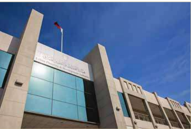
مبنى هيئة التخطيط والتطوير العمراني

مطورون يكسبون حكما بعد شد وجذب مع الهيئة