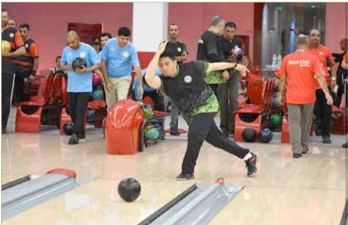
من مسابقات دوري البولينج المحلي

بوشري سابقاً وهو مدرك لاحتياجاتها ومتطلباتها، مؤكداً أهمية السعي لإيجاد مصادر تمويل ذاتية ليقوى الاتحاد على تسيير أنشطته وبرامجه على النحو الأمثل. وأضاف بأن الكشف عن خطة الاتحاد