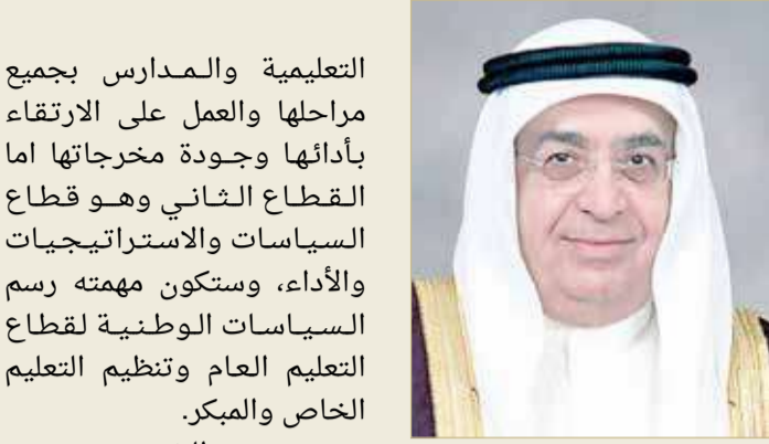
سمو الشيخ محمد بن مبارك

محمد بن مبارك: يعكس اهتمام سمو ولي العهد رئيس الوزراء بتطوير التعليم