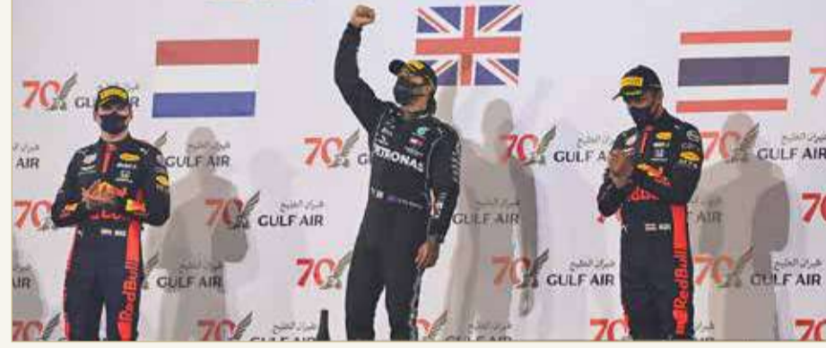
جانب من تنويع الفورمولا 1

رفع ممثل جلالة الملك للأعمال الإنسانية وشؤون الشباب سمو الشيخ ناصر بن حمد آل خليفة، أسمى آيات التهاني والتبريكات إلى حضرة صاحب الجلالة الملك حمد بن عيسى آل خليفة عاهل البلاد المفدى حفظه الله ورعاه وإلى صاحب السمو الملكي الأمير سلمان بن حمد آل خليفة ولي العهد نائب القائد الأعلى رئيس الوزراء بمناسبة نجاح مملكة البحرين في تنظيم سباق جائزة البحرين الكبرى للفورمولا 1، معرباً سموه عن تقديره واعتزازه بالدور البارز والجهود المخلصة التي بذلها صاحب السمو الملكي الأمير سلمان بن حمد آل خليفة في إنجاح السباق من خلال متابعته المستمرة لكافة الاستعدادات وحرص سموه على المتابعة الشخصية باستضافة المملكة لهذا السباق العالمي الكبير، مؤكداً سموه