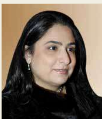
الشيخة رنا بنت عيسى بن دعيج

مع تسلسل التطوير الإداري للوزارة، إذ شغلت عدة مواقع، فكانت هناك مجموعة من الموظفات الإداريات بالوزارة، وأخرى تخصصت بمتابعة الملفات السياسية والشؤون القنصلية.. وبفضل الثقة الملكية السامية عُينت في مواقع عليا بالوزارة وفي البعثات الدبلوماسية البحرينية في الخارج، وانسجمت خبرات كثير منهن مع أداء السفيرات اللاتي حظين بثقة جلالته الملك بتمثيلهن لجلالته في الخارج، وقد كنّ خير معين لهن في إبراز الدبلوماسية البحرينية الفاعلة، التي تعتبر أهم أداة لتنفيذ السياسة الخارجية لمملكتنا، والتي تتسم بالتفاعلية النشطة مع الأحداث والتطورات والتواجد بشكل ملحوظ في المحافل الأممية والدولية.