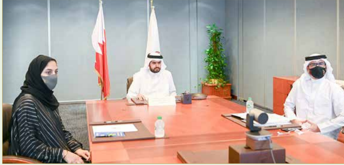
سموه لدى ترؤسه الاجتماع

اعتماد إقامة دورة الألعاب الخليجية ودمجها مع الشاطئية بالكويت مارس المقبل