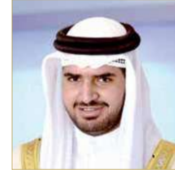
سمو الشيخ عيسى بن علي

وأشاد سموه وكيل وزارة شؤون مجلس الوزراء نائب رئيس اللجنة الأولمبية بجهود مجلس إدارة حلبة البحرين وجميع العاملين في السباق والمارشال البحريني بقدراتهم المتميزة التي مكنتهم من الحصول على إطرار كبير من قبل كل من تابع أحداث السباق، والمستوى الاحترافي في أداء مهامهم بدقة متناهية؛ من أجل إظهار السباق بشكله المتميز.