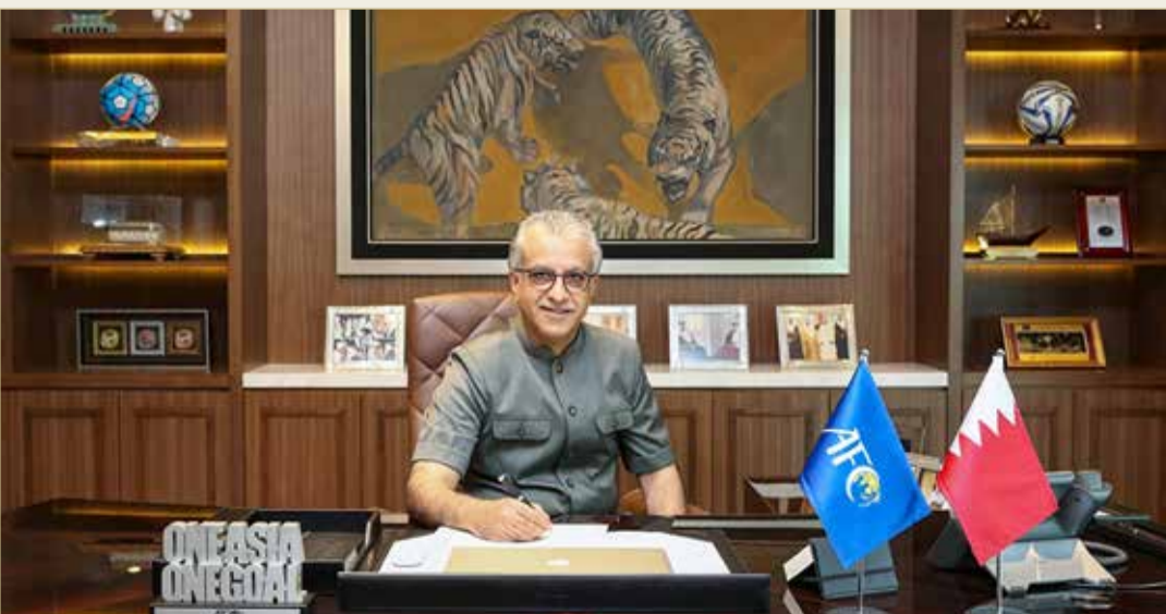
سلمان بن إبراهيم

مبادئ الاحترام المتبادل واللعب النظيف والعمل الجماعي في كل ما نقوم به من عمل إداري وفي الفعاليات الأخرى، مثلما نتوقع أن يلتزم اللاعبون باللعب النظيف على أرض الملعب، حيث تم إعداد مبادئ هذه المدونة بالاستناد إلى فكرة أن كل ما نقوم به خلال عملنا في الإتحاد الآسيوي لكرة القدم يجب أن يتم قياسه وفق أعلى مبادئ الأخلاق والنزاهة. وتم تطوير مدونة قواعد السلوك لتغطي المزيد من