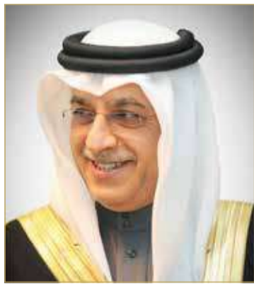
الشيخ سلمان بن إبراهيم

المرأة في مختلف مجالات الحياة لافتاً إلى أن الاحتفاء بالمرأة في المجال الدبلوماسي يبرز ما قدمته من عطاءات مهمة في هذا المجال على مدى عقود متتالية من البذل والعطاء. وأكد الشيخ سلمان بن إبراهيم آل خليفة على دور المرأة البحرينية الكبير في دفع عجلة الحركة الشبابية والرياضية في المملكة نحو آفاق واسعة من التميز والعطاء؛ مؤكداً أن الاحتفاء بيوم المرأة البحرينية بعد فرصة لاستذكار الانجازات الكبيرة التي حققتها الرياضة النسائية في المملكة على مر السنوات مثلما يعتبر محطة لشحن الهمم ومواصلة الدعم لهذا القطاع من أجل تعزيز نجاحات المرأة على الصعيدين الشبابي والرياضي.