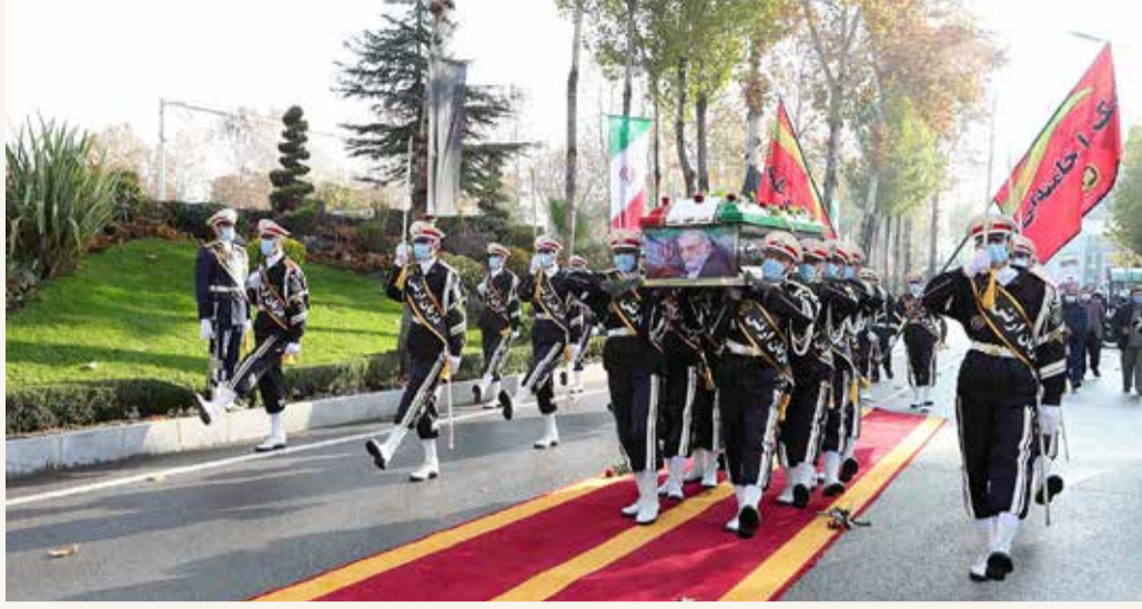
جنازة رسمية للعالم النووي محسن زادة

على الحدود مع سوريا، أن الجيش الإسرائيلي مستمر في الاستعداد الكامل ضد كل محاولة عدوانية تستهدفه. وجاءت الجولة بعد أيام من كشف حقل للعبوات الناسفة بالقرب من الحدود والضربة التي وجهها الجيش الإسرائيلي لأهداف إيرانية وسورية.