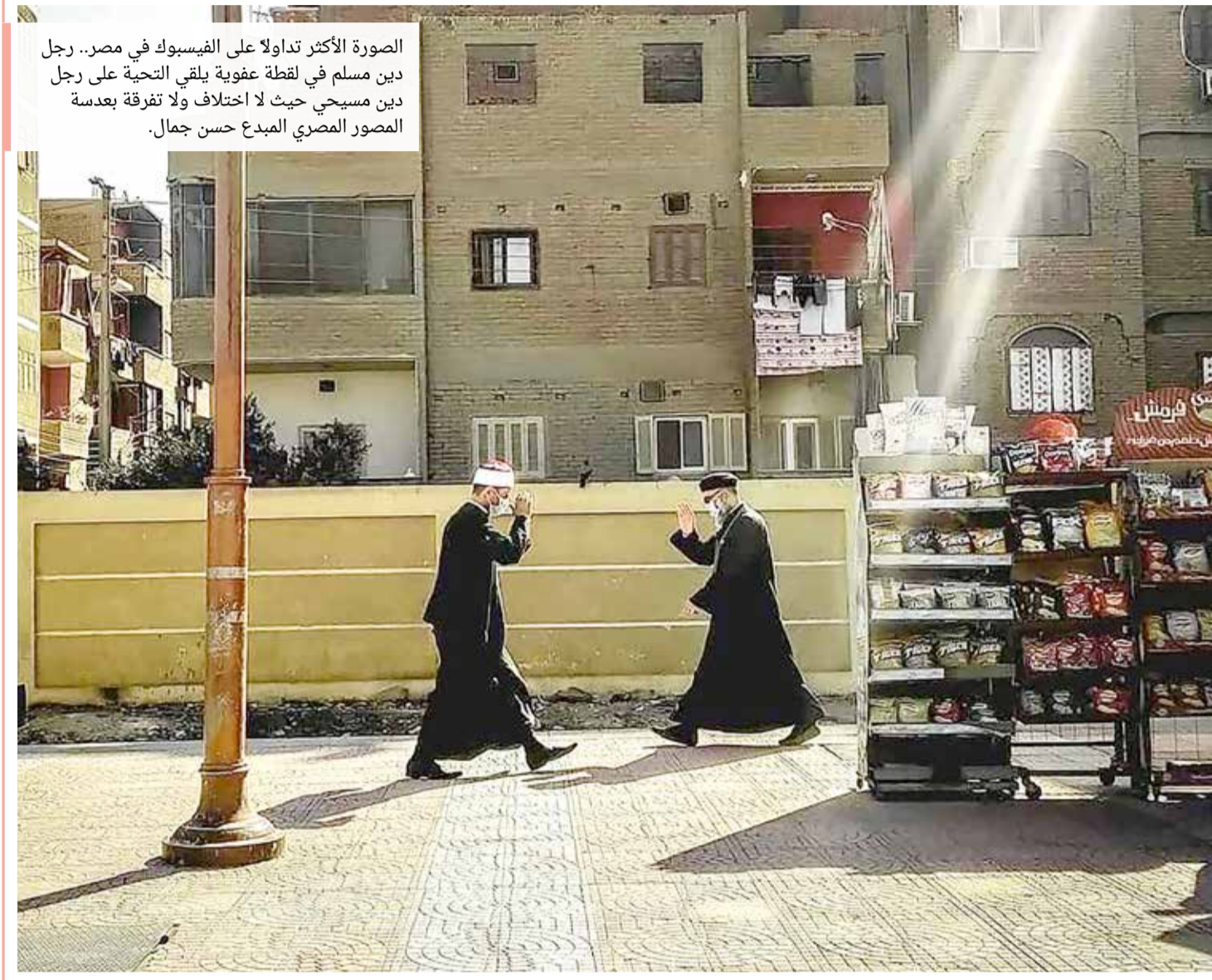
الصورة الأكثر تداولاً على الفيسبوك في مصر.. رجل دين مسلم في لقطة عفوية يلقي التحية على رجل دين مسيحي حيث لا اختلاف ولا تفرقة بعدسة المصور المصري المبدع حسن جمال.

إدارة التحرير: +973 17111444 / +973 17111467 / 385 @local@albiladpress.com / 2008 / تصدر عن دار البلاد للصحافة والنشر والتوزيع / س ت 67133 / تطبع في مؤسسة الأبرام للنشر / قسم الإعلانات: 508 / 17111501 / 32224492 / 39615645 / 17111432 / 17111434 / 17580939