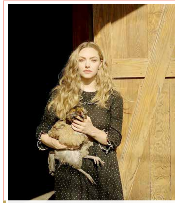
كشفت النجمة الجميلة "اماندا سيفريد" في مقابلة جديدة بأن الوضع صعب جداً لأي موهبة تريد أن تبرز في هوليوود اليوم، وهو بالفعل مكان مخيف حيث يتم استغلالك لأبعد حد، وشخصياً دفعت ثمن ذلك.

أعلنت مدينة سان فرانسيسكو فرض حظر تجول وقيد أخرى اعتباراً من الاثنين بسبب ارتفاع حالات الإصابة بفيروس كورونا المستجد وقال رئيس البلدية لوندون بريد إن المتاجر غير الأساسية ستُغلق وإن التجمعات سحظر من الساعة 22,00 حتى الخامسة من صباح اليوم التالي، وهو إجراء سيظل ساريًا حتى 21 ديسمبر. وستكون مقاطعة سان ماتيو بالقرب من سان فرانسيسكو مشمولة أيضاً بالإجراءات نفسها وكتب بريد على تويتر "هذه أخطر الأوقات التي نواجهها خلال هذه الجائحة لا تُسافروا ولا تنظّموا تجمعات يجب علينا السيطرة على هذا الأمر، ولا يمكننا ترك الأمور تسير بهذا المعدل".