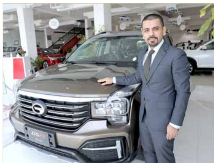
إنتاج منتجات عالية الجودة تتجاوز توقعات العملاء