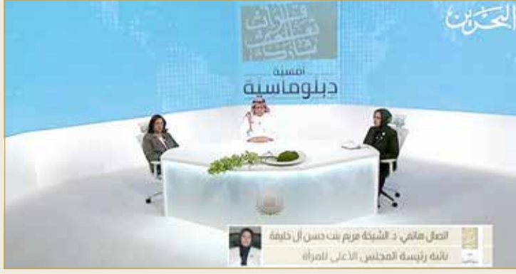
مداخلة هانفية لنانية رئيسة المجلس الأعلى للمرأة لبرنامج أمسية دبلوماسية