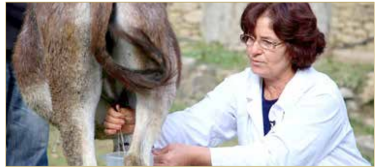
ولا يزرع أحد أن هذا الحليب يحمي من الإصابة بكوفيد -19، غير أن هذا المنتج القريب من حليب الأم غني بالفيتامينات وبمغذيات تقوي الجهاز المناعي.

تُسبب مزايا مناعية عذّة لحليب الحميمير في ألبانيا، ما يزيد الطلب على هذه المنتجات ازديادا شديدا في خضمّ الأزمة الصحية، ويشكّل فرصة لتحسين ظروف عيش هذه الحيوانات. ويتوافد الزبائن إلى مزرعة صغيرة في جنوب تيرانا، إذ يعض بعض الحميمير العلف بهدوء تحت الأشجار. ولا يزال إنتاج حليب الحميمير هامشيا في هذا البلد الفقير الواقع في منطقة البلقان، وهو يقتصر على مزرعتين فيهما بضع عشرات الحميمير. وتضمّ ألبانيا نحو 50 ألف حمار وبغل، بحسب تقديرات صحافية. وتُستخدم هذه الحيوانات لنقل الحمولات أو جز العربات أو التنقل في الريف حيث يقاسي القرويون المشقات. ويلقى حليب الحميمير إقبالا كبيرا على الرغم من سعره المرتفع عند 50 يورو (60 دولاراً تقريبا) للتر الواحد في بلد بالكاد يبلغ متوسط الأجر الشهري فيه 400 يورو (500 دولار تقريبا).