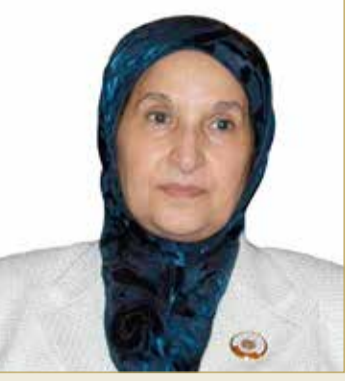
الشيخة مريم بنت حسن

♦ مريم بنت حسن: الشهادة الجامعية لا تكفي للنجاح الدبلوماسي