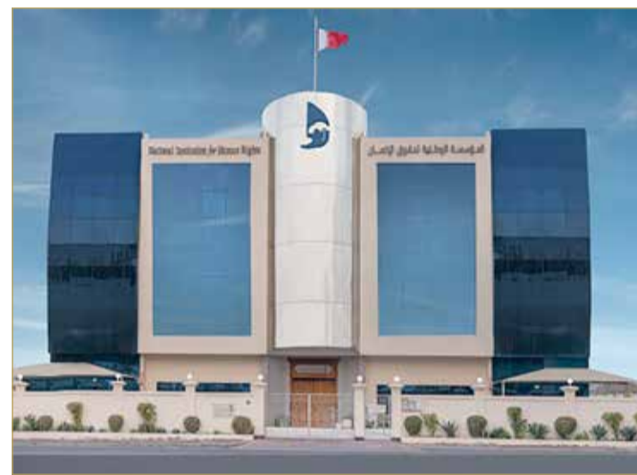
مملكة البحرين أصحت نموذجاً يحتذى به في الإصلاح السياسي والديمقراطي

ضاحية السيف - المؤسسة الوطنية لحقوق الإنسان