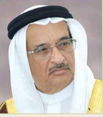
الشيخ محمد بن عبدالله

كما أشاد بالإقبال اللافت من قبل المواطنين والمقيمين في مملكة البحرين على أخذ اللقاح المضاد لفيروس كورونا مع انطلاق الحملة الوطنية للتطعيم ما ينم عن الوعي المسؤول الذي يتسم به الجميع وحرصهم على الحفاظ على صحة وسلامة أنفسهم وعوائلهم ومحيطهم المجتمعي، مشيدا بجهود وزارة الصحة في العمل على تهيئة مختلف مواقع أخذ اللقاح في 27 مركزا طبيا.