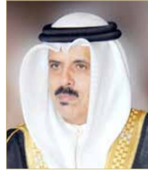
وزير التربية والتعليم

على "تعزيز تعليم اللغة العربية والنهوض بمستواها بما يمكن من إتقانها واستخدامها في مختلف مجالات المعرفة".