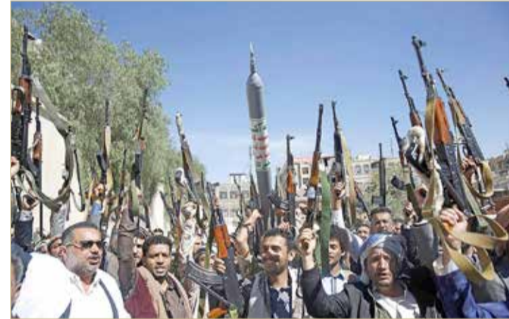
عناصر تابعة لميليشيا الحوثي الانفصالية

ولفت إلى أنه تمت "إزالة وتدمير ما مجموعه 171 لغما بحريا نشرتها الميليشيات عشوائيا". من جانب آخر، أطاحت الأجهزة الأمنية في مديرية التحتيا جنوب الحديدة، غربي اليمن، بخلية تابعة لميليشيات الحوثي الانقلابية، المدعومة من إيران، تعمل على زرع العبوات الناسفة. وقال مصدر أمني في التحتيا، إن