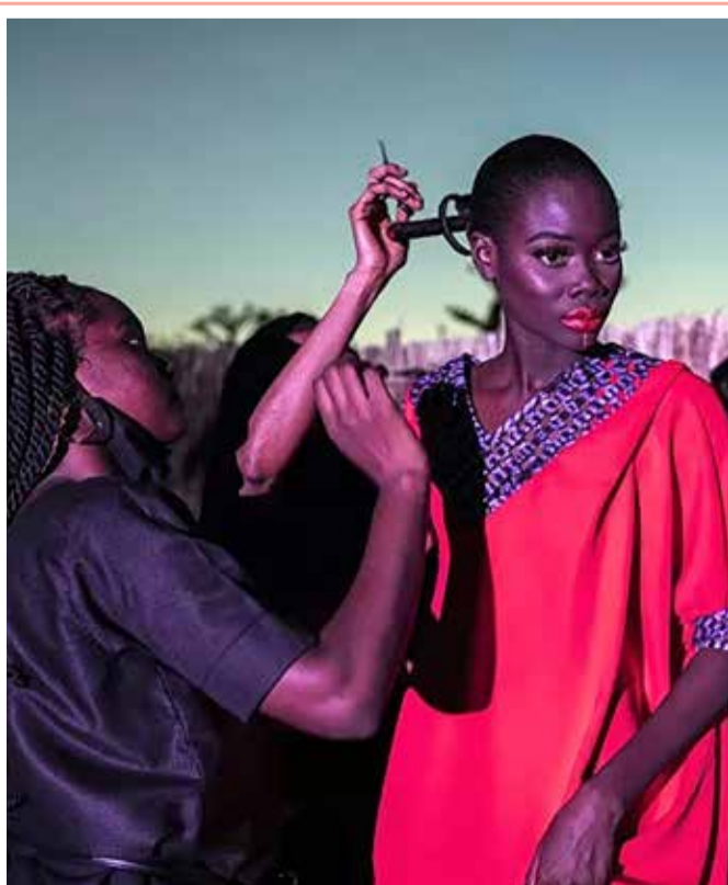
عارضة أزياء تضع اللصقات الأخيرة على ملابسها أثناء أسبوع الموضة في داكار، سنغال

التقطت كاميرا مشهد هروب طفل يبلغ من العمر 5 سنوات، غادر بيت أسرته خفية في منتصف الليل كي يشاهد “الحافلة الحمراء”. وتوصف حالة الطفل الصغير الصحية الآن بأنها جيدة، لكن بسببه ظهرت مشاكل لوالديه بالطبع. وعثر على هذا الطفل وهو يسير ليلا على أحد طرق موسكو السريعة، وكان يرتدي سروالا قصيرا ويتنعل حذاء فقط، فيما كانت درجة الحرارة (5-). ولم يتمكن الطفل من إعطاء عنوانه للشرطة، وأبلغها أنه “يريد رؤية الحافلة الحمراء”، وفيما كان الطفل الصغير يتجول في العاصمة ليلا، كانت أسرته تنام في سلام، ولم يفتقدوه والداه إلا في الساعة السابعة صباحا، وكان باب البيت مشرعا.