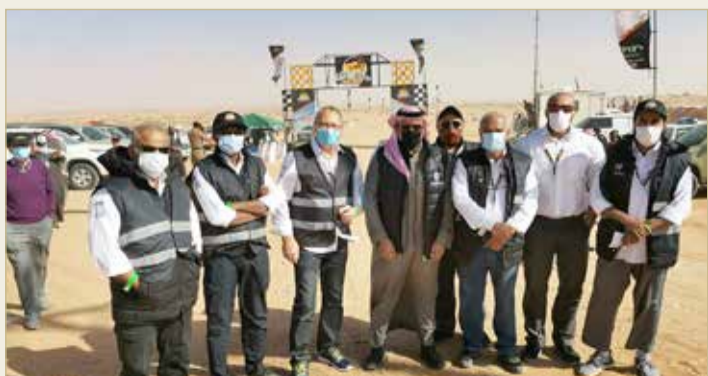
الأمير خالد بن سلطان بنوسط الوفد البحريني