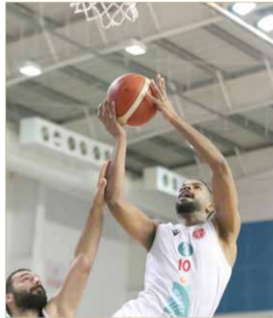
من لقاء المحرق وسماهيج

سلة المحرق بقوة عبر الثلاثيات المميزة أمام أداء ضعيف للمحرق دفاعياً وهجومياً. وفي الربع الأخير، ارتكب سماهيج أخطاء شخصية وفنية فيما المحرق تحسن وضعه الدفاعي والهجومى ليوسع الفارق وينهي اللقاء لصالحه.