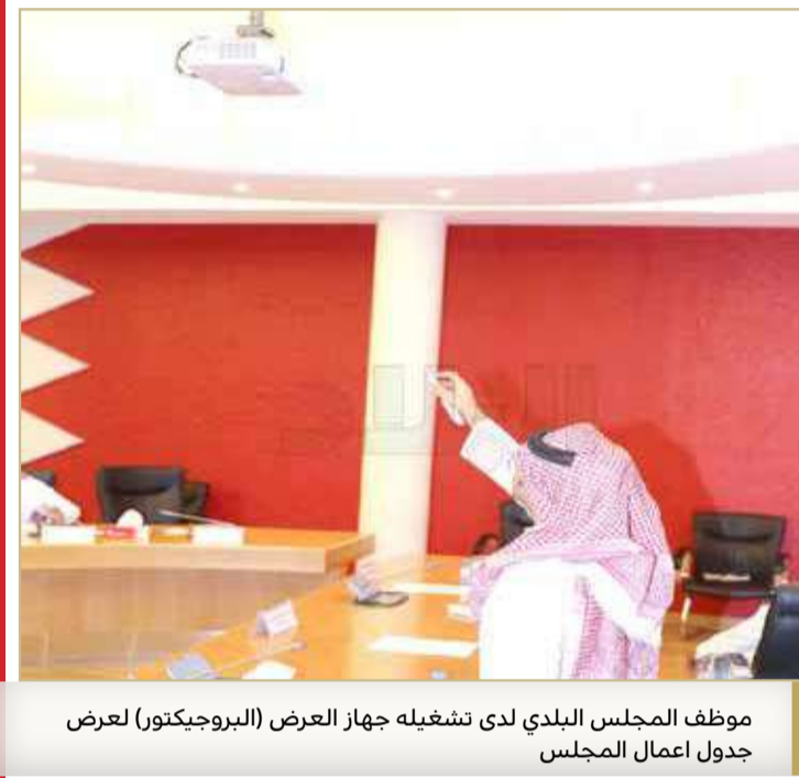
موظف المجلس البلدي لدى تشغيله جهاز العرض (البروجيكتور) لعرض جدول اعمال المجلس