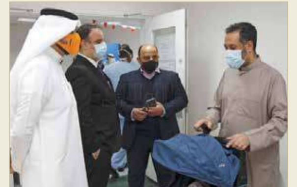
يأتي المواطن للصيدلية كل يوم أحد أسبوعيا رفقة ابنه

البلاد انتقد ولي أمر طفل مريض بمرض مزمن (الكلية) تأخر استلامه دواء ابنه، والذي يستغرق تحضيره واستلامه قرابة ساعة. وبين أنه غير مستفيد من خدمة توصيل الأدوية؛ لأن الدواء الذي يأخذه للذرة كبده يجري تحضيره بالصيدلية وليس من الأنواع الجاهزة المعلبة.