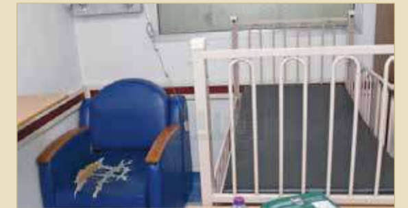
كرسي مرافق الطفل المريض ممزق