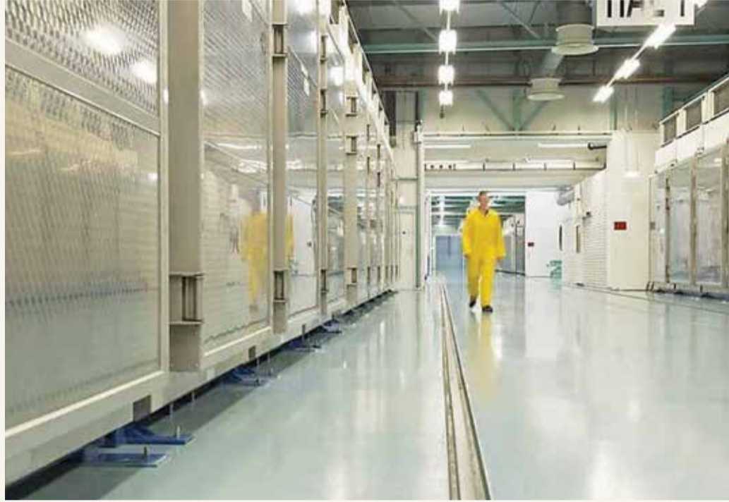
منشأة فورودو النووية الإيرانية

في تصعيد جديد، أعلنت إيران رسمياً، أمس الاثنين، البدء في تخصيب اليورانيوم بنسبة تصل إلى 20% في موقع فورودو، في تحد للمجتمع الدولي الذي يحث طهران على الالتزام بالاتفاق النووي المبرم سنة 2015. وأكد المتحدث باسم الحكومة، علي ربيعي لوكالة مهر شبه الرسمية، أن إيران استأنفت تخصيب اليورانيوم بنسبة 20% في المنشأة النووية تحت الأرض.