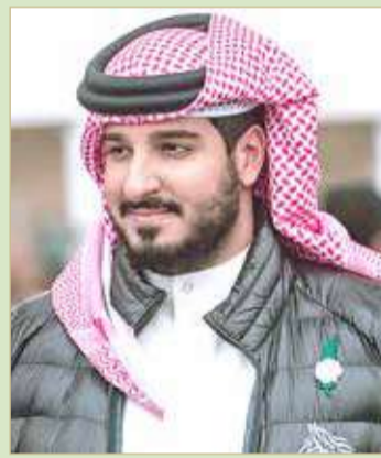
سمو الشيخ عيسى بن عبدالله

وتوقع سمو الشيخ ناصر بن حمد آل خليفة أن تشهد بطولة سمو الشيخ خالد بن حمد آل خليفة للقدره منافسة قوية ومفتوحة بين كافة الاسطبلات والفرسان المشاركين في البطولة عطفاً على المستويات البارزة التي أفرزتها