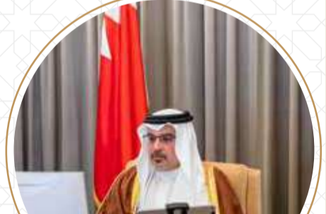
سمو ولي العهد رئيس مجلس الوزراء خلال جلسة مجلس الوزراء 4 يناير 2021.

الإشادة بجائزة الملك حمد لتمكين الشباب لتحقيق أهداف التنمية المستدامة ودورها في إبراز النماذج الشبابية المضيئة في المجتمعات.