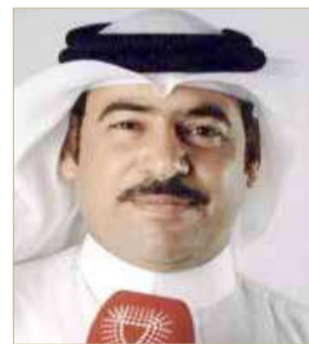
الإعلامي محمود خليفة

وأضافت بيان أيضاً من جهة أخرى هناك مسببات خارجية عن إطار الفئة العازفة، وهي عدم مجاراة منتجات ومخرجات الثقافة الأدبية للعصر وما يلفت الجمهور والشباب خاصة، مما