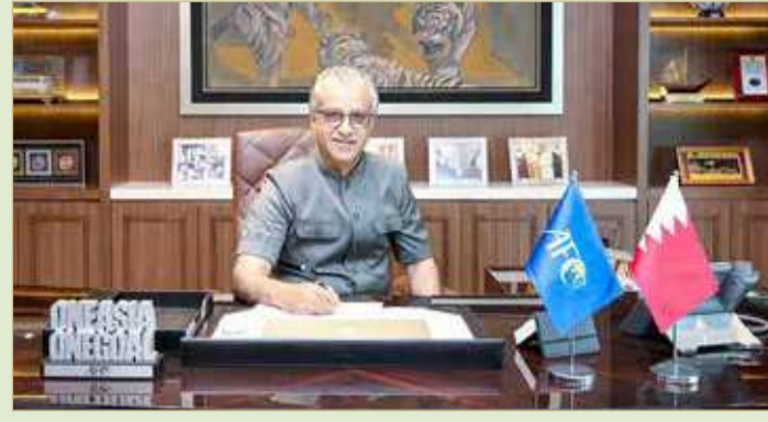
الشيخ سلمان بن إبراهيم

في كل نسخة من هذه البطولات، بحيث تحمل عناصر محلية من الاتحاد الوطني المضيف. وكذلك من أجل تسليط الضوء على أهمية التصنيفات الآسيوية - الطريق إلى قطر، وقيمتها التجارية، فقد تم تخصيص شعار خاص بالدور النهائي من تصنيفات كأس العالم 2022 في قطر، والذي ينطلق في النصف الثاني من عام 2021 لتحديد المنتخبات التي ستمثل قارة آسيا في كأس العالم. أما بطولة دوري أبطال آسيا، والتي تحظى بمتابعة جماهيرية هائلة تقارب المليار مشجع أغلبهم من الشباب القادمين من أكبر مدن القارة، فقد حظيت بتصميم جديد لشعارها، والذي يعرض كأس البطولة إلى جانب عناصر تمثل منطقتي الغرب والشرق. وحظيت بطولة كأس الاتحاد الآسيوي بتصميم جديد للشعار، والذي يحمل خمسة ألوان تعبر عن المناطق الجغرافية الخمس في القارة، عبر تصميم حديث ومميز. من جهته، قال باتريك مورفي عضو مجلس الإدارة والمدير التنفيذي في شركة تسويق كرة القدم الآسيوية (FMA): اليوم يعتبر يوماً مهماً على عدة مستويات، حيث يمكن لجماهير كرة القدم الآسيوية الاستمتاع بمشاهدة التصاميم والعلامات التجارية الجديدة لبطولات الاتحاد الآسيوي لكرة القدم، كما يمكن للراحة وشركاء البث التلفزيوني وكذلك الأندية والاتحادات الوطنية، أن تبدأ باستخدام هذه الشعارات والتصاميم الجديدة من أجل الترويج لمسابقات الاتحاد الآسيوي لكرة القدم، وهي لحظة فخر وخطوة مهمة من أجل دخول عصر جديد لكرة القدم الآسيوية.