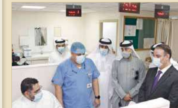
الموظف متحدثا لأعضاء لجنة التحقيق

وقال الموظف للنواب: كلنا نعمل على الكادر الوظيفي الاعتيادي وليس على الكادر التخصصي، وبالرغم من أهمية وظيفتي إلا أنني أعمل بمسمى لا يتناسب مع وظيفتي. وأشار إلى أنه كان يتعين تصحيح مسماه الوظيفي ليكون فني سحب دم بالمختبر، ولكن اشتراطات هذه الوظيفة نيل الدبلوم وهو خريج الثانوية العامة. وتابع: المسؤولون بوزارة الصحة يبلون بلاء حسنا في التواصل مع الديوان؛ للوصول إلى نتيجة مرضية بشأن هذا الموضوع.