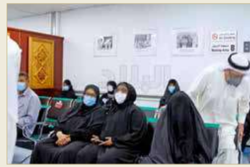
لا تباعد اجتماعي