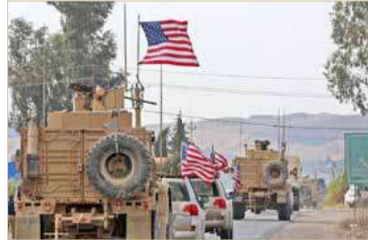
قوات أميركية في العراق

◆ رغم استمرار الحملة الأمنية للسيطرة على السلاح المتفلس