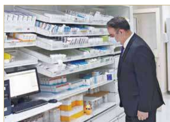
العشيري بصيدلية ”السلمانية“

◆ لا تباعد اجتماعيا... وأطباء لا يلتزمون بالمواعيد... وموعد مواطن بعد سنة