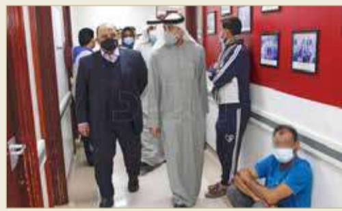
مريض جالس بالمرم

البلاد انتقد رئيس لجنة التحقيق البرلمانية بشأن الخدمات الطبية هشام العشيري عدم تطبيق قواعد التباعد الاجتماعي ببعض مواقع انتظار المرضى خصوصا بعيادات مبنى الفاتح ومواقع أخرى. وأشار لوجود تكديس كبير بقاعات الانتظار في هذا المبنى، والوزارة لا تراعي تطبيق التباعد الاجتماعي، وهي الأولى بتطبيق هذه القواعد بصرامة. واقترح تطبيق آلية مناسبة لترتيب قدوم المرضى لمواعيدهم بالمبنى؛ لتجنب الازدحام والتكدس.