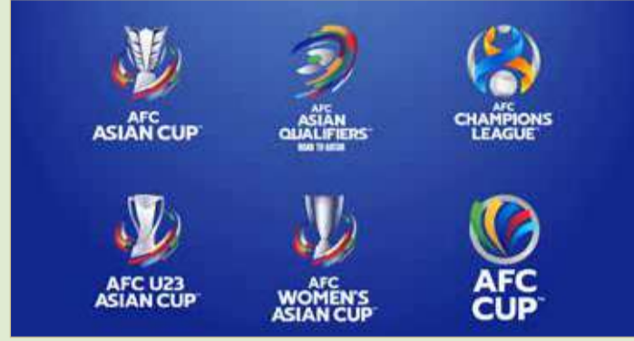
الشعارات الجديدة لبطولات الآسيوية

في كافة أرجاء قارة آسيا، وبحيث جاءت التصاميم الجديدة معبرة عن روح هذه البطولات. واستلهمت تصاميم بطولات المنتخبات الوطنية من ملابح كرة القدم والألوان المنتخبات الوطنية في قارة آسيا، حيث تم التركيز على الأماكن التي شهدت تتويج أبطال آسيا، ودعم أفضل المنتخبات الوطنية وأهم الأبطال في القارة. ومن أجل تأكيد الترابط بين البطولات، فإن شعارات كأس آسيا، وكأس آسيا للسيدات، وكأس آسيا تحت 23 عاماً، تتشارك في العناصر الأساسية للتصميم، كما تعرض هذه التصاميم الكؤوس الخاصة بكل بطولة. وسوف يتم تعديل هذه الشعارات