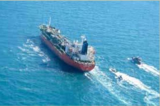
سفينة كوريا الجنوبية المحتجزة من قبل الحرس الثوري الإيراني

◆ على خلفية مخالفتها "للقوانين البيئية البحرية".. وسيول تستنفر