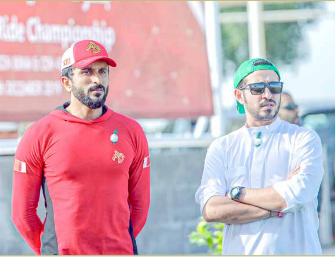
سمو الشيخ ناصر بن حمد وسمو الشيخ خالد بن حمد