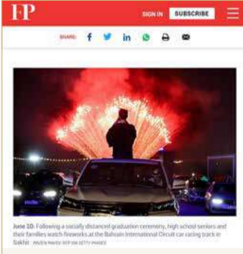
صورة نشرتها مجلة "فورين بوليسي"

إجراءات احترازية وتدابير صحية ووقائية فائقة. يُذكر أن "فورين بوليسي" هي مجلة أميركية تأسست العام 1970، وتهتم بإنتاج محتوى صحفي يعني بنقل الشؤون العالمية والأحداث الجارية والسياسة المحلية والدولية.