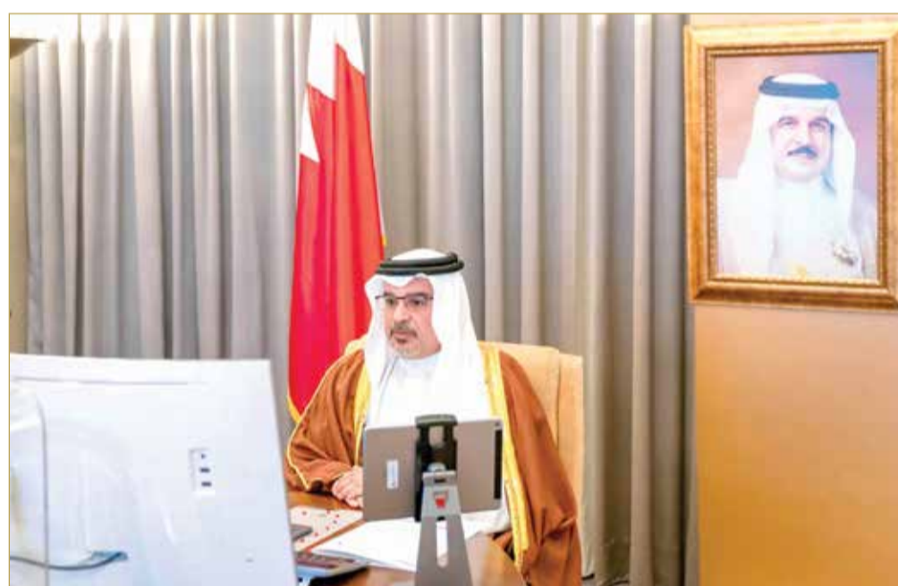
سمو ولي العهد رئيس مجلس الوزراء مترئساً جلسة مجلس الوزراء

أشاد مجلس الوزراء بالرعاية الملكية السامية لعاهل البلاد صاحب الجلالة الملك حمد بن عيسى آل خليفة لدعم وتمكين الشباب، منوها المجلس بجائزة الملك حمد لتمكين الشباب لتحقيق أهداف التنمية المستدامة وأهميتها في إبراز النماذج الشبابية المضيئة والمؤسسات الداعمة للشباب في المجتمعات. ورأس ولي العهد رئيس مجلس الوزراء صاحب السمو الملكي الأمير سلمان بن حمد آل خليفة الاجتماع الاعتيادي الأسبوعي لمجلس الوزراء الذي عقد صباح أمس عن بُعد. وأشاد المجلس بمستوى المشاركة في مسابقة الابتكار الحكومي (فكرة) في نسختها الثالثة، ووجه صاحب السمو الملكي ولي العهد رئيس مجلس الوزراء الوزارات والأجهزة الحكومية إلى دراسة إدراج الأفكار في برامجها ومشاريعها لما تحمله من بصمات إبداعية وطنية يجب أن تحظى بالرعاية الحكومية. (05)