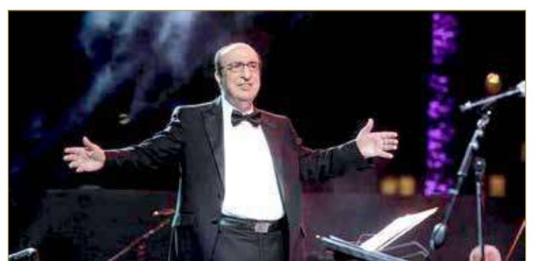
ومن حصيلة المسار الفني للراحل، أنه لحن أكثر من 2500 أغنية ومعروفة، 2000 منها عربية، و ألف موسيقى تصويرية لـ 25 فيلما. وتم تويج الراحل بكثير من الجوائز الدولية المرموقة مثل "جائزة روستوك" الألمانية، وجوائز أخرى في كل من البرازيل وبلغاريا وبريطانيا واليونان.

بعد مسيرة فنية حافلة تكلفت بعدد من الأعمال الخالدة، غيب الموت الموسيقار اللبناني، إلياس الرحباني، أمس الاثنين، إذ توفي عن عمر 83 عاما بعد إصابته بفيروس "كورونا" المستجد. والرحباني، من مواليد 1938 في محافظة جبل لبنان، إذ سلك مسارا فنيا متنوعا ومتفردا، فمزج بين التلحين والتوزيع وكتابة الأغاني، كما كان قائد