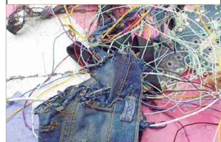
جانب من حطام الطائرة