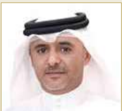
مساعد النائب العام المستشار وائل بوعلامي