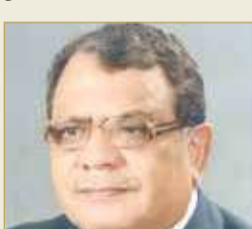
رئيس جمعية المحامين البحرينية حسن بدوي