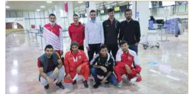
منتخب الدراجات الهوائية