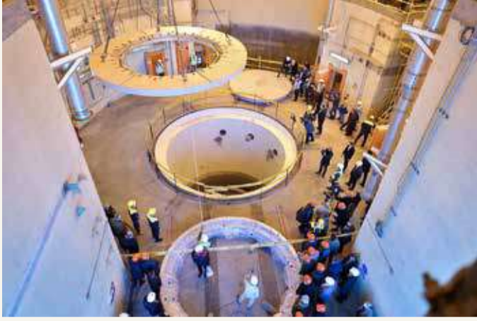
مفاعل آراك النووي الإيراني

منطقة الصرايم الأثرية الواقعة في عمق بادية دير الزور، وعمد إلى إغلاق المنطقة بشكل كامل، مانعا أي أحد من الاقتراب، بما في ذلك عناصر الحرس الثوري غير المشاركين في العملية.