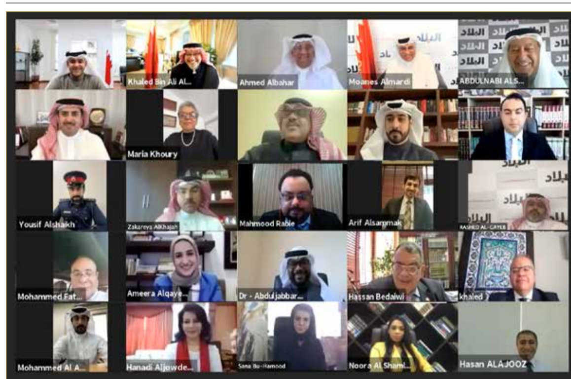
المشاركون في منتدى "البلاد"

الالكتروني، واستتمام مشروع أمور التنفيذ الخاص، ومشروع عقد الزواج الالكتروني. وأشار الى امكان الاتجاه مستقبلا لث جلسات المحاكم عبر الوسائط الرقمية. وذكر الوزير أن التحول الرقمي مكن محاكم التنفيذ من إصدار نصف مليون قرار في العام الماضي، وأصبح بإمكان قاضي التنفيذ أن يصدر أكثر من 300 قرار في اليوم. ومن جهته، تحدث مساعد النائب العام المستشار بوعلاي عن أبرز خطط النيابة بالمرحلة المقبلة وهي وقف التعامل الورقي بالكامل. (08-05)