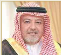
وزير العدل والشؤون الإسلامية والأوقاف الشيخ خالد بن علي آل خليفة