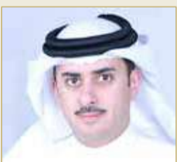
الأمين العام للمنظمات بوزارة الداخلية ورئيس مفوضية حقوق السجناء والمحجزين نواف المعاودة