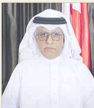
الشيخ سلمان بن إبراهيم

بشار إلى أن الشيخ أحمد الفهد قد أعلن استقالته من عضوية المكتب التنفيذي للاتحاد الدولي لكرة القدم العام 2017 وأصدر بياناً أكد من خلاله انسحابه من المشاركة في الانتخابات على العضوية الآسيوية في الفيفا والتي أقيمت في البحرين وهو المنصب الذي كان يتولا وذلك على خلفية إدانة المحكمة الأمريكية ”ريتشارد لاي“ العضو السابق بلجنة التقيق والامتثال بالفيفا، والذي يرأس اتحاد جوام لكرة القدم، بتورطه في قضية رشوة بقيمة مليون دولار، وقد نفى الشيخ أحمد الفهد تورطه أو علاقته بتلك المزاعم.