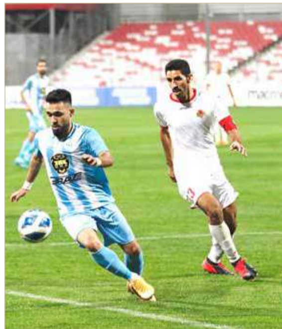
الرفاع فاز وتصدر الدوري

أدار المباراة الحكم إسماعيل حبيب، وعاونوه محمد جعفر وعبدالله يعقوب، والحكم الرابع عبدالله قاسم.