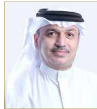
نواف عبدالله حمزة

أعلن رئيس هيئة التشريع والرأي القانوني المستشار نواف حمزة عن إطلاق المرحلة الثانية من برنامج التدريب الإلكتروني "إضاءات قانونية" حيث ستقدم الهيئة دورات تدريبية تفاعلية متخصصة تستهدف صقل الخبرات القانونية للقانونيين العاملين في الوزارات والجهات الرسمية، وذلك بدء من شهر يناير 2021. وأضاف "المرحلة الثانية ستشهد إضافة للدورات التفاعلية المتخصصة مع الاستمرار في المحاضرات العامة التي سبق للهيئة أن دشنتها والتي شهدت