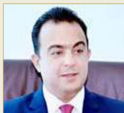
عضو مجلس الشورى المستشار علي عبدالله العراقي