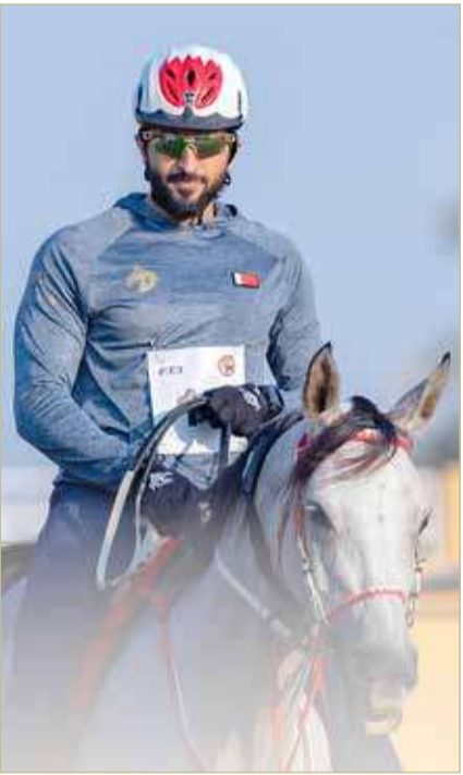
لقطة لسمو الشيخ ناصر بن حمد

لمسافة 30 كم، والمرحلة الخامسة (لون أصفر) لمسافة 20 كم.