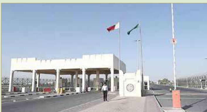
معبر أبو سمرة بين قطر والسعودية