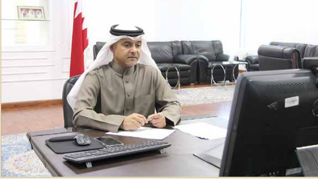
المستشار بوعلاي: الاستمرار في تنفيذ مشروعات التحول الإلكتروني

وختم بالقول "استطعنا تجاوز فعال في تلقي طلبات المراجعين وذوي الشأن والمحامين وإنجازها وفقا للقانون وقد أدى ذلك الى انخفاض المترددين على مقر النيابة العامة بشكل كبير وقد اختلفت موضوعات هذه الطلبات ما بين الحصول على إفادات القضايا والحصول على نسخ منها والاستعلام عن مواعيد الإجراءات واستفسار عن القضايا المحالة الى المحاكم وطلبات متعلقة بتنفيذ العقوبات البديلة ورد الاعتبار، والحق ان التوسع في استخدام وسائل التقنية في