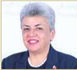
رئيس المؤسسة الوطنية لحقوق الإنسان ماريا خوري