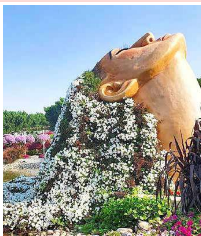
حديقة "زهور في العالم" في حديقة دبي المعجزة، والتي تقع في منطقة دبي لاند، بمساحة تفوق 72 ألف متر مربع، وتضم أكثر من 150 مليون زهرة مزروعة وأكثر من 120 نوعا من الزهور المختلفة.

وانتهت سنة 2020 بمعدل حرارة أعلى بـ 1,25 درجة مئوية من ذلك المسجل ما قبل العصر الصناعي، وهو المعدل نفسه الذي سجل العام 2016، إلا أن الفارق أن 2016 شهدت ظاهرة "إل نينيو" قوية، وهي ظاهرة طبيعية تتسبب بارتفاع درجات الحرارة، ولو شهدتها 2020 لكان ارتفاع معدل الحرارة فيها بما بين 0,1 و0,2 درجة، بحسب العلماء.