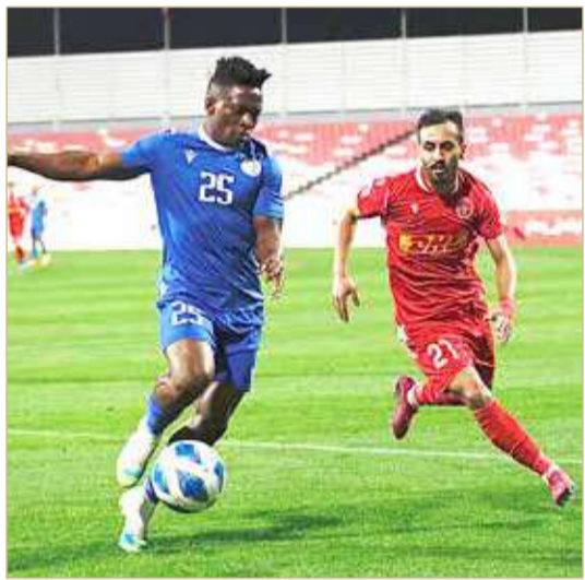
من لقاء المحرق والحد

ووصل رصيد المحرق إلى 8 نقاط مستثمراً فوزه الثاني على التوالي في منافسات الدوري، فيما بقي الحد عند رصيده السابق البالغ ٤ نقاط، متلقياً خسارته الثانية بعد