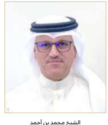
الشيخ محمد بن أحمد

للتعمير في مختلف مناطق المملكة رقم (28) لسنة 2009 مشيرا إلى أن أهم المخالفات في هذا الشأن متعلقة بمخالفات الإضافات وبناء بدون ترخيص ومخالفات العمل خلاف شروط البناء التنظيمية ومخالفات المباني ذات الحالة الإنشائية الحرجة ومخالفات البناء الغير قانوني