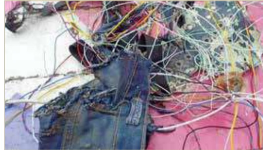
جانب من حطام الطائرة

كانت في حالة جيدة. كما أعلنت البحرية الإندونيسية، عن ارسال سفينتين إلى الموقع المفترض لسقوط الطائرة.