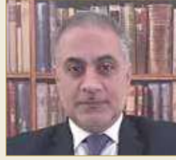
المحامي والمحكم الدولي الدكتور محمد رضا بوحسين