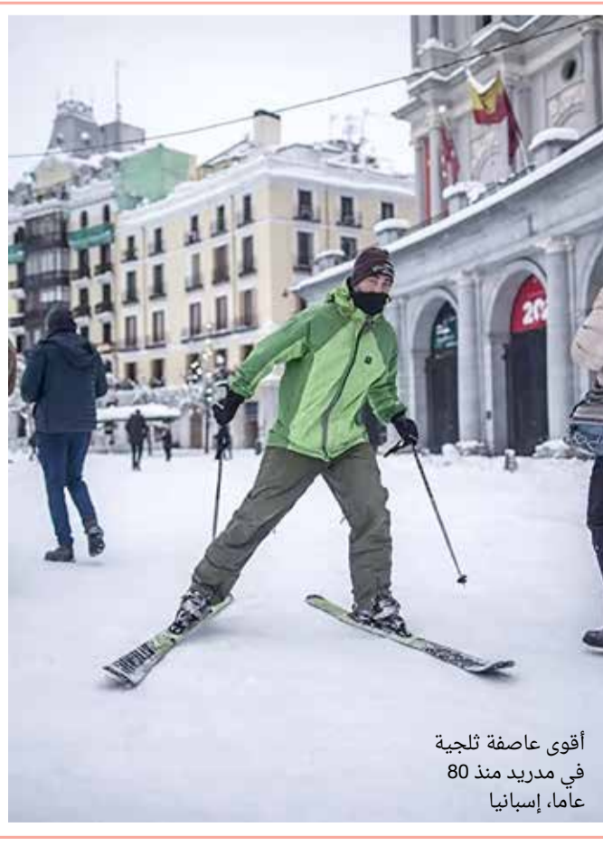
أقوى عاصفة ثلجية في مدريد منذ 80 عاما، إسبانيا

أغلقت المدارس والمحاكم والمتاحف في أنحاء مدريد أمس الإثنين بعد يومين على عاصفة ثلجية قوية اجتاحت وسط إسبانيا. وطلب المسؤولون من الأهالي لزوم منازلهم إن أمكن، عقب مرور العاصفة فيلومينا وتساقط ما بين 20 إلى 30 سنتم من الثلوج على مدريد السبت وهو ما لم يُسجل منذ 1971. وأودت العاصفة بثلاثة أشخاص على الأقل عندما اجتاحت إسبانيا مجبرة أجهزة الطوارئ وجرافات الجيش على العمل دون توقف للوصول إلى 2500 سائق عالقين في سياراتهم. وتخشى السلطات من احتمال تحول الثلج إلى جليد مع انخفاض متوقع للحرارة إلى 11 درجة تحت الصفر، و13 درجة تحت الصفر اليوم الثلاثاء.