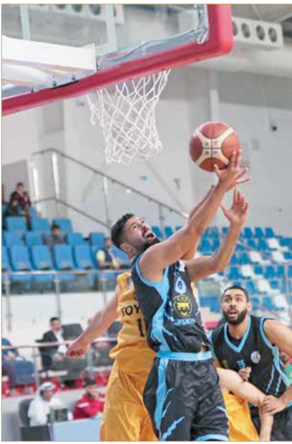
لقاء الرفاع والأهلي

وأطاح فريق الاتحاد بنظيره النويدرات بنتيجة (89/107)، وواقع الأشواط (20/23) الاتحاد، 22/25 الاتحاد، 24/26 الاتحاد،