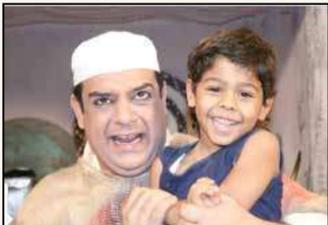
تعلق فطري بالأطفال