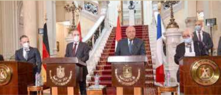
اجتماع رياضي رسمي يهدف إلى تحريك جهود السلام في منطقة الشرق الأوسط.

عقد وزراء خارجية مصر والأردن وفرنسا وألمانيا اجتماعاً جديداً أمس الإثنين في القاهرة؛ للعمل على إحياء عملية السلام الفلسطينية-الإسرائيلية. وناقش الوزراء الأربعة "الخطوات الممكنة لدفع عملية السلام في الشرق الأوسط وخلق بيئة مواتية لاستئناف الحوار بين الفلسطينيين والإسرائيليين". وأعلنت هذه المجموعة الرباعية، التي اجتمعت للمرة الأولى في ميونيخ في فبراير 2020 ثم في عمان في سبتمبر، أنها ستعقد اجتماعها المقبل في باريس من دون أن تحدد موعداً له. وفي مؤتمر صحفي مشترك عقب الاجتماع، قال وزير الخارجية الأردني أيمن الصفدي إن المجموعة تعمل على "منع أي إجراءات من شأنها تقويض حل الدولتين". ودان في هذا السياق إعلان إسرائيل