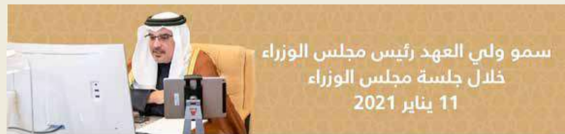
سمو ولي العهد رئيس مجلس الوزراء خلال جلسة مجلس الوزراء 11 يناير 2021

تطوير العمل الخليجي المشترك وتعزيز التنمية والأمن والاستقرار