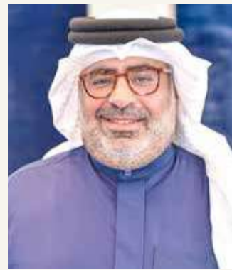
عبدالله بن عيسى

وأضاف الشيخ عبدالله بن عيسى آل خليفة أن إنجاز فريق "Seas Motor-sport2" بقيادة سمو الشيخ عيسى بن عبدالله بن حمد آل خليفة يؤكد جاهزية هذا الفريق وجميع أعضائه من أجل تحقيق المزيد من الإنجازات والألقاب في السباقات والبطولات القادمة.