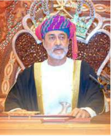
السلطان هيثم بن طارق

وبحسب الدستور يقوم مجلس العائلة المالكة خلال ثلاثة أيام من شغور منصب السلطان، بتحديد من تنتقل إليه ولاية الحكم. وإذا لم يتم الاتفاق، تُفتح رسالة تركها السلطان وحدد فيها اسم خليفته، ثم يجري تثبيته في منصب السلطان. ويُشترط فيمن يتم اختياره لولاية الحكم أن يكون مسلماً رشيداً عاقلاً وابناً شرعياً لأبوين عمانيين مسلمين. وتوفي السلطان قابوس الذي تولى الحكم لنحو 50 عاماً، في العاشر من يناير 2020 عن 79 عاماً. ولم يكن السلطان قابوس متزوجاً ولا أبناء أو أشقاء له ليرثوا الحكم من بعده، بل أبناء عمومة فقط. والسلطان الحالي هو أحد أبناء عمومته.