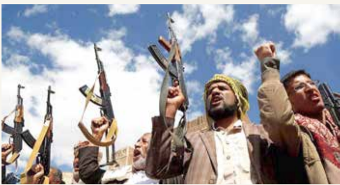
عناصر من ميليشيات الحوثي الإرهابية

أعربت وزارة الخارجية السعودية عن ترحيب حكومة المملكة العربية السعودية بقرار الإدارة الأمريكية بتصنيف ميليشيا الحوثي منظمة إرهابية، ووضع قياداتها ضمن قوائم الإرهاب؛ في خطوة منسجمة مع مطالبات الحكومة الشرعية اليمنية بوضع حد لتجاوزات تلك الميليشيا المدعومة من إيران وما تمثله من مخاطر حقيقية أدت إلى تدهور الوضع الإنساني للشعب اليمني، واستمرار تهديدها للأمن والسلم الدوليين واقتصاد العالم. وعبّرت الوزارة عن تطلعها في أن يسهم ذلك التصنيف في وضع حد لأعمال ميليشيا الحوثي الإرهابية وداعميها، حيث إن من شأن ذلك تحييد خطر تلك الميليشيات،