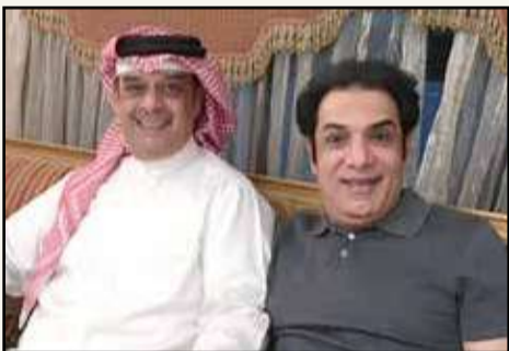
مع شقيقه الوفي ووليد الغرير