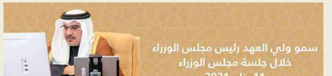
سمو ولي العهد رئيس مجلس الوزراء خلال جلسة مجلس الوزراء 11 يناير 2021