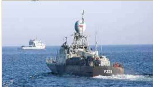
إيران تختبر صواريخ خلال مناورات عسكرية في الخليج

حذر وزير الخارجية ومستشار الأمن القومي الأمريكي الأسبق هنري كيسنجر، في مؤتمر لمعهد سياسة الشعب اليهودي، أمس الإثنين، من العودة إلى الاتفاق النووي مع إيران. وقال إنه على الإدارة الأميركية الجديدة ألا تعود إلى روح الصفقة الإيرانية التي قد تؤدي إلى سباق تسلح في الشرق الأوسط.