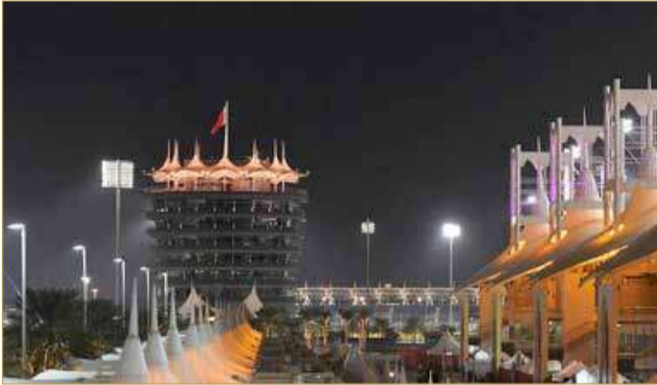
الموسم سيبدأ من حلبة البحرين الدولية

تتمتع التغييرات الأخرى للتقويم: تغيير موعد سباق جائزة الصين الكبرى في التاريخ المحدد له، مع إمكانية إعادة جدولة السباق، وعودة سباق إيمولا في 18 أبريل، انطلاق سباق السعودية وأبو ظبي خلال 5 ديسمبر و12 ديسمبر على التوالي، علاوة على ذلك، سيتم الإعلان كذلك عن سباق آخر على