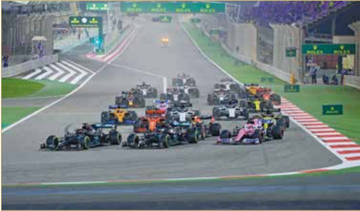
من سباقات الفورمولا 1

بينما نستعد للموسم الجديد. وللمزيد من المعلومات عن سباق جائزة البحرين الكبرى لطيران الخليج على حلبة البحرين الدولية يمكنكم زيارة الموقع الرسمي www.bahraingp.com أو الاتصال على الخط الساخن 17450000.