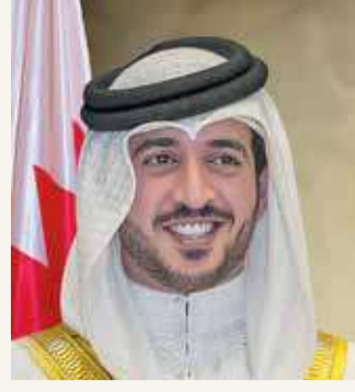
سمو الشيخ خالد بن حمد