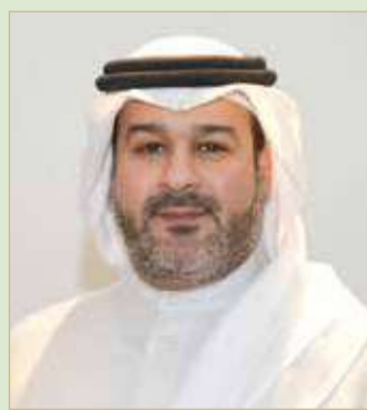
الشيخ حمد بن سلمان

كفاءة مصابيح الإنارة المنزلية الذي طبق في سبتمبر 2015، الذي ساهم في منع استيراد المصابيح المتوهجة "التنجستن"، وكذلك البرنامج الرقابي الثاني لرفع كفاءة الطاقة في أجهزة التكييف والذي تم إلزام به في فبراير 2016، من خلال وضع بطاقة تعريفية على المكيف معتمدة على النجوم، وكلا البرنامجين هو ثمرة التعاون على المستوى الوطني مع هيئة الكهرباء والماء. من جانب آخر، هناك أيضاً تعاون على المستوى الخليجي مع هيئة التقييس لدول مجلس