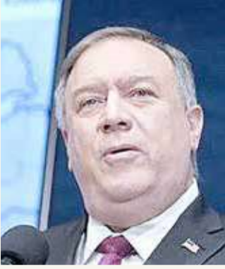
بومبيو: إيران هي أفغانستان الجديدة بالنسبة لتنظيم القاعدة

عرض وزير الخارجية الأمريكي، مايك بومبيو، أمس الثلاثاء، جملة من الأدلة بشأن علاقة وثيقة بين إيران وتنظيم القاعدة الإرهابي الذي شن هجمات دموية في كثير من دول العالم.