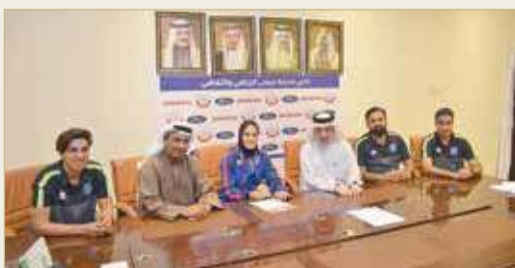
من توقيع العقود

في خطوة غير مسبوقه وضمن رؤية ناصر بن حمد