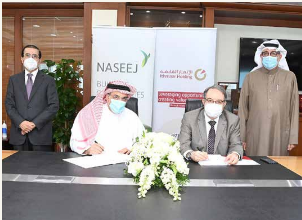
أثناء توقيع الاتفاقية

أعلنت شركة نسيج، إحدى شركات التطوير العقاري الرائدة في مملكة البحرين، عن توقيعها اتفاقية شراكة مع شركة الإثمار القابضة يتم بموجبها تطوير مشروع سكني بقيمة 40 مليون دينار في منطقة باربار بالمحافظة الشمالية، على مساحة تقدر بحوالي 150 ألف متر مربع.