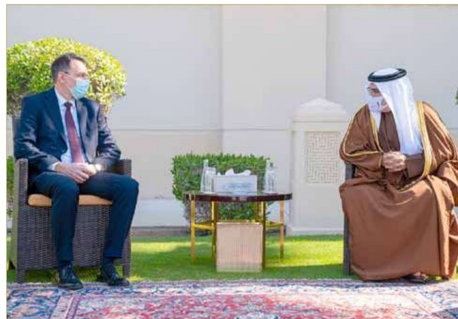
سمو ولي العهد رئيس الوزراء أثناء الاستقبال

استقبل ولي العهد رئيس الوزراء صاحب السمو الملكي الأمير سلمان بن حمد آل خليفة، في قصر الرفاع أمس سفير جمهورية ألمانيا الاتحادية الصديقة لدى مملكة البحرين كاي ثامو بوكمان، والقائم بأعمال سفارة الولايات المتحدة الأميركية لدى مملكة البحرين مارغريت ناردي. ونوه سموه بأهمية مواصلة تعزيز التعاون الدولي المشترك في ظل الظروف العالمية الاستثنائية لجائحة فيروس كورونا على كل المستويات لدعم الجهود العالمية للتصدي للجائحة، معرباً سموه عن تقديره للتعاون المثمر بين مملكة البحرين والولايات المتحدة الأميركية، ومملكة البحرين وجمهورية ألمانيا الاتحادية فيما يتعلق بجهود مواجهة جائحة فيروس كورونا وتسهيل توفير اللقاحات للمملكة والتي ستسهم في حماية كل أفراد المجتمع من الفيروس.