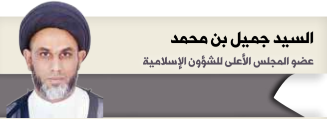
السيد جميل بن محمد عضو المجلس الأعلى للشؤون الإسلامية

القمة الخليجية التي عقدت في محافظة العلا بالمملكة العربية السعودية الشقيقة. كما أعلن المجلس ترحيبه بدعوة وزارة الخارجية البحرينية لبدء المباحثات الثنائية بين مملكة البحرين ودولة قطر المغلقة القضايا والموضوعات المتعلقة بين البلدين تفعيلاً لما نص عليه بيان العلا، وهو ذات الأمر والمطلب الذي دعا له مجلس النواب بعقد جلسات ثنائية مباشرة لبحث كافة المسائل والقضايا، تحقيقاً لما فيه الخير لمواطني البلدين الشقيقين، وتعزيزاً لمسيرة العمل الخليجي المشترك.