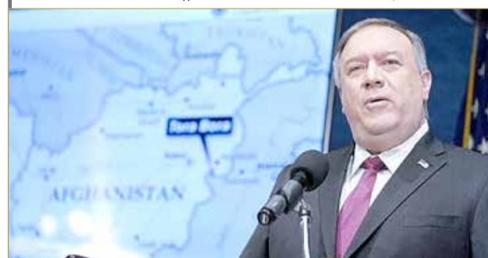
بومبيو: إيران هي أفغانستان الجديدة بالنسبة لتنظيم القاعدة