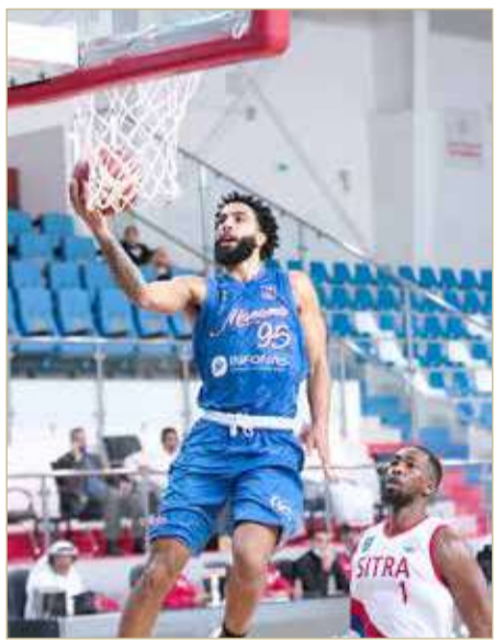
لقاء المنامة وسترة