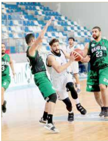
لقاء النجمة والبحرين