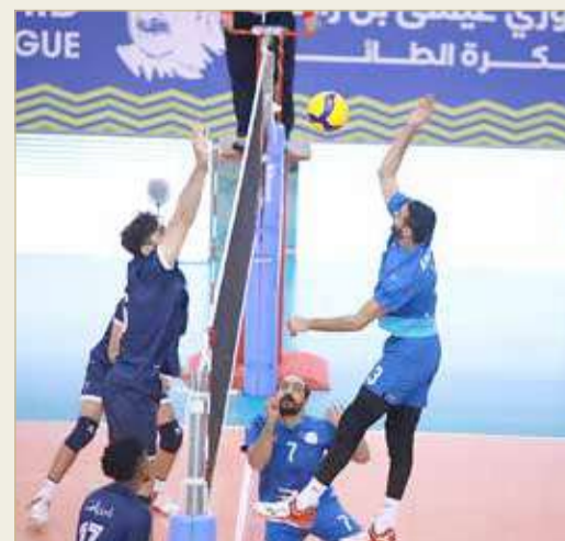
مواجهة النجمة وعالي

النجمة يعبر أجواء عالي بدوري عيسى بن راشد