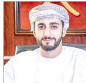
ذي يزن بن هيثم

أصدرت سلطنة عمان أمس الثلاثاء نص "النظام الأساسي للدولة" الذي تضمن تعديلات على آلية انتقال الحكم نصت على أن ولاية الحكم تنتقل "من السلطان إلى أكبر أبنائه سناً، ما يجعل أكبر أبناء السلطان هيثم بن طارق، وليا للعهد.