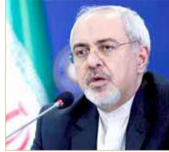
وزير الخارجية الإيراني محمد جواد ظريف

إدارة النفوذ الإيراني عن طريق تمويل الوكلاء.