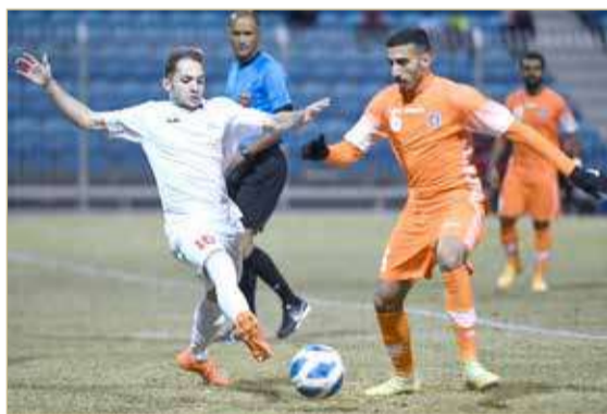
من لقاء الحالة وسترة

التضامن يحقق نقطته الأولى.. والبحرين والتضامن يتعادلان بلا أهداف