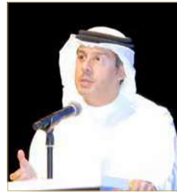
الرئيس التنفيذي لشركة "ممتلكات"

مشروع القانون في ضوء ما سيرعاه الفريق الحكومي من توافق في الاجتماع المقبل.