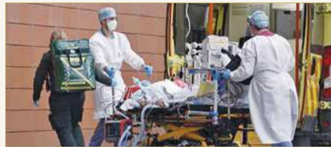
"مآسي" في مستشفيات بريطانيا

معدلات الإصابة، يقول المسؤولون "إن معدلات الوفيات والضغط على الخدمات الصحية الوطنية ستستمر في النمو". وقال كبير المستشارين العلميين للحكومة باتريك فالانس، لشبكة سكاي نيوز، عندما سئل عن الوضع في المستشفيات "الوضع سيء للغاية في الوقت الحالي، هناك ضغوط هائلة.. بعض المستشفيات تبدو وكأنها منطقة حرب".