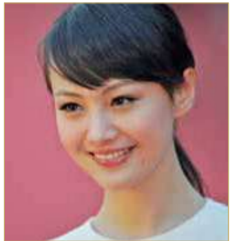
الممثلة الصينية الشهيرة شونغ شوانغ

أنهت علامة "برادا" التجارية تعاونها مع الممثلة الصينية الشهيرة شونغ شوانغ بعدما كشفت الصحافة المحلية تخليها عن طفلها المولودين من أم بديلة إثر انفصالها عن شريكها.