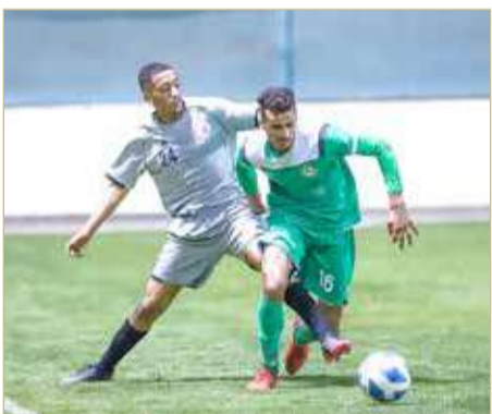
من لقاء البحرين والتضامن

أدارها الحكم محمد مرشد، وعاونه عبدالسلام فواز وأحمد الغريب، والحكم الرابع إسمايل حبيب. وبناء على ذلك، يكون ترتيب دوري الدرجة الثانية كالآتي: الاتفاق 17 نقطة، الشباب 15 نقطة، الحالة 13 نقطة، سترة 11 نقطة، مدينة عيسى 10 نقاط، قلالي 10 نقاط، الخالدية 10 نقاط، البحرين 7 نقاط، الاتحاد 4 نقاط، والتضامن في المركز الأخير بنقطة وحيدة.