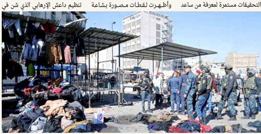
قوات أمنية تتفقد مكان الانفجارين

مع ارتفاع حصيلة القتلى في التفجير الانتحاري المزودج الذي استهدف سوقاً شعبياً، أمس الخميس، في ساحة الطيران وسط بغداد إلى 32 قتيلاً، ترأس رئيس مجلس الوزراء مصطفى الكاظمي اجتماعاً طارئاً لقيادة الأجهزة الأمنية والاستخباراتية بمقر قيادة عمليات بغداد. ووجه الكاظمي بفتح تحقيق فوري للوقوف على أسباب التفجيرين، وملاحقة الخلايا الإرهابية التي سهلت مرور المنفذين. كما وجه باستنفار القوات الأمنية لحفظ أمن المواطن واتخاذ الإجراءات الكفيلة بذلك ميدانياً. وقال "وضعنا كل إمكانيات الدولة وجهود قطعنا الأمنية في حالة استنفار قصوى"، وفق ما نقلته وكالة الأنباء العراقية.