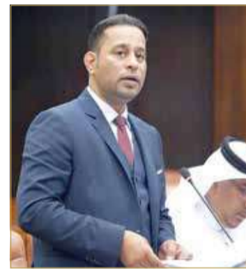
النائب محمود البحراني

◆ 56 مليون دينار أرباح حقل البحرين وإنتاجه يقل 16 % سنويا