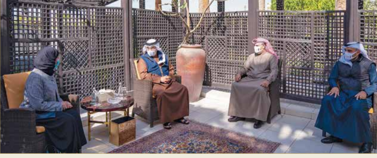
سمو ولي العهد رئيس مجلس الوزراء في لقاء مع رئيسة مجلس النواب

◆ سمو ولي العهد رئيس الوزراء: المشاريع الحكومية موجهة للمواطن