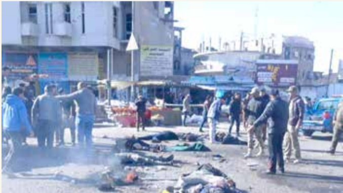
من موقع التفجير وسط بغداد

يشار إلى أن هذا الاعتداء يأتي في وقت تناقش السلطات تنظيم انتخابات تشريعية، وهو استحقاق غالباً ما يترافق مع أعمال عنف في العراق. وأعدت هذه التفجيرات مشهداً كان العراقيون يحاولون نسيانه وهو مشهد الدماء والأشلاء الناجمة عن التفجيرات الانتحارية قبل سنوات.