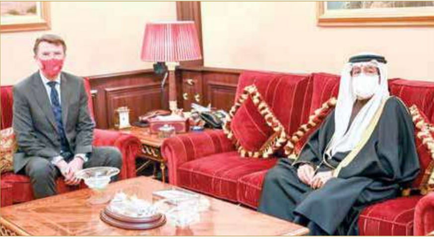
سمو الشيخ علي بن خليفة آل خليفة مستقبلاً السفير السابق للمملكة المتحدة ايان ليندسي

◆ سمو الشيخ علي بن خليفة: التعاون الثنائي في نمو مستمر