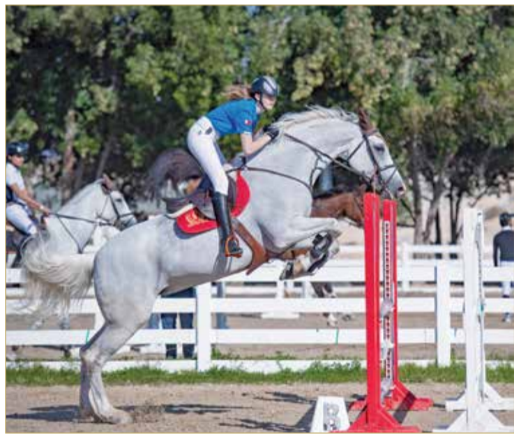
من منافسات قفز الحواجز

مشراكة واسعة وإثارة منتظرة في البطولة الخامسة