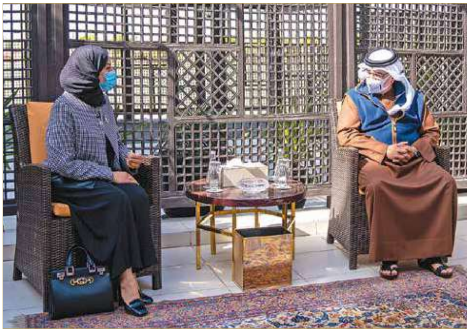
سمو ولي العهد رئيس مجلس الوزراء في لقاء مع رئيسة مجلس النواب

سمو ولي العهد رئيس الوزراء: المشاريع الحكومية موجهة للمواطن