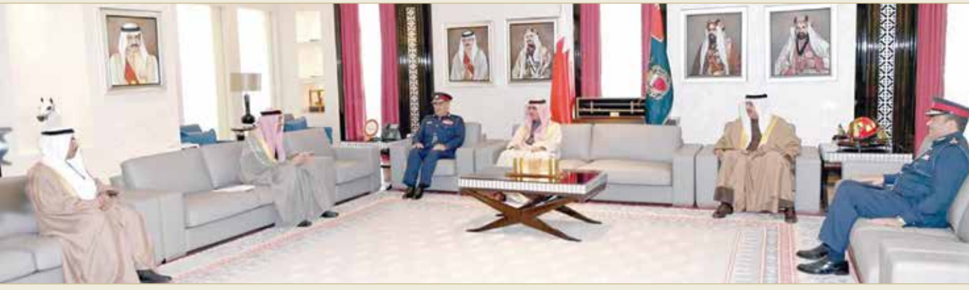
المنامة - وزارة الداخلية

بينها طلب التأشيرة... وإجمالي الخدمات يرتفع إلى 104