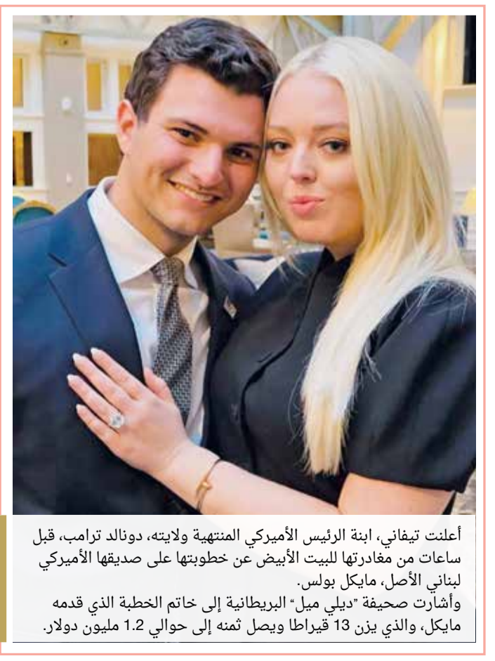
أعلنت تيفاني، ابنة الرئيس الأميركي المنتهية ولايته، دونالد ترامب، قبل ساعات من مغادرتها للبيت الأبيض عن خطوبتها على صديقها الأميركي لبناني الأصل، مايكل بولس. وأشارت صحيفة "ديلي ميل" البريطانية إلى خاتم الخطبة الذي قدمه مايكل، والذي يزن 13 قيراطاً ويصل ثمنه إلى حوالي 1.2 مليون دولار.

انتقدت محطة "فوكس نيوز" التلفزيونية حرق ضيوف حفل تنصيب الرئيس الأميركي الجديد جو بايدن، قواعد التباعد الاجتماعي لتفادي الإصابة بفيروس كورونا. وقالت المحطة: إن شخصيات بارزة في الحفل لم تحافظ على مبدأ الحديث عن بعد 6 أقدام (1.8 متر). وأضافت أنه على الرغم أن عدد الحضور كان قليلاً بسبب الوباء، لكن الشخصيات رفيعة المستوى لا تحترم التباعد الاجتماعي. ولفتت إلى أن الرؤساء السابقين والسيدات الأوائل ارتدوا الأقنعة الطبية، لكنهم لم يلتزموا بالتباعد الاجتماعي وراح بعضهم يحتضن عدداً من الحضور. وأشارت إلى أن بايدين ونائبته كامالا هاريس كانا قريباً جداً من بعضهما البعض، موضحة أن بايدين تلقى جرعتي اللقاح، في حين لم تتلق هاريس سوى جرعة واحدة.