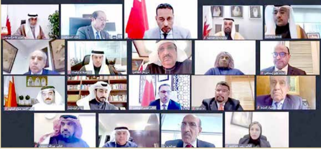
الاجتماع الحكومي البرلماني الخامس لمناقشة مشروع قانون الميزانية العامة للدولة

◆ وزارة الشباب ستستفيد من صالات المدارس.. و25 ألف دينار كلفة إنشاء الملعب