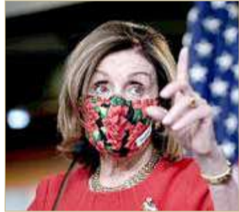
رئيسة مجلس النواب الأميركي نانسي بيلوسي

ارتكب انتهاكا غير مسبوق في تاريخ الكونغرس".