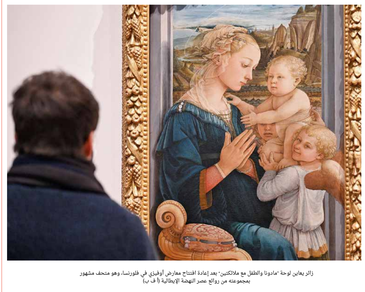
زائر يعاين لوحة "مادونا والطفل مع ملائكتين" بعد إعادة افتتاح معارض أوفييزي في فلورنسا، وهو متحف مشهور بمجموعته من روائع عصر النهضة الإيطالية

إدارة التحرير: +973 17111444 / +973 17111467 / 385 @albiladpress.com / 2008 / تصدر عن دار البلاد للصحافة والنشر والتوزيع / س ت 67133 / تطبع في مؤسسة الأبرام للنشر / قسم الإعلانات: 508 / +973 17111501 / +973 32224492 / 39615645 / +973 17111434 / +973 17111432 / الاشتراكات والتوزيع: +973 17580939