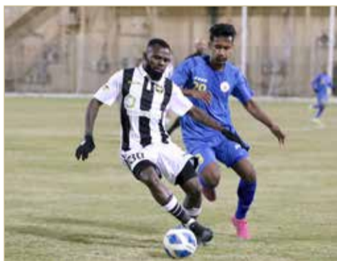
من لقاء الخالدية وقلالي