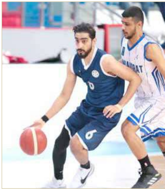
لقاء النجمة والنويدرات

البحرين يحقق انتصاره الثاني من بوابة مدينة عيسى