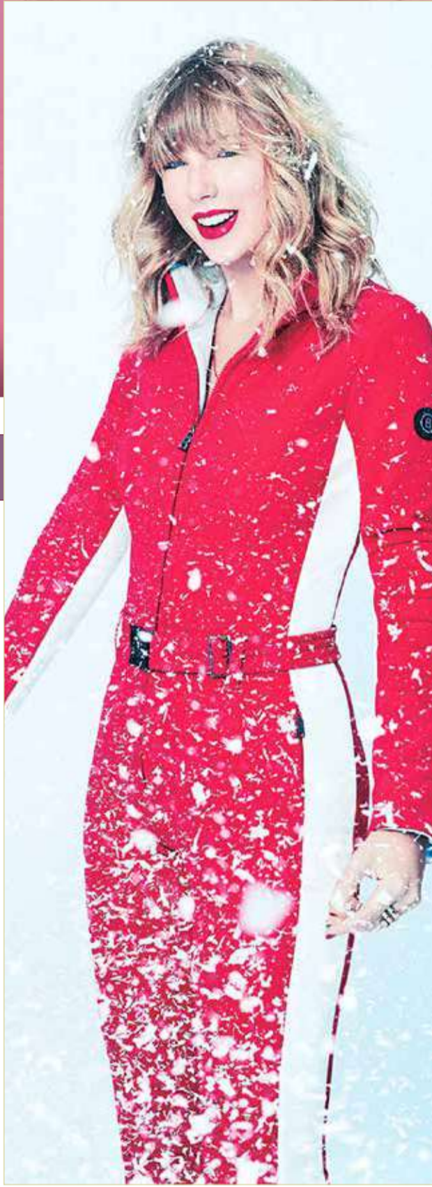
« تصدرت النجمة تايلور سويت قائمة "Billboard 200" بألبومها الجديد "Evermore"، للأسبوع الثالث غير المتتالي، بعد أن كان رقم 2 قبل أسبوع. وحصل الألبوم على 56000 وحدة اليوم مكافئة في الولايات المتحدة.