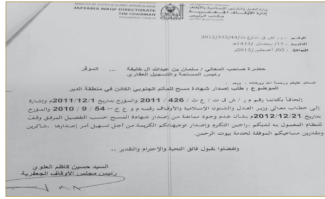
رسالة من رئيس الأوقاف العام 2012 لطلب شهادة مسح عن الماتم الجنوبي بالدير