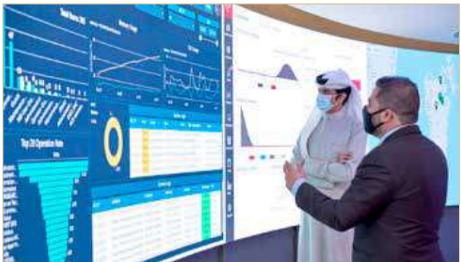
أثناء افتتاح مركز عمليات الشبكة الذكية