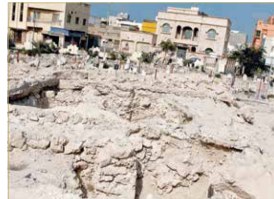
بقايا أثرية تعود لمسجد وبقايا مبنى قديم يعود للفترة المسيحية

بعد اكتشاف مسجد الشيخ مالك الأثري ومبنى مسيحي وتسييجهما