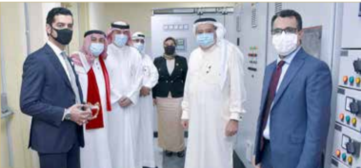
المنامة- هيئة شؤون الكهرباء والماء

بكلفة 3.5 ملايين دينار وتعمل بنظام الطاقة الشمسية