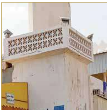
كلفة هدم المنارة 8 آلاف دينار

إبلاغها بالأمر وطلب الموافقة على هدم وإعادة بناء المنارة. - تمت مخاطبة مهندس من أبناء القرية ولديه مكتب هندسي لهدم وإعادة بناء المنارة، وقد وافق على