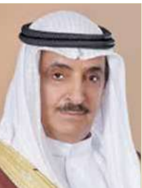
الشيخ سلمان بن عبدالله

صرح رئيس جهاز المساحة والتسجيل العقاري الشيخ سلمان بن عبدالله بن حمد آل خليفة، بأن مجموع حجم التداول العقاري للعام الماضي 2020 بلغ نحو 717 ألفاً و436 ديناراً، وبمقارنة هذه النتائج للعام الذي سبقه 2019 والتي وصل فيها التداول العقاري نحو 804 ملايين و934 ألفاً و154 ديناراً أي بنسبة نقصان تقدر بـ 11%.