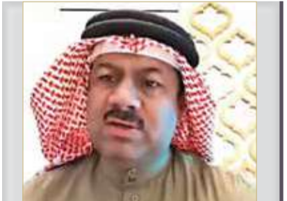
الديري: لم يقصر الأهالي في شراء الأراضي ووقفها