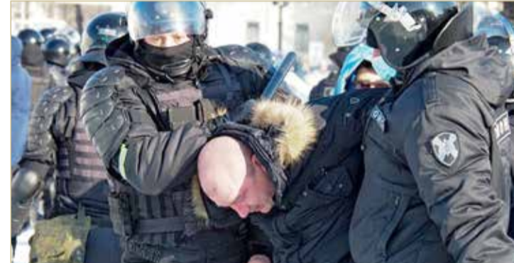
جانب من التظاهرات في روسيا

قبل أشهر من الانتخابات التشريعية المرتقبة في الخريف على خلفية تراجع شعبية الحزب الحاكم "روسيا الموحدة". وجرت التظاهرات الأولى أمس في أقصى شرق روسيا، حيث خرج آلاف الأشخاص إلى الشوارع في فلاديفوستوك وخاباروفسك وقوبلت بعدد كبير من عناصر الشرطة.