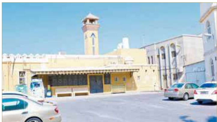
أرض الجمعية الوقفية غير مسجلة