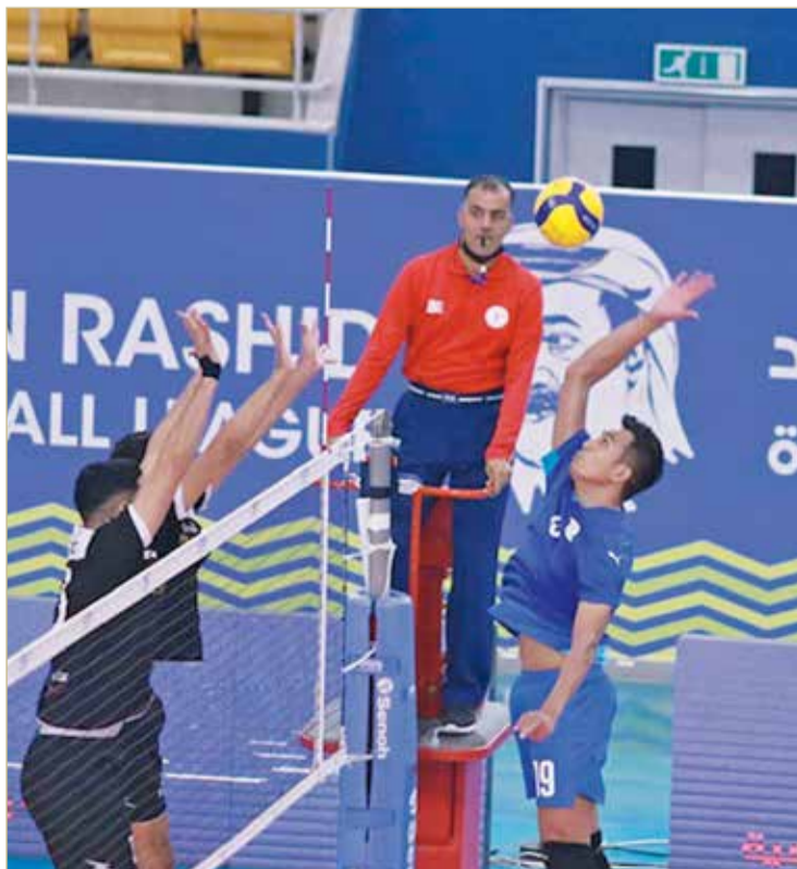
من لقاء عالي وبني جمرة