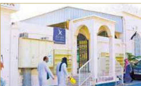
التصدعات خطيرة وقد تؤدي لإصابة المصلين

ذلك وتكفل بمصاريف توفير الأيدي العاملة المناسبة للمشروع مع وضع تصور للتكلفة المالية للمشروع. - تم التواصل مع إدارة الأوقاف الجعفرية برسالة لإصدار وثيقة للجامع