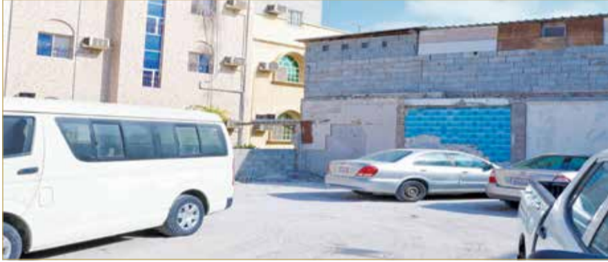
كل المخططات جاهزة لضم العقارين الملائقين للماتم الجنوبي بالدير

وواصل "رتبنا العديد من الزيارات مع المسؤولين ووجدنا التعاون الإيجابي من قبل وزير العمل والتنمية الاجتماعية وكذلك من إدارة الأوقاف الجعفرية، وتبين أن الكثير من الطلبات متوقفة ليس لدى الأوقاف، بل لدى وزارة العدل أو هيئة الكهرباء، وطلبت من الأوقاف استلام الخطابات لكي أتابعها."