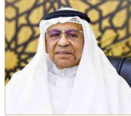
رئيس الأوقاف الجعفرية