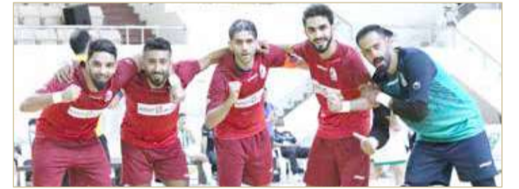
فرحة الماروني بالانتصار على خورفكان