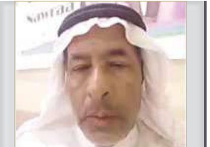
بوعباس: حصول الماتم الجنوبي على الوثيقة والمسح عقبة كؤود