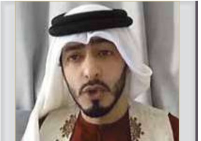
الحاج: طلب رخصة بناء بماتم محمد علي معطل منذ 8 سنين