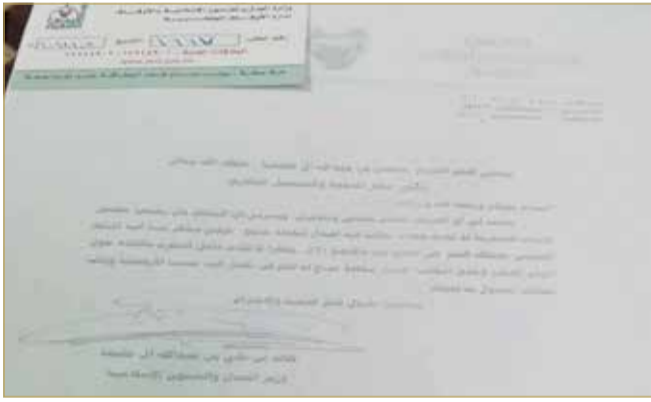
رسالة من وزير العدل بشأن شهادة المسح للماتم الجنوبي بالدير