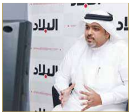
الرئيس راشد الغائب أدار اللقاء

الغائب يشكر أكثر من 70 مشاركاً في لقاء الصحيفة مع الأهالي