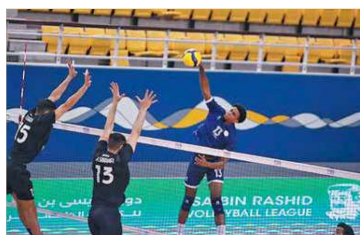
كوستا تألق أمام الأهلي