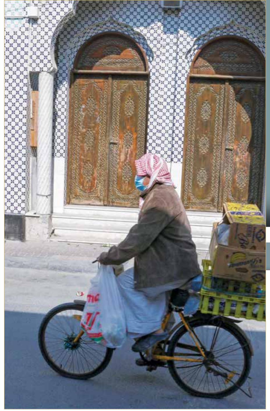
امام ماتم محمد علي بالدير