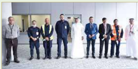
وزير "المواصلات" منقدا مراكز التحكم بمبنى المسافرين

البحريين وصل مهاراتهم وإعدادهم لتولي مناصب قيادية في قطاع النقل الجوي، وهو ما يأتي ضمن أهم أهداف برنامج تحديث المطار. كما يتفق مع برنامج عمل الحكومة ورؤية البحرين الاقتصادية 2030.