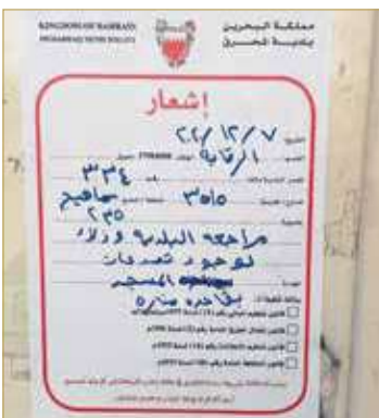
إشعار البلدية عن المنارة