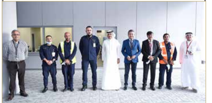
وزير ”المواصلات“ متفقد مراكز التحكم بمبنى المسافرين