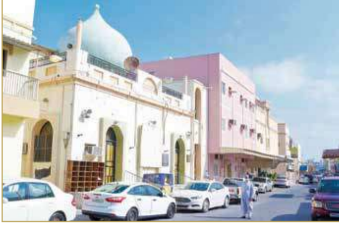
الماتم الجنوبي بقرية الدير