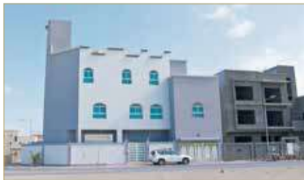
مقر جمعية الهدى

لا تستطيع الجمعية تشييد أي مشروع عليها حتى اليوم