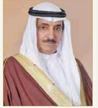
الشيخ سلمان بن عبدالله

صرح رئيس جهاز المساحة والتسجيل العقاري رئيس مجلس إدارة مؤسسة التنظيم العقاري الشيخ سلمان بن عبدالله بن حمد آل خليفة، بأن مجموع حجم التداول العقاري للعام الماضي 2020 بلغ نحو 717 ألفاً و436 ألفاً و872 ديناراً، ومقارنة بنتائج العام الذي سبقه 2019، كان قد وصل التداول العقاري لنحو 804 ملايين