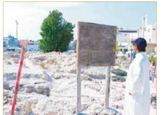
مسجد الشيخ مالك الأثري

البلاد وخرج المسجد من يد الأوقاف. ويشير الحاج إلى قرار هيئة البحرين للثقافة والآثار الصادر قبل عام بتسجيل تل مقبرة سماهيح ضمن قائمة التراث الوطني. وجاء في القرار أن الموقع الأثري يتضمن تلاً أثرياً يقع بوسط مقبرة سماهيح ويضم بقايا أثرية تعود لمسجد