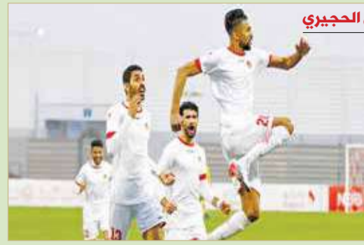
فرحة شرقاوية تكررت مرتين

البلاد | أحمد مهدي