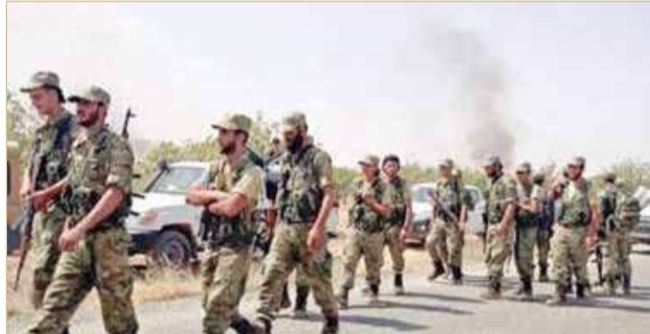
مقاتلون اجانب في ليبيا

مع انتهاء المهلة المحددة للقوات الأجنبية