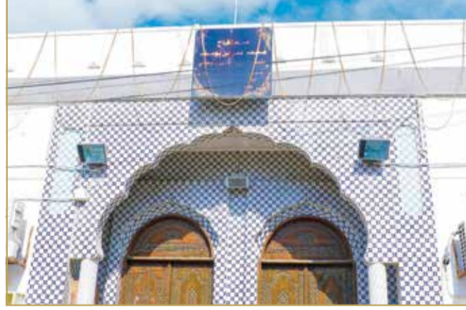
ماتم محمد علي من أقدم الماتم بالبحرين وتأسس العام 1846