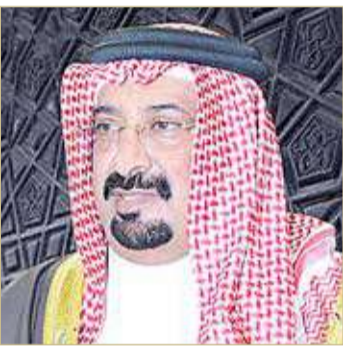
أحمد بن علي

تدعم القطاع الرياضي . وأكد الشيخ أحمد بن علي آل خليفة رئيس نادي المحرق أن قانون الاحتراف الرياضي يعتبر خطوة على الطريق الصحيح من أجل بناء الرياضة البحرينية على الأسس السليمة القائمة على الاحتراف. وأكد رئيس النادي الأهلي خالد كانو أن تطبيق الاحتراف الرياضي يساهم في الارتقاء بالرياضة البحرينية ويرفع من شأنها على مختلف الأصعدة.