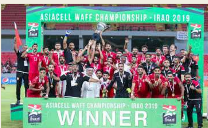
منتخبنا الوطني حامل لقب النسبة الأخيرة لبطولة غرب آسيا للرجال

التي حددت خلال يونيو المقبل، بحيث يتم تحديد البلد المستضيف لاحقًا بعد مخاطبة الاتحادات الأهلية الأعضاء، كما تتضمن الخطة إقامة بطولتي الناشئات الثالثة والشابات الثالثة إما في يونيو أو يوليو المقبلين، بحيث تكونان محطتين تحضيريتين قبل التصفيات الآسيوية لكأس آسيا تحت 20 عامًا والمقررة من 14 إلى 22 أغسطس 2021، وكذلك قبل التصفيات الآسيوية لكأس آسيا تحت 17 عامًا المحددة من 18 إلى 26 سبتمبر 2021. ويسعى الاتحاد كذلك لإقامة بطولة أندية السيدات الثانية خلال مايو المقبل بضيافة الاتحاد الأردني لكرة القدم.