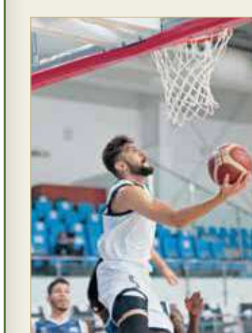
لقاء النجمة وسماهيج

الاتحاد يلعب مع المنامة في الساعة 5.30 مساءً، وتليها مباراة الأهلي والحالة في الساعة 7.45، وبيروز اللقاء الثاني كثيرًا نحو تحديد هوية المتأهلين للمربع.