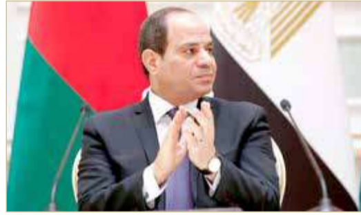
الرئيس المصري عبدالفتاح السيسي

وقال: إن الوضع المستقر لمصر جاء تجسيدا للإرادة الجمعية الصلبة للدولة وشعبها العظيم، وكان حصادا لتضحيات أبنائها من رجال الشرطة بجانب إخوانهم البواسل من القوات المسلحة، مشدداً على أهمية استمرار اليقظة والجهد من الجميع لمحاصرة وتطوير أي محاولة يائسة لأزعجة أمن واستقرار الوطن أو المساس بمكتسبات الشعب المصري. وأضاف قائلاً إن تحقيق ما نصبو إليه من تقدم وازدهار في كافة المجالات يحتاج إلى بيئة آمنة ومستقرة وأرض ثابتة، ونحن اليوم نحوض معركة لا تقل ضراوة أو أهمية، وهي معركة البناء من أجل تحقيق التنمية الشاملة وخلق مستقبل