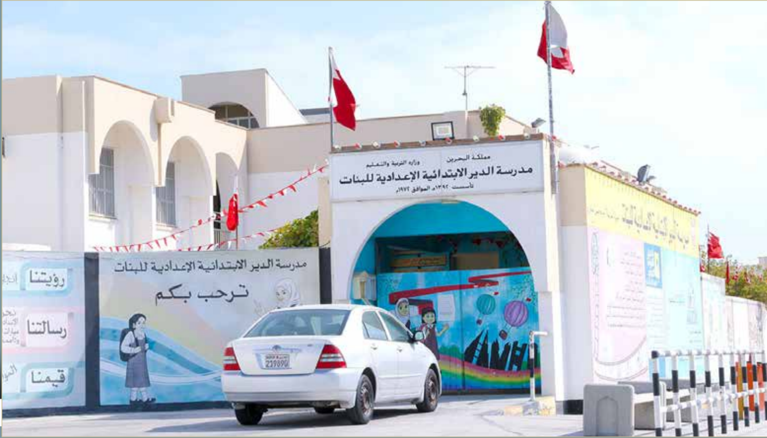
1088 طالبة بمدرسة الدير الابتدائية الإعدادية للبنات