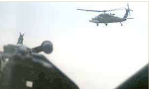
التحالف ضرب مخبأ لداعش شمالي العراق

وحول وجود 3000 حكم بالإعدام لم تتم المصادقة عليه، نفى الحديدي "وجود هكذا رقم لدى رئاسة الجمهورية"، مؤكداً استمرار الرئاسة في تدقيق وإصدار مراسيم الإعدام. وأكد أن "الرئاسة لم تتعمد في التأخير بإصدار مراسيم الأحكام، وإن حصل تأخير فهذا يرجع إلى التدقيق". من جهتها، أعربت منظمات حقوقية عن خشيتها أن تعطي الرئاسة العراقية الضوء الأخضر لتنفيذ سلسلة إعدامات كرد فعل بعد التفجيريين الانتحاريين الداميين في بغداد. في غضون ذلك،