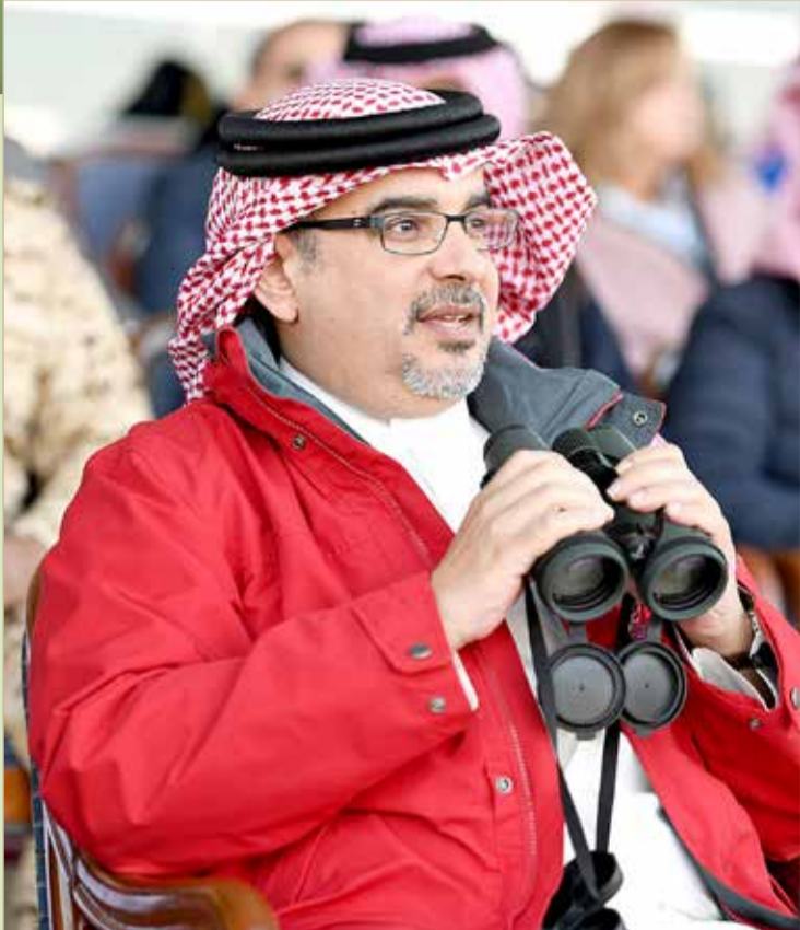
سمو ولي العهد رئيس الوزراء خلال حضوره أحد سباقات الخيل

الرعاية والدعم لهذا السباق الكبير ورياضة سباق الخيل الأصيلة