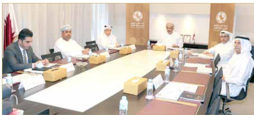
جانب من اجتماعات لجنة التفتيش سابقا

عدة نتيجة الظروف الأمنية التي يعاني منها البلد وكانت سببًا في إغلاق ملاعبه بأن لا تقام عليها أي مباراة دولية بقرار من الفيفا، وتولي وزارة الشباب والرياضة العراقية ملف الاستضافة أهمية كبيرة من خلال تجهيز المنشآت الرياضية لاستضافة الحدث الخليجي الأهم في المنطقة.