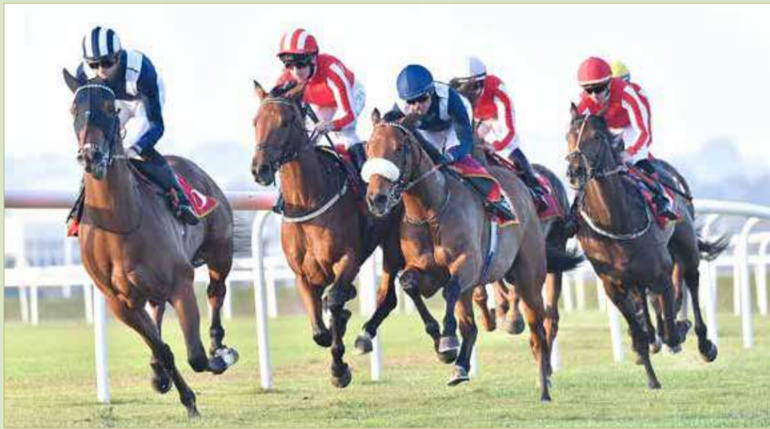
منافسات قوية بين نخبة الجياد في السباق المرتقب

المستوردة، وذلك في مؤشر ينذر بمنافسات قوية ومثيرة مرتقبة بين نخبة الجياد والتي سبق للعديد منها تحقيق الانتصارات بكؤوس السباقات الكبيرة وآخرها أبطال الكؤوس الغالية في سباق الموسم الماضي ومن بينها الحصان "كحيلان عافص 1708" الفائز بكأس سمو ولي العهد للجياد العربية الموسمين الماضيين، وكذلك الحصان "بولسار" الفائز بكأس سمو ولي العهد للنتائج المحلي، والحصان "بورت ليونز" الفائز بكأس ولي العهد للجياد المستوردة، حيث ستواجه هذه الجياد الأبطال تحديًا لإثبات جدارتها بتكرار فوزها بالكؤوس الغالية على رغم المنافسات المرتقبة التي ستواجهها من أقوى الجياد وأبرزها الحصان "سمسبير" بطل كأس البحرين الدولي 2020 والجياد "رايون بور" الذي