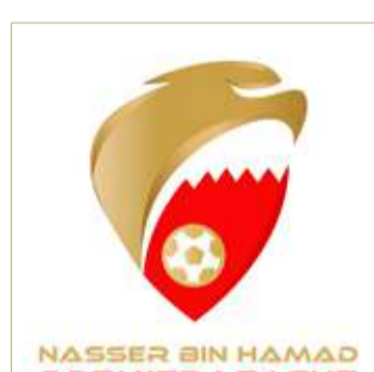
الحد لم يشرك لاعباً "تحت 21"

يظهر الجولات المقبلة مع الحداويين ومشاركته في المباريات. على صعيد متصل، فإن نادي المالكية والمنامة هما الوحيدان اللذان استوفيا المعيار حتى الآن، إذ أشرك المالكية 6 لاعبين لمدة 1140 دقيقة والمنامة 6 لاعبين أيضاً لمدة 1219 دقيقة. وفي باقي إحصاءات الأندية، فإن الأهلي أشرك 3 لاعبين لمدة 402 دقيقة، البديع لاعب واحد لمدة 439 دقيقة، النجمة لاعبين اثنين لمدة 767 دقيقة، البسيتين 3 لاعبين لمدة 712 دقيقة، الرفاع الشرقي لاعبين اثنين لمدة 497 دقيقة، المحرق 6 لاعبين لمدة 487 دقيقة، الرفاع 5 لاعبين لمدة 620 دقيقة.