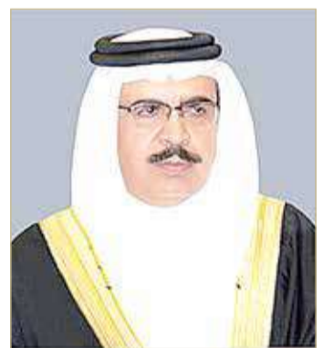
الشيخ راشد بن عبدالله

♦ القرار يحسن الحركة المرورية وحملة توعوية بالإجراءات