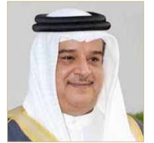
سمو الشيخ عبدالله بن عيسى