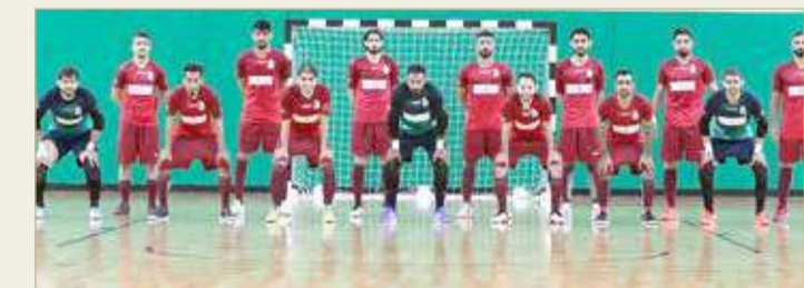
فريق كرة قدم الصالات بنادي الشباب

محققا 9 نقاط، وصعد بطلًا للمجموعة الثالثة. ويسعى الماروني في لقاء اليوم إلى تأكيد ظهوره القوي في البطولة ومواصلة تألقه وإثبات قدرته كفريق منافس بقوة في المسابقة، عبر تحقيق النتيجة الإيجابية التي ستقوده إلى التأهل للمباراة