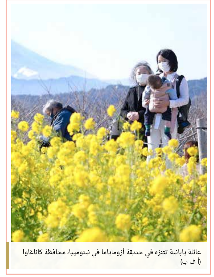
عائلة يابانية تنزه في حديقة أزوماياما في نينومييا، محافظة كاناغاوا

« وكان الحادث على مسمع من الجيران، الذين طلبوا الشرطة على الفور بعد سماعهم أصوات صراخ وشجار، وتم نقل الزوج إلى المستشفى حيث يتلقى العلاج.