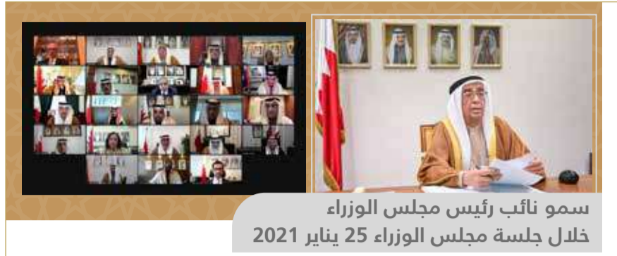
سمو نائب رئيس مجلس الوزراء خلال جلسة مجلس الوزراء 25 يناير 2021

مجلس الوزراء: إسهمات جلالة الملك عززت الأمن العالمي