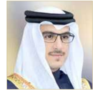
سمو الشيخ عيسى بن سلمان