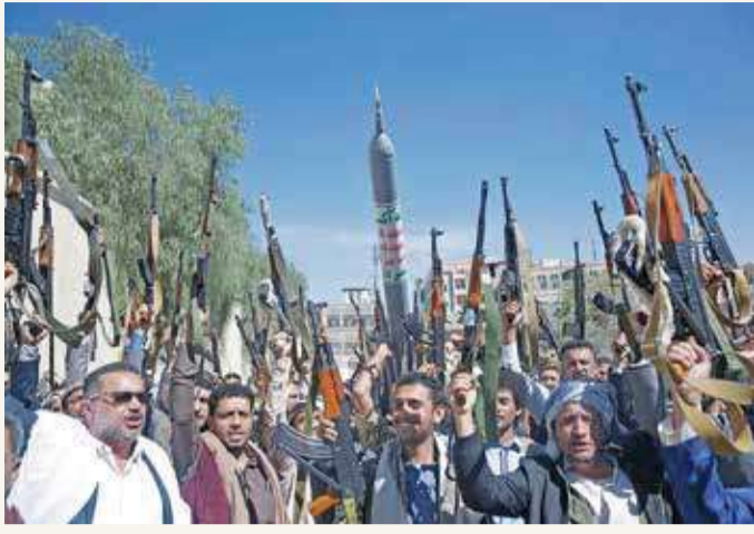
عناصر من ميليشيا الحوثي

وقال وزير الإعلام اليمني في تغريدة على صفحته بموقع تويتر "تحذر من مخطط خبيث تديره ميليشيات الحوثي وعناصر الحرس الثوري لحشد المواطنين بالقوة لتجمعات في العاصمة المختطفة صنعاء، وتنفيذ تفجيرات بين المدنيين تحت غطاء القاعة وداعش، للتغطية على هجومها الإرهابي على مطار عدن الدولي، واستعطاف واستمالة المجتمع الدولي". وتعتزم ميليشيات الحوثي، المدرجة على اللائحة الأميركية