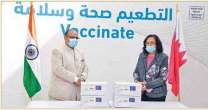
المنامة - وزارة الصحة

يذكر أن لقاح "كوفيشيلد - أسرازينيكا" المضاد لفيروس كورونا "كوفيد 19"، يتوجب الحصول على جرعتين، حيث سوف تغطي الجرعة الثانية بعد 28 يوماً من تلقي الجرعة الأولى. ونوهت وزارة الصحة باستمرارها في الحملة الوطنية للتطعيم والاستعدادات الرامية لتوفير التطعيمات للجميع، بإشراف ومتابعة من الفريق الوطني الطبي للتصدي لفيروس كورونا، ومواصلة الجهود الحثيثة التي تهدف للتصدي للجائحة.