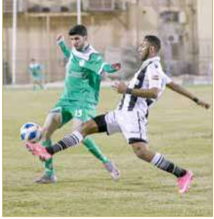
من لقاء الخالدية والبحرين