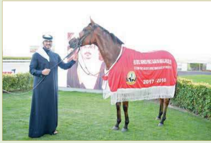
سمو الشيخ عيسى بن سلمان بعد أحد الانتصارات

سمو ولي العهد ولي العهد ولي العهد ولي العهد ولي العهد ولي العهد ولي العهد ولي العهد ولي العهد ولي العهد