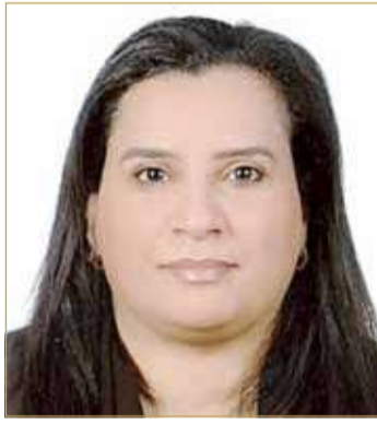
الشيخة مريم بنت خليفة