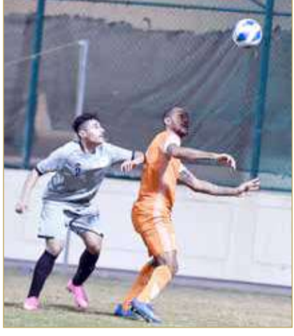
من لقاء الحالة والنظام

الخالدية يكسب البحرين في ختام الجملة 8 لدوري الثانية