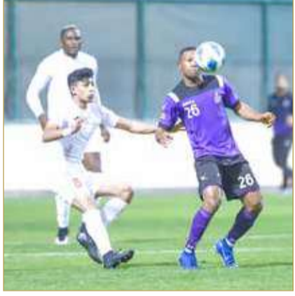
من لقاء سترة والاتحاد