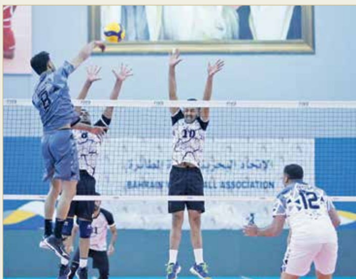
من لقاء التضامن والنيبه صالح في الدور التمهيدي

التنافس على لقب دوري الدرجة الثانية لكرة الطائرة