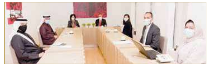
المنامة - هيئة البحرين للثقافة والآثار

استقبلت رئيسة هيئة البحرين للثقافة والآثار الشيخة مي بنت محمد آل خليفة بمتحف البحرين الوطني أمس، وزير الأشغال وشؤون البلديات والتخطيط العمراني عصام خلف. وقد تبادل الطرفان الرؤى حول أهم المشاريع الثقافية المشتركة ما بين هيئة البحرين للثقافة ووزارة الأشغال وشؤون البلديات والتخطيط العمراني، مؤكداً أهمية التعاون والتكامل من أجل تعزيز البنى التحتية الثقافية. كما تمت مناقشة مشروع الارتقاء بشوارع الشيخ حمد بمدينة المحرق العريقة، والذي يهدف إلى تحسين الهوية الجمالية والبصرية، وينسجم مع هوية المدينة وأصالتها بما يتسق مع