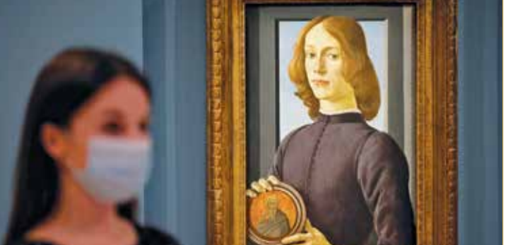
وما تزال لوحة بونتيتشيلي في حال حفظ استثنائية مع أنها تعود إلى أكثر من 500 عام.

عرضت دار "سوذبيز" للمزادات أمس الخميس لوحة للفنان ساندر بونتيتشيلي، أحد أهم رسامي عصر النهضة الإيطالي، قدر ثمنها بأكثر من 80 مليون دولار، في وقت يفتقر سوق الأعمال الفنية إلى البريق. فنذ 20 شهرًا، لم تُبع أي لوحة لقاء 100 مليون دولار مثلاً، وبالتالي ولت مرحلة الأرقام القياسية التي شهدتها السنوات الممتدة من 2015 إلى 2018 ولم تعد أخبار المزادات تستحوذ على العناوين الرئيسية لوسائل الإعلام. فهل تصل إلى هذه العتية الرمزية لوحة بونتيتشيلي التي تمثل شابًا وسيقًا ذا شعر طويل يحمل ميدالية؟ لدى "سوذبيز" في نيويورك كريستوفر أبوستل "عند النظر إلى لوحة كهذه، وهي استثنائية جدًا، ينبغي مقارنتها بالروائع الأخرى، كلوحات بيكاسو وبيكون وباسكيا" التي حطمت الأرقام القياسية في السنوات الأخيرة.