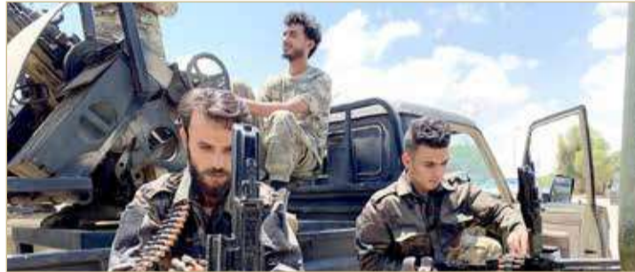
عناصر من قوات الوفاق في طرابلس

اشتباكات بين قوتين تابعتين للوفاق في طرابلس