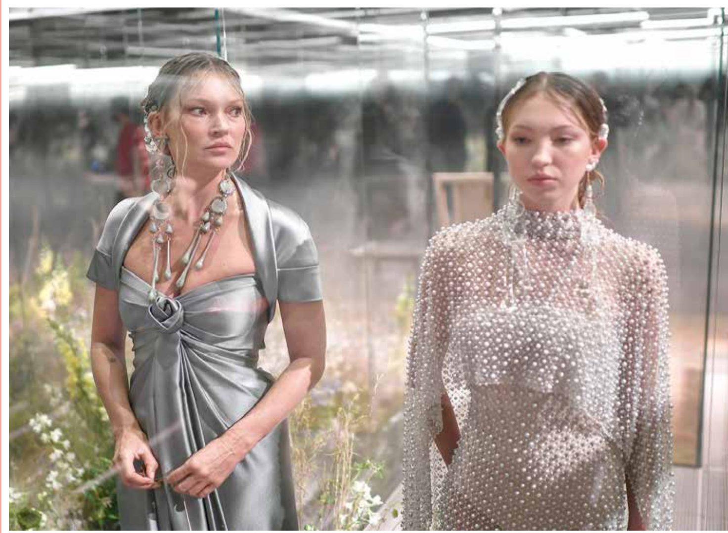
تقدم العارضتان البريطانيتان كيت موس (يسار) وابنتها ليلي جريس موس-هاك إبداعات للمصممة البريطانية كيم جونز من مجموعة فندي لربيع وصيف 2021 أثناء أسبوع الموضة في باريس