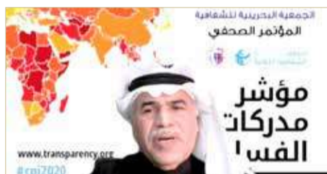
شرف الموسوي خلال مؤتمر إطلاق التقرير

البحرين في الحد من آثار الجائحة سواء على المستوى الصحي أو على المستوى الاقتصادي، حيث حقق فريق البحرين بقيادة سمو ولي العهد رئيس مجلس الوزراء صاحب السمو الملكي الأمير سلمان بن حمد آل خليفة نجحاً سواء على مستوى انخفاض الوفيات بنسبة تقل عن 0.4% من الإصابات وبلغت نسبة المتعافين 98%، وهي نسبة نجاح عالية جداً. وواصل: أما على مستوى توفير اللقاحات المتنوعة، فقد وصل عدد المواطنين والمقيمين الذين أخذوا اللقاح إلى أكثر من 150 ألف، حيث يقدم اللقاح مجاناً للجميع بناء على توجيهات