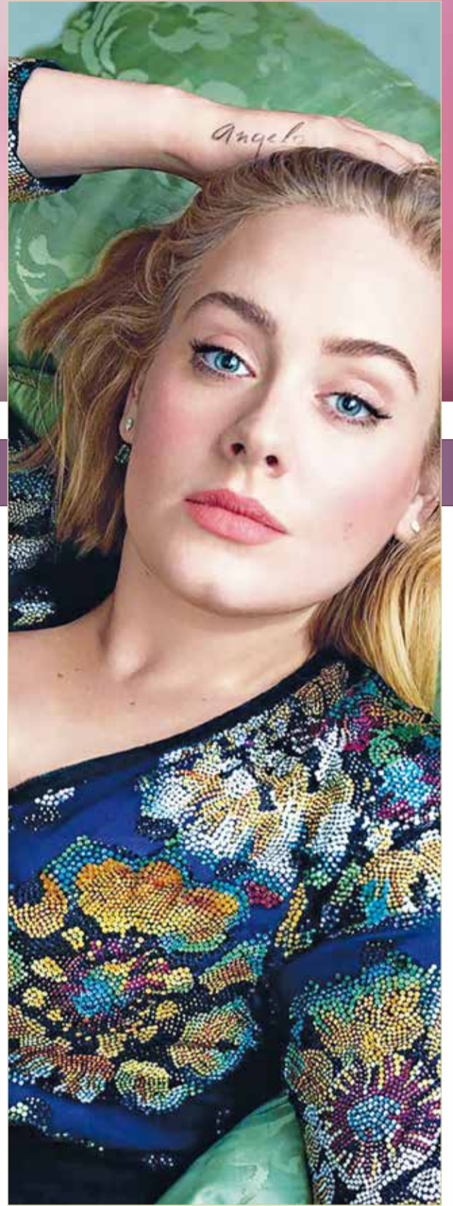
« احتفلت مؤخرا أديل بالذكرى العاشرة لاليومها الحائز جائزة 21، والذي أصدرته العام 2011 وتعلق على مجموعة صور نشرتها: "من الجنون أن أذكر القليل عما كان عليه وكيف شعرت قبل عقد من الزمن". »