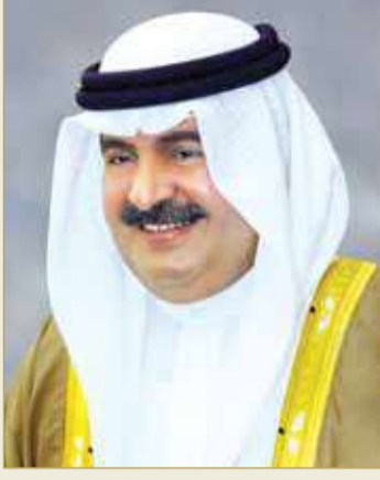
سمو الشيخ علي بن خليفة

المجلس من مهام أخرى في مجال عمل الوقف، يجوز لمجلس الأمناء أن يعهد إلى لجنة أو أكثر تُشكل من بين أعضائه