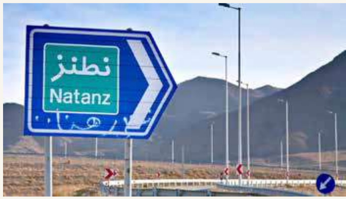
إيران تؤكد مضيها قدماً في تخصيب اليورانيوم

مهدة بتطبيق الانسحاب من البروتوكول الإضافي إذ لم يتم رفع العقوبات