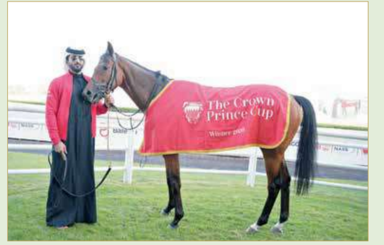
سمو الشيخ ناصر بن حمد بعد أحد الانتصارات

سمو ولي العهد للموسم الثاني على التوالي والتي ظفر بها الموسم الماضي بكأس المستورد وكأس الخيل العربية بالحصانين "كحيلان عافص 1708، بورت ليونز"، حيث سيخوض فيكتوريبوس الشوط السابع والرئيسي بالجياد القوية المرشحة "سمسير، نبو شو، مكاك"، كما يسعى إسطنبول فيكتوريبوس للمحافظة على لقب كأس ولي العهد للجياد العربية للموسم الثالث من خلال مشاركته بالجوادين البطليين في سباقات الخيل العربية "كحيلان عافص 1708، الجلابي 1544" اللذين حققا الكأس الموسمين الأخيرين.