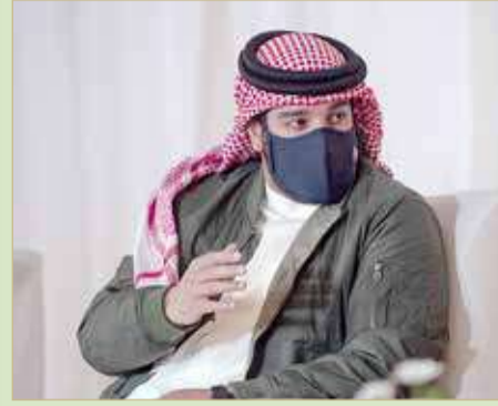
سمو الشيخ عيسى بن عبدالله