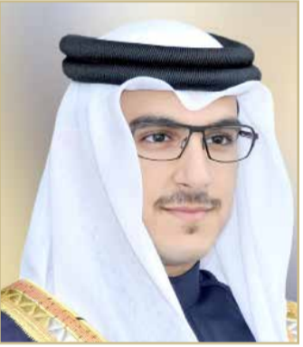
سمو الشيخ عيسى بن سلمان

صدر عن رئيس الهيئة العليا لنادي راشد للفروسية وسباق الخيل سمو الشيخ عيسى بن سلمان بن حمد آل خليفة قرار رقم (1) لسنة 2021 بإعادة تشكيل الهيئة العليا لنادي راشد للفروسية وسباق الخيل.