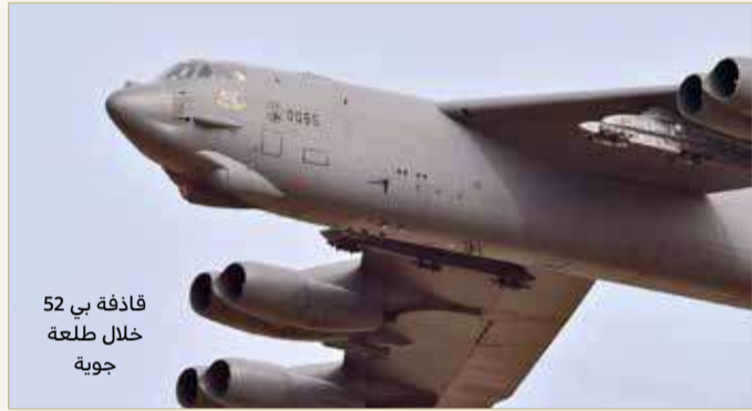
قاذفة بي 52 خلال طلعة جوية

بيان لم يترك حيزاً للتأويل أو التكهن، أن إرسال القاذفات يأتي لإظهار التزام الولايات المتحدة المستمر بالأمن الإقليمي وردع أي عدوان.