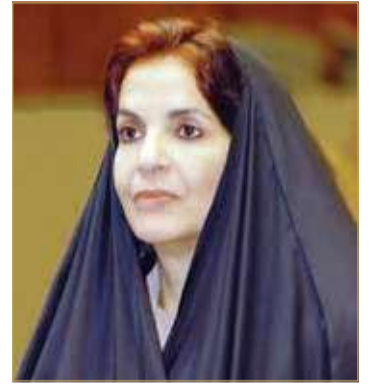
سمو الأميرة سبيكة بنت إبراهيم