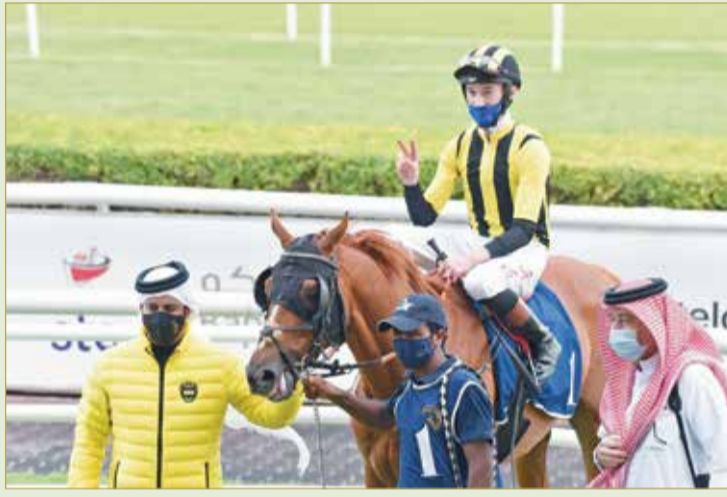
سمو الشيخ خالد بن حمد بعد أحد الانتصارات