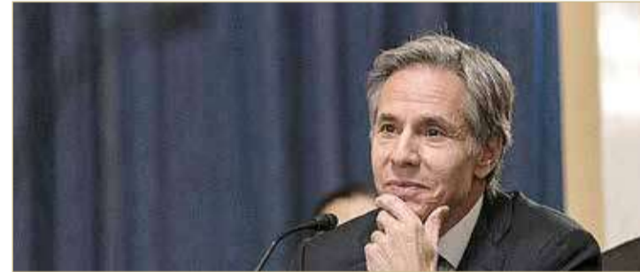
وزير الخارجية الأميركي أنتوني بلينكن

الرئيس الأميركي سيواصل العمل فيما يتعلق باتفاقات أبراهام