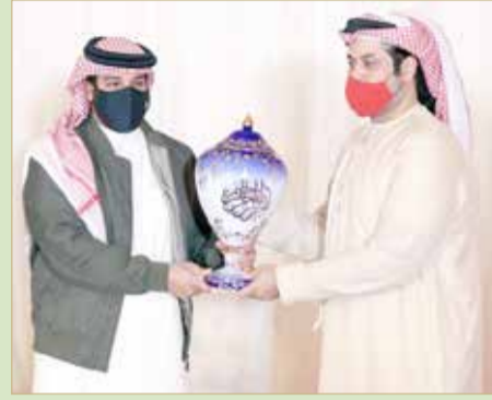
سمو الشيخ عيسى بن عبدالله يتوج الأبطال