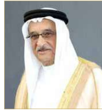
الشيخ محمد بن عبدالله