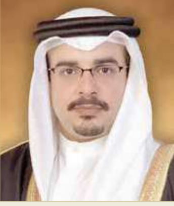
سمو ولي العهد رئيس مجلس الوزراء