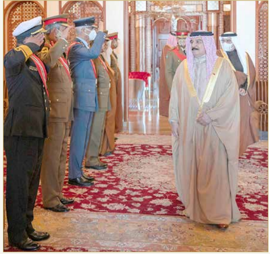
جلالة الملك لدى استقباله، بحضور سمو ولي العهد رئيس الوزراء، كبار ضباط قوة الدفاع