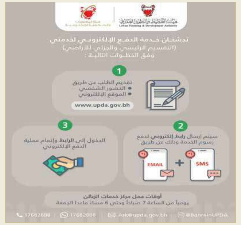
”التخطيط العمراني“ تتيح الدفع الإلكتروني المباشر لخدماتها

التخطيط العمراني ل”تتيح الدفع الإلكتروني المباشر لخدماتها