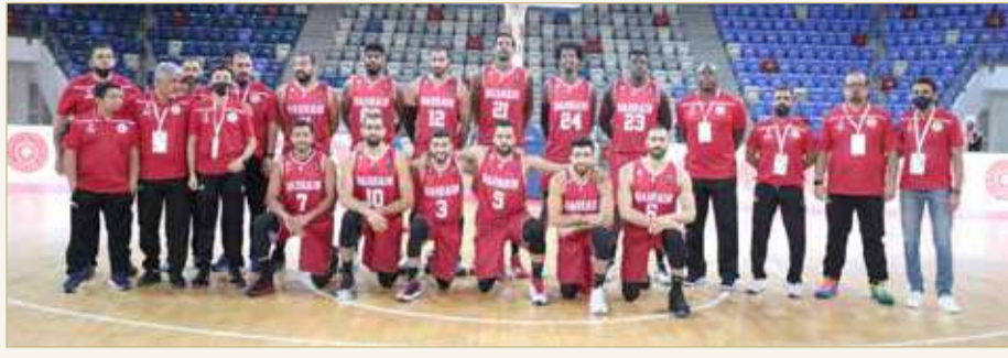
منتخب البحرين لكرة السلة

يلتقي المنتخبين اللبناني والعراقي رسمياً والأردن ودياً