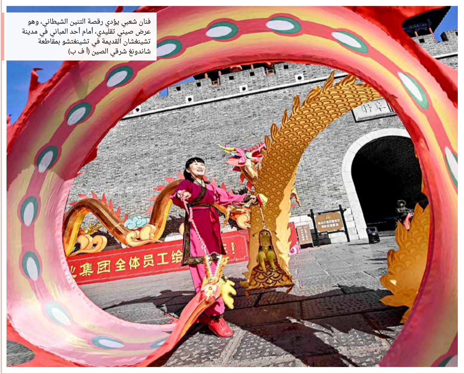
فنان شعبي يؤدي رقصة التنين الشيطاني، وهو عرض صيني تقليدي، أمام أحد المباني في مدينة تشينغشان القديمة في تشينغتشو بمقاطعة شانونغ شرق الصين