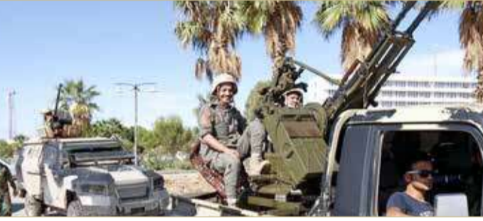
اللجنة العسكرية تناقش إجراءات اتفاق وقف النار

المشتركة (5+5). وأضافت في حينه أنه "بحسب ما ورد في تقرير الأمين العام للأمم المتحدة إلى مجلس الأمن في 30 ديسمبر 2020، الذي اقترح فيه ترتيبات لدعم وقف إطلاق النار من خلال إنشاء وحدة مراقبة كجزء من بعثة الأمم المتحدة للدعم في ليبيا، فمن المتوقع إرسال عدد محدود من المراقبين المحايدين.