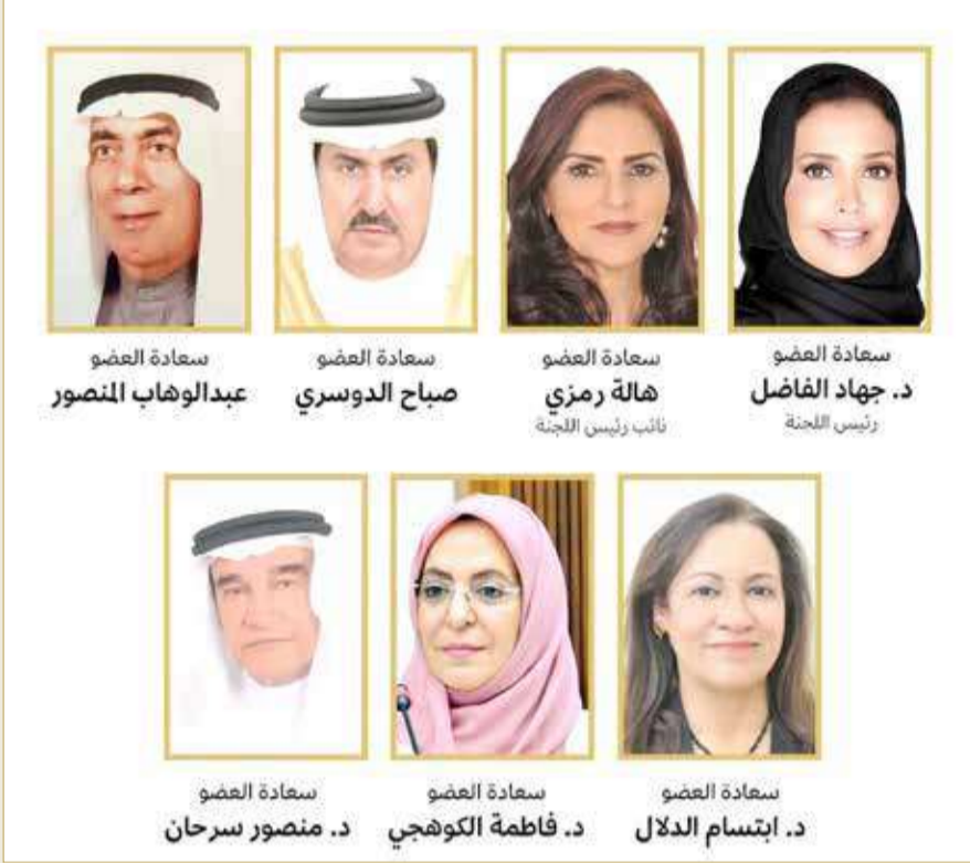
خدمات الشورى: مركز محمد بن خليفة للقلب تأكيد واضح لمستوى تطور الخدمات الطبية بمملكة البحرين

وأثنت اللجنة على الدعم الكبير والبارز من المشير الركن الشيخ خليفة بن أحمد آل خليفة القائد العام لقوة دفاع البحرين للمركز، إلى جانب المساعي الطبية لرئيس المجلس الأعلى للصحة الفريق الطبيب الشيخ محمد بن عبدالله آل خليفة رئيس مجلس أمناء مركز القلب لمساندته المستمرة لإنجاح إنجاز هذا المشروع الوطني والطبي الرائد.