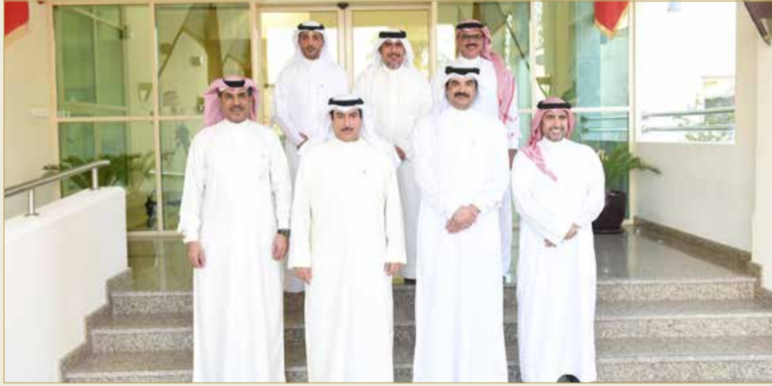
لجنة الخارجية والأمن الوطني