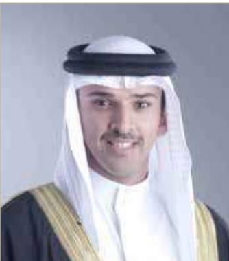
علي بن خليفة

وقال إن الإنجاز يتوج الجهود المخلصة والكبيرة لسمو الشيخ خالد بن حمد آل خليفة في رعاية هذه الرياضة عبر استقطاب البطولات الدولية وتعزيز مكانة مملكة البحرين كبيئة حاضنة لمختلف الاستضافات الرياضية.