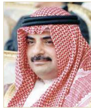
سمو الشيخ سلمان بن خليفة

والتقدم والأزدهار. وتلقى سمو ولي العهد نائب القائد الأعلى رئيس مجلس الوزراء