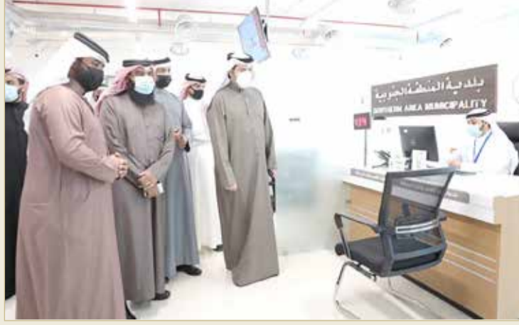
جانب من جولة التدشين

السن وذوو الهمم من الحصول على الخدمة وهم في سياراتهم، إضافة إلى توافر إنترنت مجاني. وفي خطوة تؤكد حرص بلدية المنطقة الجنوبية على صحة وسلامة العملاء والمتقدمين قامت بوضع جهاز متخصص عند استقبال المراجعين لتسهيل تسجيل بيانات المراجعين وفحص الحرارة والتأكد من لبس الكمامة قبل الدخول إلى مركز خدمة العملاء، وإدخال بيانات المراجع واسترداد المعلومات المخزنة بالذاكرة؛ لتقليص الوقت والجهد وتسريع إجراءات دخول المراجعين للمركز مع الاطمئنان على صحتهم وسلامتهم.