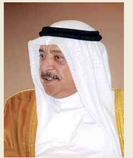
الشيخ خالد بن أحمد

بعث وزير الديوان الملكي الشيخ خالد بن أحمد آل خليفة، برقية تهنئة إلى القائد العام لقوة دفاع البحرين المشير الركن الشيخ خليفة بن أحمد آل خليفة؛ بمناسبة الذكرى الثالثة والخمسين لتأسيس قوة دفاع البحرين. وأكد وزير الديوان الملكي في برقيته أن "الذكرى