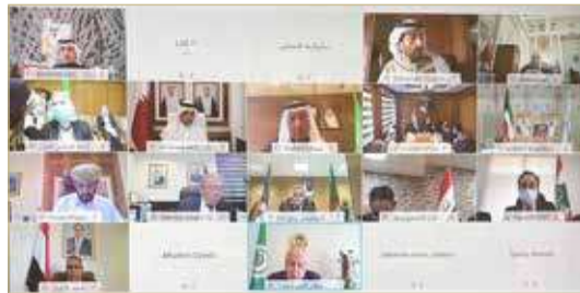
جانب من الاجتماع الافتراضي

الأمن الغذائي. وفي إطار الملف الاقتصادي والاجتماعي، بحث الاجتماع العديد من الموضوعات التي من أهمها: اتفاقية السوق العربية المشتركة للكهرباء، والخطة التنفيذية الاستراتيجية العربية لتربية الأحياء المائية، إضافة إلى اعتماد محاضر اللجان الفنية التابعة للمجلس كجنة التنفيذ والمتابعة واللجنة الدائمة لقواعد المنشأ العربية ولجنة الخبراء القانونيين المختصين بتطوير آلية تسوية المنازعات في إطار منطقة التجارة الحرة العربية الكبرى ولجنة تحرير التجارة في الخدمات، كما تابع المجلس مستجدات التعاون العربي الدولي مع كل من الصين والهند واليابان والبرازيل.