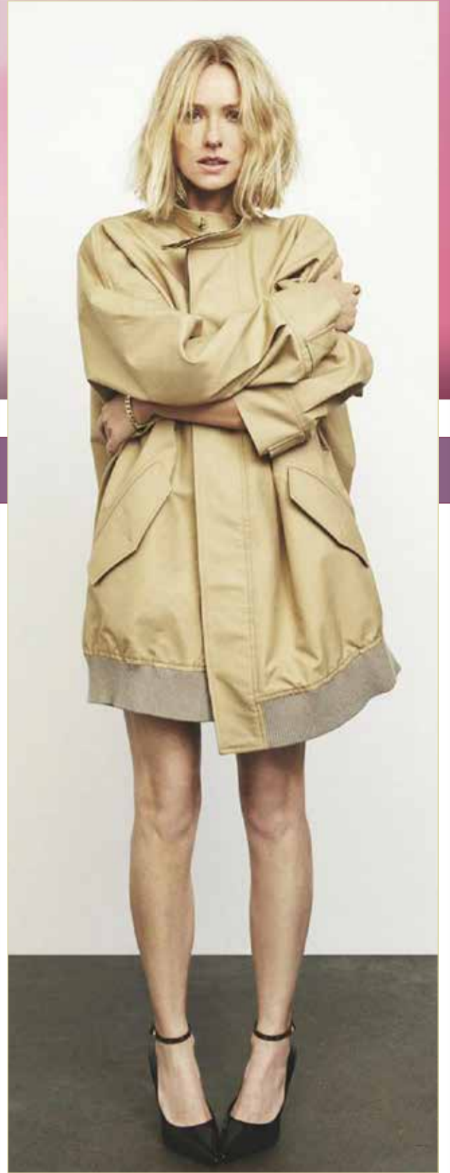
« ستجتمع الرائعة "ناومي واتس" مع المخرجة البولندية "مالجورزانا سزموسكا" لإخراج فيلم عنوانه Infinite Storm. الفيلم يحكي قصة امرأة تدعى "يام باليس"، وهي أم وممرضة ومرشدة جبلية كانت في رحلة بمفردها إلى جبل واشنطن، فتساعد رجلا غربيا أثناء هبوب عاصفة ليلية يقلب حياتها رأسا على عقب.