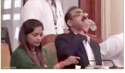
باوار اعتقد خطأ أن الزجاجة بها ماء

رصدت الكاميرات مسؤولا التقط علبة مطهر الديدان وشرب منها جرعة معتقدا بالخطأ أنها زجاجة ماء، وذلك أثناء اجتماع عام بمدينة مومباي الهندية. وكان نائب مفوض