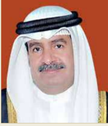
سمو الشيخ علي بن خليفة

سمو الشيخ علي بن خليفة: تحقيق أعلى المراتب الصحية دولياً