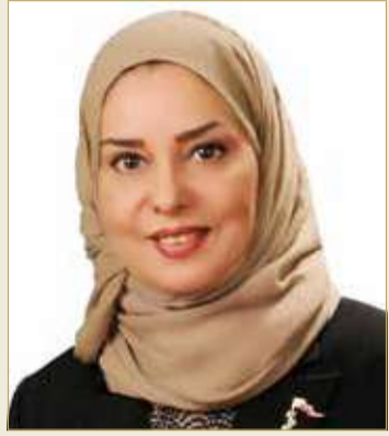
رئيس مجلس النواب