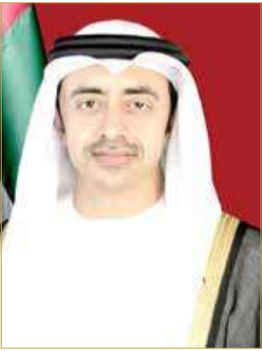
سمو الشيخ عبدالله بن زايد