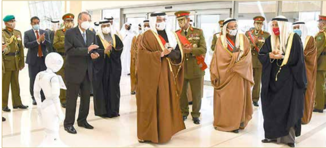
سمو ولي العهد رئيس الوزراء لدى افتتاحه مركز محمد بن خليفة بن سلمان آل خليفة التخصصي للقلب

◆ نيابة عن جلالة الملك... سمو ولي العهد رئيس الوزراء يفتتح مركز محمد بن خليفة بن سلمان آل خليفة التخصصي للقلب