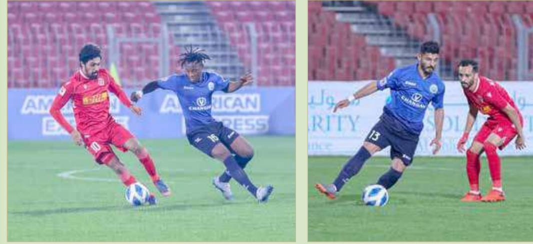
من لقاء البسيتين والمحرق

الفريقان تقاسما النقاط في افتتاح الجولة 9 لدوري ناصر بن حمد الممتاز