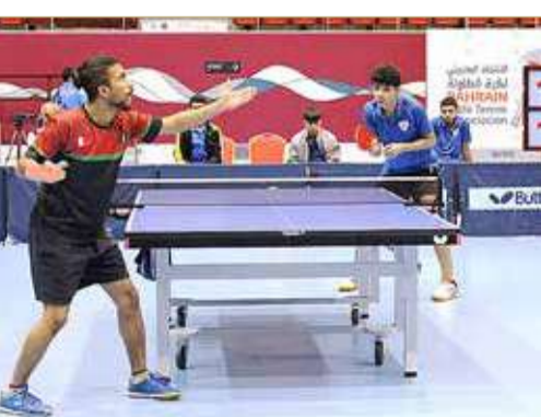
جانب من المنافسات

الجولة الثانية شهدت فوز سار وعالي على باربار وسماهيح