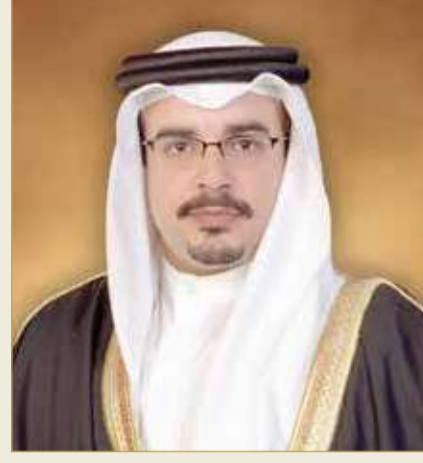
سمو ولي العهد رئيس الوزراء