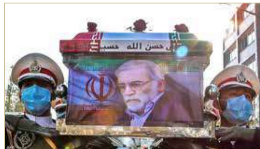
قتل العالم النووي الإيراني يوم 27 نوفمبر 2020

د"سردار"، وهو لقب الضباط الكبار في الحرس الثوري. وأشار نائب القائد العام للحرس الثوري، العميد علي فدوي، إلى أن الاغتيال تم بواسطة رشاش باستخدام الذكاء الاصطناعي تم التحكم به عبر الأقمار الصناعية والإنترنت ولم يكن هناك عناصر في مكان الحادث. وأشار علوي في حديثه، إلى أن وزارة الاستخبارات طلبت من القوات المسلحة "تكليف شخص لتتعاون في هذه المسألة، لكن الحادث (الاغتيال) للأسف حصل قبل أن تقوم بتعيين مندوب".