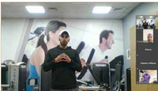
جانب من الفعاليات