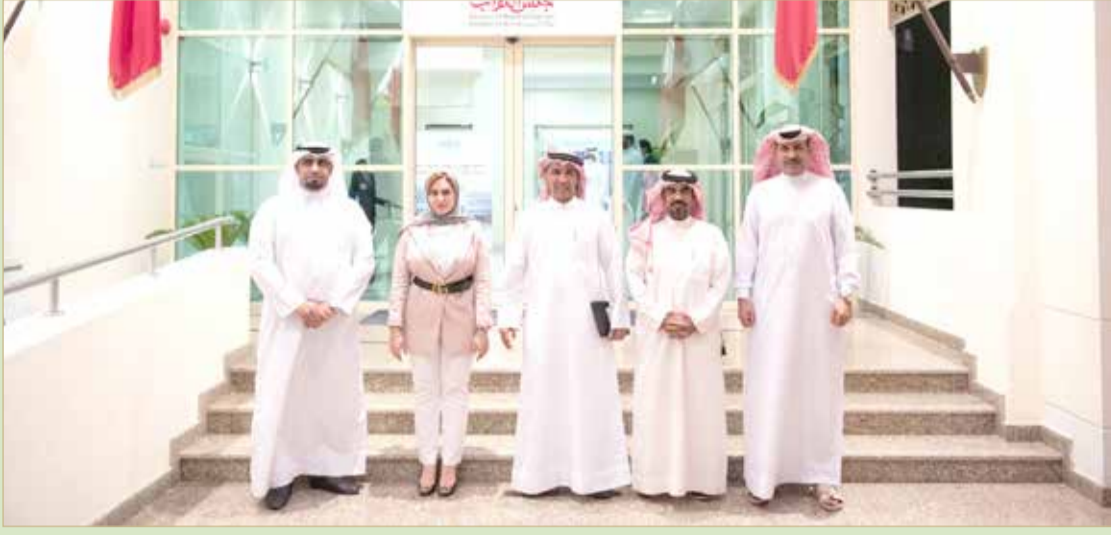
اللجنة النوعية الدائمة للشباب والرياضة