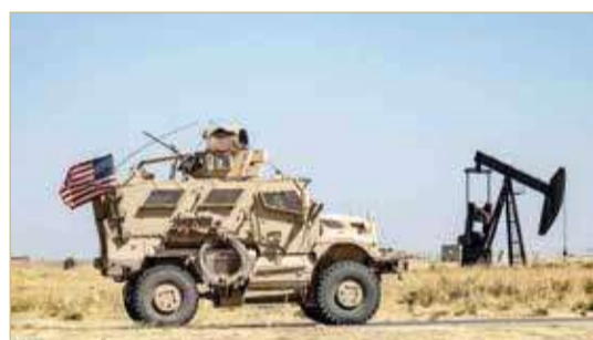
قوات أميركية في سوريا

ليسوا مخولين مد يد المساعدة إلى شركة خاصة تسعى لاستغلال موارد نفطية في سوريا ولا إلى موظفي هذه الشركة أو إلى وكلائها. ولا تزال الغالبية العظمى من حقول النفط في شرق سوريا وشمالها الشرقي خارج سيطرة النظام. وتقع هذه الحقول في مناطق تسيطر عليها بشكل أساسي "قوات سوريا الديمقراطية"، القوى العسكرية المرتبطة بإدارة الذاتية الكردية التي تشكل العائدات النفطية المصدر الرئيس لمداخيلها.