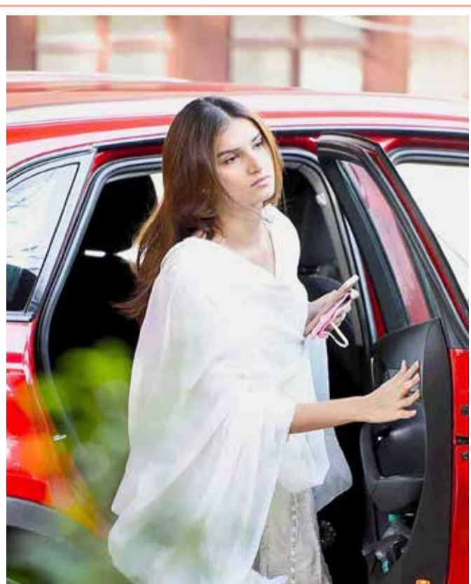
ممثلة بوليوود تارا سوتاريا تصل لحضور جنازة الممثل الراحل راجيف كابور في مومباي

أعلنت مديرية شرطة محافظة ميسان، جنوبي العراق، أمس الثلاثاء، عن "جريمة" قيام أب بشنق أطفاله الثلاثة بسبب خلافات عائلية مع زوجته. وذكرت المديرية في بيان صحفي أن "الشرطة تمكنت من اعتقال رب أسرة قتل 3 من أطفاله شنقا، بعد هروبه من منزله إثر عملية مطاردة استمرت لأكثر من ساعة، واعترف بجريمتته وتعاطيه للمخدرات". وأضاف بيان المديرية أن "الجاني تحدث عن خنق أولاده الثلاثة القاصرين شنقا حتى الموت وأعمارهم بين 5 و9 سنوات". وأمس الأول، توفيت امرأة في محافظة ذي قار، جنوبي العراق، متأثرة بإصابة تعرضت لها إثر قيام زوجها برميها من مركبة أثناء سيرها بسرعة كبيرة.