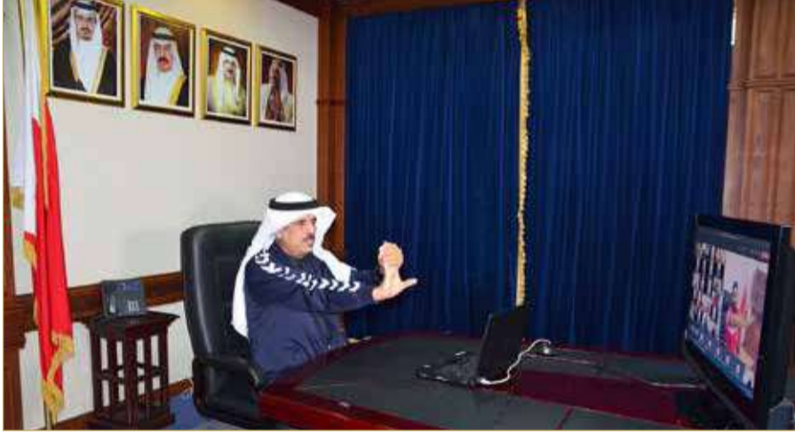
وزير التربية والتعليم يشارك في فقرة التربية الرياضية

بفقرة تفاعلية، ومسابقات رقمية في الثقافة الرياضية، بمشاركة العديد من المسؤولين والموظفين من القطاعات والإدارات، هذا إلى جانب توجيه المدارس لتنظيم احتفالات افتراضية داخلية لمتسببيها.