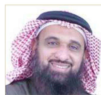
الشيخ صلاح حسين