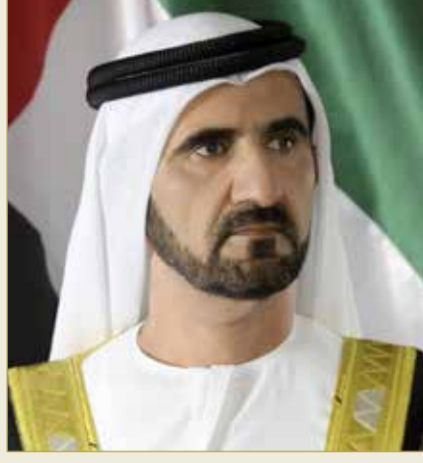
سمو الشيخ محمد بن راشد