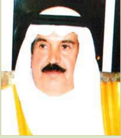
دعيج بن سلمان

عبر البرامج التفاعلية سواءً في قناة البحرين أو وسائل التواصل الاجتماعي، مؤكداً أن توجيهات سموه ساهمت في تحقيق النجاح الكبير لهذا الحدث الوطني. في المقابل، أكد الشيخ دعيج بن سلمان آل خليفة أن الفعاليات التي بثت عبر قناة البحرين ووسائل التواصل الاجتماعي لاقت إقبالاً وتفاعلاً كبيراً من مختلف شرائح المجتمع