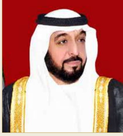
سمو الشيخ خليفة بن زايد