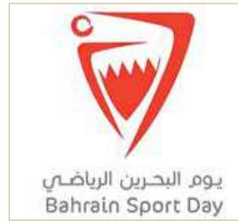
يوم البحرين الرياضي Bahrain Sport Day

ومسابقة تحدي الجري التي فاز بها الموظف عثمان بوقيس، وتحدي سباق الدراجات الذي فاز به الموظف سلمان ياسين. هذا ورفع منسوب وزارة الخارجية بالديوان العام لوزارة الخارجية وبعثات مملكة البحرين في الخارج أصداق التهاني لممثل جلالة الملك للأعمال الإنسانية وشؤون الشباب رئيس المجلس الأعلى للشباب والرياضة سمو الشيخ خالد بن حمد آل خليفة، والنائب الأول لرئيس المجلس الأعلى للشباب والرياضة رئيس اللجنة الأولمبية البحرينية سمو الشيخ خالد بن حمد آل خليفة، بالنجاح الكبير الذي حققه اليوم الرياضي الوطني في ظل هذه الظروف الاستثنائية. يشار إلى أن سفارات وقنصليات مملكة البحرين في الخارج شاركت في اليوم الرياضي الوطني، إذ تم تخصيص وقت لممارسة مختلف الرياضات.