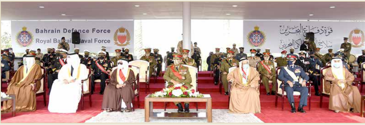
القائد العام لقوة الدفاع بدشن سفينة الزبارة وعددا من السفن بسلاح البحرية الملكي البحريني