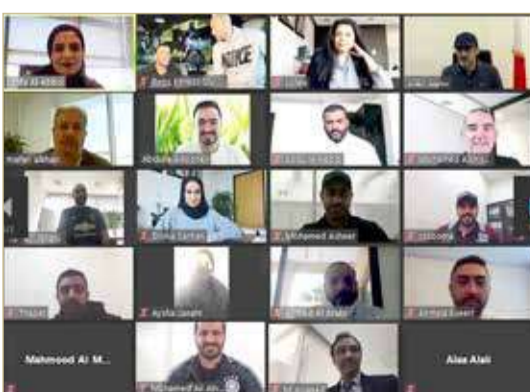
جانب من فعاليات الهيئة