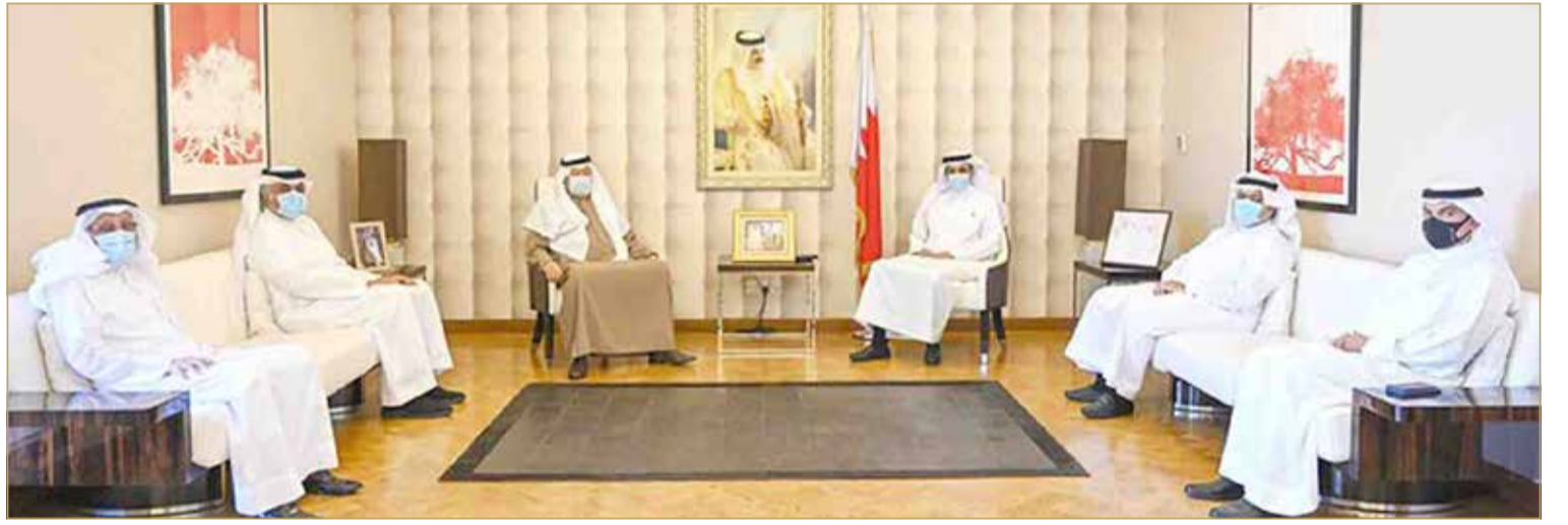
وزير الإعلام مستقبلاً رئيس مجلس إدارة "البلاد" والإدارة التنفيذية للصحيفة

الصحافة والإعلام، والدور المشهود لصحافتنا الوطنية في المحافظة على الثوابت الوطنية والدفاع عن قضايا الوطن.