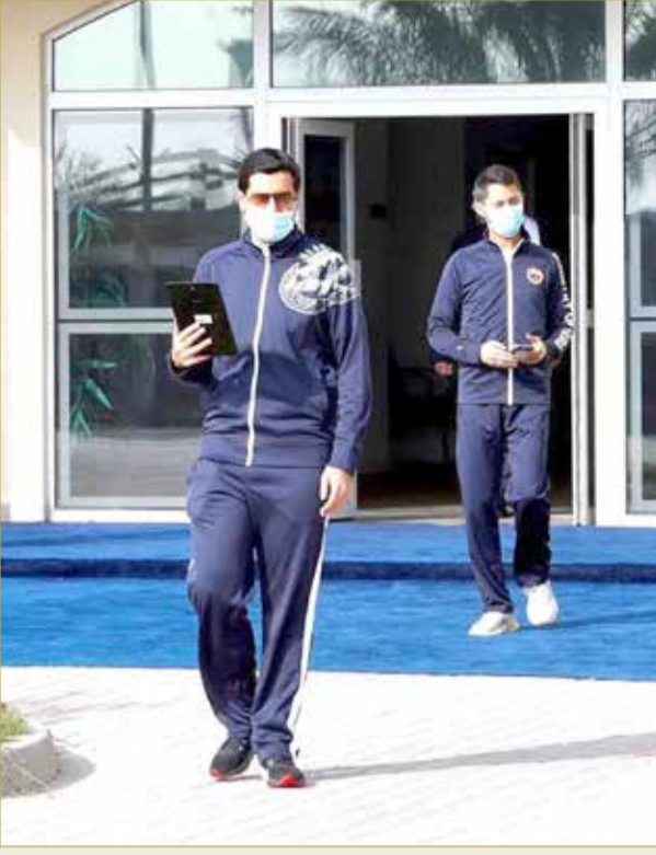
اسمو الشيخ خليفة بن علي خلال اليوم الرياضي