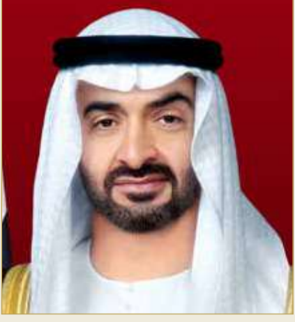
سمو الشيخ محمد بن زايد

جلالة الملك: مصدر فخر للإمارات والعرب ويسهم بخدمة الإنسانية