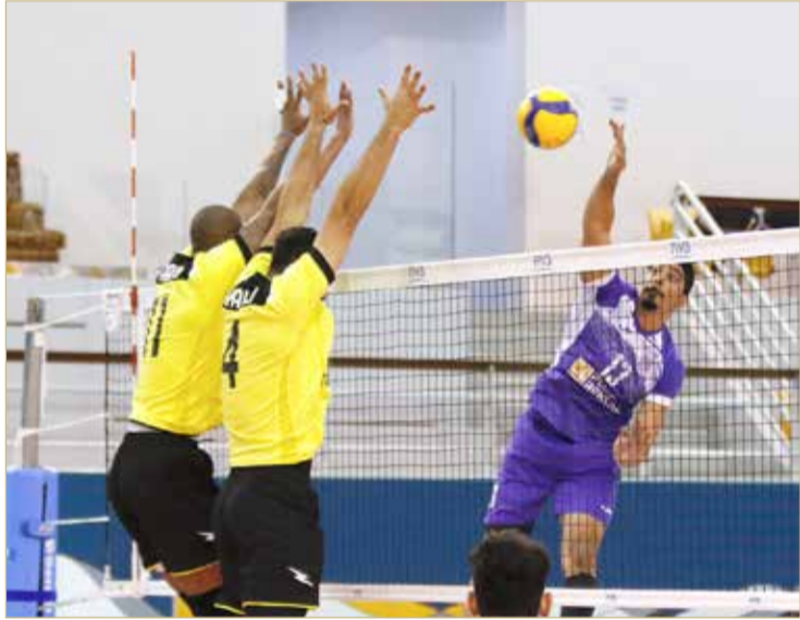
من لقاء داركليب والأهلي بنصف النهائي الأول

الأهلي صاحب المركز الثاني بالدور التمهيدي، حقق انتصارا كاسحا على داركليب للمرة الثالثة هذا الموسم وبالنتيجة نفسها (0/3) في اللقاء الأخير، وهو ما يعكس الهيمنة الأهلاوية أو العقدة التي يطمح داركليب لتجاوزها؛ حتى لا يخرج خالي الوفاض هذا الموسم. الأهلي بقيادة المدرب التونسي نزار بن قارة تفوق على منافسه بقوة الإرسالات وتنظيم حوائط الصد