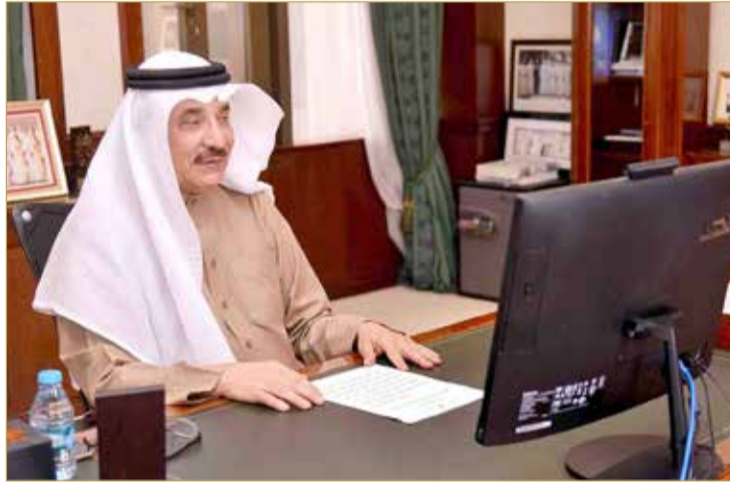
جانب من فعاليات اليوم الوطني الرياضي بوزارة العمل والتنمية الاجتماعية