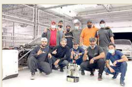
صورة جماعية للفريق

كسب اللقب بجدارة في فئة “6 سلندر أوت لو”