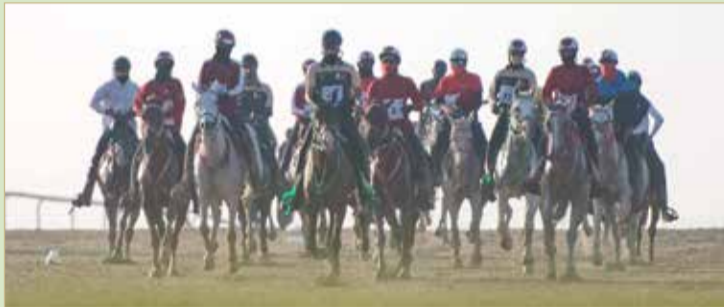
من سباقات القدرة

خليفة أن السباقات التي سينظمها الاتحاد في مهرجان جلالة الملك ستكون ذات طابع تنافسي مثير عطفاً على المستويات البارزة والتنافس