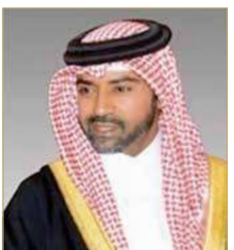
سمو الشيخ فيصل بن راشد

♦ حجر أساس في بناء مؤسسات الدولة الحديثة