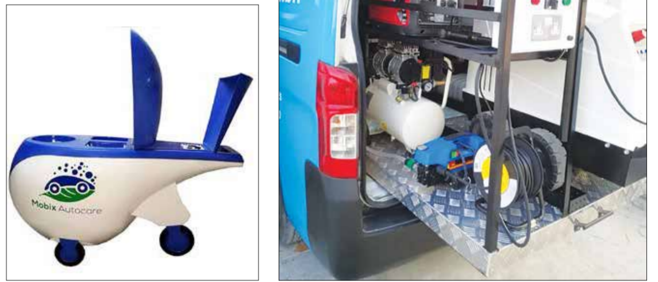
معرض سيارات موبيكس في البحرين، حيث يمكن للعملاء غسل سياراتهم في مكانهم.