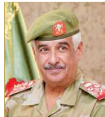
سمو الشيخ محمد بن عيسى

الفريق أول ركن سمو الشيخ محمد بن عيسى بن سلمان آل خليفة؛ بمناسبة الذكرى العشرين لإقرار ميثاق العمل الوطني. وأعرب سمو رئيس الحرس الوطني في برقيته، باسمه وباسم جميع منتسبي الحرس الوطني، عن أسمى آيات التهاني وأطيب التبريكات لصاحب السمو الملكي ولي العهد نائب القائد الأعلى رئيس مجلس الوزراء بمناسبة الذكرى العشرين لإقرار ميثاق العمل الوطني، الذي حظي بإجماع أبناء المملكة؛ ليكون نبراشاً لمسيرة التقدم والازدهار لمملكة البحرين، سائلاً المولى العلي القدير أن يُعيد هذه المناسبة على سموه بالصحة والعافية، وعلى مملكة البحرين وشعبها المخلص بمزيد من التقدم والرفعة والنماء تحت ظل القيادة الحكيمة لصاحب الجلالة الملك القائد الأعلى.