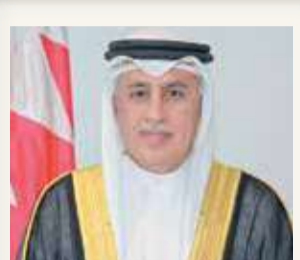
وزير “الصناعة”: اقتصدنا يسير بخطى ثابتة أمام التحديات