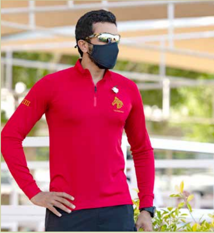
سمو الشيخ ناصر بن حمد