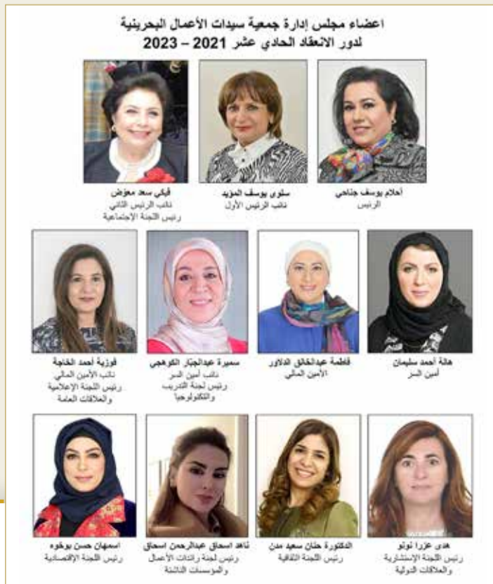
أعضاء مجلس إدارة جمعية سيدات الأعمال البحرينية لدور الاعداد الحادي عشر 2021 - 2023