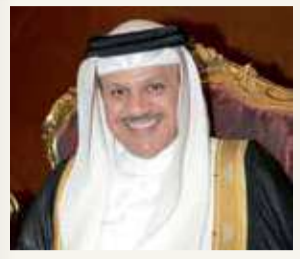
وزير الخارجية: رسخ القوانين والتشريعات والحقوق