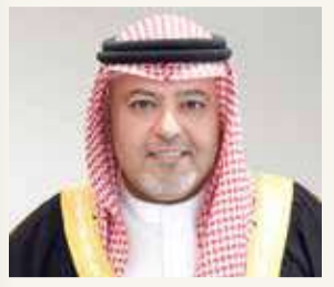
وزير “العدل”: رسّخ دولة المؤسسات والقانون