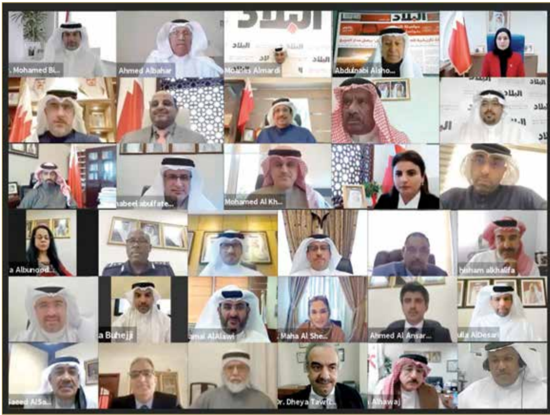
المشاركون في منتدى "البلاد" عبر "زووم"

الميثاق يحكي قصة نجاح بحرينية ومشروع قائد حكيم وشعب طموح