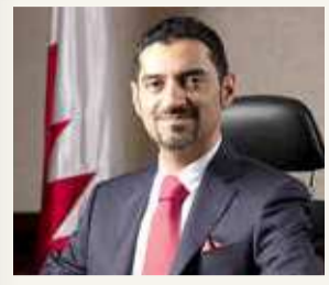
وزير “الكهرباء”: محطة للفخر والاعتزاز بالإنجازات الوطنية