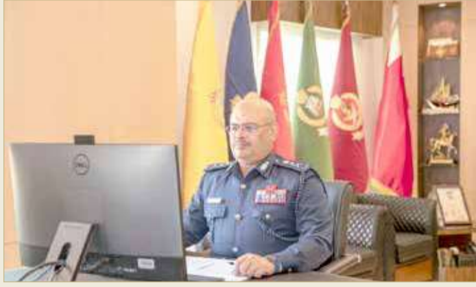
المنامة - وزارة الداخلية

◆ انخفاض معدلات الجريمة و97% نجاح خطة مكافحة المخدرات