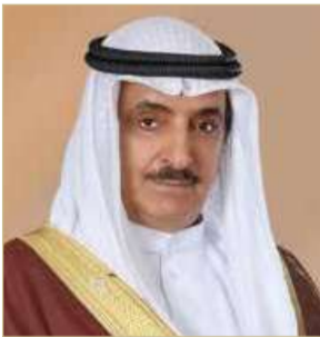
الشيخ سلمان بن عبدالله

واجتمع عليه شعب البحرين بنسبة 98.4%. وأكد الشيخ سلمان أن ذكرى التصويت على ميثاق العمل الوطني ستبقى خالدة في تاريخ البحرين وذاكرة شعبها لما أوجده من عناوين عريضة وشاملة، سياسية واقتصادية وقانونية وحقوقية واجتماعية، وتأسيس قاعدة متينة وصلبة للجيل الذي عاشه والأجيال القادمة نحو الانطلاق للمستقبل بخطى ثابتة ووثيقة، لشير هنا بخصوص ما أسس له المشروع من رؤية تنموية للقطاعات الاقتصادية المختلفة، والتي رمت في نهاية المطاف وبالدرجة الأولى إلى علو وتنمية الإنسان البحريني ورفع