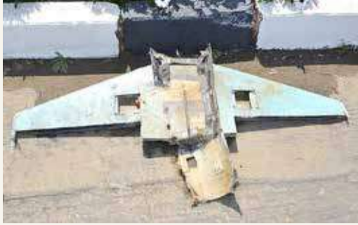
"المسيرة المفخخة" تستهدف مطار أبها الدولي