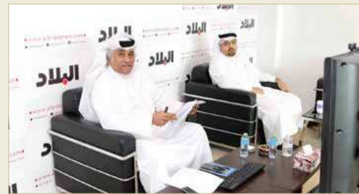
رئيس التحرير والرئيس راشد الغائب خلال المنتدى

وختم المردي: حرصت "البلاد" في ترتيب هذا المنتدى على حضور شخصيات من مختلف القطاعات وبينهم أعضاء اللجنة الوطنية لوضع الميثاق؛ وذلك كي يقدم الجميع إضاءة من نور عن المكتسبات والمنجزات، والتي يستمر فريق البحرين بقيادة ولي العهد رئيس مجلس الوزراء صاحب السمو الملكي الأمير سلمان بن حمد آل خليفة بالبناء عليها وتعزيزها لآفاق أكبر".