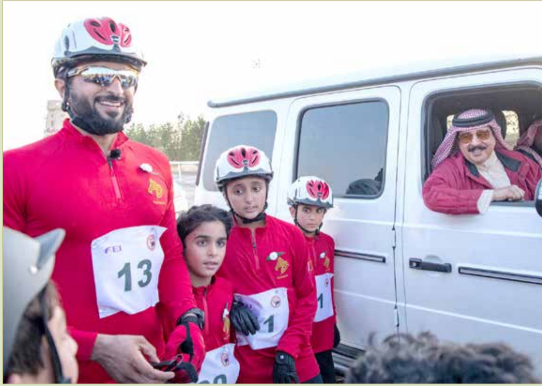
جلالة الملك خلال حضور إحدى سباقات القدرة

أكد ممثل جلالة الملك للأعمال الإنسانية وشؤون الشباب الرئيس الفخري للاتحاد الملكي للفروسية وسباقات القدرة سمو الشيخ ناصر بن حمد آل خليفة أن الرعاية والمتابعة التي تحظى بها رياضات الفروسية من عاهل البلاد صاحب الجلالة الملك حمد بن عيسى آل خليفة وضعت مملكة البحرين على خارطة الدول العالمية في تنظيم مختلف بطولات الفروسية وساهمت في تحقيق العديد من الإنجازات.