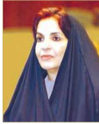
سمو الأميرة سبيكة بنت إبراهيم

تلقى عاهل البلاد صاحب الجلالة الملك حمد بن عيسى آل خليفة، برقية تهنئة من قرينة جلالة الملك رئيسة المجلس الأعلى للمرأة صاحبة السمو الملكي الأميرة سبيكة بنت إبراهيم آل خليفة توجهت سموها فيها لمقام جلالته السامي بخالص التهاني والتبريكات بمناسبة الذكرى العشرين للإجماع العام على ميثاق العمل الوطني. وجددت سمو الأميرة سبيكة بنت إبراهيم في البرقية الالتزام ومواصلة