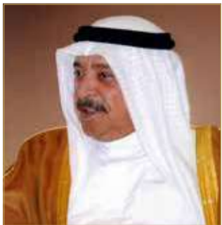
الشيخ خالد بن أحمد