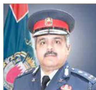
الشيخ حمد بن محمد

أكد مساعد رئيس الأمن العام لشؤون العمليات والتدريب العميد الركن الشيخ حمد بن محمد آل خليفة استمرار متابعة الإدارات المعنية بوزارة الداخلية للالتزام بالإجراءات الاحترازية والتدابير الوقائية الهادفة إلى الحد من انتشار فيروس كورونا، ورصد المخالفات واتخاذ الإجراءات القانونية حيال مرتكبيها، مشيرًا إلى أن ارتفاع عدد الإصابات خلال الأيام الماضية جاء بسبب تهاون البعض في اتباع الإرشادات والالتزام بالتعليمات الصادرة عن الفريق الوطني الطبي للتصدي لفيروس كورونا.