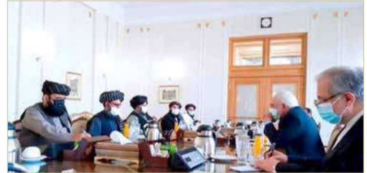
ظريف مستقبلا قادة "طالبان"

مع "طالبان"، مضيفا أن إيران تتطلع إلى زيادة نفوذها في المفاوضات مع الإدارة الأميركية الجديدة. وتابع "4 سنوات من إدارة الرئيس دونالد ترامب وضعتهم حقاً تحت ضغط كبير، إنهم يأتون إلى طاولة المفاوضات مع إدارة بايدن من موقف ضعف نسبي، وهذا يعني أنهم بحاجة إلى كسب النفوذ".