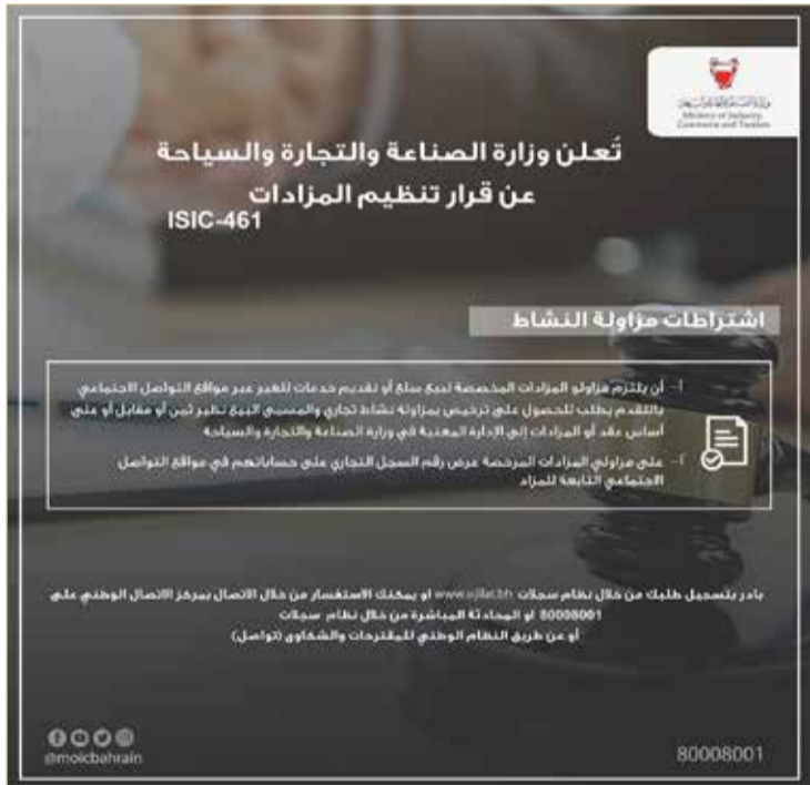
المنامة - وزارة الصناعة والتجارة والسياحة

◆ "التجارة" تدعو المعنيين للمبادرة بتصحيح الأوضاع