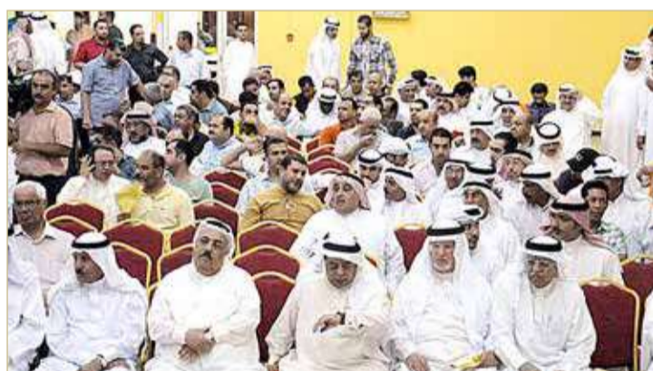
الجمعية العمومية للنادي الأهلي (أرشيفية)

وتأهيل المدربين من أبناء النادي وتنظيم الدورات الرمضانية وإحياء النشاط الصيفي بالنادي.