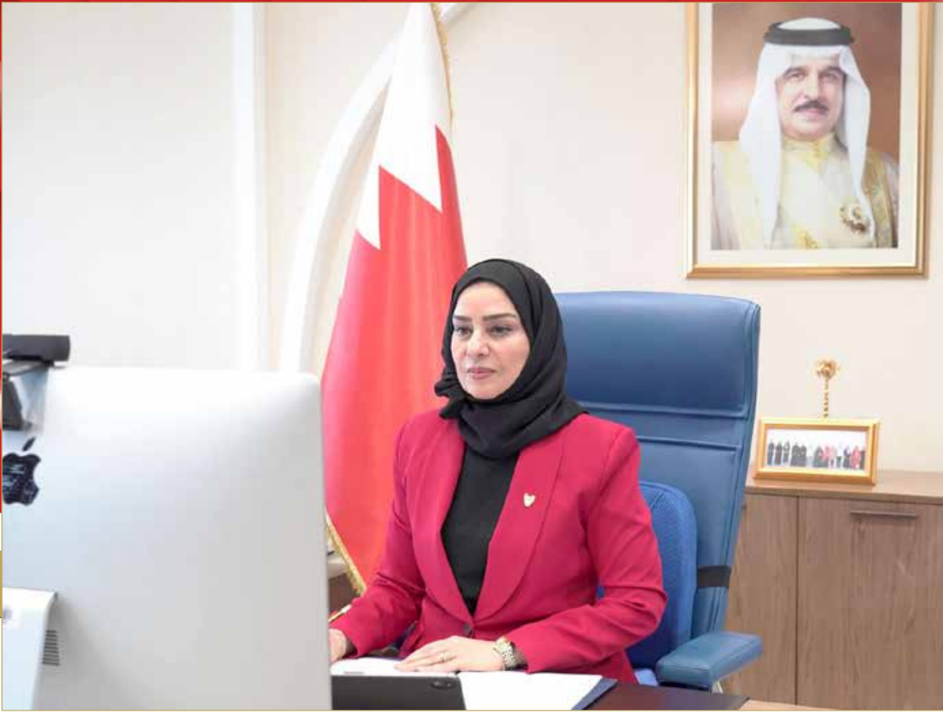
رئيسة مجلس النواب تلقي الكلمة الرئيسية بمنتدى "البلاد"