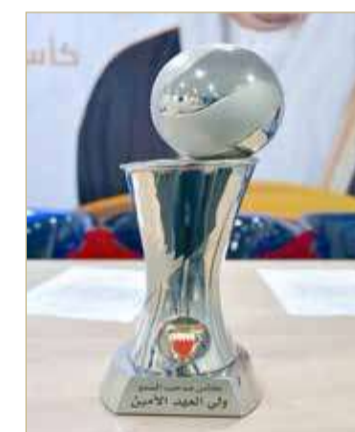
كأس سمو ولي العهد

المغامير والشباب يواجهان اتحاد الريف والدير