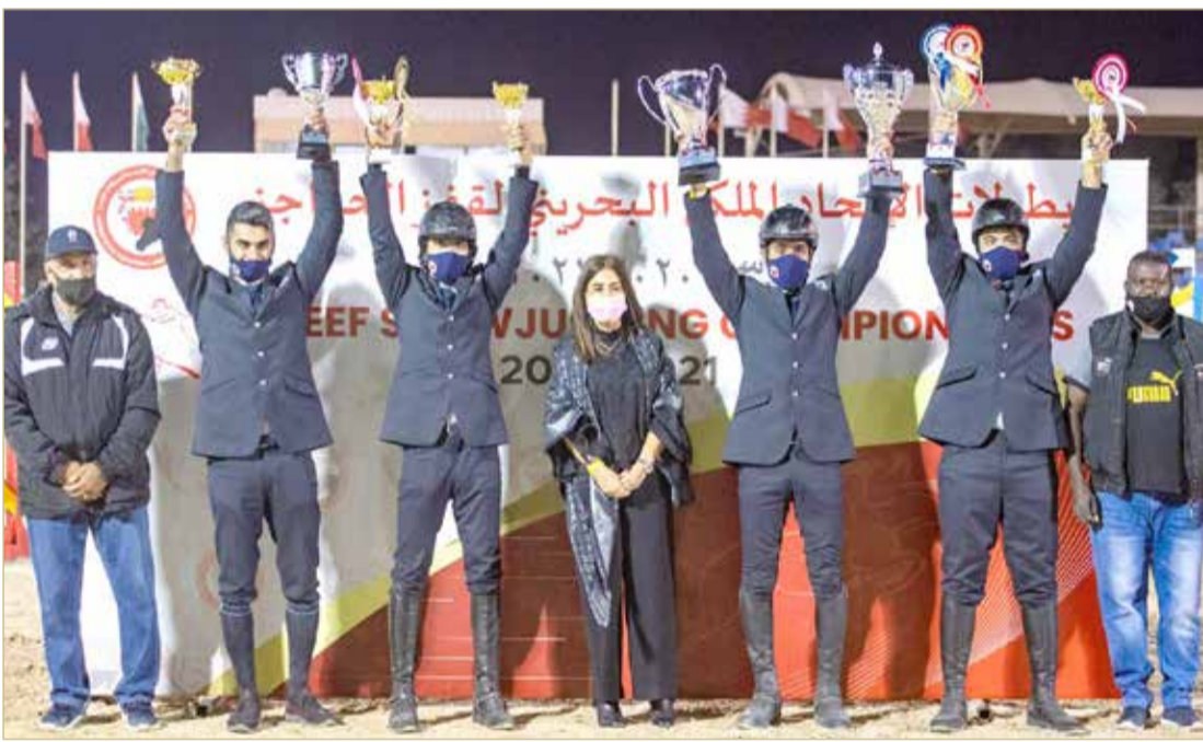
جناحي تتوسط فرسان فريق وزارة الداخلية

◆ توج بالمسابقة الكبرى ضمن سبع بطولات موسم قفز الحواجز