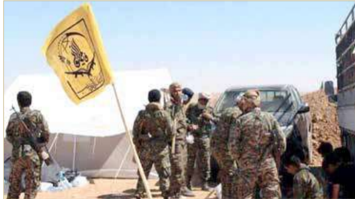
الميليشيات الموالية لطرهان تخشى الاستهداف

وكان المرصد السوري ذكر قبل يومين أن طيرانا مسيرا مجهول الهوية عمد، صباح الخميس، إلى استهداف سيارة تحمل شحنة أسلحة قادمة من العراق، وذلك بالقرب من معبر عسكري غير شرعي بين العراق وسوريا، تستخدمه الميليشيات للتنقل بين البلدين وإدخال