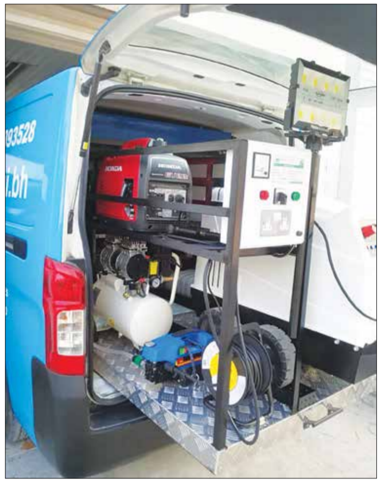
معرض سيارات موبيكس في البحرين، حيث يمكن للعملاء غسل سياراتهم في مكانهم.