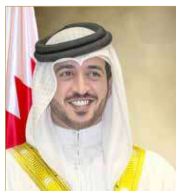
سمو الشيخ خالد بن حمد

في سماء البحرين تتجلى فيها صور الوطنية والولاء. وقال سموه "إنها مناسبة عزيزة على الجميع نستذكر فيها التفاتة الشعب حول القيادة، من خلال ما سجله إقرار ميثاق العمل الوطني من نسبة وصلت إلى 98.4%، والتي أكدت حقيقية ما تضمنه المشروع الإصلاحية لسيد الوالد صاحب الجلالة عاهل البلاد، من أهداف تنموية شاملة استطاعت أن تحقق قفزات نوعية في مختلف القطاعات لاسيما قطاع