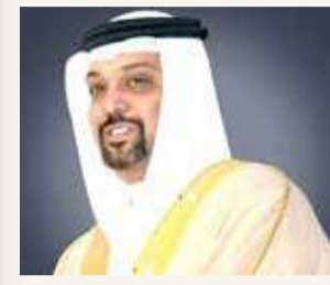
وزير “المالية”: مرحلة جديدة من الازدهار

رفع وزير المالية والإقتصاد الوطنى الشيخ سلمان بن خليفة آل خليفة أسمى