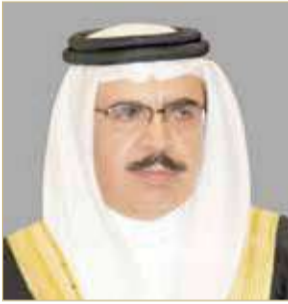
الشيخ راشد بن عبدالله

جلالته الإصلاحي الكبير، إذ ترسخت بفضل جلالته قواعد البناء وتجذرت روابط شعب مملكة البحرين الوفي والتفافه حول قيادته لتبقى البحرين قوية ينشد أبنائها التقدم والنهضة، داعياً الله عز وجل أن يحفظ جلالته وأن يسدد على طريق الفلاح خطاه. وتلقى ولي العهد نائب القائد الأعلى رئيس مجلس الوزراء صاحب السمو الملكي الأمير سلمان بن حمد آل خليفة برفقة تهنية من وزير الداخلية؛ بمناسبة الذكرى العشرين لإقرار ميثاق العمل الوطني. ورفع وزير الداخلية إلى صاحب السمو