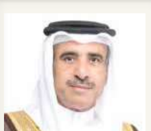
وزير الإسكان: كفل حق المواطن بالخدمة الإسكانية