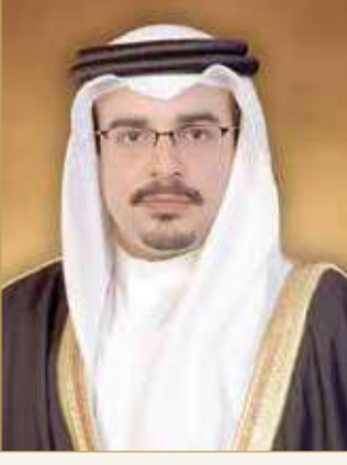
سمو ولي العهد رئيس الوزراء

♦ جلاله الملك وسمو ولي العهد رئيس الوزراء يتبادلان التهاني