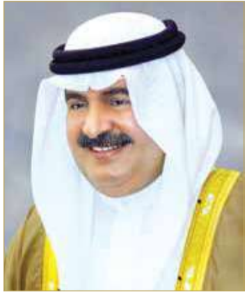
سمو الشيخ علي بن خليفة

على المضي قدمًا في مواصلة العمل تحت قيادة جلالته الحكيم، سائلًا الله القدير أن يديم على جلالته موفور الصحة والعافية وطول العمر. وتلقى ولي العهد رئيس مجلس الوزراء صاحب سمو الملكي الأمير سلمان بن حمد آل خليفة، برفقة تهنئة من سمو الشيخ علي بن خليفة آل خليفة؛ بمناسبة الذكرى العشرين لإقرار ميثاق العمل