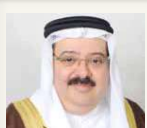
الرئيس التنفيذى لـ “الكهرباء”: مصدر فخر واعتزاز

آيات التهاني والتبريكات إلى عاهل البلاد صاحب الجلالة الملك حمد بن عيسى آل خليفة وإلى ولي العهد رئيس مجلس الوزراء صاحب السمو الملكي الأمير سلمان بن حمد آل خليفة، كما هنا جميع أبناء البحرين؛ بمناسبة حلول الذكرى العشرين لإقرار ميثاق العمل الوطني. وبهذه المناسبة الغالية، أكد أن ميثاق العمل الوطني شكل محطة تاريخية مضيئة في تاريخ مملكة البحرين المعاصر وانطلاقة للمسيرة التنموية الشاملة بقيادة عاهل البلاد، مبيّن أن ميثاق العمل الوطني أسهم في تحقيق مزيد من التقدم والازدهار لمملكة البحرين في مختلف المجالات وعزز مكانتها كدولة المؤسسات والقانون، مشيرًا إلى ما تضمنه ميثاق العمل الوطني من أسس ومبادئ أسهمت في تحقيق نهضة تنموية شاملة وتحقيق مزيد من الإنجازات والمكتسبات ومستقبل أكثر إشراقًا وازخار بالمنجزات لأبناء هذا الوطن الغالي في جميع الأصعدة.