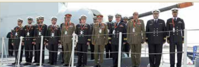
أبوبطي - بنا

حضر رئيس هيئة الأركان الفريق الركن ذياب النعيمي، أمس الإثنين، فعاليات الدورة 15 من معرضي (أيدكس و نافدكس 2021)، اللذين يُعقدان في العاصمة أبوظبي في الفترة من 21 إلى 25 فبراير الحالي. وقام رئيس هيئة الأركان بجولة، اطلع خلالها على عدد من الأجنحة المشاركة في المعرضين وما تحتويه الأقسام المختلفة من أحدث نظم الدفاع العالمية والتقنيات العسكرية الدقيقة والمتقدمة، وأحدث ما توصل إليه قطاع الصناعات الدفاعية من تكنولوجيا ومعدات متطورة تسهم في تعزيز الأمن الإقليمي والدولي وخدمة السلام العالمي. وخلال الزيارة اجتمع رئيس هيئة