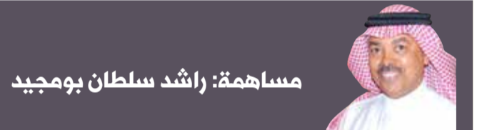
مساهمة: راشد سلطان بومجيد

البلاد | بدور المالكي تروي المواطنة "أ.ي." تفاصيل مأساتها التي تعيشها منذ أكثر من عام، ومازالت متواصلة، بعد أن فقدت الأمل في حلها، وبدلاً من إيجاد الحل وجدت الألم النفسي والمرض يتسلل إليها؛ بسبب الضيق والتعب والفشل في مئات المحاولات التي حاولتها عليها تجد أحداً يصفها ويضع الحل الصحيح، ليس من أجلها بل من أجل أسرتها وعائلتها التي تجرعت الخيبة وفقدان الأمل في كل محاولة تحاولها، عليها ترى بصيصاً من الأمل فيها يقودها للحل. وتقول المواطنة: أناشد وزير التربية ماجد النعيمي، الذي تعودنا دوماً بأن يتابع مشاكل كل العاملين في الوزارة، ولا يتواني عن التواصل معهم وإيجاد الحلول المناسبة لها. وتروي المواطنة قائلة: أكتب لكم وعبر جريدتكم "البلاد" قصتي المليئة بالمعاناة والظلم مع قسم التعليم الثانوي بالوزارة، حيث إنني موظفة إدارية بإحدى المدارس الثانوية للبنات، وتقدمت بطلب نقلي لمدرسة ابتدائية؛ نظراً لظروفي الأسرية والعائلية التي أمر بها والتي تستوجب