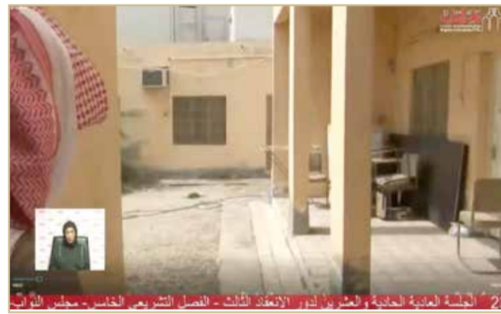
مبنى شباب الرلاق كما عرضه الدوسري بجلسته النواب

الدوسري: اهتموا بالبنية التحتية للمنشآت الرياضية