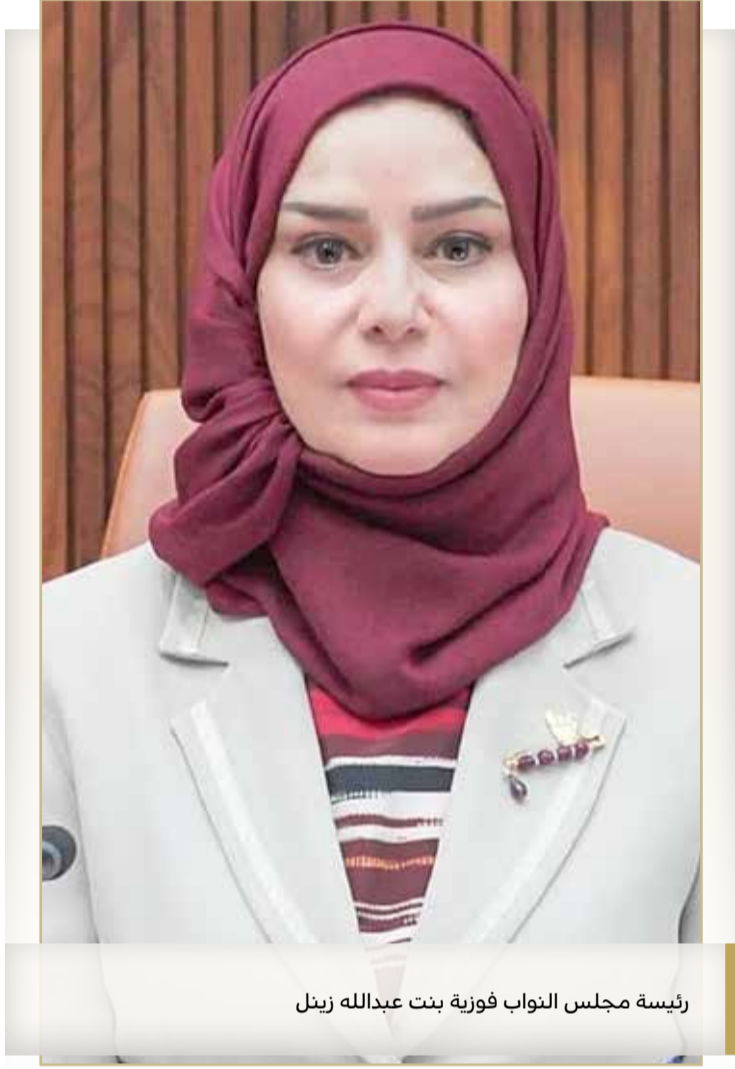
رئيسة مجلس النواب فوزية بنت عبدالله زينل

وأضاف أن تراجع أسعار النفط أثر على ميزانية الوزارة المخصصة للمشاريع، حيث بلغت ميزانيتها 20 مليون دينار في 2011، إلا أنها انخفضت لتصل إلى مليوني دينار فقط، وهو ما يجد