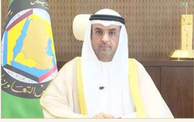
الأمين العام لمجلس التعاون الخليجي نايف الحجرف

إلى ذلك، دعا إيران إلى التخلي عن سلوكها بالتدخل في الشؤون الداخلية للدول والتوقف عن زعزعة الأمن والاستقرار من خلال دعم الجماعات الإرهابية.