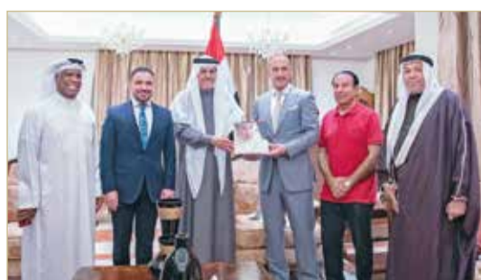
درجال يتسلم كتاب خاطرات وذكريات

تقديم كتاب «خاطر وذكريات للمرحوم عيسى بن راشد»