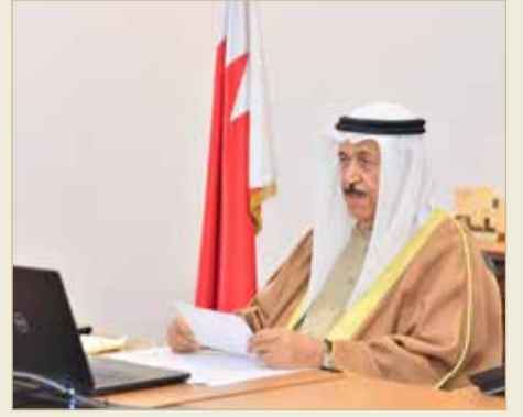
اجتماع المجلس 11 رجب 1442