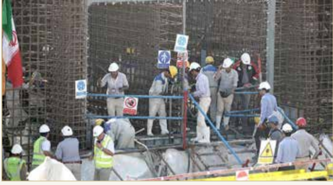
عمال عند موقع مفاعل بوشهر النووي في إيران

على الرغم من تهديد المرشد الإيراني علي خامنئي لأول مرة بامتلاك سلاح نووي، إلا أن صحيفة "كيهان" الموالية عبرت عن تأييدها للاتفاق الذي أبرمته الحكومة مع الوكالة الدولية للطاقة الذرية يوم الأحد حول تمديد التفتيش الإلزامي لمدة 3 أشهر، رغم إيقاف البروتوكول الطوعي لعمليات المراقبة. وكتب رئيس التحرير ومدوب خامنئي حسين شريعتمداري، في افتتاحية الصحيفة الموالية للمرشد أمس الثلاثاء، أن "معارضة نواب البرلمان للاتفاق لم تكن ضرورية لأن إيران أوقفت تنفيذ البروتوكول الإضافي، وهذا إنجاز كبير على مدى عقدين من صراعنا حول البرنامج النووي". إلى ذلك، اعتبر ممثل خامنئي في كيهان أنه إذا قامت الولايات المتحدة وأوروبا برفع جميع العقوبات، بعد