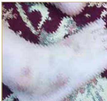
يعاني من الألم ونزف الدم

متقاعدًا وأعيد أسرة من 8 أفراد وظروفي المادية صعبة للغاية وراتبي لا يسد متطلبات الحياة، وإذ إن طفلي يحتاج للعلاج في الخارج، حيث إنني أرسلت كل التقارير، وأبلغوني في الرد بتوفر العلاج في إحدى المستشفيات ولكن كلفته باهظة، وكلي أمل في أن يصل صوتي إلى المسؤولين وإلى أهل الخير لمساعدتي في علاج طفلي.