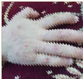
تسبب له الحساسية حكة شديدة

علاجه في مجمع السلمانية الطبي يقسم الأمراض الجلدية، لكن ليس هناك أي تقدم في علاجه. ويتابع المواطن: وكوني مواطناً