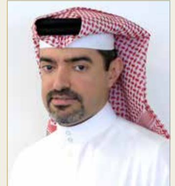
الشيخ عبدالله بن خالد