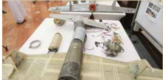
طائرة مسيرة إيرانية

تبدو سياسة الإدارة الأميركية تجاه اليمن مقتصرة على محورين أساسيين، الأول إيصال المساعدات إلى من يحتاجها من اليمنيين والثانية مكافحة الإرهاب، وتقتصد الولايات المتحدة هنا محاربة تنظيم القاعدة. لكن محاولات ميليشيات الحوثي المتكررة من أجل استهداف الأراضي السعودية، فضلاً عن هجماتهم على محافظة مأرب، تطرح أسئلة ملحة حول الموقف الأميركي من تلك الهجمات الحوثية. ورداً على سؤال حول ما "إذا كان الحوثيون يحصلون أو يطوّرون قدرات تكنولوجية لتحاشي الأنظمة المضادة للصواريخ والمسيرات المليئة بالمتفجرات، أكدت المتحدثة باسم البنتاغون، الكوماندور جيسيكا مانولتي "أن الحوثيين طوّروا خلال المرحلة الأخيرة تقنياتهم، مضيفاً أن "إيران هي مصدر الأسلحة للحوثيين منذ أمد بعيد". لكن المتحدثة لم تذكر تفاصيل كافية حول تلك "التقنيات" وطرق تحسينها. إلا أن تقنيات الميليشيات ترتبط عادة ببرنامج الصواريخ والمسيرات الإيرانية، بحسب ما يؤكد عدة خبراء، فضلاً عن تصريحات أميركية رسمية، أفادت سابقاً بأن هجمات عديدة في العراق واليمن أشرت إلى تطوير إيران لهذه التقنيات خلال السنوات