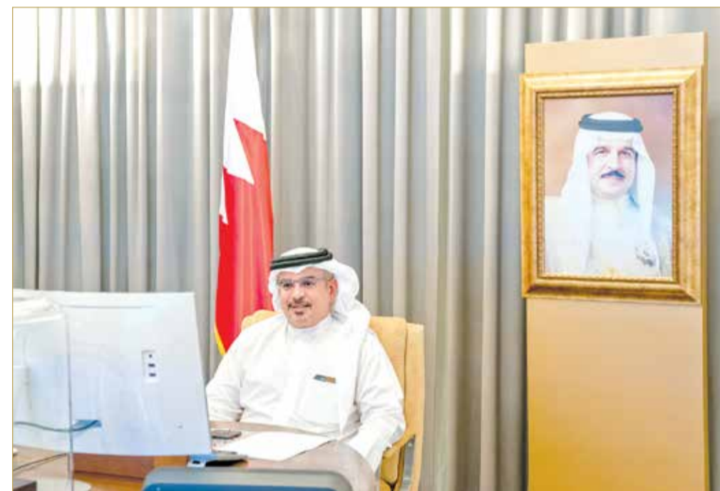
سمو ولي العهد رئيس الوزراء لدى لقائه المدير العام والرئيس التنفيذي للمعهد الدولي للدراسات الاستراتيجية

المنامة - بنا أكد ولي العهد رئيس مجلس الوزراء صاحب السمو الملكي الأمير سلمان بن حمد آل خليفة أهمية الدراسات البحثية كمرتكز لبناء الاستراتيجيات التي تحقق أهداف التنمية المستدامة وتدعم الرؤى المشتركة لمختلف القضايا على جميع المستويات بما يحقق التطلعات المنشودة، منها الحضاري والثقافي بين الشعوب وتعزيز أسس الحوار بما يحقق التقدم والتطور للمجتمع، وإسهامها الفاعل كذلك في تشكيل الأسس التي تستند إليها التوجهات والاستراتيجيات نحو التنمية والأمن والاستقرار. وأشار سموه إلى مواصلة العمل على تعزيز الاهتمام بالدراسات البحثية بما يساهم في رفد منظومة البحث والتطوير ويحقق التقدم والنماء. جاء ذلك لدى لقاء سموه أمس عن بُعد، المدير العام والرئيس التنفيذي للمعهد الدولي للدراسات الاستراتيجية جون تشيمان. (02)