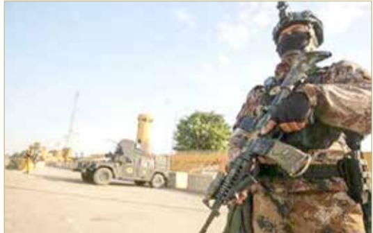
عملية عسكرية لتتبع عناصر "داعش"

تكررت الهجمات "الداعشية" أمس الثلاثاء في قضاء الطارمية، شمال العاصمة بغداد، مستهدفة نقاطاً أمنية للجيش العراقي. وأفادت وسائل إعلام محلية أن الاشتباكات مستمرة، وكانت هجمات فلول التنظيم تصاعدت في الفترة الأخيرة. فقبل أيام شنت القوى الأمنية عملية مدماهمة على تجمع لعناصر من التنظيم في الطارمية، وأدت المداهمة والاشتباكات التي تلتها إلى مقتل 5 عناصر من "داعش"، وفق ما أفاد بيان للجيش. ويواصل التحالف الدولي مساعدة القوات العراقية بالمعلومات الاستخباراتية والضربات الجوية في مكافحة الخلايا النائمة للتنظيم في المناطق الصحراوية والجبلية. قال رئيس مجلس الوزراء العراقي مصطفى الكاظمي، خلال جلسة مجلس الوزراء، أمس الثلاثاء، إن بلاده لن تكون ساحة لتصفية الحسابات.