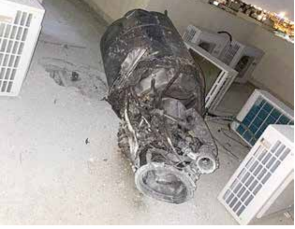
آثار الصاروخ الحوثي بمنزل في الرياض

كشفت صورٌ نشرتها وكالة الأنباء السعودية، ما لحق بمنزل مواطن في العاصمة الرياض، من أضرار، من جراء الشظايا التي انتشرت عند اعتراض صاروخ باليستي أطلقته ميليشيات الحوثيين الإرهابية. وذكر المصدر أن استهداف المدنيين بهذه الطريقة يندرج ضمن جرائم الحرب، بموجب القوانين الدولية.