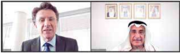
قصر القضيبيّة - مكتب نائب رئيس مجلس الوزراء

نوّه نائب رئيس مجلس الوزراء، الشيخ خالد بن عبد الله آل خليفة، بأهمية الخطط التنموية الرامية إلى تعزيز القدرة التنافسية لمملكة البحرين في المجال الاقتصادي على الصعيدين المحلي والدولي. وأكد أن ما تتمتع به مملكة البحرين بقيادة عاهل البلاد صاحب الجلالة الملك حمد بن عيسى آل خليفة، ومساندة ولي العهد رئيس مجلس صاحب السمو الملكي الأمير سلمان بن حمد آل خليفة رئيس مجلس التنمية الاقتصادية، من أرضية صلبة وراسخة استطاعت بناءها على مدى العقود الماضية، وبوأتها لأن تكون محور جذب للاستثمار، ومركزاً مالياً موثوقاً ومميراً في المنطقة، لم يتأت إلا بفضل السياسة الاقتصادية والمالية المبنية على أسس سليمة ومدروسة لتوفير بيئة آمنة ومشجعة لرؤوس الأموال، والتي ستقودنا نحو العام 2030. عام رؤية البحرين الاقتصادية، بكل ثقة وثبات.