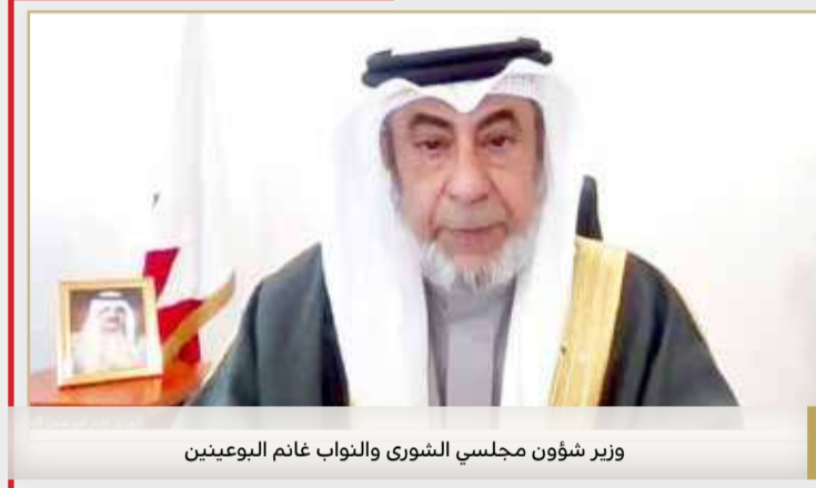
وزير شؤون مجلسي الشورى والنواب غانم البوعينين