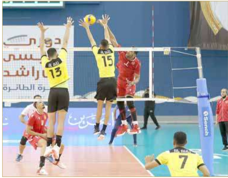
من لقاء المحرق والأهلي بالنهائي الأول