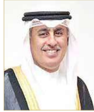
وزير الصناعة والتجارة والسياحة

حماية المستهلك وتعريفه بواجباته في الأعوام الماضية من خلال تبني عدد من المبادرات والسبل لتوعية المستهلك وثقافته بالحقوق والواجبات إلى جانب رقابة الأسواق بكفاءة أعلى والتأكد من خلوها من الممارسات التجارية غير النزيفة، والتنسيق مع الأشقاء في دول مجلس