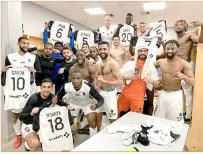
فرحة الفريق بالفوز

◆ فاز على "كان" بشعار "فيكتوريوس البحرين" في الدوري الفرنسي