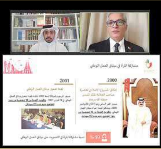
المجلس الأعلى للمرأة ينظم محاضرة التوازن بين الجنسين في "الميثاق"

ولفت إلى أن الفصل الأول من ميثاق العمل الوطني أكد كفاءة الحريات الشخصية والمساواة بين المواطنين والعدالة وتكافؤ الفرص كدعامات أساسية للمجتمع، ويقع على الدولة عبء كفالتها للمواطنين جميعاً بلا تفرقة، إضافة إلى أن المواطنين متساوون أمام القانون في الحقوق والواجبات، لا تمييز بينهم بسبب الجنس أو الأصل أو اللغة أو الدين أو العقيدة، وأشار أيضاً إلى الفصل الثاني الذي نص على حق الشعب في المشاركة في الشؤون العامة، حيث يتمتع المواطنون رجالاً ونساءً بحق المشاركة في الشؤون العامة والحقوق السياسية بما فيها حق الانتخاب والترشيح، الانتخاب والترشيح طبقاً لأحكام القانون.