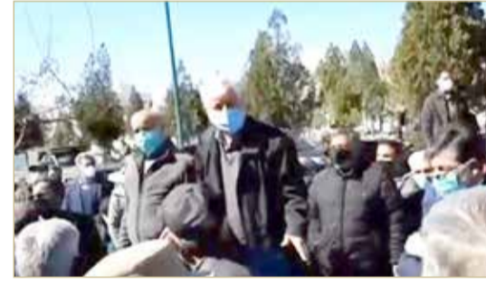
تظاهرات المتقاعدين في المدن الإيرانية

بعد أسبوع من اندلاعها، تجددت تظاهرات المتقاعدين في المدن الإيرانية، أمس الأحد، احتجاجاً على أوضاعهم المعيشية الصعبة، ونسبة الفقر العالية التي وصلت إليها البلاد نتيجة التضخم، نظمت مجموعة من المتقاعدين الإيرانيين في مناطق طهران، وتبريز، ومشهد، واصفهان، وشيراز، ويزد، وكرج تظاهرات احتجاجاً على أوضاعهم المعيشية الصعبة، وعدم تناسب معاشاتهم مع التضخم الكبير الذي يضرب اقتصاد البلاد، ما أدى إلى تدهور كبير في الأوضاع المعيشية. وردد المحتجون شعارات ضد المسؤولين مفادها "عدونا هنا في إيران"، و"يكدبون عندما يقولون أميركا هي العدو"، و"مطلبنا الرئيسي مرتبات تتناسب مع التضخم"، و"تكفي الوجود، وموائدنا فارغة"، و"المتقاعدون يموتون ولا يقبلون التمييز"، و"استولى اللصوص على صندوق التقاعد"، و"سفينة المتقاعدين رست على الطين"، وهذه ليست المرة الأولى، فقد أقام المحتجون تجمعات الأسبوع الماضي، في مناطق مختلفة من العاصمة طهران، وتجمعوا أمام مبنى البرلمان في طهران، وكذلك أمام مكاتب الضمان الاجتماعي في مدن عدة. يشار إلى أن المتقاعدين، الذين يبلغ عددهم حوالي 4 ملايين ونصف،