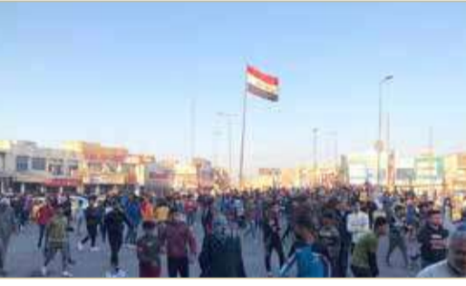
ساحة الحويبي في محافظة ذي قار

أمهل متظاهرو ساحة الحويبي في محافظة ذي قار جنوبي العراق، أمس الأحد، الحكومة 3 أيام لتنفيذ 10 مطالب وضعوها في قائمة سلمت للمحافظ الجديد. وكانت أبرز المطالب العشرة، كشف الجهة التي أمرت بإطلاق النار على المحتجين وإقالة قائد شرطة المحافظة والتحقيق مع المحافظ المستقيل. وأعلنت خلية الإعلام الأمني الحكومية في العراق، تشكيل لجنة عليا للتحقيق بالأحداث التي شهدتها المحافظة خلال الأيام الماضية. وعين رئيس الحكومة العراقية مصطفى الكاظمي، رئيس مجلس الأمن الوطني عبد الغني الأسدي محافظاً لذي قار، على خلفية مطالبة المتظاهرين بإقالة المحافظ السابق ناظم الوائلي. وشدد المحافظ بالوكالة عبد الغني الأسدي، خلال زيارة لمركز الشرطة، بوقت سابق اليوم على محاسبة كل من يطلق الرصاص الحي على المحتجين. وقال: فوضنا شرطة ذي قار بمحاسبة من لا ينفذ أوامر منع استخدام الرصاص الحي أثناء التظاهرات. كما أكد أن الحوار مع أهالي الناصرية لاختيار ما يرونه مناسباً من أجل إدارة محافظتهم والخروج من الأزمة الحالية متواصل، مضيفاً "لن نسمح لأحد