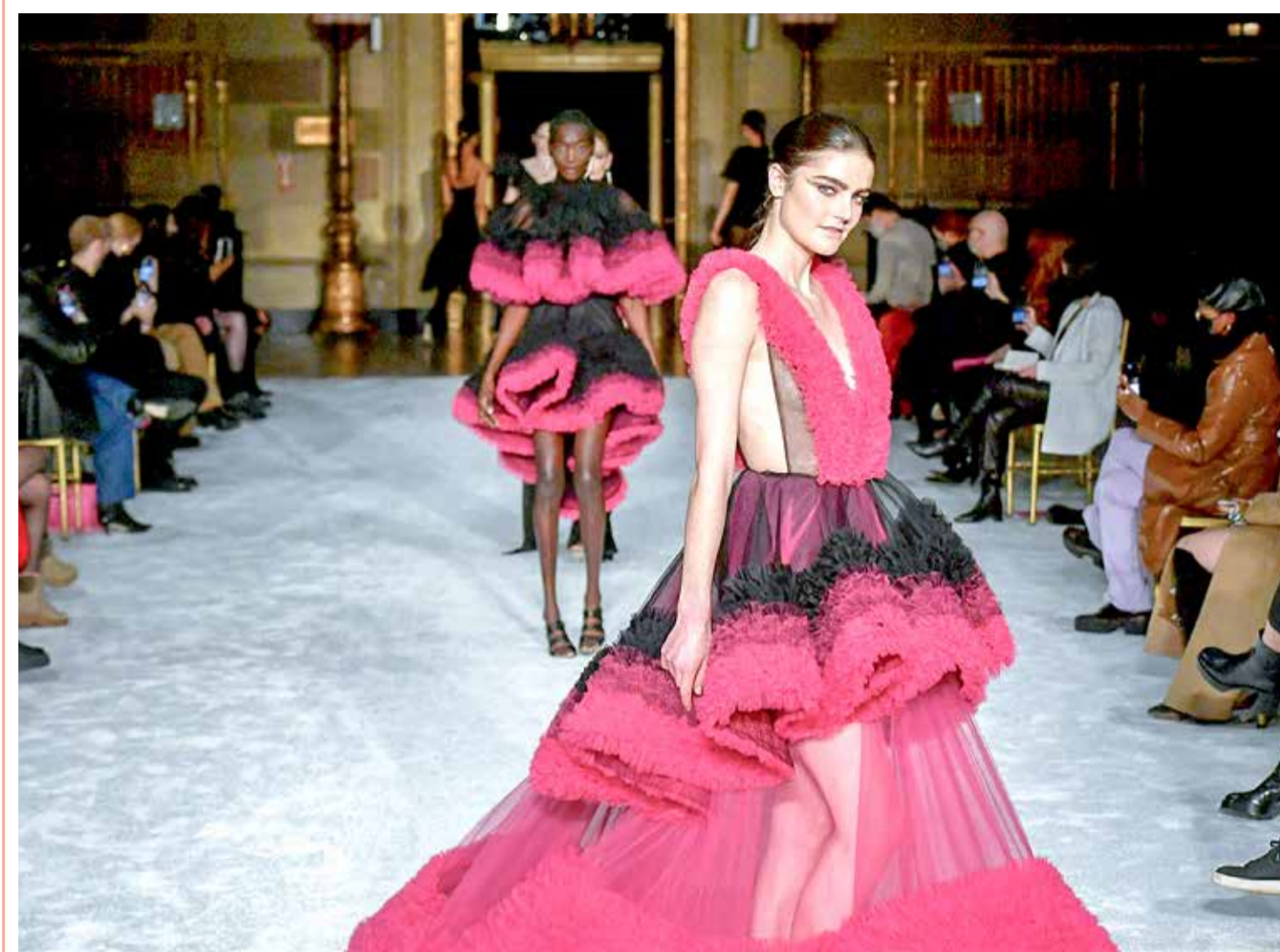
من عرض أزياء كريستيان سيريانو في جوتام هول في مدينة نيويورك

إدارة التحرير: +973 17111444 / +973 17111467 / 385 @albiladpress.com / 2008 تصدر عن دار البلاد للصحافة والنشر والتوزيع • س ت 67133 / تطبع في مؤسسة الأبرام للنشر • قسم الإعلانات: 508 / +973 17111501 / +973 17111432 / +973 17580939 / +973 32224492 / 39615645