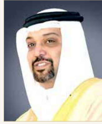
وزير المالية والاقتصاد الوطني

أقر مجلس الشورى الحساب الختامي لاحتياطي الأجيال القادمة للسنتين الماليين المنتهيتين في 31 ديسمبر 2017م و2018م، بعد تدقيقهما من قبل ديوان الرقابة المالية والإدارية. وقبل التصويت، أكد وزير المالية والاقتصاد الوطني الشيخ سلمان بن خليفة آل خليفة على الدور الهام لصندوق احتياطي الأجيال القادمة، منوهاً بأن الحكومة الموقرة ستقوم بإحالة تشريع جديد إلى السلطة التشريعية لزيادة الاستقطاع من مبيعات النفط لصالح احتياطي الأجيال القادمة بما يدعم الصندوق ويعزز من إيراداته، مشيراً إلى أن التشريع الجديد يعتبر أحد الأدوات المهمة التي ستسهم في وضع