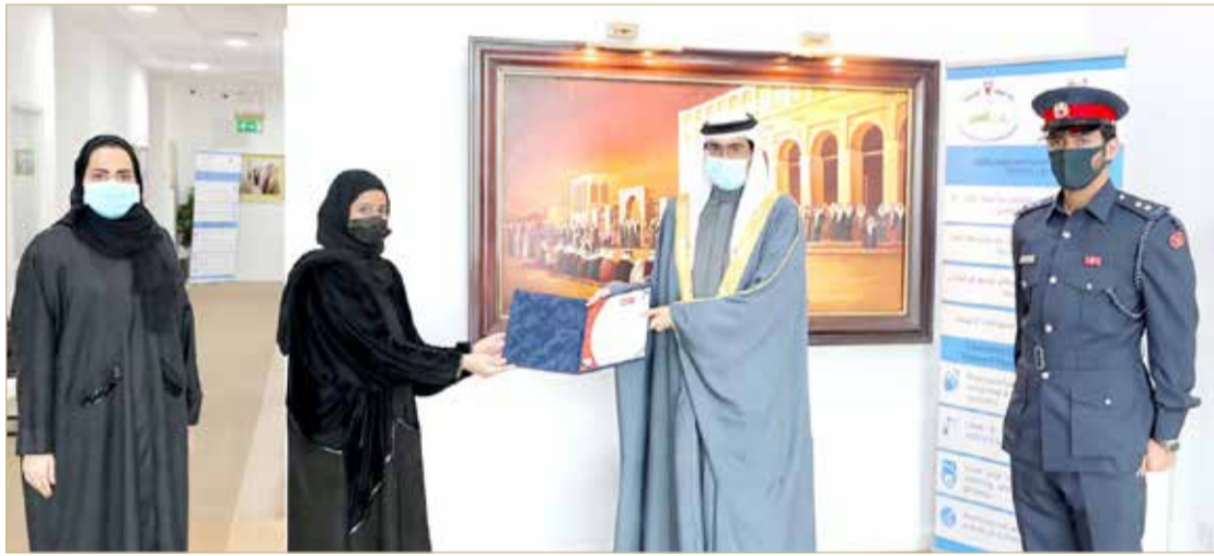
المنامة - وزارة الداخلية

سمو الشيخ خليفة بن علي: رفع كفاءة عمل البرنامج الحكومي