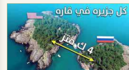
الجزيرتان تقعان في مضيق بيرينغ

المنصة "ثمة أشياء غريبة في هذا العالم"، مشيرا إلى الفارق الزمني بين الجزيرتين. والطريف في الأمر، أنه بوسع المرء أن يسير من إحدى الجزيرتين نحو الأخرى مشيا، في فصل الشتاء، لأن المياه تكون متجمدة. وتساءل معلقون "ماذا لو كان شخص ما يعمل في جزيرة ويسكن في أخرى؟ سيسير وفق أي توقيت؟". واكتشفت هاتان الجزيرتان من قارب البحار الروسي الدنماركي، فيتوس بيرينغ، في السادس عشر من أغسطس 1728. وجزيرة "ديوميدي" الكبرى غير مأهولة، في حين تضم جزيرة "ديوميدي" الصغرى ما لا يقل عن 110 من الأشخاص.