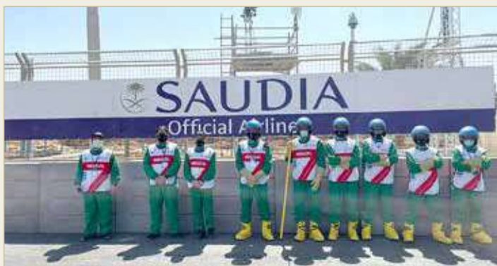
من مشاركة المارشالز في تنظيم سباق الفورمولا إي

وكان منظمو رياضة السيارات التابعين للاتحاد البحريني للسيارات قد ساهموا بعدد 127 فردًا قد ساهموا في تنظيم أولى وثاني جولات بطولة العالم للفورمولا إي التي أقيمت بالدرعية التاريخية بالعاصمة السعودية الرياض، وفي نفس الوقت كانت حلبة البحرين الدولية قد احتضنت الجولة السادسة من تحدي حلبة البحرين الدولية CRC والجولة الرابعة من بطولة البحرين الوطنية لسباقات السرعة.