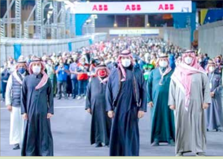
الأمير محمد بن سلمان خلال حضوره سباق الفورمولا إي الدرعية

أشاد بجهود الأمير خالد بن سلطان ودعم القيادة الرشيدة