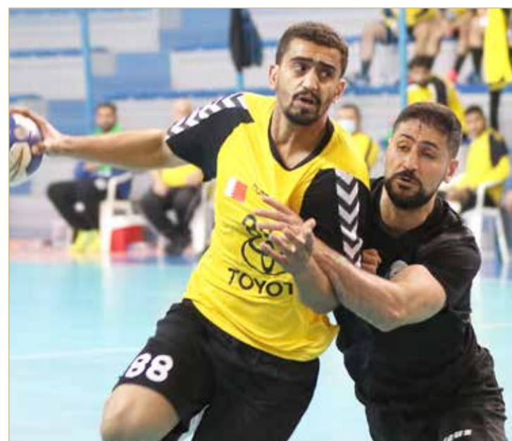
لقاء الأهلي وسماهيج

حقق فريق الأهلي انتصاره الخامس بدوري أندية الدرجة الأولى لكرة اليد وذلك على حساب نظيره سماهيج بنتيجة (26/29) في مباراة مؤجلة لحساب الجولة الرابعة والمجموعة الثانية أقيمت مساء الإثنين.