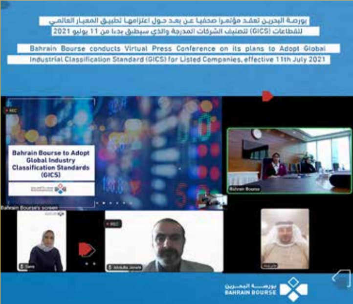
جانب من المؤتمر الصحفي للبورصة أمس

احتساب قيم تاريخية لهذه المؤشرات الجديدة لمدة عام سابق (12 شهراً) من تاريخ البدء. وبما أن هذه المؤشرات جديدة، لن يتم احتساب المؤشرات القطاعية الحالية وستظهر قيم التغير ونسب التغير في اليوم اللاحق ليوم الإطلاق على الموقع الإلكتروني للبورصة على صفحة المعيار العالمي الجديد المعتمد للقطاعات.