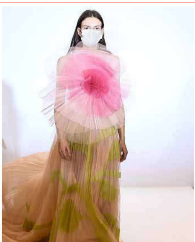
عرض فستان مبتكر في دار الأزياء الراقية لكريستيان ديور في باريس

كشف أطباء أميركيون عن الدور الذي تلعبه المشروبات الغازية في تراكم الدهون في منطقة البطن. وأكد خبراء في كلية الطب بجامعة هارفارد في بوسطن أن المشروبات الغازية تؤدي إلى تراكم الدهون في البطن وتؤثر بشكل كبير على فقدان الوزن. وتم التوصل إلى هذا الاستنتاج في تجربة شارك فيها أكثر من 2500 متطوع. ولاحظ الباحثون أن الأشخاص الذين يشربون المشروبات السكرية يوميًا لديهم مستويات دهون حشوية أعلى بنسبة 10% من أولئك الذين لم يكن لديهم مثل هذه العادات، حسب صحيفة "إكسبرس".