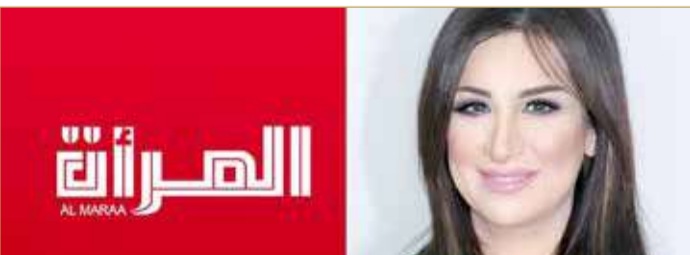
الجفير - جمعية الصحفيين