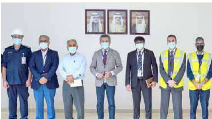
البنفلاخ متفقد سير العمل في المشروع

إجراء الاختبارات اللازمة قبل بدء التشغيل الفعلي