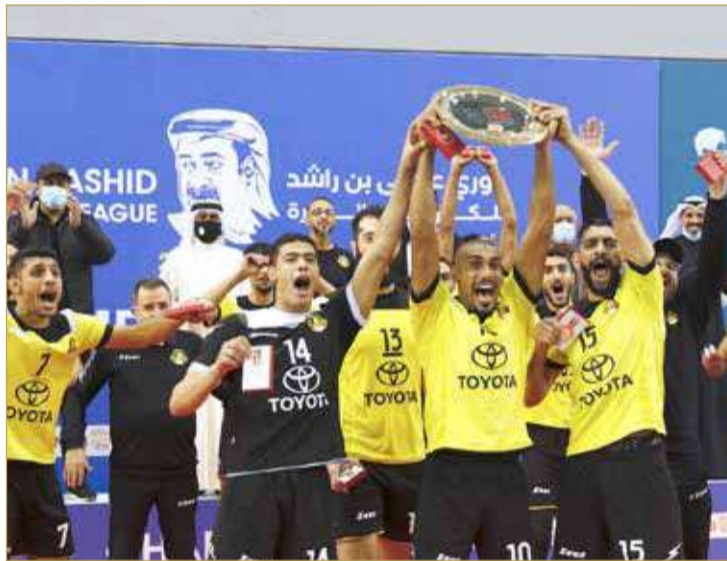
الأهلاوية يتوجون باللقب