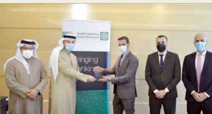
أثناء تسليم الجائزة

قد خصص هذه الجوائز منذ العام 1997م، تقديراً للأداء المتسق وعالي الجودة لإدارة عمليات تحويل الأموال لعملاء "جي بي مورغان" وموظفيها، إضافة إلى تقدير جهودهم في تحقيق أفضل معدلات المعالجة المباشرة للتحويلات "STP" لفئتها.