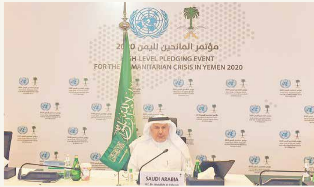
المشرف على مركز الملك سلمان للإغاثة عبد الله الربيعة في افتتاح مؤتمر المانحين

يشار إلى أن نصف المرافق الصحية في اليمن مغلقة أو مدمرة. وبحسب الأمم المتحدة، سيواجه أكثر من 16 مليون شخص من بين 29 مليوناً الجوع في اليمن هذا العام، وهناك ما يقارب من 50 ألف يمني "يموتون جوعاً بالفعل في ظروف تشبه المجاعة".