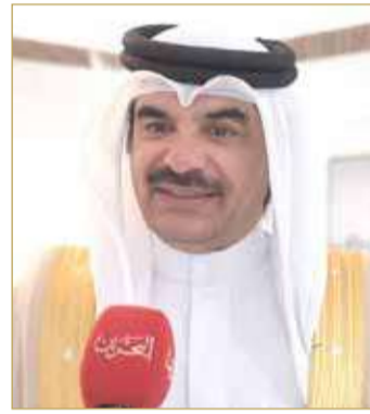
محمد السبيسي البوعيين

من جانبه، أكد رئيس لجنة الشؤون الخارجية والدفاع والأمن الوطني بمجلس النواب محمد السبيسي البوعيين أحد مقدمي الطلب "أن الإجماع النيابي بموافقة جميع أعضاء مجلس النواب على التقدم بطلب إصدار بيان حول رفض المساس بسيادة المملكة العربية السعودية الشقيقة وكل ما من شأنه المساس بقيادتها واستقلال قضائها، والتأكيد على دور المملكة المحوري في تعزيز الأمن والسلم الإقليمي والدولي ومكافحة الإرهاب والعنف والفكر المتطرف، جاء ليعكس الإرادة الشعبية لشعب البحرين وتعبيراً عن الموقف الداعم