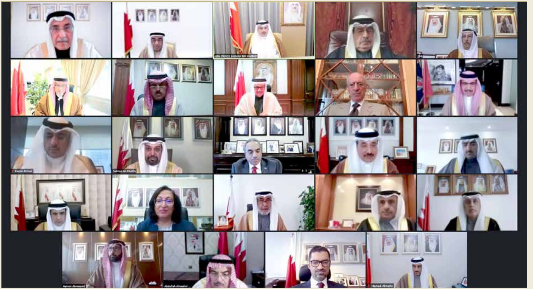
سمو ولي العهد رئيس الوزراء مترسدا جلسة مجلس الوزراء

◆ مجلس الوزراء: السعودية العمق الاستراتيجي ومحور ارتكاز الأمن العربي والإقليمي