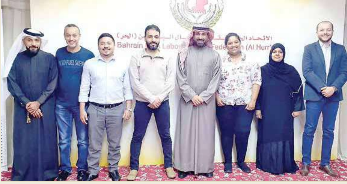
رئيس الاتحاد الحر متوسط إدارة النقابة بقيادة الجودر