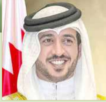
سمو الشيخ خالد بن حمد