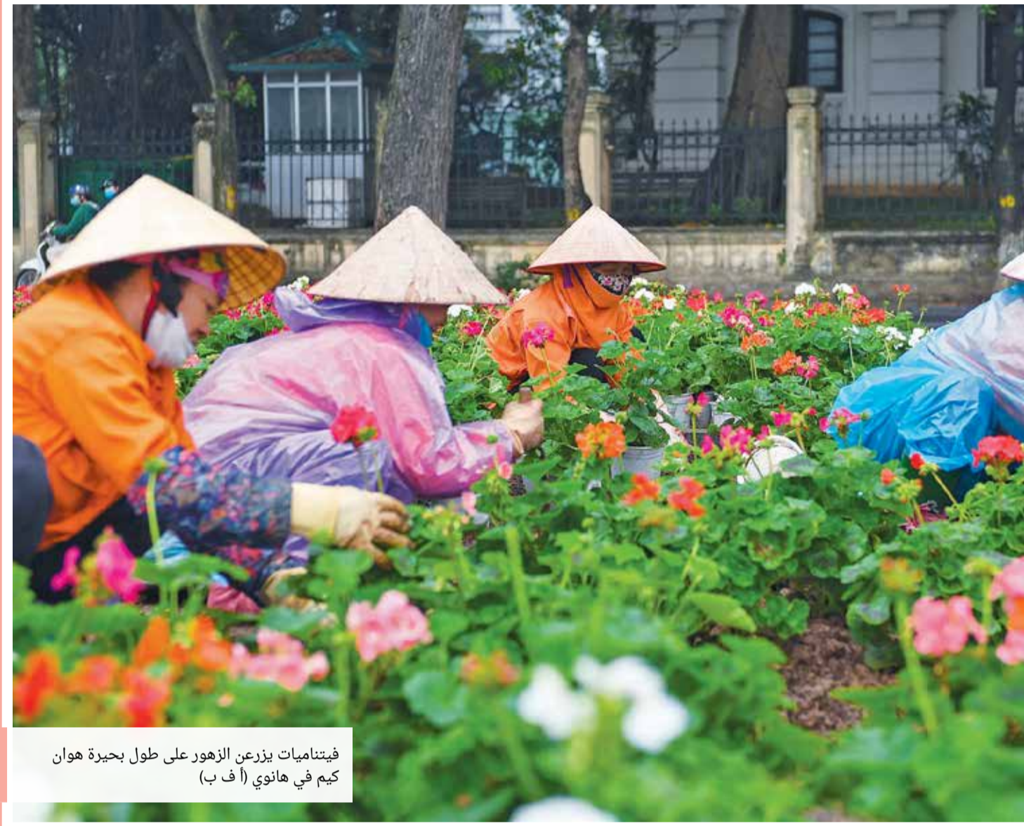
فيتناميات يزرعن الزهور على طول بحيرة هوان كيم في هانوي

إدارة التحرير: +973 17111444 +973 17111467 385 @local@albiladpress.com 2008 تصدر عن دار البلاد للصحافة والنشر والتوزيع س.ت 67133 تطبع في مؤسسة الأبرام للنشر قسم الإعلانات: +973 17111501 / 508 +973 32224492 / 39615645 +973 17111432 +973 17111434