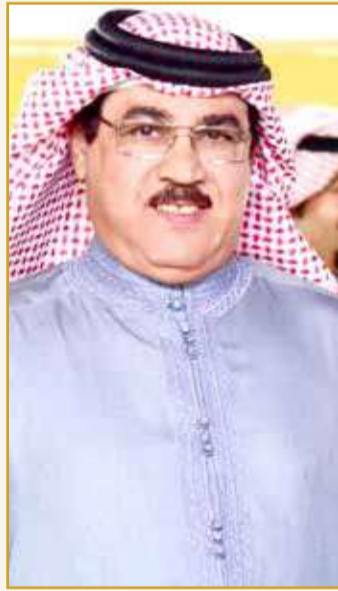
عيسى بن خليفة

هذا الجانب، وصدر لي ديوان بعنوان "دمعة بتيمة"، وكنت صاحب فكرة إنشاء جمعية الشعر الشعبي، بعد أن رفعتها إلى حضرة صاحب الجلالة الملك حمد بن عيسى آل خليفة حفظه الله حين كان وليا للعهد، بحضور الشيخ خالد بن أحمد آل خليفة رئيس الديوان، ومجموعة من شعراء البحرين المعروفين. وشاركت وأقمت مجموعة من الأمسيات الشعرية المحلية والخليجية، منها أمسيات لكار الشعراء وعلى رأسهم صاحب السمو الملكي الأمير خالد الفيصل، وكذلك أقمت المسابقات الشعرية للمواهب الشابة والتي اختتمتها بأمسية شعرية شارك فيها أقطاب الساحة الشعرية في الخليج، وهم: المغفور له الشيخ عيسى بن راشد آل خليفة، وصاحب السمو الملكي الأمير بدر بن عبدالمحسن آل سعود، وصاحب السمو الأمير عبدالعزيز بن