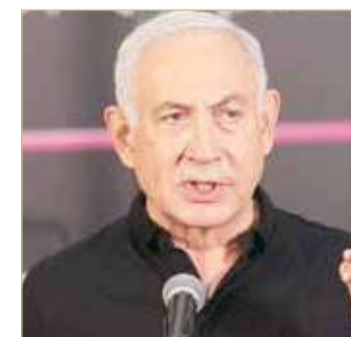
رئيس الوزراء الإسرائيلي نتانياهو

الإيرانيين هم من فعلوها". وتابع غانتس قائلاً: "هذا تقديري.. حتى الآن وعلى مستوى التقييم المبدئي في ظل قرب المكان وسباق الأحداث". وتعرضت السفينة ناقلة السيارات التي تحمل اسم (إم. في هيلبوس راي) لانفجار في خليج عمان بين الخميس وصباح الجمعة.