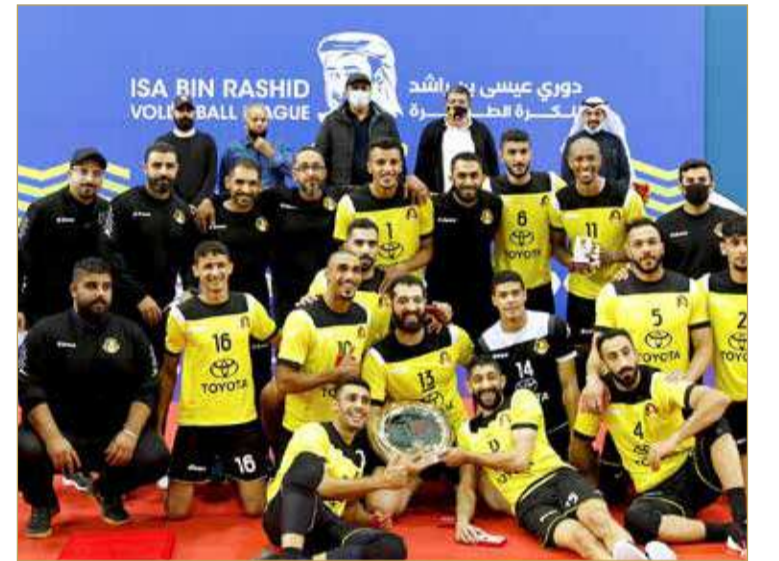
الأهلي البطل متوجا باللقب