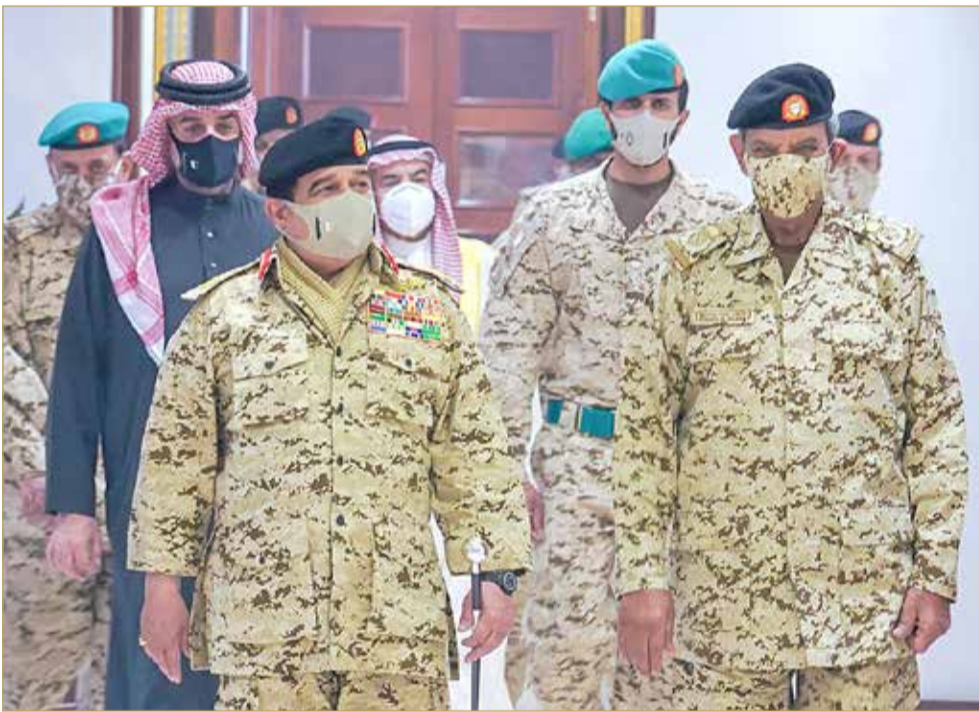
جلالة الملك في زيارة للقيادة العامة لقوة دفاع البحرين

تفضل عاهل البلاد صاحب الجلالة الملك حمد بن عيسى آل خليفة، بزيارة إلى القيادة العامة لقوة دفاع البحرين أمس. وتأتي الزيارة الكريمة للقيادة العامة بمناسبة ختام احتفالات قوة دفاع البحرين بمناسبة الذكرى الثالثة والخمسين لتأسيس قوة الدفاع، مشيداً جلالتهم بالإنجازات والمشاريع العديدة والمهمة التي تم افتتاحها بهذه المناسبة، ومقدراً جلالتهم للجهود التي قامت بها قوة الدفاع للاحتفال بالمناسبة الوطنية المجيدة. كما أثنى جلالتهم، على الجهود التي تبذلها قوة دفاع البحرين للتصدي لفيروس كورونا (كوفيد 19) ضمن الحملة الوطنية لمكافحة هذا الوباء العالمي، وعلى المساهمات النبيلة وجاهزية الخدمات الطبية بتوفير المنشآت المجهزة بأحدث المستلزمات الصحية العلاجية والتدابير الوقائية من خلال كوادر طبية مؤهلة ومتخصصة. وأعرب جلالتهم عن اعتزازهم بمنتسبي قوة دفاع البحرين وتأهيمهم الدائم، مؤكداً أنهم موضع تقديرنا الكبير وفخر البحرين وأهلها.