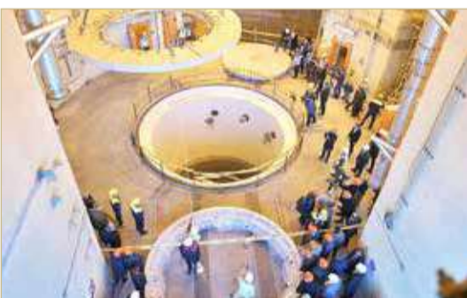
الوكالة الذرية قلقة من وقف إيران عمليات المراقبة والتفتيش

عنها إلى طهران. وأضاف غروسو أنه تم إبلاغ طهران أن وقف أو تقيد وصول المفتشين الدوليين للمواقع النووية سيكون له تأثير سلبي على عمل الوكالة. ودعا إلى عدم تحويل عمليات التفتيش التي تجريها هيئته في إيران إلى "ورقة مساومة" توضع على طاولة المفاوضات، في وقت تفكر القوى الكبرى بإطلاق مفاوضات لإعادة إحياء الاتفاق النووي المبرم العام 2015.