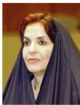
سمو الأميرة سبيكة بنت إبراهيم

بعثت قرينة العاهل رئيسة المجلس الأعلى للمرأة صاحبة السمو الملكي الأميرة سبيكة بنت إبراهيم آل خليفة مساء أمس الإثنين برقية تهنية لعضو مجلس الشورى ورئيس لجنة الشؤون التشريعية والقانونية دلال الزايد بمناسبة إعلان الاتحاد البرلماني العربي عن فوزها بجائزة "التميز البرلماني العربي" للعام 2020، عن فئة عضو البرلمان.