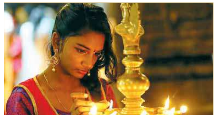
وقال روهانا إن طاردة الأرواح الشريرة وضعت الزيت على الفتاة أولا ثم بدأت نضربها مرارا بعصا. وعندما فقدت الفتاة وعيها، تم نقلها إلى المستشفى حيث توفيت، وفق ما نقلت "السوشيتي برس".

ألقت الشرطة السريلانكية القبض على شخصين على صلة بوفاة طفلة تبلغ من العمر 9 سنوات، تعرضت للضرب بشكل متكرر، أثناء طقس يعتقد أنه يطرد روحا شريرة. وكان من المقرر أن يمثل المشتبه بهما - المرأة التي قامت بعملية طرد الأرواح الشريرة ووالدة الفتاة - أمام المحكمة الاتيين للاستماع إلى اتهامات بشأن