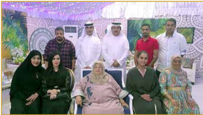
فريق برنامج تاريخ المحرق