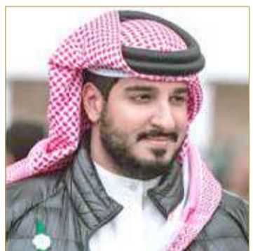
سمو الشيخ عيسى بن عبدالله

كما سيشارك الفارس الهولندي المعروف أدري ديفريس الذي سبق له الفوز بكأس الملك حيث سيشارك حضوراً قوياً بأربع