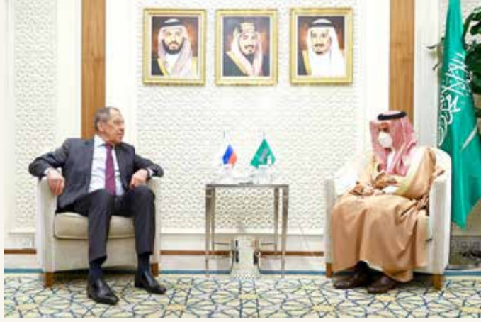
الأمير فيصل بن فرحان بن عبد الله ولافروف في الرياض

أكد وزير الخارجية السعودي، الأمير فيصل بن فرحان بن عبد الله، أن "محاولات الاستهداف الحوثية الفاشلة تستهدف عصب الاقتصاد العالمي". وقال الأمير فيصل بن فرحان خلال مؤتمر صحفي مع نظيره الروسي سيرغي لافروف في الرياض أمس الأربعاء: "نجدد دعماً للوصول إلى حل سياسي للأزمة في اليمن". كما شدد على أنه "يجب أن تكون هناك وقفة دولية حازمة تجاه هجمات الحوثيين"، لافتاً إلى أن "هناك تنديداً دولياً واسعاً بالهجوم على ميناء رأس تنورة". إلى ذلك أضاف أن "الأولوية في اليمن هي التوصل لوقف شامل لإطلاق النار، مؤكداً أن "التحالف أوقف إطلاق النار في اليمن من جانب واحد منذ نحو عام". وأوضح أن "على المجتمع الدولي مسؤولية كبيرة للضغط على الحوثيين".