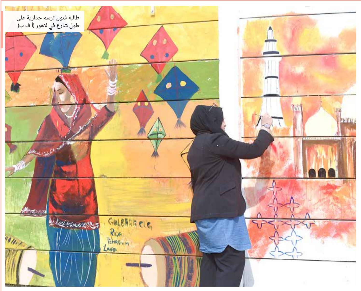
طالبة فنون ترسم جدارية على طول شارع في لاهور

إدارة التحرير: +973 17111444 +973 17111467 385 local@albiladpress.com 2008 تصدر عن دار البلاد للصحافة والنشر والتوزيع • س.ت 67133 • طبع في مؤسسة الأبرام للنشر • قسم الإعلانات: 508 / 17111501 +973 32224492 / 39615645 +973 17580939 +973 17111432 +973 17111434