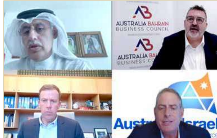
جانب من المشاركين بالندوة أمس

نتطلع لتوقيع اتفاقية للتجارة الحرة بين دول الخليج وكانبرا 2021