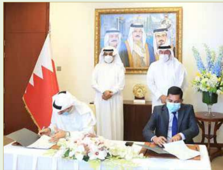
توقيع اتفاقية شراء "غولدن غيت"

التنظيم العقاري "تراقب حسابات الضمان وسير إنجاز المشاريع"