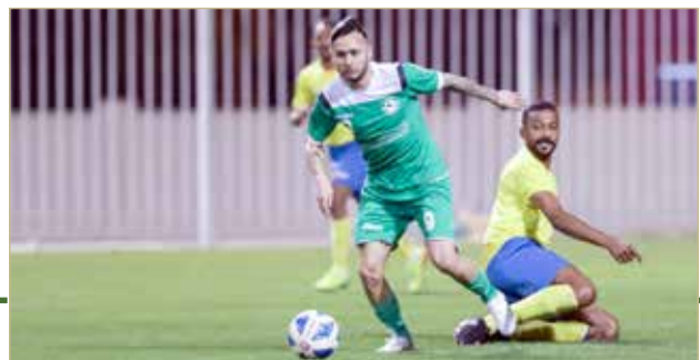
من لقاء البحرين وقلالي