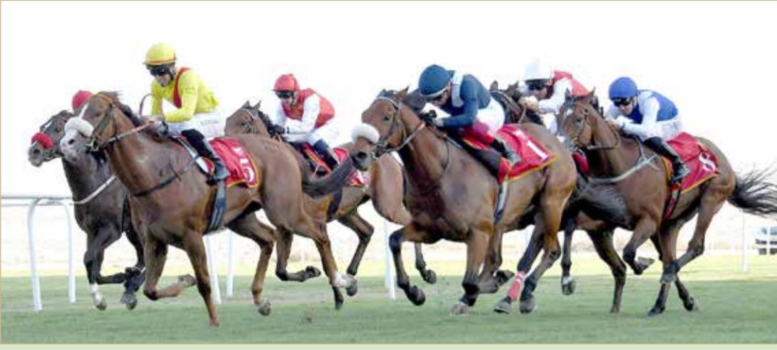
منافسات قوية بين نخبة الجياد في السباق المرتقب