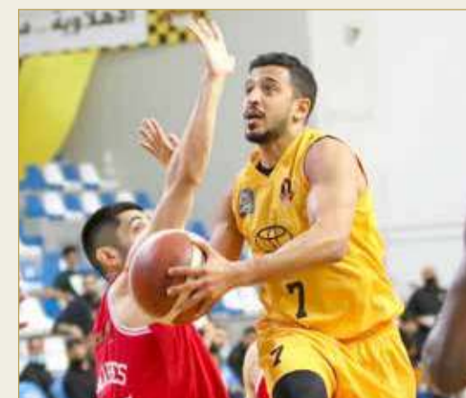
لقاء الاهلي والمحرق