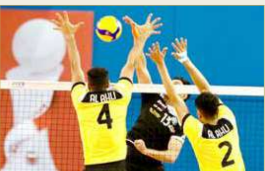
الاهلي هزم بني جمرة وصعد لنصف النهائي

بعد تغلبهما على النصر وبني جمرة في كأس ولي العهد