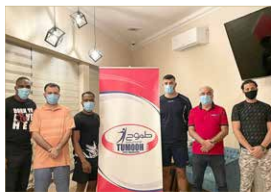
اللاعبون الذين وقعت معهم شركة طموح