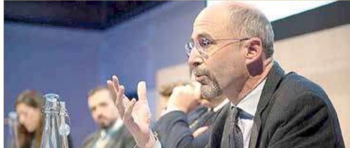
مبعوث وزارة الخارجية الأميركية إلى إيران، روب مالي

على وقع حالة الشد والجذب بين الجانبين، أكد مبعوث وزارة الخارجية الأميركية إلى إيران، روب مالي أن إدارة الرئيس جو بايدن لن ترفع العقوبات بشكل أحادي عن طهران. وأوضح أن إدارة بايدن مستعدة لدراسة تخفيف بعض العقوبات فقط في حالة استئناس المحادثات بين الأطراف، وضمن عملية متبادلة، بحسب ما أبلغه مسؤولون في الخارجية. كما رأى أن المحادثات المباشرة أكثر فعالية وتنطوي على احتمالات أقل لسوء الفهم، لكنه أضاف أنه بالنسبة لواشنطن، فالمضمون أهم من الشكل، بحسب تعبيره. إلى ذلك، شدد في مقابلة أمس الأربعاء مع موقع أكسيوس: "لا نوي أن تسير وتيرة مناقشاتنا بناء على الانتخابات