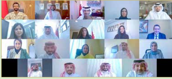
جانب من اللقاء المرئي

ناصر بن حمد يلتقي وزير "الرياضة" ومسؤولي الوزارة عبر الاتصال المرئي