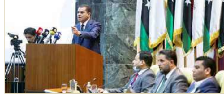
دبيبة يترأس حكومة من 34 عضواً

منح البرلمان الليبي أمس الأربعاء الثقة لحكومة وحدة وطنية ستقود هذا البلد الشمال إفريقي الفارق في النزاع نحو انتخابات في ديسمبر في محطة رئيسة نحو طي صفحة عقد من الفوضى. وغرقت ليبيا الغنية بالنفط في النزاع منذ الإطاحة بالزعيم معمر القذافي ومقتله في 2011 في انتفاضة أزرها حلف شمال الأطلسي، ما أدى إلى صراع على النفوذ بين قوى عدة. وقال رئيس الحكومة المكلف عبد الحميد الدبيبة في كلمة مقتضبة بعد تصويت البرلمان وقد بدا عليه التأثير "ستكون هذه الحكومة كل الليبيين". وأضاف "ليبيا واحدة موحدة". وبعد يومين من المشاورات المكثفة في مدينة سرت الساحلية، منح البرلمان