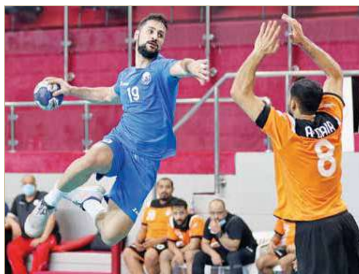
لقطة لفريق سماهيج في الدوري

وأكد رئيس نادي سماهيج أن طموح الفريق لن يتوقف عند مرحلة الصعود، بل الاستمرار قدماً طالما هناك فرصة أمام سماهيج وهذا حق مشروع له كما هو للأخريين. مضيقاً أن الفريق لا يمتلك الخبرة الكافية للتعامل مع المباريات والمراحل الحساسة ولكن لدينا الثقة التامة بالمدرّب الحسناوي الذي لن يتم التنازل عنه، بأن يظهر الفريق بالمستوى المطلوب الذي يلي الطموح، متمنياً التوفيق لهم.