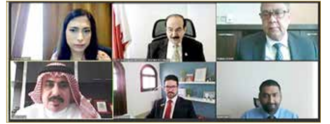
المنامة - مكتب رئيس هيئة الطاقة المستدامة

عقد رئيس هيئة الطاقة المستدامة عبدالحسين ميرزا اجتماعاً افتراضياً عن بعد مع وفد رفيع المستوى من شركة "مشاريع المناعي" وهي إحدى شركات مجموعة المناعي. وخلال اللقاء، أثنى ميرزا على الشراكات والعلاقات مع كبرى الشركات الدولية التي تقوم بها "مشاريع المناعي" لجلب وجذب الخبرات التنافسية، حرصاً على تقديم أعلى مستويات الخدمة وأفضل المعايير في مختلف المجالات والمشاريع التي تعمل عليها الشركة. وفي هذا السياق استعرض الوفد خطط واستراتيجيات شركة "مشاريع المناعي" وأهم الشراكات الدولية التي عقدها مع بيوت الاختصاص والخبرة في مجالات الطاقة المتجددة والمجالات الأخرى التي تعمل عليها الشركة.