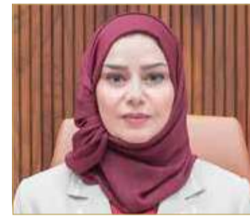
رئيسة مجلس النواب

♦ زينل: دعوناهم لزيارة البحرين... إلا أنه مصرّ على التسييس