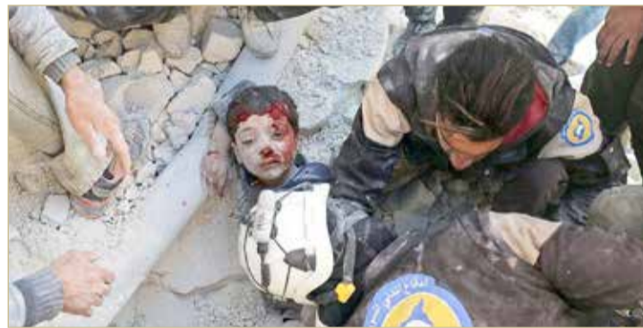
السوريون يعانون من تبعات حرب ما تزال مستمرة

♦ بعد 10 سنوات من الحرب .. 60% يواجهون خطر الجوع