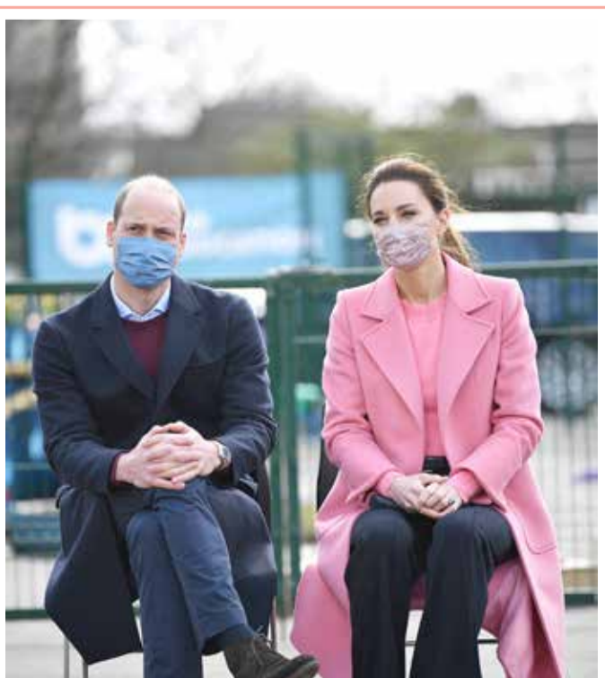
دوق ودوقة كامبريدج البريطانية أثناء مناقشة مع معلمين متخصصين في الصحة العقلية خلال زيارة مدرسة بعد إعادة افتتاحها إثر تخفيف قيود الإغلاق بسبب فيروس كورونا في شرق لندن