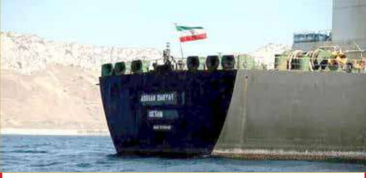
سفينة إيرانية (12)