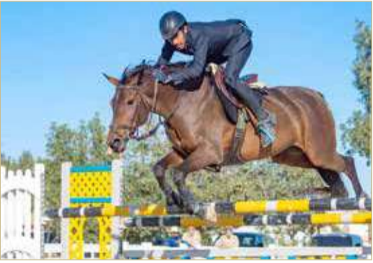
من منافسات قفز الحواجز

منافسات مثيرة في بطولة الاتحاد الملكي لقفز الحواجز