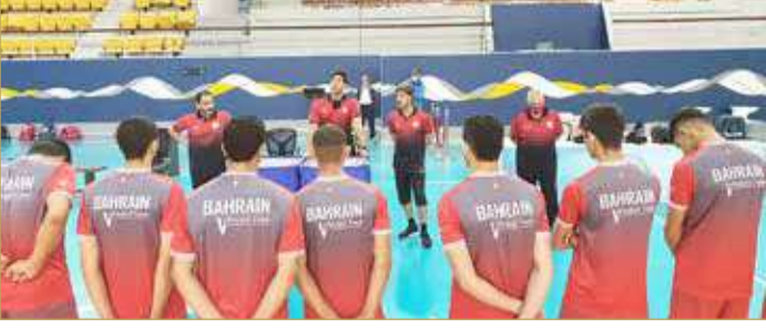
منتخب الناشئين خلال تدريبه