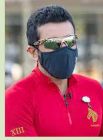
سمو الشيخ ناصر بن حمد

سيسجل نجاح جديد يضاف إلى سلسلة النجاحات التي حققتها الاتحاد في الموسم الحالي 2020 - 2021. وتابع سموه "لدينا العديد من الأهداف التي من شأنها مواصلة الارتقاء برياضة القدرة، وفي كل موسم نجني ثمار العديد من الأهداف عبر تشجيع شريحة كبيرة من الشباب والشابات بالمشاركة في سباقات القدرة وهو ما تحقق في الموسم الحالي ونحن على ثقة أن سباق الأبطال والعوائل القادم سيكون ذات طابع خاص وسيحقق أهدافنا".