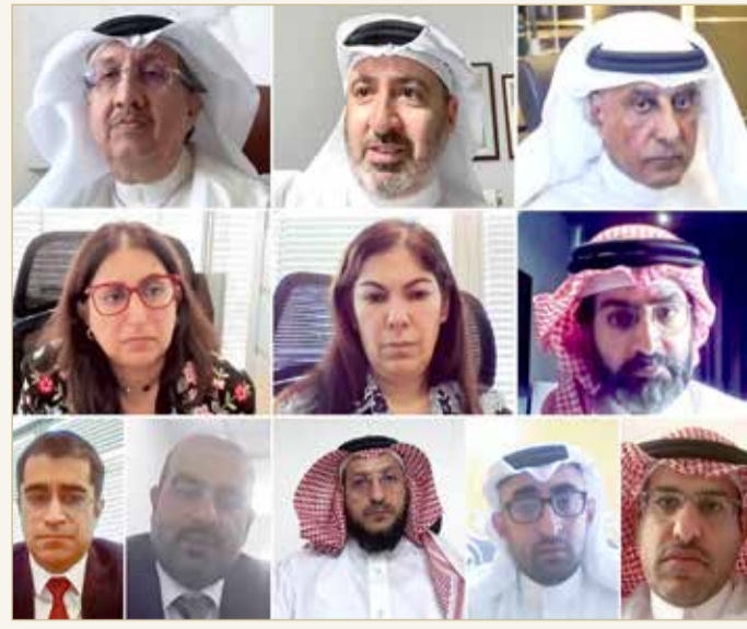
المشاركون في اجتماع "عمومية ألبا"

وتمت الموافقة على عدم توزيع حصص أرباح نقدية للمساهمين وتحويل 9,755 ألف دينار - صافي الربح للسنة المنتهية في 31 ديسمبر 2020 إلى الأرباح المستبقاة. وتم خلال الاجتماع أيضًا الموافقة على مقترح المكافأة الإجمالية لأعضاء مجلس الإدارة بقيمة 210,000 دينار عن السنة المنتهية في 31 ديسمبر 2020، والخاضع