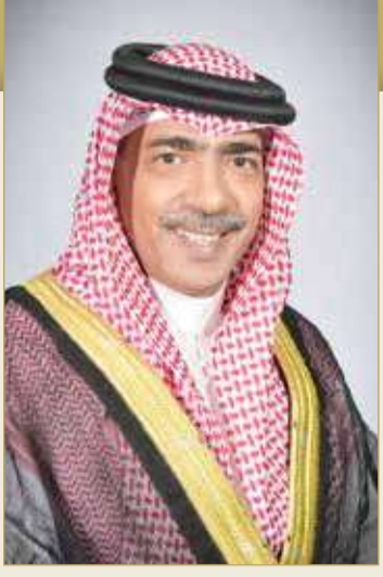
الشيخ علي بن محمد