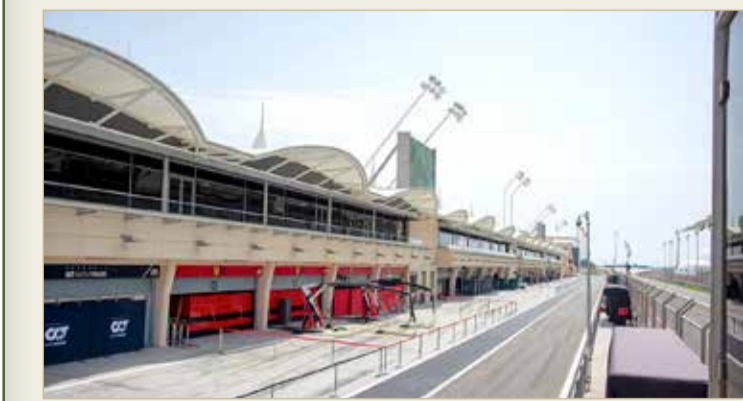
الحلبة جاهزة للتجارب

تتواصل الإثارة على مضمار حلبة البحرين الدولية "موطن رياضة السيارات في الشرق الأوسط"، إذ ستشهد اليوم (الجمعة) الموافق 12 مارس انطلاق التجارب الرسمية لبطولة العالم للفورمولا 1 وتتواصل لـ 3 أيام حتى يوم الأحد الموافق 14 مارس الجاري. وتقام التجارب استعدادا لانطلاق الموسم الجديد من البطولة العالمية 2021 من خلال الجولة الافتتاحية للبطولة العالمية من خلال سباق جائزة البحرين الكبرى لطيران الخليج للفورمولا 1، الذي سيطلق نهاية هذا الشهر وفي الفترة من 26 حتى 28 مارس الجاري. وتنطلق التجارب الرسمية للفورمولا 1 على فترتين التجارب الصباحية من