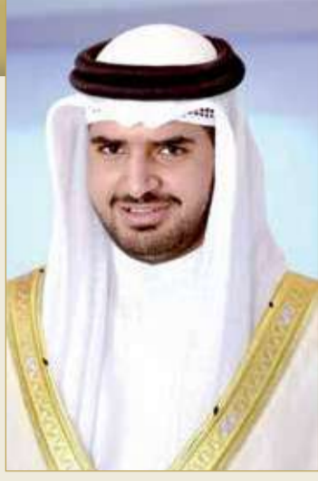
سمو الشيخ عيسى بن علي

بمناسبة تأهل منتخب شباب الطائفة لبطولة العالم تحت 21