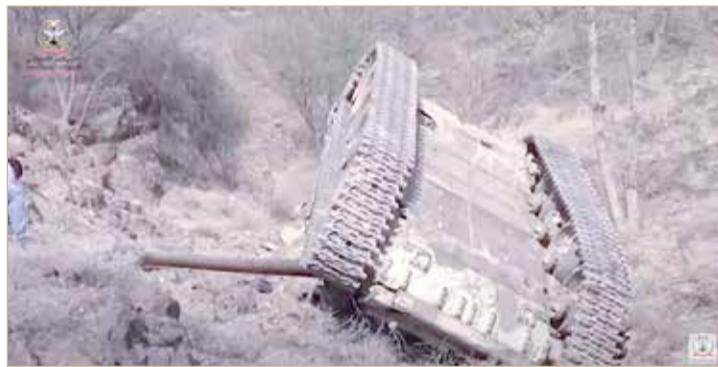
من خسار الحوثيين في منطقة الكدحة

♦ تعز.. الجيش يحرر مواقع ويلحم الجبهات لأول مرة منذ 6 سنوات