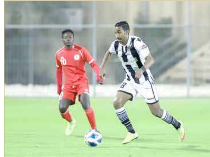
من لقاء الخالدية والاتفاق

فوز سداسي للاتحاد.. والمدينة يتخطى سترة بدوري الثانية