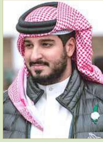
سمو الشيخ عيسى بن عبدالله

مضاعفة المكافآت والجوائز تشجيعا لمشاركة أولياء الأمور مع أبنائهم