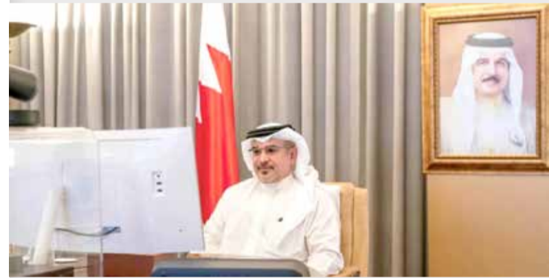
سمو ولي العهد رئيس مجلس الوزراء يترأس اجتماع اللجنة التنسيقية

ترأس ولي العهد رئيس مجلس الوزراء صاحب السمو الملكي الأمير سلمان بن حمد آل خليفة اجتماع اللجنة التنسيقية 372 الذي عُقد عن بُعد. واستعرضت اللجنة آخر مستجدات التعامل مع فيروس كورونا (كوفيد 19).