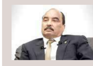
نواكشوط.