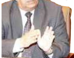
عبدالقادر عقيل (04)

قال الأديب البحريني عبدالقادر عقيل إن مشكلة الثقافة أنها لم تكن أبداً ضمن أولويات النمو الاقتصادي والاجتماعي؛ لذا كانت، ولا تزال، تعاني من الإهمال والقصور. وأضاف أنه مازال ينظر إلى الثقافة على أنها أنشطة "ترفهية" و"كرفالية" و"فنية" يمكن الاستغناء عنها حال تغير الأحداث، وهي لا تكون أبداً في مستوى الرؤى السياسية والاقتصادية.