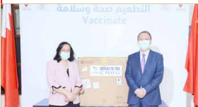
وزيرة الصحة أثناء تسلم الشحنة بحضور السفير الصيني