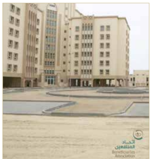
صورة أرشيفية لأحد مشروعات شقق التمليك

مشروع السكن العمودي "مشوه" ... ووزارات لا تعترف بالنظام