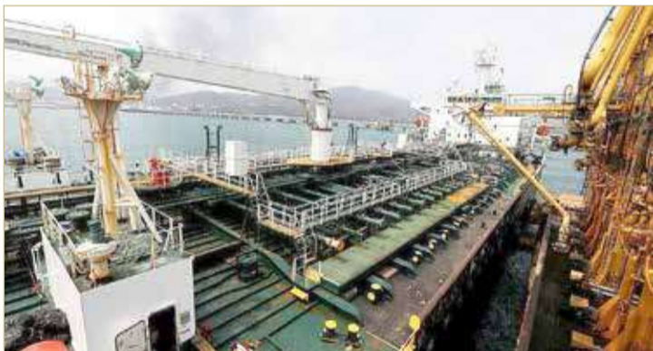
سفينة نفط إيرانية "ارشيفه"

الشحنات مصدر ربح لطرهان تستغل في تمويل الميليشيات، حيث تمت في مناطق بحرية عدة بالشرق الأوسط مثل البحر الأحمر. وقال مسؤولون أميركيون: إن بعض الهجمات طالت سفن إيرانية تنقل أسلحة في المنطقة، فيما رفضت إسرائيل التعليق على هذه التقارير.