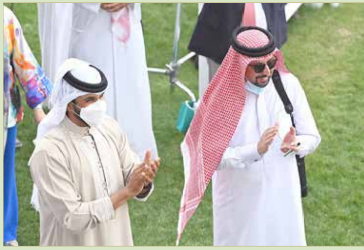
سمو الشيخ ناصر بن حمد مع المضمهر فوزي ناس