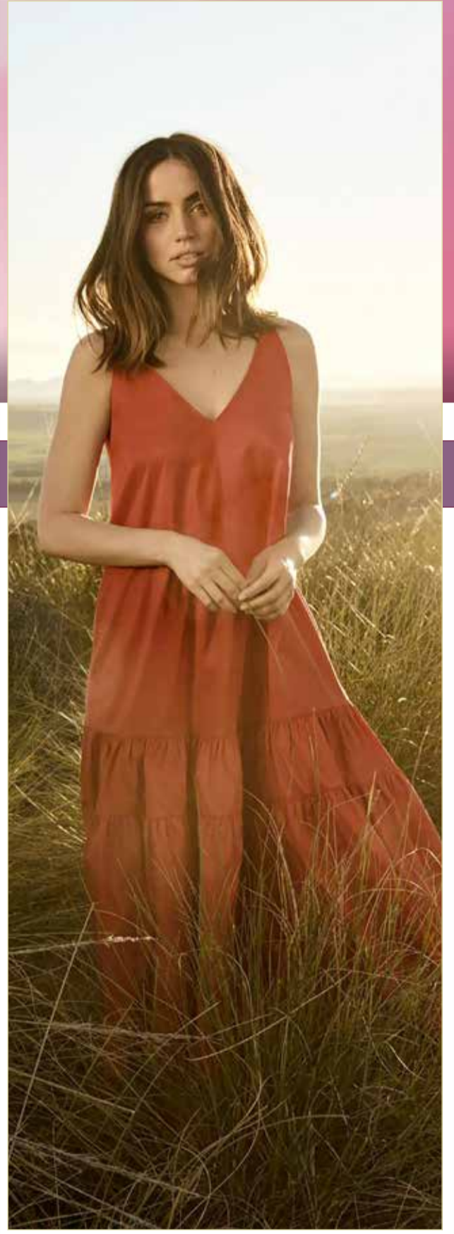
« قالت النجمة الإسبانية الكوبية آنا دي أرماس إن دور مارلين مونرو في فيلمها الجديد أرهقها كثيرا وعذبها، خصوصا أنها ظلت 9 أشهر تتدرب على تقليد طبقة صوتها وطريقتها المميزة في الكلام.