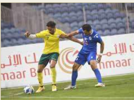
من مباراة المالكية والحد