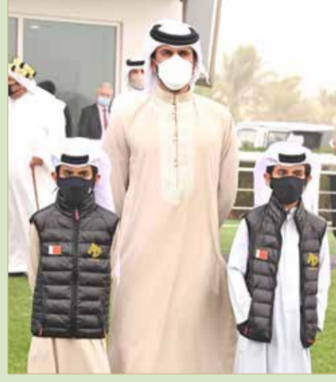
سمو الشيخ ناصر بن حمد وأنجال سموه الكرام