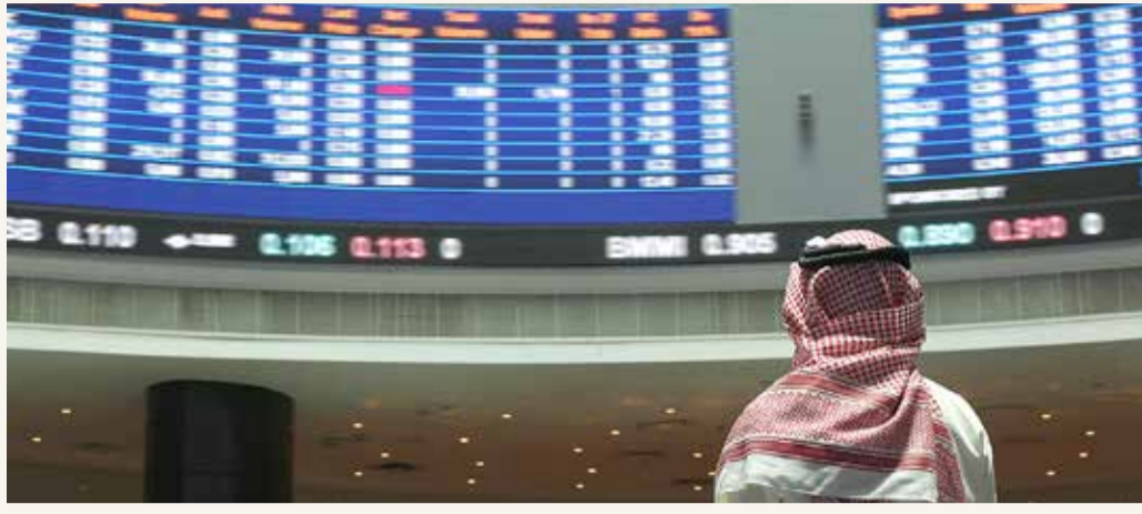
المنامة - بورصة البحرين

بلغت كمية الأسهم المتداولة في "بورصة البحرين" خلال هذا الأسبوع 29 مليون و478 ألف و613 سهم بقيمة إجمالية قدرها 10 ملايين و261 ألف و978 دينار، نفذها الوسطاء لصالح المستثمرين من خلال 442 صفقة. تداول المستثمرون خلال هذا الأسبوع أسهم 28 شركة، ارتفعت أسعار أسهم 7 شركات، في حين انخفضت أسعار أسهم 13 شركة، واحتفظت باقي الشركات بأسعار أفعالها السابق. استحوذ على المركز الأول في تعاملات هذا الأسبوع قطاع الخدمات، حيث بلغت قيمة أسهمه المتداولة 6 ملايين و385 ألف و200 دينار أو ما نسبته 62.22% من إجمالي قيمة الأسهم المتداولة وبكمية قدرها 15 مليون و117 ألف و452 سهم، تم تنفيذها من خلال 167 صفقة. أما المرتبة الثانية فقد كانت من