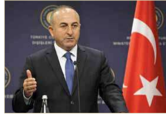
وزير الخارجية التركي مولود تشاوش أوغلو

أننا لم نضع شرطا مسبقا، لكن حين تتوقف العلاقات على مدى سنوات، فليس من السهل العمل كما لو أن شيئا لم يحصل". وكثفت أنقرة في الأسابيع الماضية تصريحات التهدئة حيال مصر. إلى جانب مصر، تسعى أنقرة إلى تهدئة التوتر مع دول مجاورة لها في شرق المتوسط مثل اليونان وإسرائيل، ودول الخليج خصوصا السعودية والإمارات.