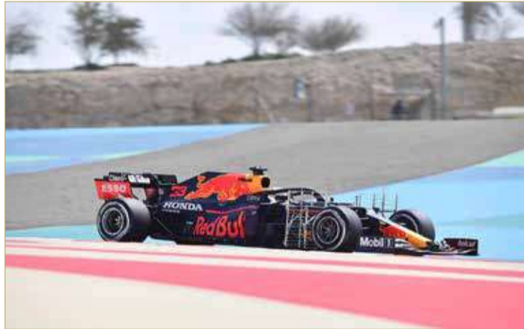
جانب من التجارب الشتوية

دفعته للاكتفاء بـ 15 لفة فقط. وحلّ شوماخر في المركز ما قبل الأخير أمام بوتاس. كما توقفت سيارة شارل لوكلير صاحب المركز الـ 11 على المسار قبل 10 دقائق من الاستراحة مما تسبب في رفع العلم الأحمر الوحيد اليوم.