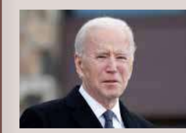
واشنطن. أ ف ب

بدأ الرئيس الأميركي جو بايدن أمس الجمعة هجوما دبلوماسيا على الصين في أول قمة رباعية له مع قادة أستراليا والهند واليابان، التي يجري فيها أيضا بحث تكثيف جهود إنتاج اللقاحات المضادة لكورونا في جنوب شرق آسيا. وهذه أول مرة يجتمع فيها التحالف الرباعي على أعلى مستوى منذ تأسيسه في العقد الماضي، لمواجهة صعود الصين وإحيائه في عهد الرئيس الأميركي السابق دونالد ترامب. وقال بايدن في افتتاح القمة افتراضيا مع رؤساء الوزراء الياباني يوشيهيدي سوغا، والهندي ناريندرا مودي والأسترالي سكوت موريسون، "هذه أول قمة متعددة الأطراف تسنح لي الفرصة لتنظيمها كرئيس". وأضاف أن "الولايات المتحدة مصممة على العمل مع جميع حلفائنا الإقليميين لضمان الاستقرار". ولم يذكر أي من المسؤولين الأربعة الصين بشكل صريح، لكنهم أشاروا إليها بلغة دبلوماسية، إذ أعلن عن نقاشات حول "الأمن البحري" والحفاظ على منطقة المحيطين الهندي والهادئ "حرة ومفتوحة". وقال جو بايدن في إشارة واضحة إلى التهريب الذي يتهم بكين بممارسته في بحر الصين الجنوبي، "نجدد التزامنا ضمان سيادة القانون الدولي في منطقتنا، وإعلاء القيم الكونية بعيدا عن أي إكراه".