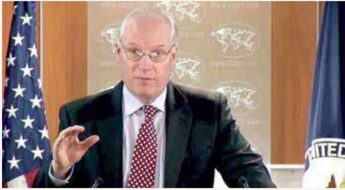
المبعوث الأميركي الخاص إلى اليمن تيموني ليندركينغ

قال المبعوث الأميركي الخاص باليمن تيم لنديركينغ، أمس الجمعة، إن خطة متماسكة لوقف إطلاق النار في اليمن مطروحة الآن على حركة الحوثيين المتحالفة مع إيران، مشيرًا إلى أنه تلقى كل الدعم من التحالف العربي في اليمن، معتبرا أن الدعم السعودي أمر مهم وأساس لمهمتنا في اليمن. وأضاف ليندركينغ أن حركة الحوثي تعطي أولوية للهجوم العسكري لانتزاع السيطرة على مأرب، محذرا من أنه دون إحراز تقدم في وقف إطلاق النار، "سيدخل اليمن في صراع وانعدام استقرار أكبر". وأضاف ليندركينغ أن الولايات المتحدة استأنفت تمويل المساعدات الإنسانية لشمال اليمن. ولفت إلى أن قيادة السعودية تقدم الدعم الكامل لجهود واشنطن الرامية لإنهاء النزاع. ودعا المبعوث الأميركي الخاص إلى اليمن تيموني ليندركينغ، ميليشيات