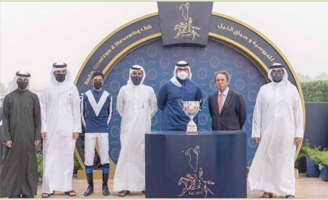
سمو الشيخ عيسى بن سلمان خلال التتويج