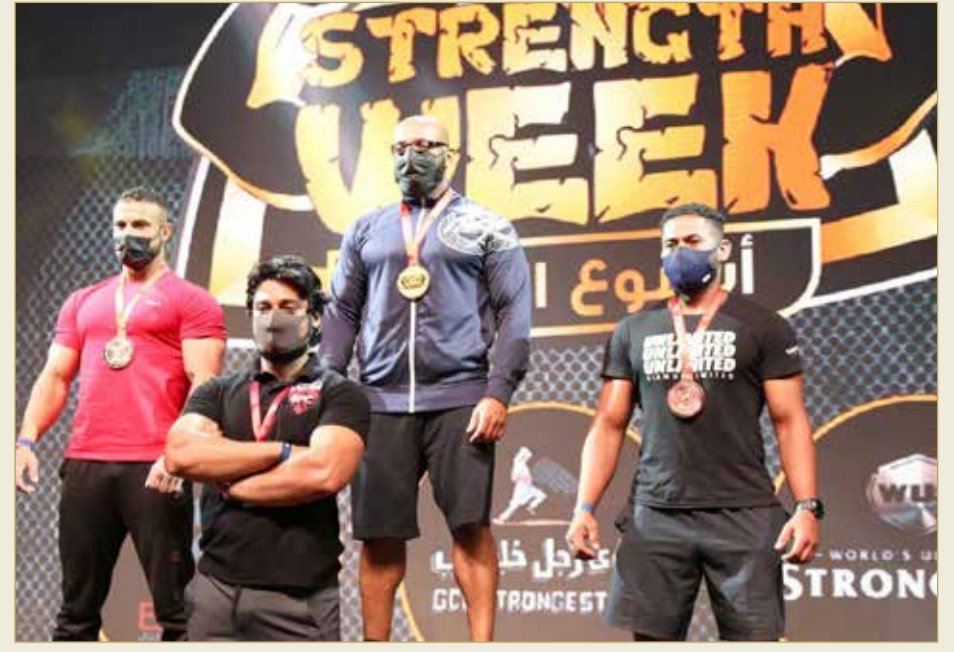
لقطات من التتويج