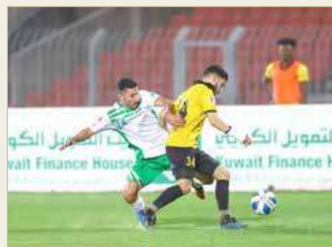
من مباراة الأهلي والبديع