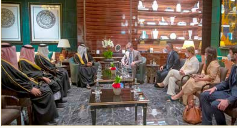
سمو الشيخ ناصر بن حمد مستقبلاً الرئيس الصربي