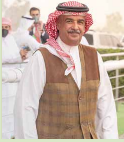
سمو الشيخ محمد بن عيسى