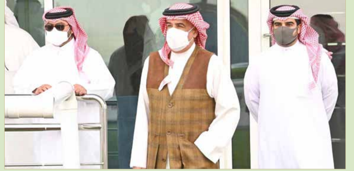
سمو الشيخ محمد بن عيسى خلال حضوره سباق الأوس