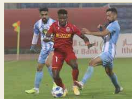
من مباراة المحرق والرفاع