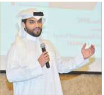
الغريبي متحدان بإحدى الفعاليات

بجامعة البحرين؛ لرغبتى الجادة في التخصص والارتقاء بالمرجعات العلمية في مجال القانون لحاجة المملكة لذلك. ويضيف "بعد ما يقارب 10 سنوات في مجال العمل الطلابي والتطوعي والشبابي، وما شهدته تلك المرحلة من تجارب ساهمت في تطوير