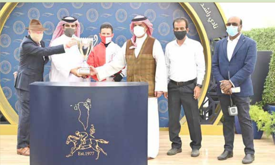
سمو الشيخ محمد بن عيسى يتوج الفائزين