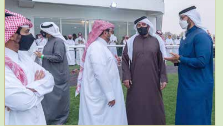
سمو الشيخ خالد بن حمد وسمو الشيخ عيسى بن سلمان