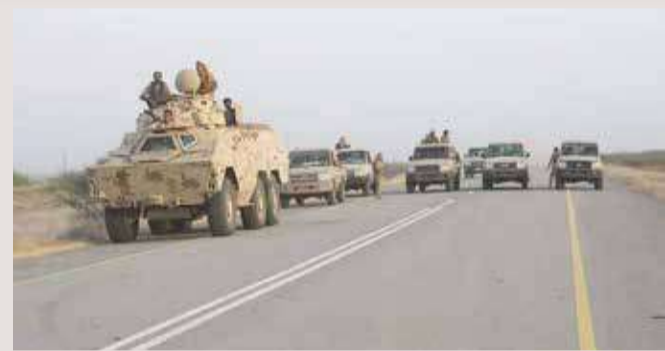
الليات عسكرية تابعة للجيش اليمني في حجة

« دبي - العربية نت : أطلقت قوات الجيش اليمني، أمس الجمعة، عملية عسكرية مفاجئة ضد ميليشيات الحوثي الانقلابية في محافظة حجة، شمال غربي البلاد، حررت خلالها عدداً من المناطق. وتمكنت قوات الجيش اليمني، في المنطقة العسكرية الخامسة، في عملية هجومية مباغتة، من تحرير عدد من القرى في مديرية عيس غرب محافظة حجة. وتدور معارك حامية للسيطرة على الخط الدولي الرابط بين حجة والحديدة في اليمن. وأن قوات الجيش وصلت إلى سوق البزاح في مديرية عيس بمحافظة حجة، وقامت بتطويقه، وقال العميد الركن عبده مجلي، المتحدث باسم القوات المسلحة اليمنية، من