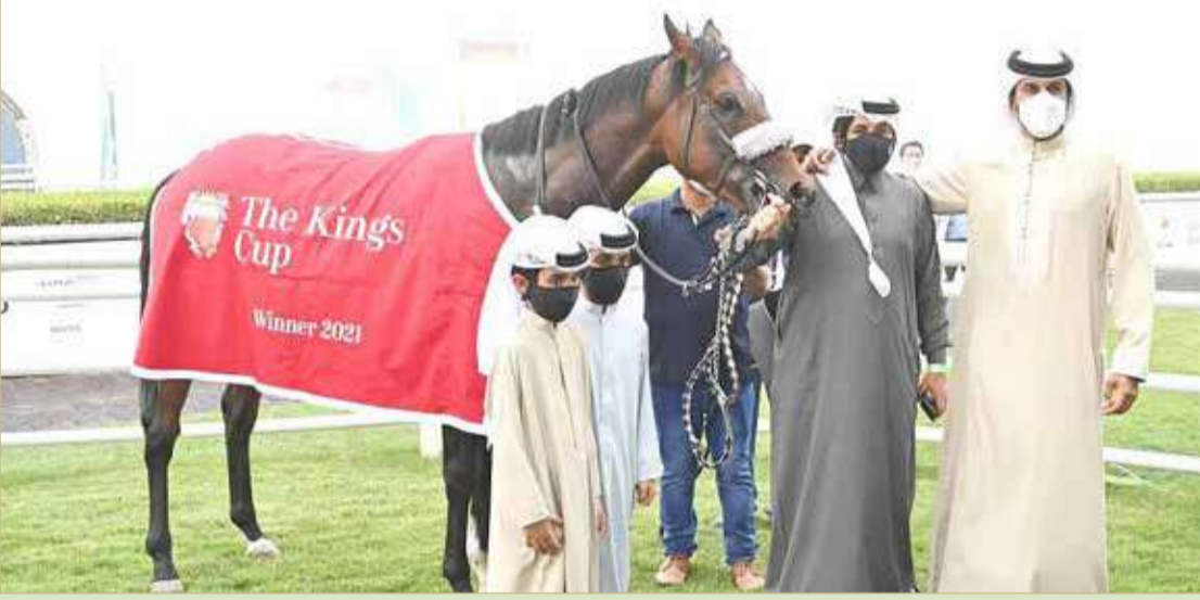
سمو الشيخ ناصر بن حمد مع أحد الجياد الفائزة

مفاجأة قوية تخطف أعلى الكؤوس و"غلن فورس" بطلا جديدا