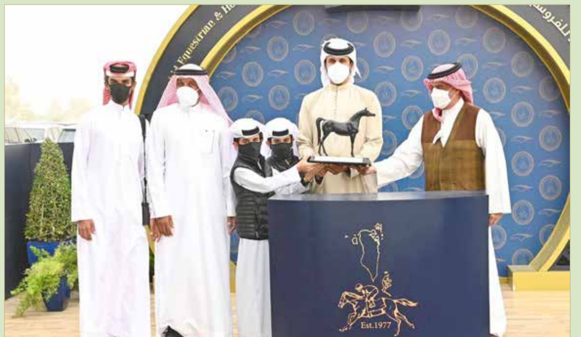
سمو الشيخ محمد بن عيسى يتوج سمو الشيخ ناصر بن حمد