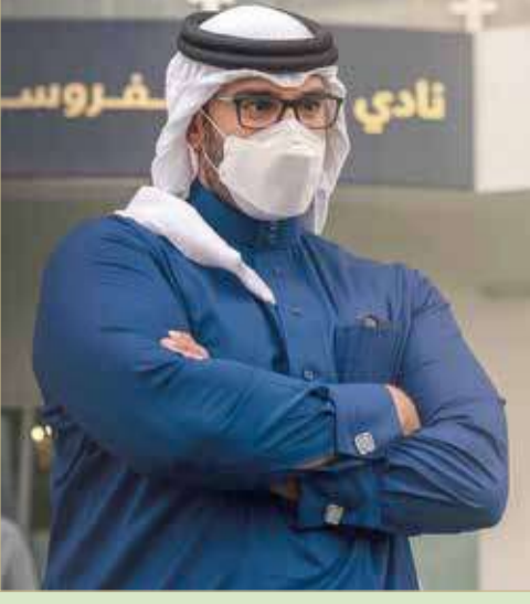
سمو الشيخ عيسى بن سلمان