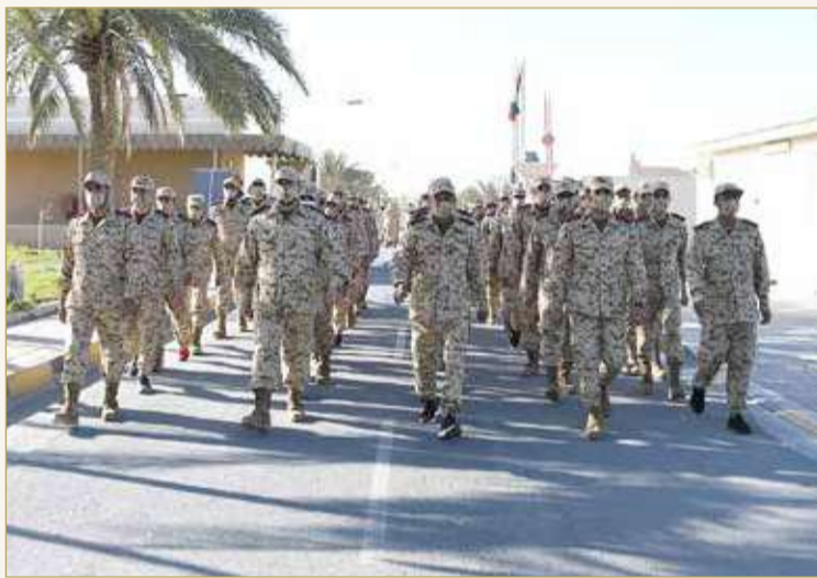
البلاد | إبراهيم النهام

جرى بقوة دفاع البحرين، وذلك في كل من الاتحاد الرياضي العسكري بحضور قائد وحدة القوة الاحتياطية الملكية اللواء الركن منير السبيعي، والدفاع الجوي الملكي بحضور مساعد رئيس هيئة الأركان للقوى البشرية اللواء الركن الشيخ علي بن راشد آل خليفة، وسلاح البحرية الملكي البحريني بحضور قائد سلاح البحرية الملكي البحريني اللواء الركن بحري محمد