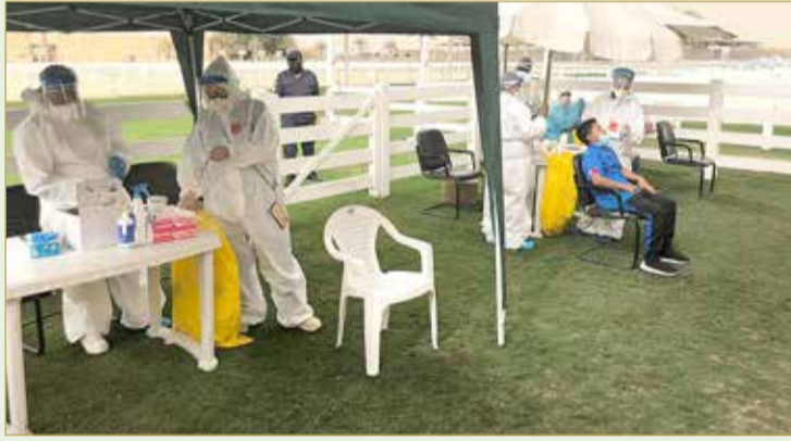
تطبيق الإجراءات الاحترازية

وحرس الاتحاد الملكي للفروسية وسباقات القدرة على تنفيذ التوجيهات الصادرة من الجهات المختصة لمكافحة فيروس كورونا "كوفيد-19"، حيث أجرى الاتحاد فحوصات للفيروس لكافة المشاركين في السباق من فرسان وحكام ولجان طبية وإعلامية وإدارية، إضافة إلى كافة كوادرات الإسطبلات المشاركين في سباق كأس سمو الشيخ ناصر بن حمد آل خليفة للقدرة.