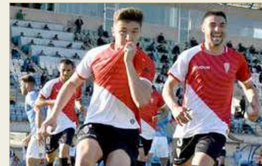
لقطة لفريق قرطبة

أشاد بفوز الفريق على إيجيدو 2012 في منافسات الدرجة الثانية