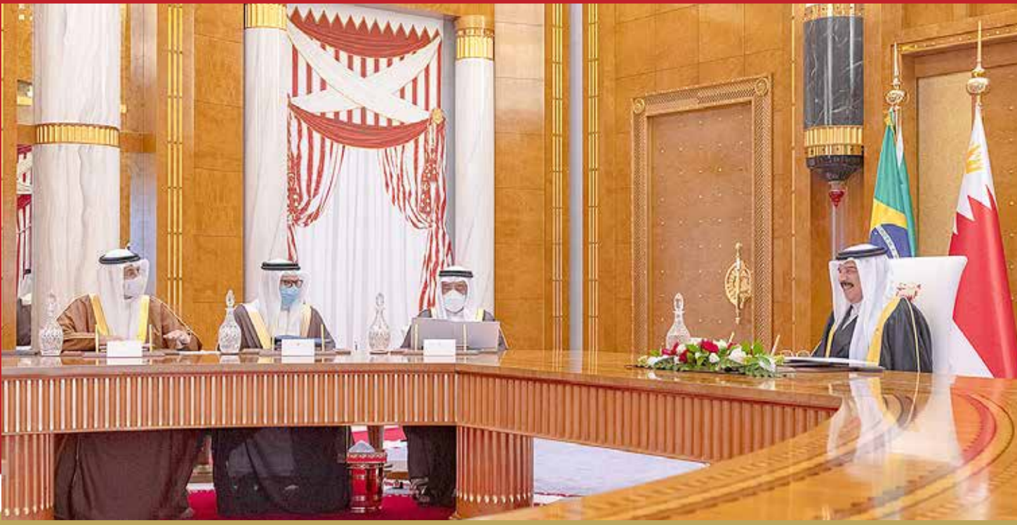
جلالة الملك يعقد اجتماعاً مع رئيس جمهورية البرازيل الاتحادية عن بعد