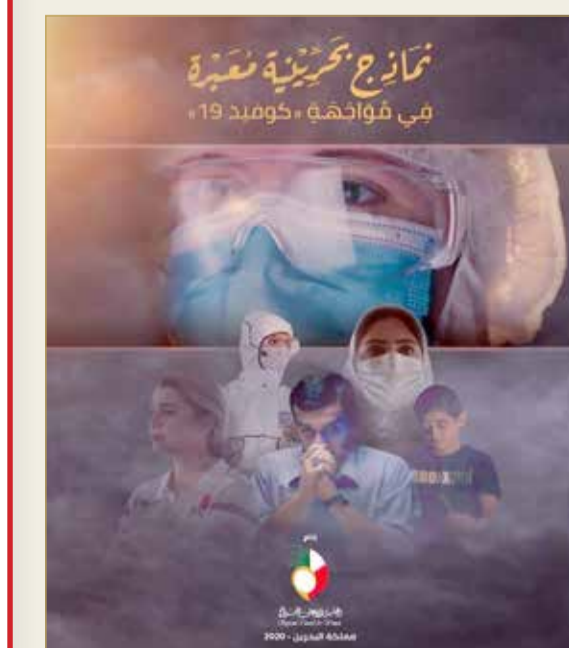
فيلم نماذج بحرينية معبرة في مواجهة كوفيد 19 يتصدر أسبوع فيلم المرأة بالأردن

الإنتاج الصادر من المجلس الأعلى للمرأة، المشاركة العربية الوحيدة ضمن “أسبوع فيلم المرأة” إلى جوار دول أخرى تقدمت بأفلام تعالج قضايا خاصة بالمرأة، كأوكرانيا التي تقدمت بفيلم “خرجت من الظل”، وإسبانيا عبر فيلم “ماتاهاريس”، وهولندا “بين ملكة النحل”، إضافة إلى أفلام مشتركة بين عدة دول أجنبية، فيما جرى اختتام العروض بالفيلم الكندي “الفراشة نادية”. وبين منظمو أسبوع فيلم المرأة إلى أول أفلام الأسبوع من حيث العرض على الجمهور وذلك لالتزامه بمعايير المشاركة وأهمها الجهود الهائلة التي تبذلها النساء والفتيات حول العالم في تشكيل مستقبل أكثر مساواة والشفاء من جائحة كوفيد 19.