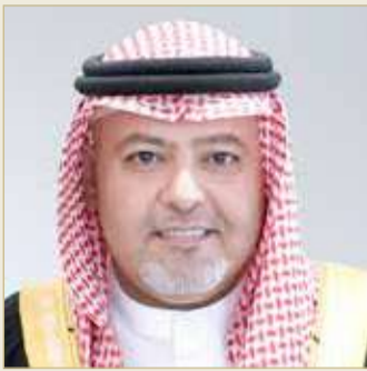
الشيخ خالد بن علي

وقال وزير العدل إن الخطط الاحترازية والوقائية التي اتخذتها حكومة خادم الحرمين الشريفين في مرحلة مبكرة من ظهور الجائحة، والتي أسهمت في تحقيق هذا النجاح الكبير في تنظيم استقبال ضيوف الرحمن وتمكينهم من أداء مناسك العمرة، مع تسخير الإمكانيات وتوفير العناية والرعاية الصحية وفقاً للمستجدات