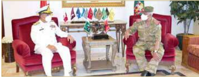
الصخبر- الحرس الوطني

الصديقة والوفد المرافق له، مشيدا بالمستوى العالي الذي وصلت إليه آفاق التعاون وتبادل الخبرات بين الجانبين، مؤكدا مواصلة الجهود نحو تعزيز تلك العلاقات الثنائية بما يصب في صالح البلدين الصديقين. كما شهد اللقاء مناقشة عدد من المواضيع ذات الاهتمام المشترك، وبحث سبل تطوير مستويات التعاون والتنسيق العسكري بين الحرس الوطني والقوات البحرية بجمهورية باكستان الإسلامية الصديقة.