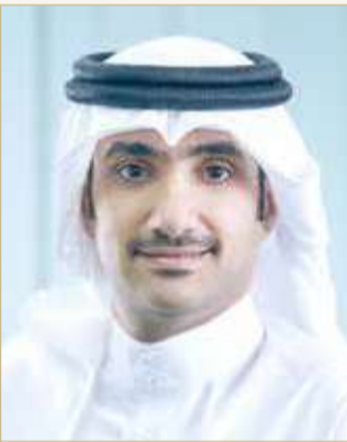
الشيخ عبدالله بن خليفة آل خليفة

نجاح الاستحواذ على Muscat Capital ومقرها السعودية