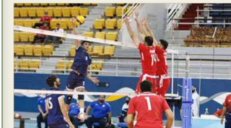
المحرق هزم النجمة بجدارة