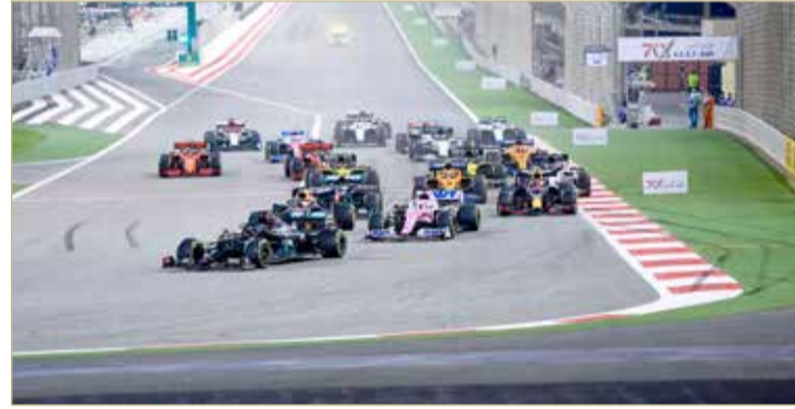
جانب من السباق

كل هذا يضيف إلى مجموعة واسعة من الفعاليات الترفيهية المنوعة التي تستضيفها حلبة البحرين الدولية سنويا، جميع هذه الفعاليات الترفيهية سيتم