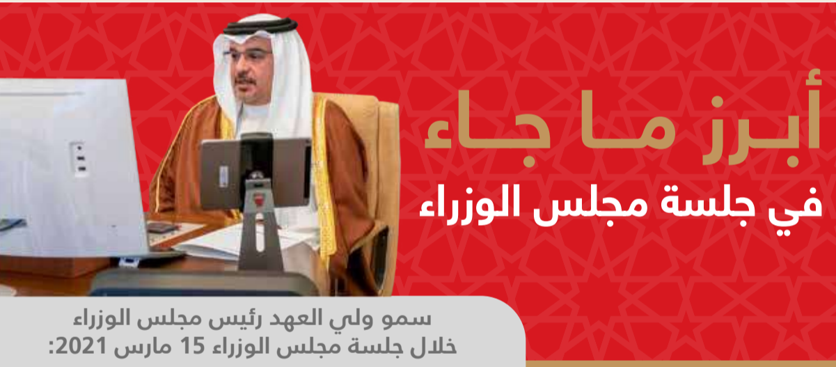
سمو ولي العهد رئيس مجلس الوزراء خلال جلسة مجلس الوزراء 15 مارس 2021: