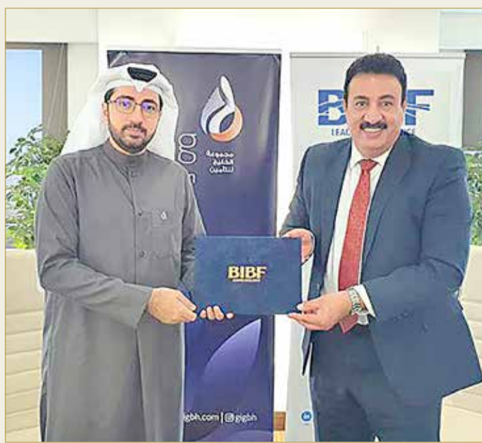
عقب توقيع الشراكة بين الجانبين