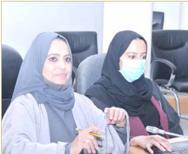
ممثلو قسم تراخيص البناء ببلدية المحرق أثناء حضورهم اجتماع المجلس البلدي

توزيع حصص متساوية بين البلديات، من جانب آخر، طالب المجلس بتعديل آلية تصديق المكاتب الهندسية بنظام بنيات، من خلال إعادة النظر في دور اللجنة المركزية للتصديق على التراخيص. ولفت رئيس مجلس بلدي المحرق غازي المرابطي إلى أن نظام بنيات تأسس من أجل زيادة سرعة التراخيص، إلا أن منح اللجنة فترة شهراً للتصديق على التراخيص أدى إلى تأخر مصالح الناس، وظهور مشكلات نتيجة اتجاه البعض للبدء في البناء فعلياً قبل التصديق على الرخص.