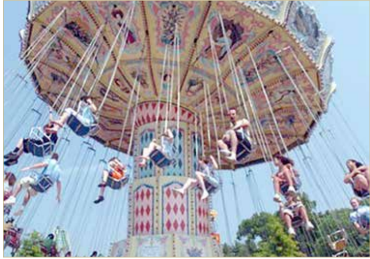
جانب من الفعاليات الترفيهية

التطبيق الشامل للإجراءات الاحترازية والتدابير الوقائية في الحلبة؛ لضمان استمتاع الجماهير بأجواء الإثارة في سباق الفورمولا 1 وسط بيئة آمنة.