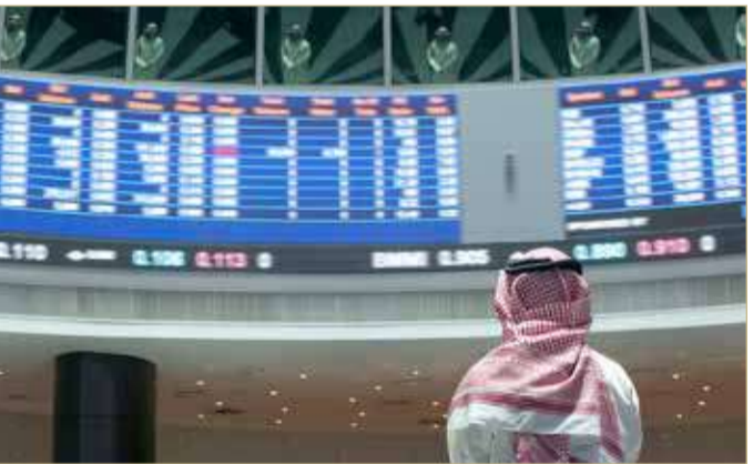
المنامة - بورصة البحرين

من المصرف المركزي بالنيابة عن حكومة البحرين