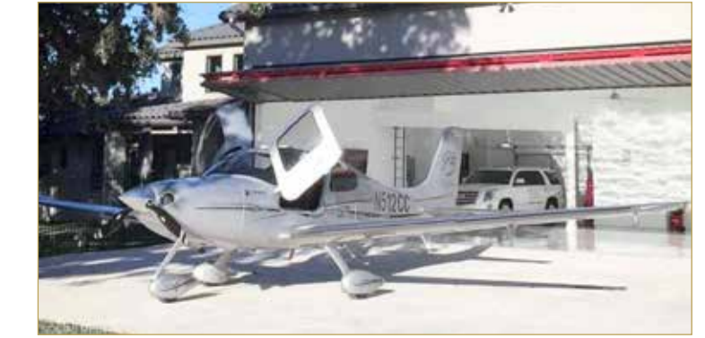
ووفق ما ذكر موقع “إنديا تايمز”، فإنه لا وجود لمنزل شاعرة في هذه المنطقة السكنية التي تشهد إقبالا كبيرا من مالكي الطائرات الصغيرة.

تشهد المناطق السكنية المخصصة لمالكي الطائرات الصغيرة، والتي تعرف باسم “إير باركس”، في أميركا زيادة كبيرة. ويحتضن العالم 650 منطقة سكنية مخصصة لمالكي الطائرات الخفيفة، في حين تعد “كاميرون إير بارك”، الواقعة في ولاية كاليفورنيا الأميركية، واحدة من أجمل تلك المناطق. وتتوافر مساكن للبيع في تلك المنطقة مقابل 1.5 مليون دولار، إذ سيكون بمقدور المقيمين هناك، استعمال طائراتهم الخاصة كبديل عن السيارات. وتحتوي المساكن على حظائر خاصة بالطائرات الصغيرة يصل عرض الواحدة منها إلى 30 مترا، بينما تتميز الشوارع في المنطقة بكونها واسعة لتتيح مرور الطائرات عليها بسهولة، دون أن تتصادم أجنحتها. وتضم المنطقة أيضا، مدرجا مشتركا لإقلاع وهبوط الطائرات، يمكن لجميع القاطنين في المجمع السكني استخدامه.