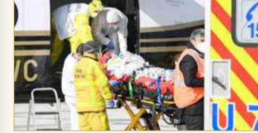
الدول الأوروبية تسجل ارتفاعا في الإصابات بكورونا

في باريس إلى العناية المركزة، وفق ما ذكرت صحيفة “ذا غارديان” البريطانية. واستجابة لهذا الارتفاع، فرض الرئيس الفرنسي إيمانويل ماكرون، حظر تجول وقيودا اجتماعية أخرى في عدة مناطق، كما أنه يواجه ضغوطا لفرض إغلاق وطني على وجه السرعة. وفي ألمانيا، تم الإبلاغ عن 12674 إصابة جديدة بكوفيد-19 يوم السبت، بزيادة 3117 عن الأسبوع السابق. وأقر رئيس وكالة الأمراض المعدية في ألمانيا، بأن البلاد “في قبضة موجة ثالثة من كوفيد-19”.