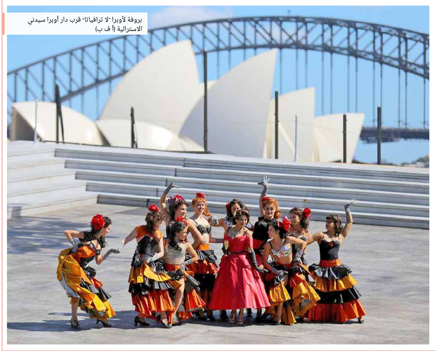
بروفة لأوبرا “لا ترافياتا” قرب دار أوبرا سيديني الاسترالية

إدارة التحرير: +973 17111444 / +973 17111467 / 385 @local@albiladpress.com / 2008 / تصدر عن دار البلاد للصحافة والنشر والتوزيع / س.ت 67133 / تطبع في مؤسسة الأبرام للنشر / قسم الإعلانات: 508 / +973 17111501 / 39615645 / 32224492 / +973 17580939 / الاشتراكات والتوزيع: +973 17111432 / +973 17111434