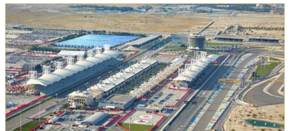
البدء في المرحلة الأولى من المشروع هذا الصيف (11)