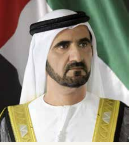
سمو الشيخ محمد بن راشد