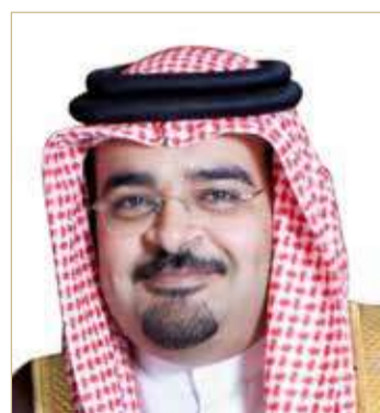
الشيخ حمد بن محمد آل خليفة

صياغة ملامح ومبادرات الخطة الوطنية للقطاع العقاري للأعوام الأربع القادمة، والتي من شأنها أن تنقل هذا القطاع الحيوي وأحد المساهمين الأبرز في الاقتصاد الوطني إلى آفاق أرحب من النمو والازدهار. وأكد الشيخ حمد دعم ومساندة شركة نسيج للخطة الوطنية للقطاع العقاري وما تبنته مؤسسة