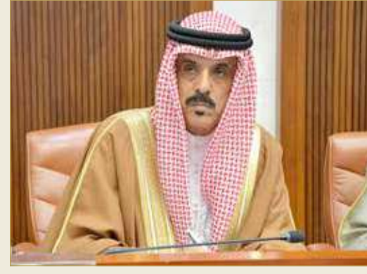
وزير التربية والتعليم

الدراسية، حيث أدرجت عددا من المناهج الدراسية لخدمة هذا الجانب، ومنها مناهج العلوم والتربية الزراعية، وتهدف المناهج الدراسية إلى توعية الطالب وتعريفه بأساسيات الزراعة والمحافظة على البيئة المدرسية والوسائل الحديثة في المجال الزراعي، إضافة إلى تضمين المجال الزراعي في أنشطة الوزارة وبرامجها، إذ تقوم الوزارة بتطبيق مشاريع مختلفة في هذا المجال وإشراك الطلبة فيها، وتسعى لنشر هذه المشاريع، بهدف زيادة الوعي في المجال