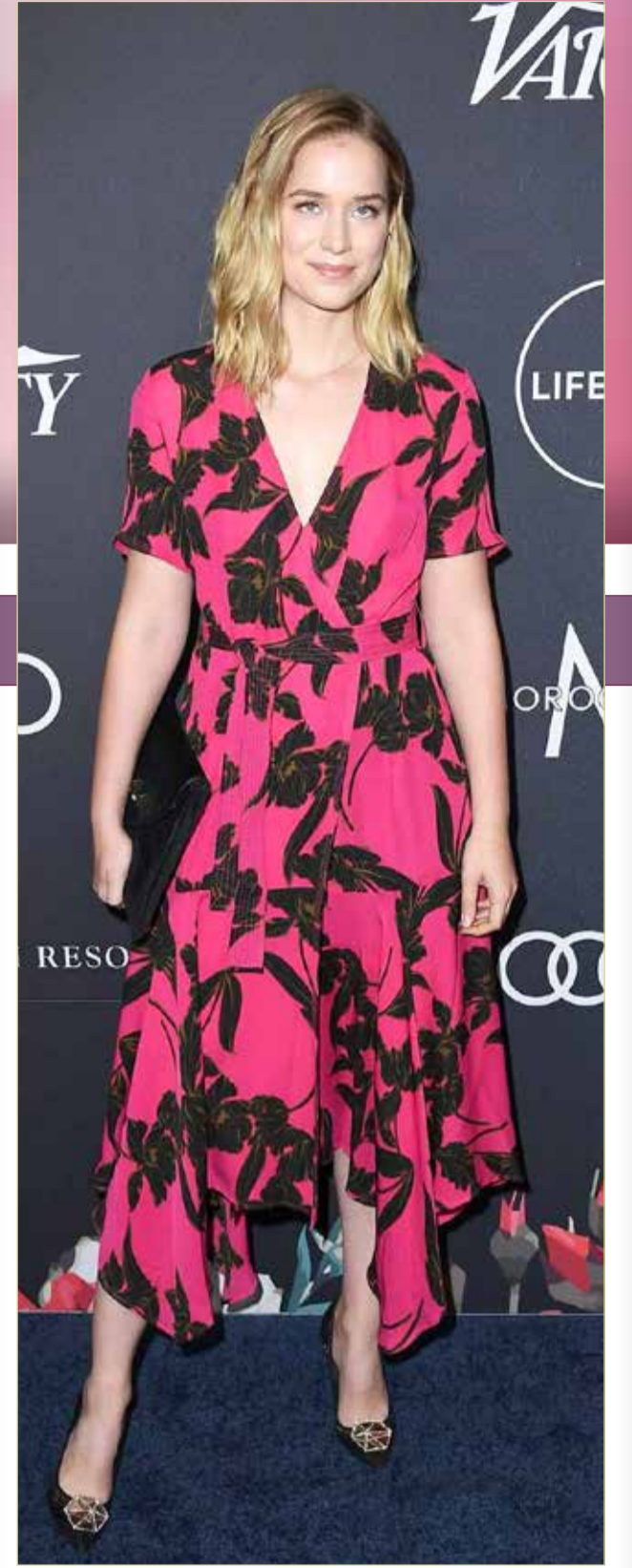
« اقتربت نجمة هوليوود إليزابيث ليل من انتهاء تصوير الموسم الجديد من سلسلة القاتل المتسلسل الشهيرة "YOU"، في لوس أنجلوس، والتي تعرض على منصة نتفليكس. ويشارك ليل في بطولة المسلسل باقة من الميع النجوم، هم: بن بادجلي، أمير تشايلدرز، لوكا بادوفان، زاك شيري، نيكول كانغ، تشارلي بارنيت، أدوين براون، كريس ديليا، جينا أورتيجا، فيكتوريا بيدريتي وماريل سكوت.

فيما انتهت من تصوير مشاهدتها في مسلسل "الوصية الغائبة"، تشغل الفنانة زهرة عرفات هذه الأيام بمسلسل "يجيب الله مطر" على أن تنتهي من تصويره، لتدخل "مفتاح صول"، وهو عمل درامي جديد من تأليف الكاتبة سحاب. وأوضحت عرفات أن جميع الأعمال السالف ذكرها ستعرض في شهر رمضان المبارك، كاشفة عن إطلالتها من خلال تلك الأعمال في 3 شخصيات مختلفة، شكلاً ومضموناً. وعن "الوصية الغائبة"، علقت بالقول "أجسد دور (أم عبدالله) وهي امرأة تتصف بالطيبة، قبل أن تعصف بها ظروف الحياة على نحو غير متوقع، فتتجرع في تيارات عديدة". وأكدت: "العمل تراثي وتاريخي، وأنا بالأساس أحب هذه الأجواء التي تحاكي ماضينا الجميل، حيث تقع الأحداث بين خمسينات وستينات القرن الماضي، إذ قام الكاتب مشاري العميري بنسج تفاصيلها بدقة بالغة، وتولى حسين أبل مهمة الإخراج، في حين شاركت في