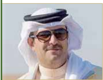
الشيخ دعيج بن سلمان

أكد الشيخ دعيج بن سلمان آل خليفة رئيس مجلس إدارة هيئة رعاية شؤون الخيل أن الاهتمام الكبير من قبل صاحب السمو الشيخ محمد بن راشد آل مكتوم بسباق كأس دبي العالمي منحه من احتلال موقفاً ريادياً عالمياً في سباق الخيل، مشيراً إلى أن سباق دبي العالمي بات الموقع الأفضل والمناسب للتنافس بين الملوك والفرسان والجياد باعتباره من بين أقوى السباقات العالمية ويحظى بمتابعة واسعة من قبل محبي رياضة الخيل ووسائل الإعلام المختلفة.