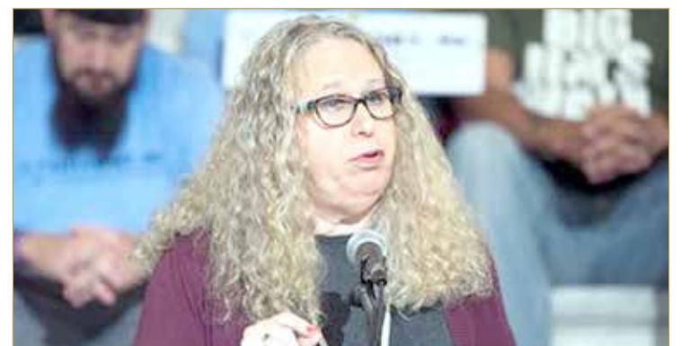
وقال مات هيل مسؤول الاتصالات في البيت الأبيض في تغريدة على تويتر إن "الدكتورة ليفين أصبحت أول أمريكي متحوّل جنسياً علانية يصادق مجلس الشيوخ على تعيينه، وهذه لحظة تحوّل في تاريخ الولايات المتحدة".

صادق مجلس الشيوخ الأمريكي بأغلبية ضئيلة على تعيين ريتشيل ليفين، طبيبة الأطفال المتحوّلة جنسياً، نائبة لوزير الصحة، لتصبح بذلك أول شخص يجاهر بأنه متحوّل جنسياً يتولّى مثل هذا المنصب الحكومي الرفيع، في حدث اعتبره البيت الأبيض "تاريخياً". ووافق المجلس على تعيين ليفين