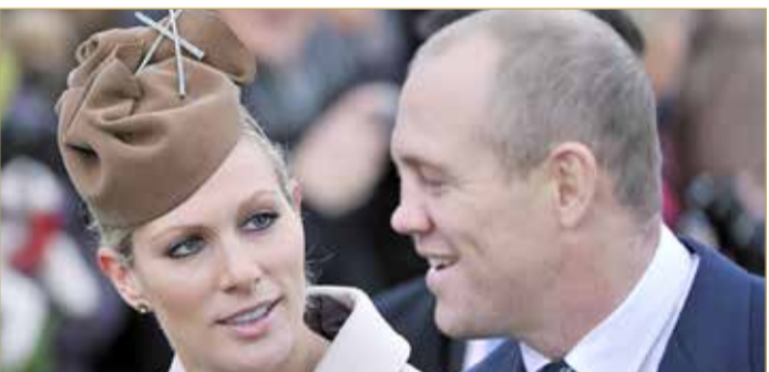
زارا وزوجها مايك تيندال

رزقت ملكة بريطانيا، إليزابيث الثانية بحفيد جديد، بعد أن أنجبت حفيدتها الكبرى زارا تيندال، في منزلها إذ لم تتمكن من الذهاب للمستشفى، مساء الأحد الماضي. ولم تتمكن الأميرة زارا تيندال، ابنة الأميرة آن، حفيدة الملكة إليزابيث، من الوصول للمستشفى، بل وضعت مولودها في الحمام، حسبما أفادت شبكة "سي إن إن". وولد الطفل الصغير على أرضية الحمام بالمنزل في غلوسسترشاير، جنوب غرب إنجلترا، في حوالي الساعة السادسة مساء.