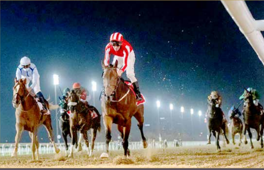
سولت ذا سولجر