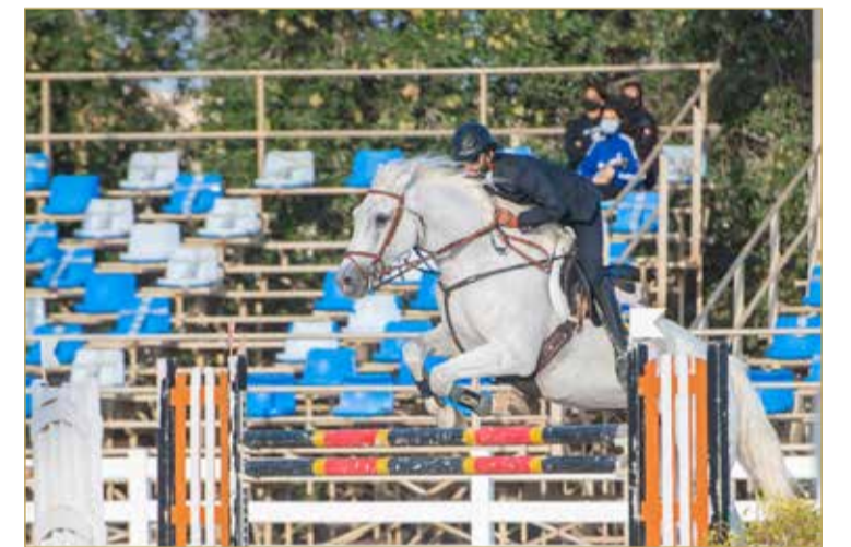
من منافسات قفز الحواجز

وتحت رعاية ممثل جلالة الملك للأعمال الإنسانية وشؤون الشباب الرئيس الفخري للاتحاد الملكي للفروسية وسباقات القدرة سمو الشيخ ناصر بن حمد آل خليفة، تقام اليوم منافسات بطولة سموه لقفز الحواجز على ميدان الاتحاد الرياضي العسكري بالرفه، إذ ينتظر أن تشهد البطولة العاشرة وقبل الأخيرة لهذا الموسم أقوى المنافسات وأكثرها إثارة وتشويق بناء على ما شهدته مسابقات وبطولات الموسم الحالي وتأهب فرسان وفارسات البحرين لهذه البطولة القوية والغالية على قلوب الجميع.