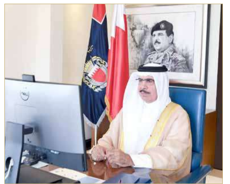
وزير الداخلية ترأس وفد مملكة البحرين في اجتماع مجلس وزراء الداخلية العرب

ترأس وزير الداخلية الشيخ راشد بن عبدالله آل خليفة، وفد مملكة البحرين في اجتماع الدورة الثامنة والثلاثين لمجلس وزراء الداخلية العرب، الذي عقد أمس عبر تقنية الاتصال المرئي، وافتتحه وزير الداخلية بالمملكة العربية السعودية الشقيقة، الرئيس الفخري لمجلس وزراء الداخلية العرب صاحب السمو الملكي الأمير عبدالعزيز بن سعود بن نايف آل سعود. وأكد وزير الداخلية، في تصريح له، أن وضع الأمن العربي، يتطلب استمرار وتعزيز التعاون والتنسيق في إطار العمل العربي المشترك، خصوصاً في ظل هذه الظروف الاستثنائية التي فرضتها جائحة كورونا، والتي تتطلب العمل المشترك وبأساليب مبتكرة لمواجهة التحديات الأمنية المتزايدة، انطلاقاً مما يجمعنا من وحدة الموقف والمصير. وأضاف أن الظروف وما يصاحبها من جهود أمنية مبذولة، تزيد من أهمية العمل بشكل تكاملي وتنسيقي، فيما يتعلق بتبادل الخبرات والتجارب العربية المتميزة، ووضع قائمة بالدروس المستفادة من إدارة الكارثة، التي ما زالت تضرب العالم وجمع هذه التجارب العربية في إطار من تبادل الخبرات، وتعميمه على الدول الأعضاء للاستفادة منه. وأشار إلى أن الجهود والتحديات، فرضت قواعد حاكمة في مجال تعزيز الأمن السيبراني والمضي بخطوات متقدمة في التوسع باستخدام تطبيقات الذكاء الاصطناعي، وأمنياً وخدمياً. (03)