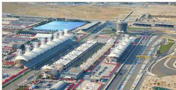
الحلبة ستستخدم الطاقة الشمسية

ستسهم في جعل حلبة البحرين الدولية مثالاً يُحتذى به، باتخاذها هذه الخطوة نحو الطاقة المستدامة وكإلهام للجميع على تبني ذلك التغيير. ومن جانبه، أكد ستيفانو دومينيكالي الرئيس التنفيذي للفورمولا 1 "نحن فخورون بالجهود التي تبذلها حلبة البحرين الدولية وخططهم التي يقومون بها لاستضافة السباقات في بيئة أكثر استدامة، وهذا مثال رائع آخر على الخطوات التي تتخذها مملكة البحرين لاستخدام التكنولوجيا والابتكار لتعزيز خطط الاستدامة، كما أن هذه المبادرة تتماشى تماماً مع استراتيجيتنا بتصغير نسب انبعاثات الكربون بحلول العام 2030 ولتحسين استدامتنا داخل المضمار وخارجه". لمزيد من المعلومات عن حلبة البحرين الدولية يمكنكم زيارة الموقع الرسمي www.bahraingp.com أو الاتصال على الخط الساخن 17450000.