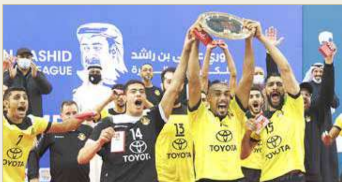
الأهلي بطل دوري عيسى بن راشد