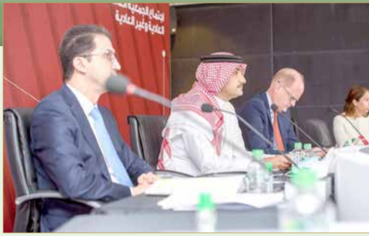
اجتماع “عمومية بتلكو” أمس

وأضاف “حرصت بتلكو على التكيف السريع مع الظروف الاستثنائية التي شهدناها في العام 2020، حتى تتمكن من تحقيق الأهداف الاستراتيجية، والتي تركز على الإدارة الدقيقة للمصاريف وهو ما نجم عنه انخفاض المصروفات التشغيلية بنسبة 10% على أساس سنوي، وساهم في زيادة صافي الأرباح بنسبة 10% مقارنة بعام 2019. كما انعكست هذه الجهود المبذولة على مدى تحسن كل من: الأرباح التشغيلية والأرباح قبل تكاليف التمويل والضرائب والاستهلاك والاستقطاعات (EBITDA) والتي زادت بنسبة 7% و9% لكل