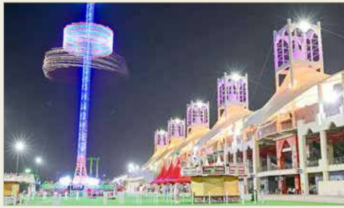
الحلبة جاهزة للانطلاق