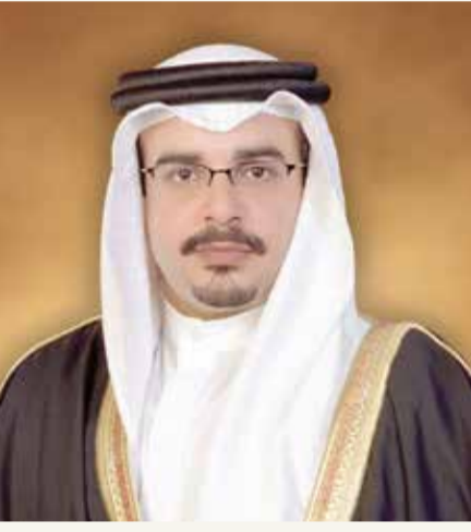
سمو ولي العهد رئيس الوزراء

ويسكنه فسيح جناته، وأن يلهم أهله وذويه وأسرة آل مكتوم الكرام جميل الصبر والسلوان، وأشاد سموه بمناقب الفقيد الراحل في تحقيق النماء والازدهار لدولة الإمارات العربية المتحدة وشعبها طوال مسيرته الحافلة بالعباء. من جانبه، عبر صاحب السمو الشيخ محمد بن راشد آل مكتوم عن بالغ شكره وتقديره لأخيه صاحب السمو الملكي ولي العهد رئيس مجلس الوزراء على تعازي ومواساة سموه وما أبداه من مشاعر طيبة ودعوات صادقة، ضارعاً إلى المولى عز وجل أن يحفظ سموه ويمتعه بدوام الصحة وموفقور العافية.