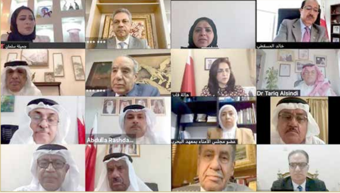
جانب من المشاركين في منتدى "البلاد"

الفاضل: لمخاطبة "السوشل ميديا" بلغتهم.. وليكن المحتوى متعددًا لكل منصة