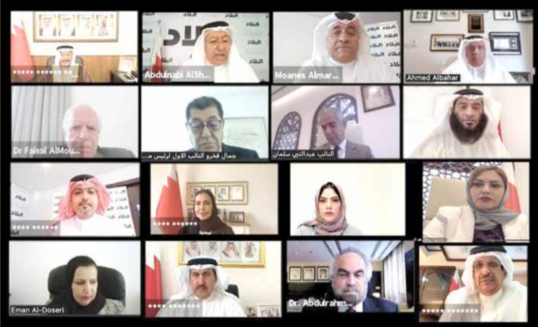
جانب من المشاركين في منتدى صحيفة "البلاد"

الشعلة: كان مجلس سمو الأمير خليفة بن سلمان طيب الله ثراه صورة مصغرة للمجتمع البحريني