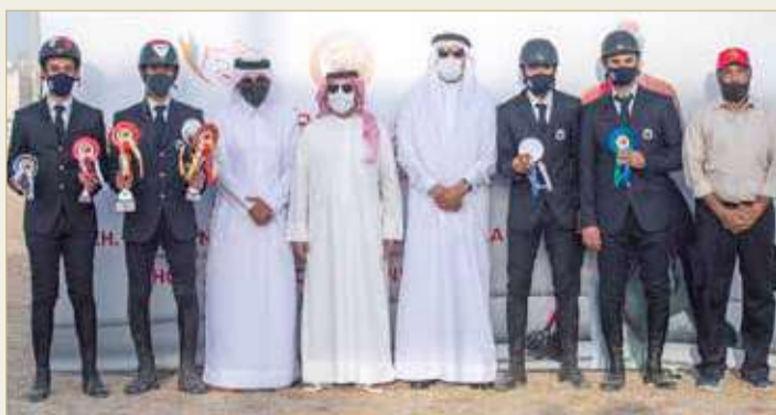
فريق وزارة الداخلية وتلق كبير في بطولة سمو الشيخ ناصر بن حمد للقفز

المسابقة ليأتي سادساً فيها. وتوج الشيخ عبدالله بن محمد آل خليفة نائب رئيس لجنة قفز الحواجز وعبدالعزيز الريمحي وتوفيق الصالحي مدير المكتب الاعلامي ومركز المعلومات لسمو الشيخ ناصر بن حمد آل خليفة الفائزين بالمراكز الأولى لمسابقات الكبار، وأثنى عبدالله بن محمد على المستويات الفنية الراقية التي قدمها الفرسان في مسابقات البطولة، مهتماً بالفائزين بالمراكز الأولى وتمنياً للجميع التوفيق المسابقات القادمة، وأشاد بجهود العاملين باللجان المختلفة الذين يبذلون قصارى جهدهم لظهور البطولة بالصورة اللائقة وتحقيق النجاح فيها على جميع المستويات.