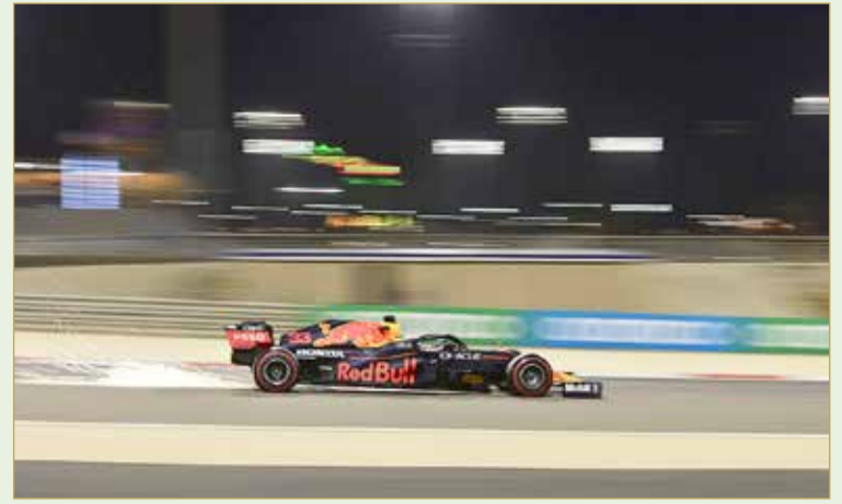
من التجارب التأهيلية