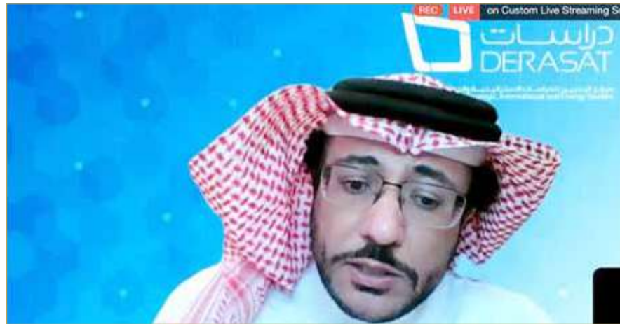
المدير التنفيذي لمركز “دراسات”

وواصل “إنفاذا لما تضمنه ميثاق العمل الوطني الذي عد خارطة طريق لمرحلة جديدة في تاريخ مملكة البحرين، أصدر حضرة صاحب الجلالة عاهل البلاد المفدى حفظه الله ورعاه المرسوم رقم (5) للعام 2001م بتشكيل لجنة تعديل بعض أحكام الدستور.” وزاد “كما وأصدر جلالتنا دستور مملكة البحرين المعدل في 14 فبراير العام 2002م، الذي يضيء دساتير نظيراتها في الدول ذات التجارب الديمقراطية العريقة وتأخذ في اعتبارها خصوصية مملكة البحرين من ناحية، ومتطلبات وتطلعات أبناء المجتمع البحريني من ناحية أخرى، عبر عنها ميثاق العمل الوطني.” وعلق بالقول “فيما شمل الدستور العمل على نظام المجلسين، مجلس النواب المكون من أربعين عضوا ومجلس الشورى المكون من أربعين عضوا. بالإضافة إلى انتخاب أعضاء المجالس البلدية. وقد انطلقت الانتخابات البلدية في مايو 2002م،