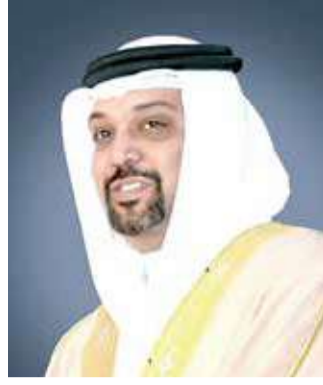
الشيخ سلمان بن خليفة

التعاون الخليجي من القيمة المضافة والإيرادات الجمركية والتي يتم تنفيذها لصالح الجهات الحكومية بملكة البحرين تطبيقاً لأحكام الاتفاقيات المبرمة بشأن تمويل تلك المشروعات التنموية ووفقاً لأحكام القانون.