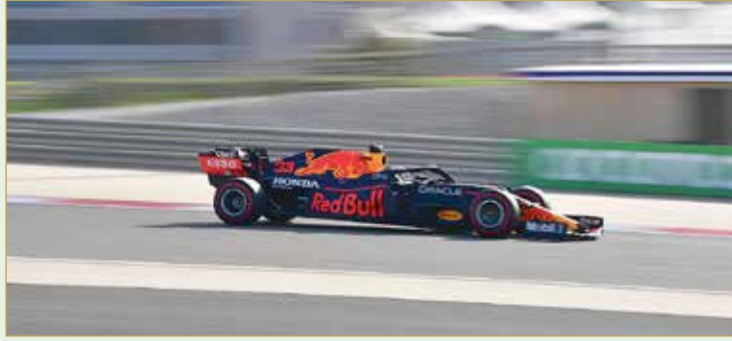
من التجارب الحرة