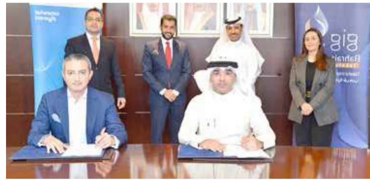
أثناء توقيع الشراكة بين الطرفين

أطلقت شركة التكافل الدولية تغطيتها التأمينية للتكافل الصحي للأفراد (عافية) والتي تتضمن عددا من الباقات المختلفة بتغطيات صحية متنوعة تتيح الاستفادة من خدمات الرعاية الصحية لشبكة واسعة من المستشفيات، والمرافق الطبية، والعيادات التخصصية في البحرين الممتدة في جميع دول العالم. تشمل التغطية التأمينية جميع الفئات العمرية حتى سن 75 عاما. وصرح الرئيس التنفيذي لشركة التكافل الدولية، عصام الأنصاري، بأن "شركة