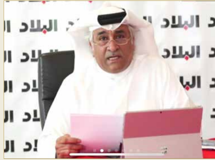
رئيس التحرير ملقيا كلمة “البلاد”

البلاد أكد رئيس تحرير صحيفة “البلاد” مؤسس المردي أن “صحيفة البلاد حجزت مكانها في المستقبل ولا مجال للاستدارة أو للخطوات الخلف، فلم يعد التعامل الصحافي مع المنتدى مثل السابق، إذ يتطلق النقاش وينتهي في غرفة مغلقة، ولا ينشر إلا بعد فترة من تبييضه على الورق.” وأوضح في كلمته في منتدى “البلاد” أن وصلة منتديات الصحيفة أصبحت متاحة للجميع للمتابعة، وتبث على الهواء مباشرة عبر مختلف منصات الصحيفة، وينشر التسجيل فور انتهاء الفعالية عبر منصة “اليوتيوب” و “الانستغرام”.