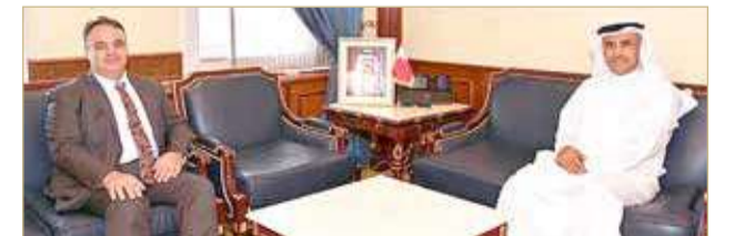
المنامة - وزارة الإسكان

استقبل وزير الإسكان باسم الحرم بمكتبه في ديوان الوزارة النائب هشام العشير، إذ بحث عدداً من الموضوعات المتعلقة بالدائرة السادسة في محافظة المحرق والموضوعات ذات الاهتمام المشترك، والتي من شأنها تعزيز التعاون والتنسيق بين وزارة الإسكان ومجلس النواب، وذلك لتنفيذ البرامج الإسكانية التي تكفل توفير السكن اللائق لجميع المواطنين. كما جرى استعراض سير المشروعات الإسكانية قيد التنفيذ في مدن البحرين الجديدة، وخطط الوزارة لتلبية الطلبات الإسكانية بمحافظات المملكة ومنها محافظة المحرق.