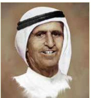
محمد بن حبتور البو فلاسة المهيري

عمرو العماري إلى جمع وتدوين وتحقيق نصوص بن حبتور الشعرية رغم شح مصادرها، واجتهد في التعريف بتفاصيل حياته وظروف مسيرته الفنية مع ذكر المغنيين الخليجيين الذين تغنوا بها منذ الأربعينات والخمسينات من القرن الماضي، وظلت تردد إلى اليوم وأشهرهم يوسف فوني، عبدالله سالم بوشيخة، حارب حسن، محمد راشد الرفاعي، علي بن هزيم، شمه داود، إبراهيم حبيب وحسين جاسم.