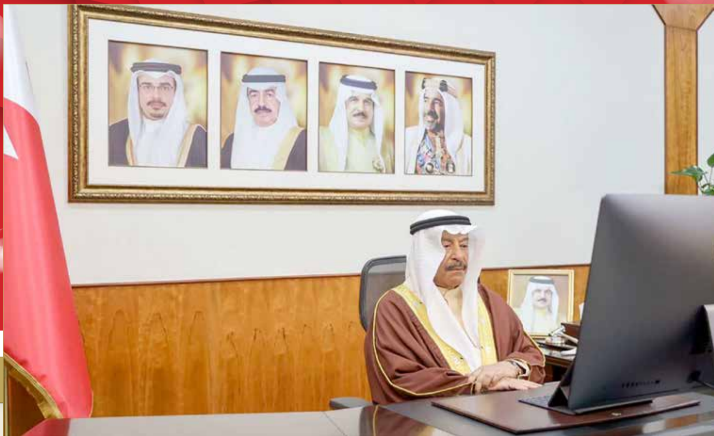
الصالح يتحدث بمنتهى "البلاد" نظام المجلسين يتناسب مع الأوضاع السياسية والاقتصادية والاجتماعية