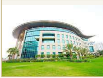
الاسترداد النقدي في حسابات، مما سيتيح للعملاء فرص للفوز بالعديد من الجوائز النقدية طوال السنة

وستنطلق العروض على قروض السيارات بدءاً من 28 مارس ولمدة ثلاثة أشهر، وسيتم إيداع مبلغ