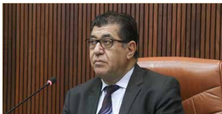
جمال فخرو (صورة أرشيفية)

◆ ردا على سؤال نائبه الأول فخرو: سنصل للديمقراطيات العريقة بهدوء وروية