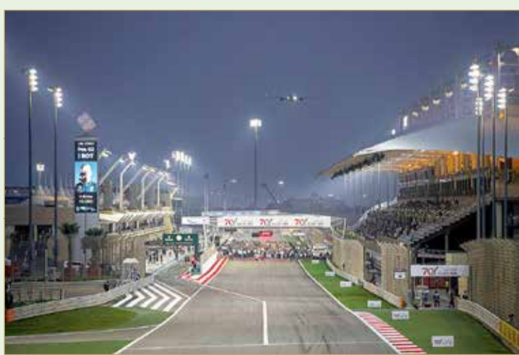
طيران الخليج تواصل رعايتها

للفورمولا وان 2021 على حلبة البحرين الدولية. وسجل جوفين الرقم الأسرع في الجولة التأهيلية بزمن دقيقتين و0.981 ليضمن انطلاقه من مقدمة الترتيب في سباق "السبرنت" المكون من 11 لفة.