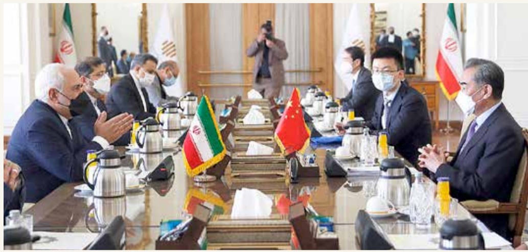
لقاء الجانبين الإيراني والصيني في طهران

والاستراتيجية والاقتصادية لـ25 عاماً من التعاون بين إيران والصين. وبالنسبة إلى بكين، فهي جزء من مشروع "طرق الحرير الجديدة" الضخم للبنية التحتية الذي أطلقته بالتعاون مع أكثر من 130 بلداً.