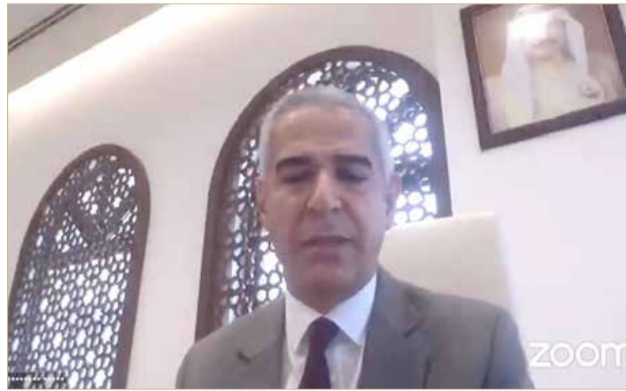
عبدالنبي سلمان متحدثاً بمنتدى "البلاد"

الحكومة تضم عناصر ذات كفاءة مع الاستفادة من تجارب الآخرين