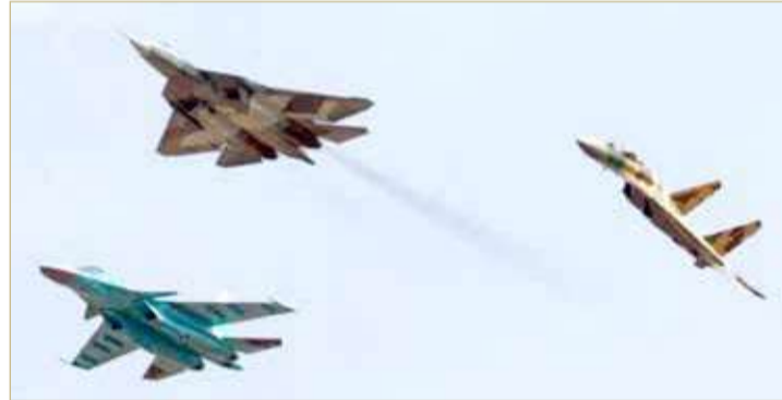
المقاتلات الروسية في سوريا

حمص، وسط إقلاعات متتالية للطيران الروسي من مطار حميميم باتجاه البادية السورية. وبلغت حصيلة الخسائر البشرية خلال الفترة الممتدة من 24 مارس 2019 وحتى أمس 1369 قتيلاً من قوات النظام والمسلحين المواليين لها من جنسيات سورية وغير سورية.