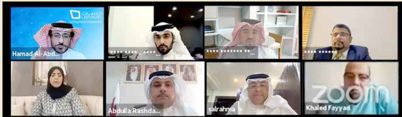
جانب من المشاركين في منتدى "البلاد"

◆ جواهرى: مهمة الصالح ليست سهلة وخبرته حافظت على التعاون بين الأعضاء