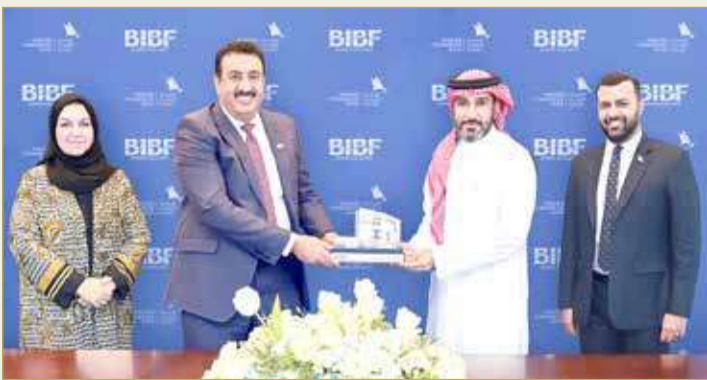
عقب توقيع الاتفاق بين الجانبين

المصرف في المبنى الجديد 4 وهو شيء نفخر به، وذلك لأنه يتماشى مع رؤيتنا لأن تكون شركاء في العملية التنموية للقطاع المصرفي في البحرين.”