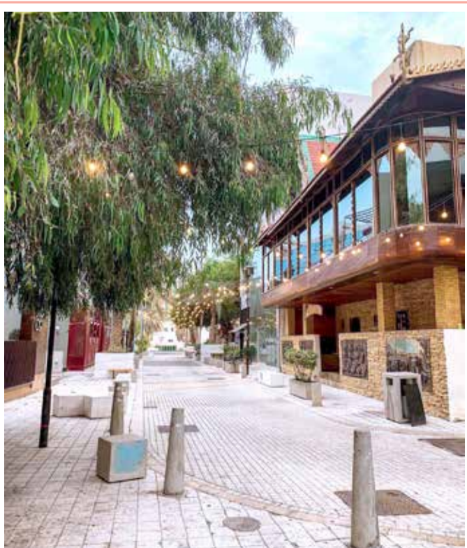
مجمع 338 في العذلية الذي يعرف بمجمع المطاعم التي تقدم العديد والمطاعم المتنوعة من الشرق الآسيوي والغربي والعالمي.

أعلن مهرجان "سونار" ذو الشعبية الكبيرة لدى عشاق الموسيقى الإلكترونية في أوروبا أنه ألغى العام الثاني على التوالي بسبب الجائحة دورته التي كان من المفترض إقامتها في يونيو في مدينة برشلونة الإسبانية. وأوضح منظمو المهرجان الذي استقطب 105 آلاف من عشاق الموسيقى العام 2019 أن "الدورة التي كان من المقرر إقامتها في يونيو في برشلونة ألغيت لأسباب قاهرة، وستقام عوضا عن ذلك في 15 و 16 و 17 و 18 يونيو 2022". وأضافوا في بيان أن "المعطيات الصحية والقيود المفروضة على التنقل وعدم وجود قرارات تنظيمية تتعلق بإقامة الأنشطة الكبرى حتى الآن تجعل إقامة المهرجان غير ممكنة".